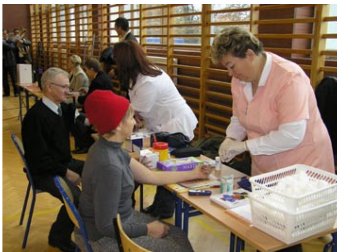
Pielęgniarki z mierzęcickiego PROMED NZOZ: Jedno małe uklucie ... i zaraz poznamy poziom cholesterolu!