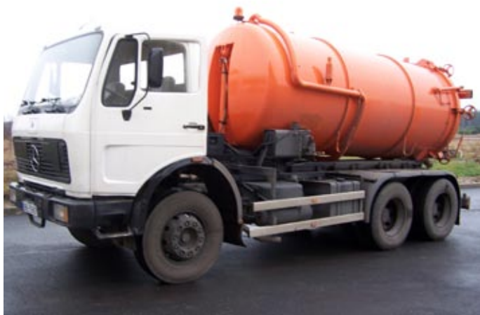
Samochód asenizacyjny mierzęcickich wodociągów