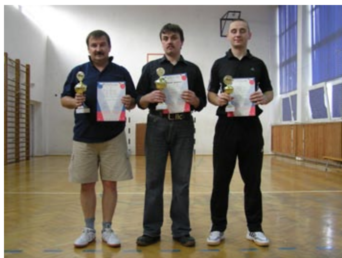
Najlepsza trójka mistrzostw