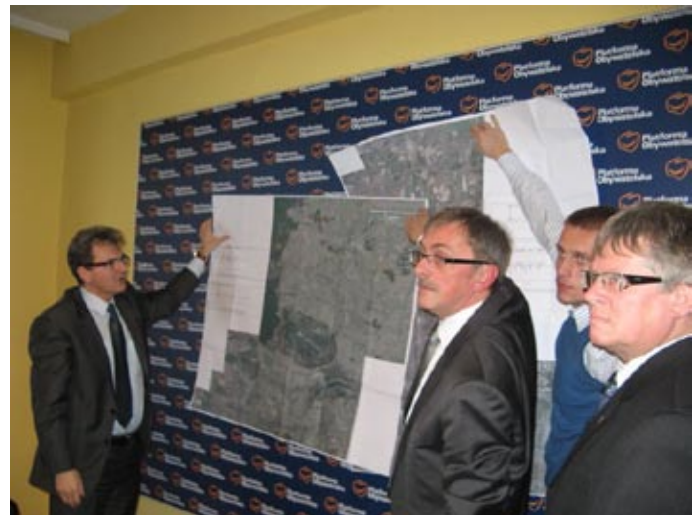
Prezentacja koncepcji budowy linii kolejowych dużych prędkości.