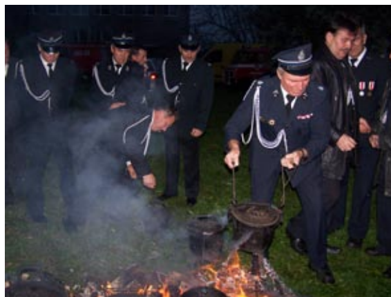
Wyciąganie gotowych pieczonek z ogniska