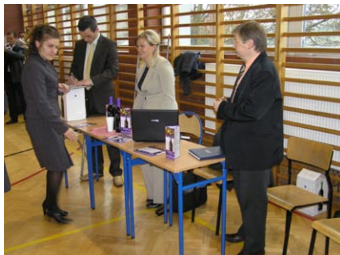
Przedstawiciele firmy MONA VIE: Sok z jagody acai jest dobry na wszystko. Wspomaga leczenie cukrzycy i innych chorób.