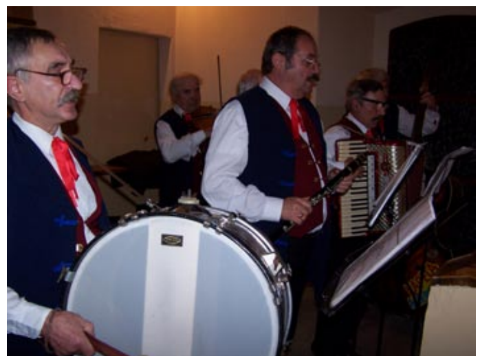
Występ Kapeli Regionalnej „Mierzęcice” podczas Dnia św. Cecylii w kościele pw. św. Mikołaja w Targoszycach