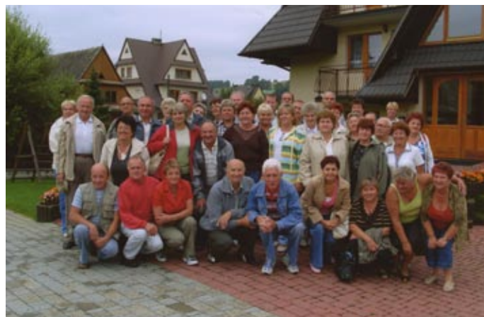
Emeryci i renciści z mierzęcickiego Koła

Koło Emerytów i Rencistów w Mierzęcicach