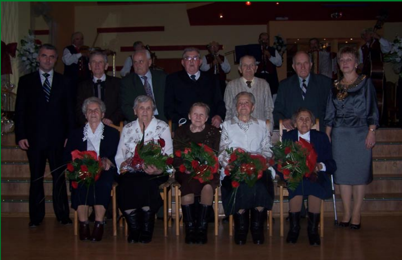
Jubilaci 60-lecia pożycia małżeńskiego