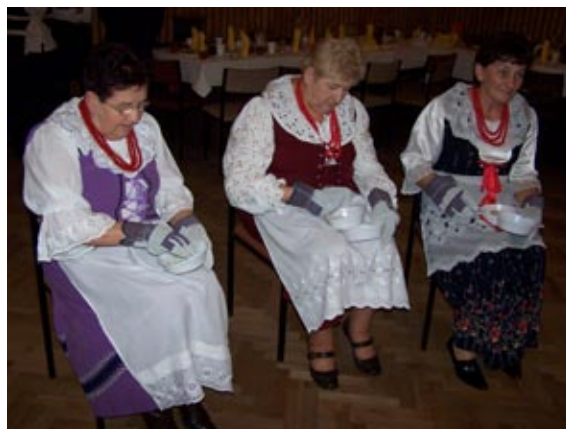
Rywalizacja w konkursie przebijania fasoli