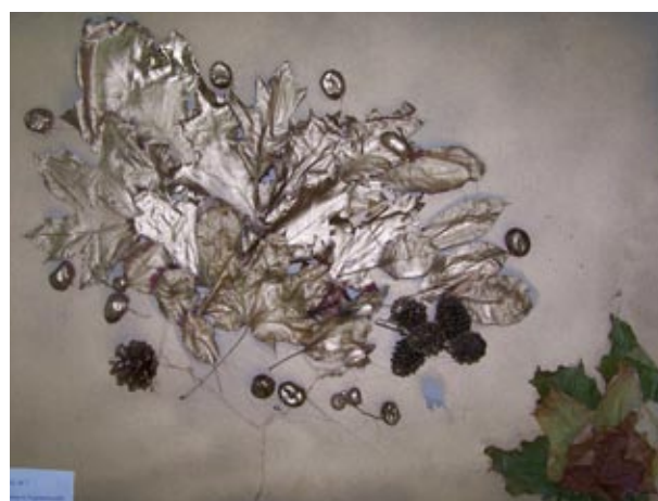
Praca Klaudiusza Muzyk