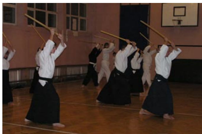
Członkowie szkoły Shinkendo w czasie treningu