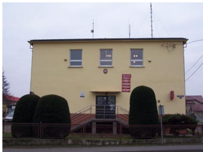
Odnowiona elewacja Urzędu Gminy