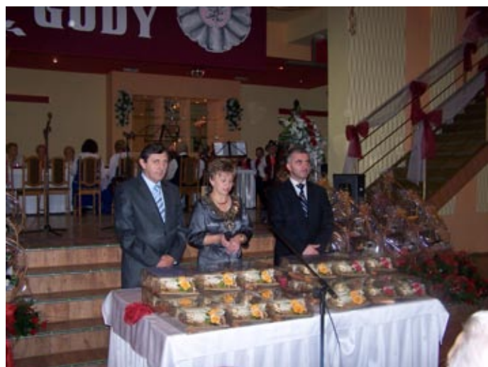
Uroczyste rozpoczęcie jubileuszu Złotych Godów