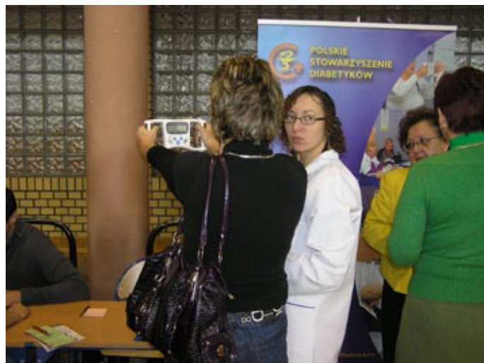
Pomiar tkanki tłuszczowej cieszył się powodzeniem zwłaszcza wśród pań.