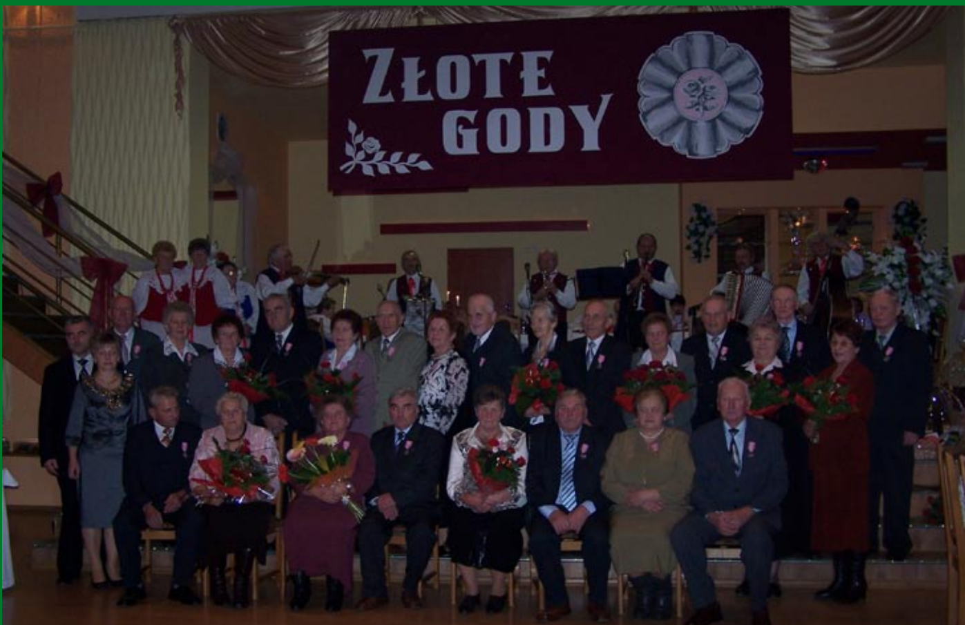
Jubilaci 50-lecia pożycia małżeńskiego