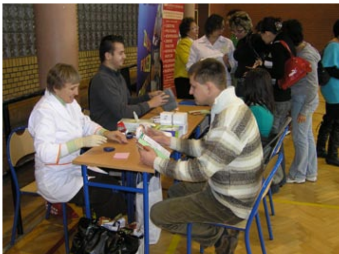
Śląski Zarząd Wojewódzki Polskiego Stowarzyszenia Diabetyków: Poziom cukru? ... To warto kontrolować!