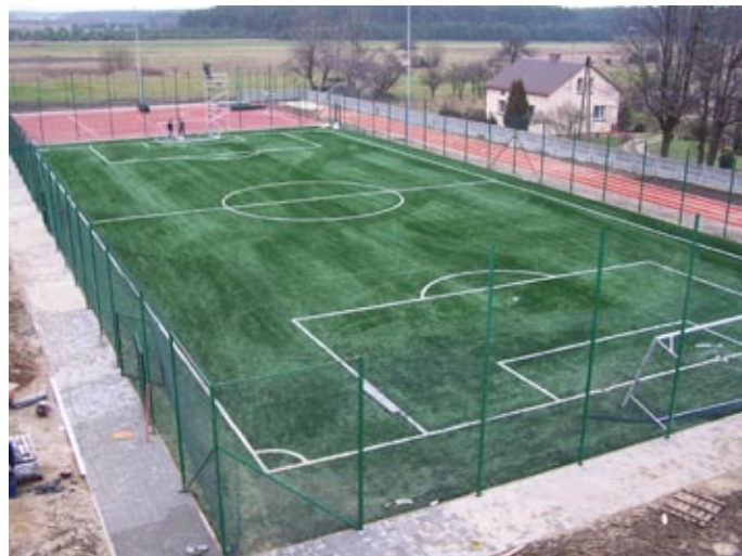
Ostatni etap powstawania Orlika

Doskonały prezent świąteczny otrzymają mieszkańcy Mierzęcic pod choinkę. Gołym okiem widać