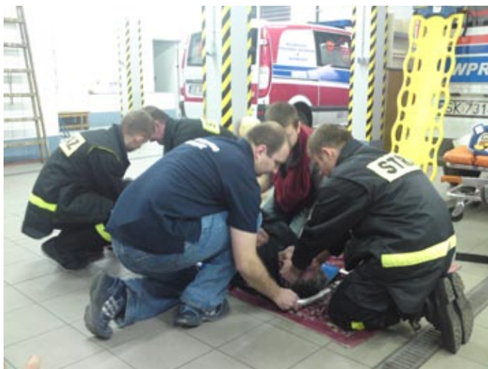
Ćwiczenia z transportu osoby poszkodowanej