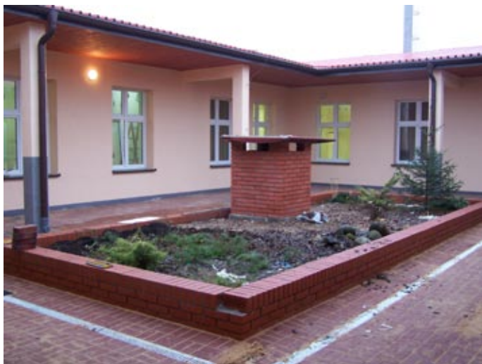
Końcowe prace przy przedszkolnym patio