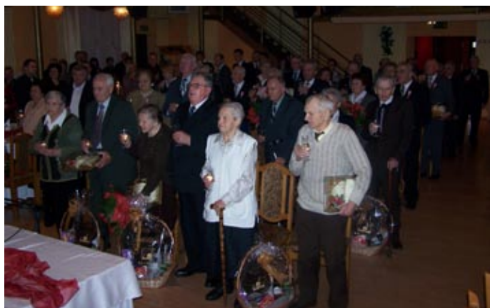
„Sto lat” dla szanownych jubilatów