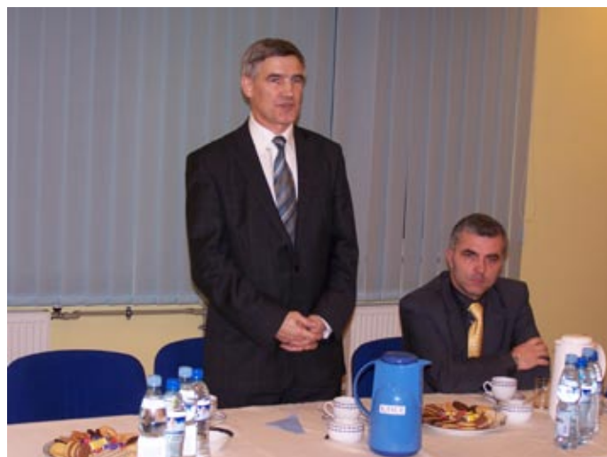
Senator Zbigniew Szaleniec w trakcie spotkania z mieszkańcami Gminy Mierzęcice