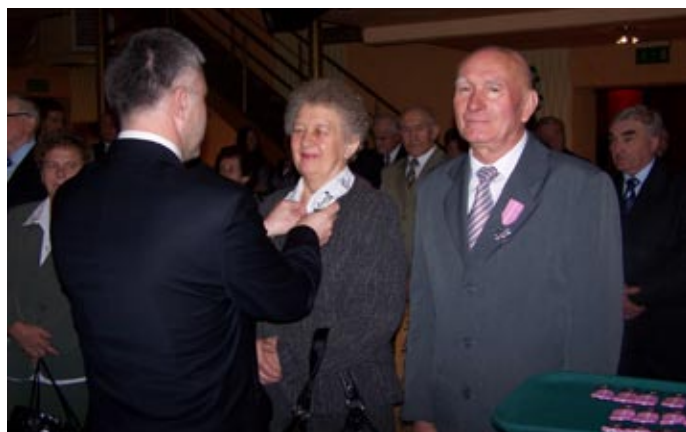
Wręczenie medalu za „Za długoletnie pożycie małżeńskie”