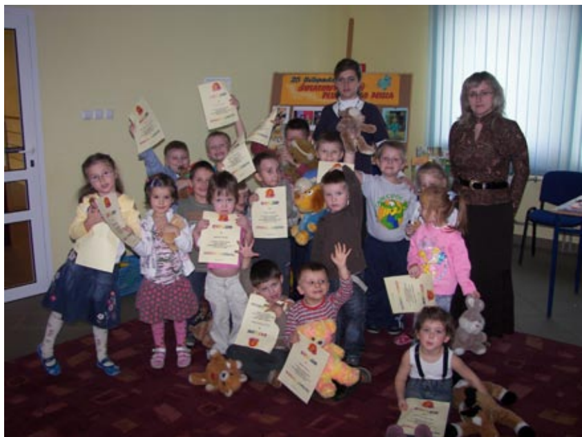
Uczestnicy Dnia Pluszowego Misia

W Mierzęcicach - Osiedlu zakończono również konkurs plastyczny,