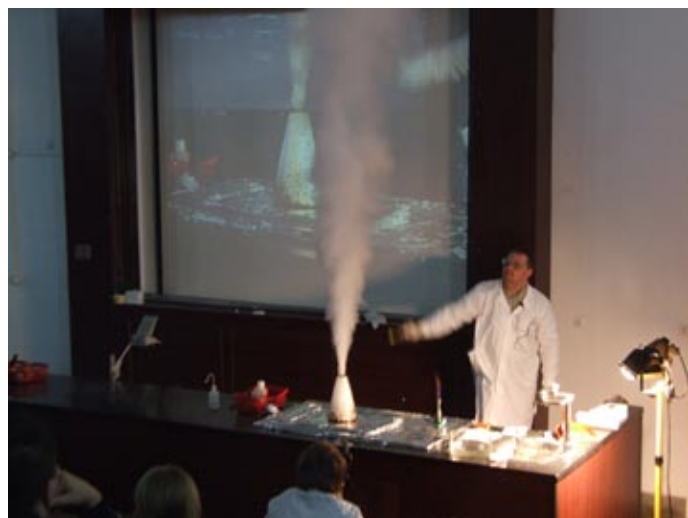
Wybuchowy wykład chemiczny