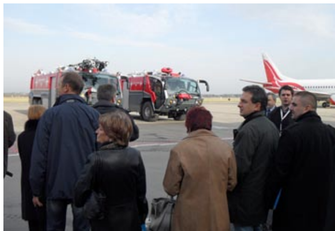
Uczestnicy seminarium w trakcie zwiedzania lotniska.