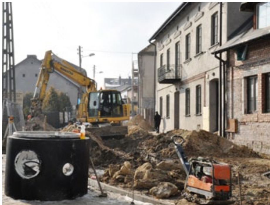
W związku z pracami ul. Kościelna jest wyłączona z ruchu

Stanowisko Urzędu Zamówień Publicznych będzie znane najpewniej do końca lutego. Nieco dłużej natomiast przyjdzie czekać na wyniki kontroli przeprowadzonej przez Europejski Trybunał Obrachunkowy – instytucję nadzorującą finanse Unii Europejskiej. Urzędnicy z Luksemburga pojawili się w sławkowskim magistracie 20 stycznia 2015 roku. Kontrola obejmowała wszystkie czynności podejmowane w ramach projektu do końca 2014 roku, w tym przeprowadzane w tym czasie postępowania przetargowe. Jej wyniki mogą być jednak znane dopiero za sześć miesięcy. Krzysztof Koziół