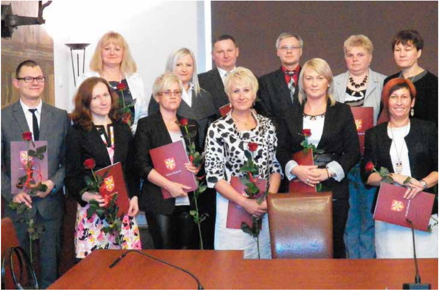
Dzień Edukacji Narodowej w Urzędzie Miejskim