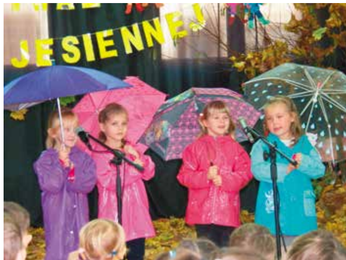
Festiwal Piosenki Jesiennej - dzieci z Biedzychowic