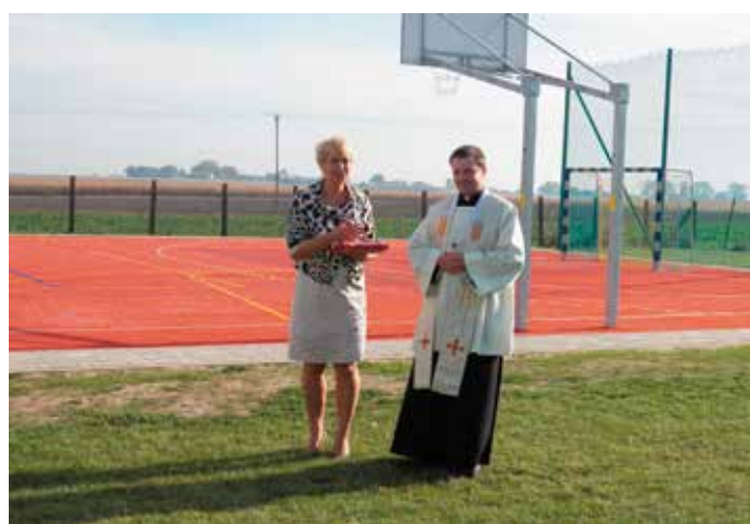
Otwarcie boiska w Szonowie