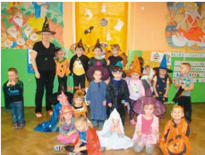
Przedszkolaki z PP nr 3