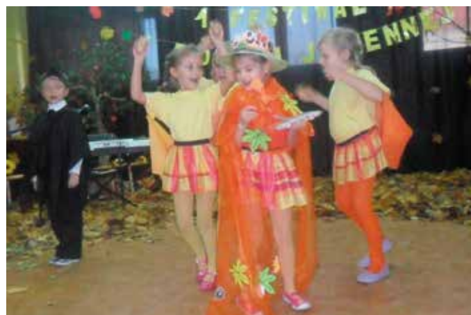
Festiwal Piosenki Jesiennej - dzieci z PP nr 4