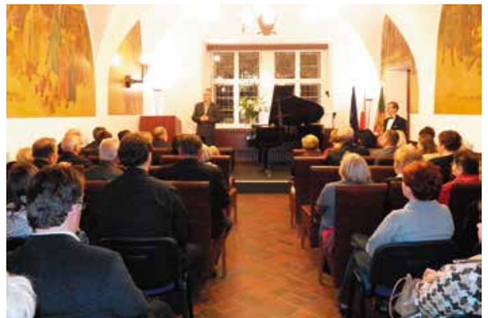
Śląski Festiwal im. Ludwiga van Beethovena