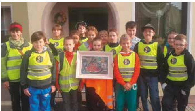
Uczniowie SP w Szonowie we Wróblinie