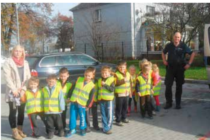
Przedszkolaki z Oraczy