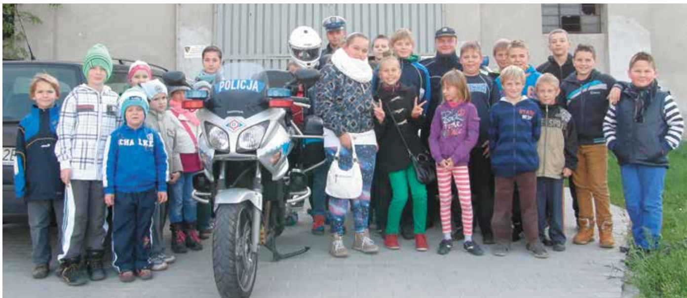
Spotkanie z policjantami w szkole w Brożcu