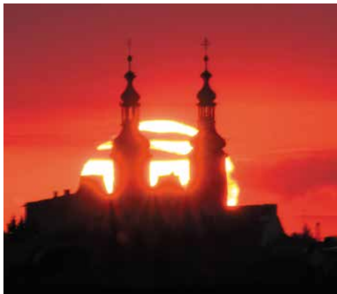
Wschód słońca nad Głogówkiem