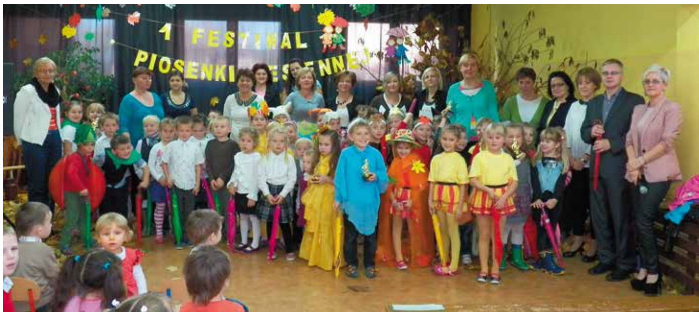
I Festiwal Piosenki Jesiennej w Twardawie