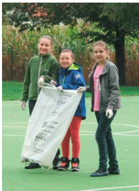
Sprzątanie świata SP nr 1