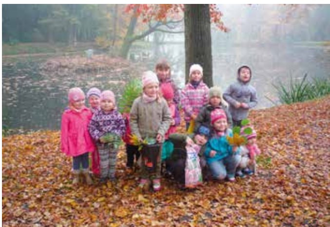
Przedszkolaki z Wierzchu