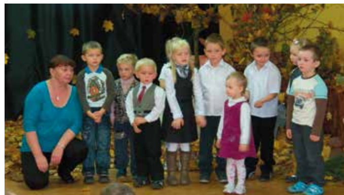
Festiwal Piosenki Jesiennej - dzieci z Wróblina