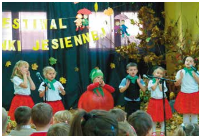
Festiwal Piosenki Jesiennej - dzieci z Twardawy