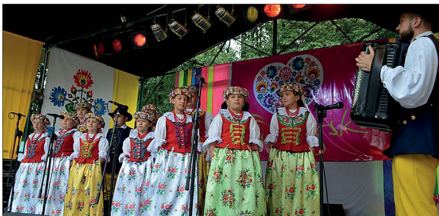
Najmłodszy zespół dziecięcy z Ożarowa bardzo spodobał się publiczności