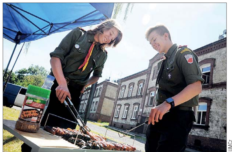
Ośrodek będzie służył mieszkańcom

Obok działań mieszkańców i pracowników OSL stworzone zostały dodatkowo Partnerstwa Lokalne skupiające podmioty, instytucje i oso-