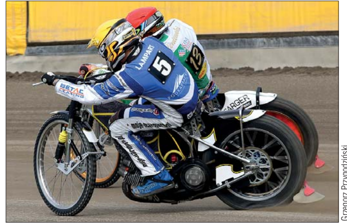
Zacięta rywalizacja trwała do ostatniego wyścigu