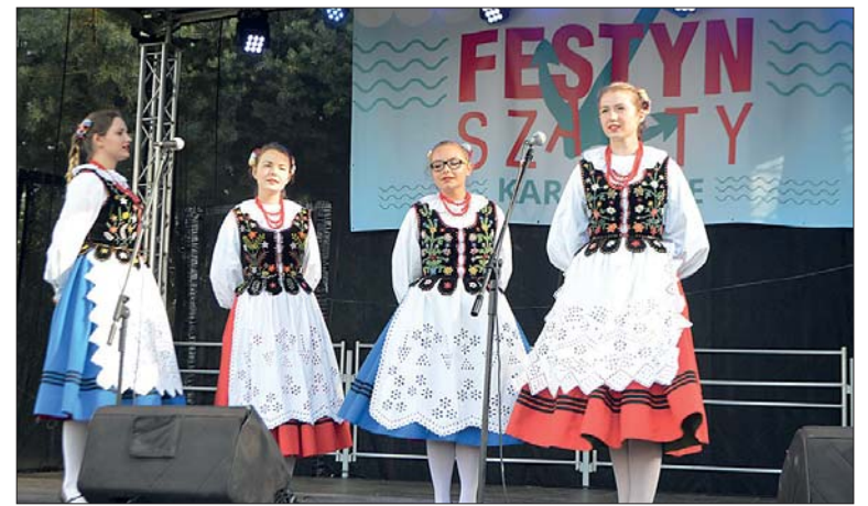
Na scenie z wdziękiem prezentowały się członkinie zespołu „Kłomnickie Płomyczki”