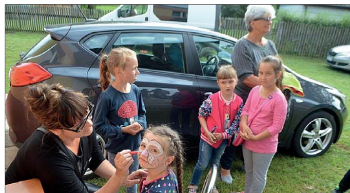
Malowanie twarzy jak zawsze przypadło do gustu dziewczynkom