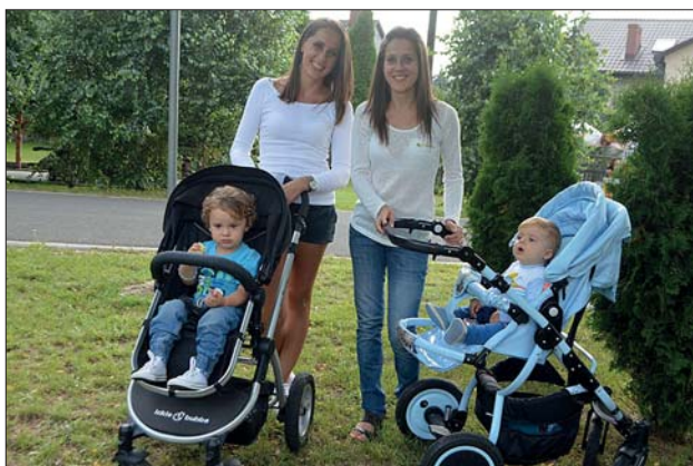
Na festyn przyszły mamy ze swoimi pociechami