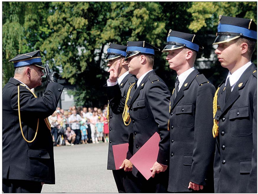
Podczas uroczystości nagrodzono najlepszych absolwentów