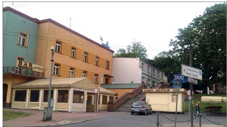
Poradnia przy Jasnej Górze

Spotkania odbywają się w grupach około 10-osobowych (z reguły o bardzo szerokim przedziale wiekowym), podczas których przedstawiane jest dane zagadnienie z punktu widzenia psychologii w powiązaniu z Katolicką Nauką Społeczną i odniesieniem do Pisma Świętego i mądrości Ojców Pustyni. Po krótkiej modlitwie i przedstawieniu się uczestników (przybyłych często z odległych miejscowości), a następnie ustaleniu i przyjęciu wspólnych zasad, następuje niedługi wstęp teoretyczny. Rozdawane są krótkie materiały (wydruki prezentacji) zawierające najistotniejsze treści, a także proponowane pozycje literaturowe dla zainteresowanych szczegółami, dla celów własnych, dalszych poszukiwań. Podczas warsztatów można, a nawet należy, zadawać pytania, które nie pozostają bez odpowiedzi, uczestnicy często dzielą się swoimi osobistymi przeżyciami, niekiedy trudnymi, a także spostrzeżeniami i przemyśleniami. Zainteresowani robią ćwiczenia praktyczne, pozwalające utrwalić uzyskane umiejętności i wia-