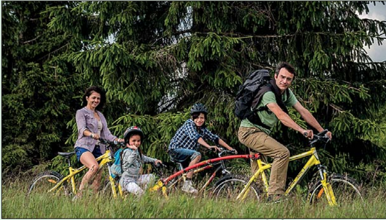
W Polsce z coraz większym sentymentem darzymy rowery. Częściej wsiadamy na nie jadąc do pracy, modne też stały się rodzinne wycieczki za miasto.

T NS Polska w styczniu 2016 roku opublikowała badania z których wynika, że w codziennej cyklicznie gonimy inne kraje europejskie. Już 6 procent Polaków dojeżdża regularnie do pracy lub szkoły na rowerze. W całej Unii Europejskiej ten wskaźnik wynosi 7,6 procent, więc nie odbiegamy znacząco od średniej. Najwięcej codziennych