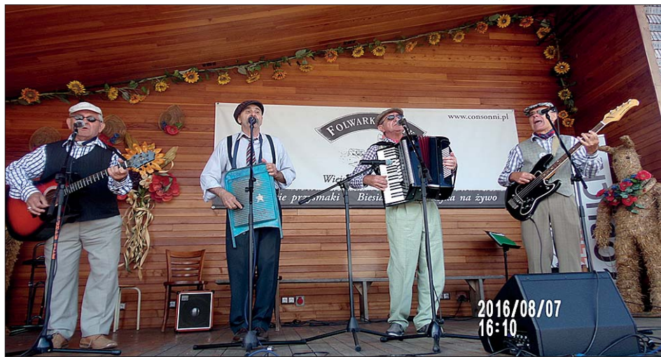
Kapela „Z Naszego Miasteczka”