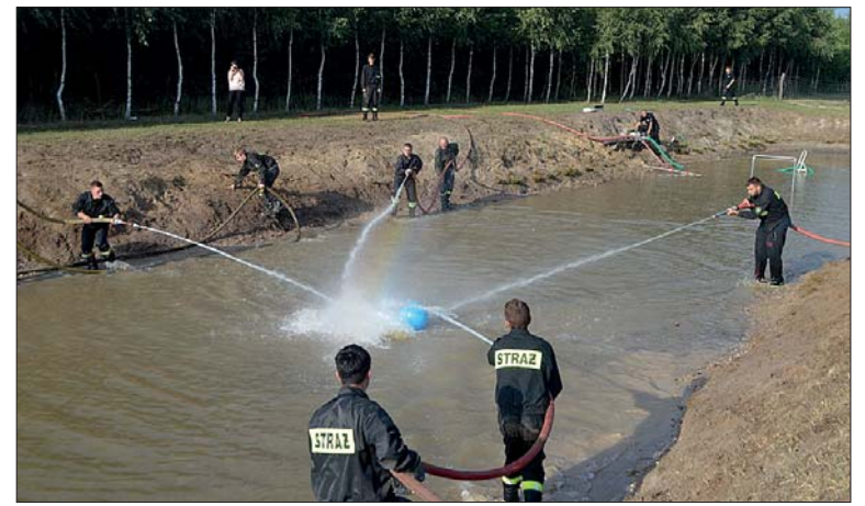
Turniej piłki prądowej „Wasserball” – Karczewice 2016 wzbudzał emocje zawodników i publiczności