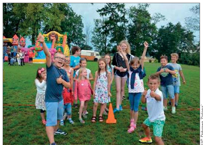
Dzieci radośnie uczestniczyły w zabawie piknikowej