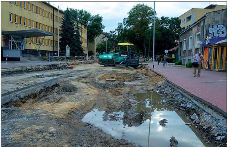
Remont na ulicy Sobieskiego ma potrwać co najmniej trzy miesiące