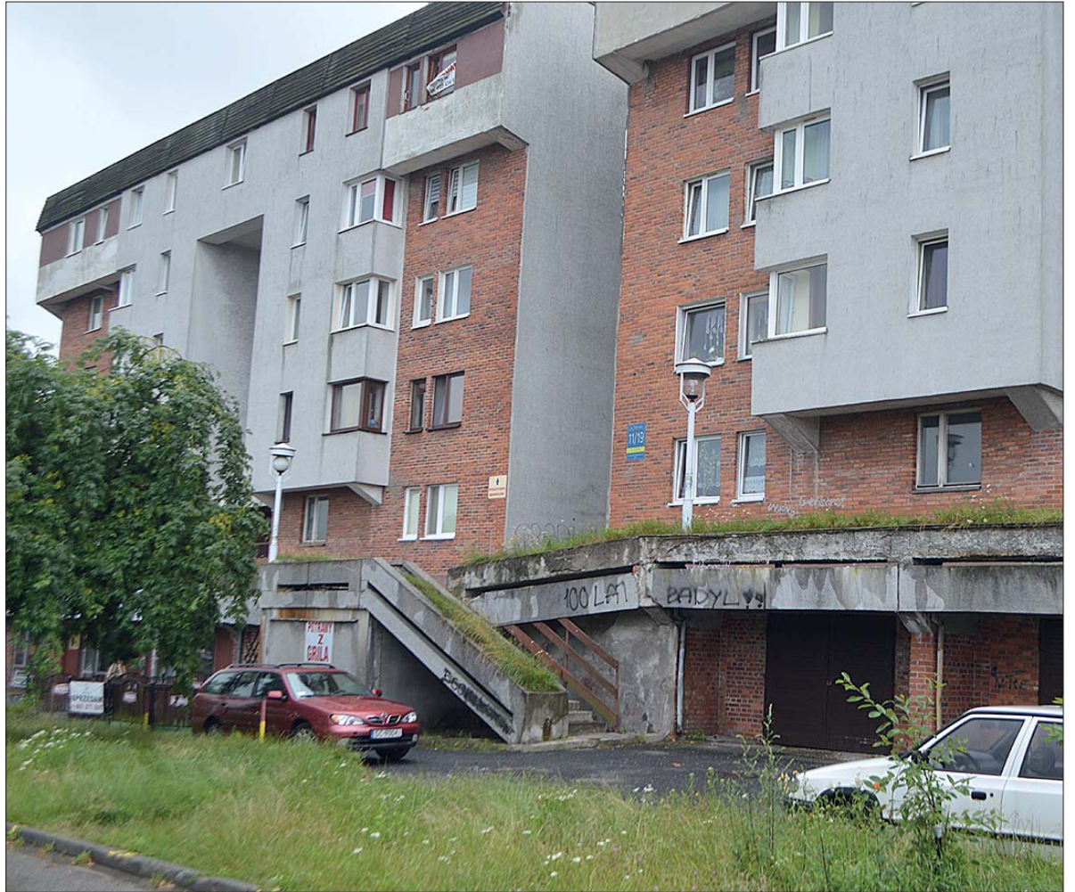
Spółdzielnia Mieszkaniowa „Jura” mieści się przy ul. Palmowej w Częstochowie

Należy zauważyć, że: „prowadzona przez dekadę korespondencja pomiędzy miastem Częstochowa, zarządem Spółdzielni Mieszkaniowej „JURA”, Ministerstwem Skarbu Państwa i Regionalnym Funduszem Gospodarczym” dotyczyła poprzedniego Zarządu RFG i nie odnosi się do działań obecnego Zarządu. Obecna strategia Zarządu zmierza do uporządkowania wszelkich, narosłych przez ostatnią deka-