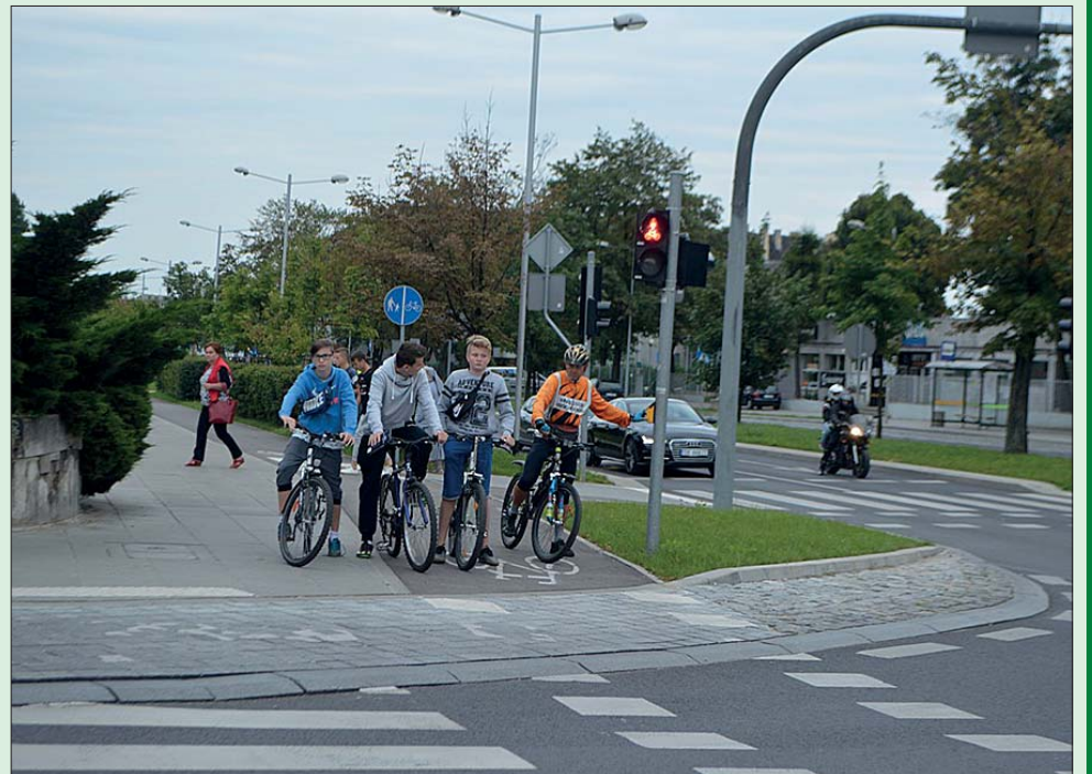
W Częstochowie coraz więcej osób korzysta z dobrodziejstwa cyklistyki

Trzeba wspomnieć o „bonusie” dla rowerzystów na Północy, czyli budowie ciągów pieszo-rowerowych przy okazji poszerzenia zakresu inwestycji drogowej w alei Wyzwolenia. Oprócz remontu przejścia podziemnego w alei Wyzwolenia, dzięki oszczędnościom przetargowym, udało się pozyskać i skierować środki zewnętrzne na modernizację części drogowej alei Wyzwolenia, wraz z budową ścieżek dla pieszych i rowerów. Ciągi pieszo-rowerowe będą wiodły od alei Armii Krajowej do ul. Michałowskiego jednostronnie (300 m – po stronie M1), a od ul. Michałowskiego do ul. Fieldorfa-Nila – po obu stronach (2 x 400 m). Kolejny na ul. Jana III Sobieskiego od skrzyżowania z ul. Nowowiejskiego do ul. Pułaskiego (na długości ok. 600 metrów). Nie można też zapomnieć o nowych drogach dla rowerów przewidzianych w ramach rozpoczętej rozbudowy i przebudowy DW 908, tyle że na finalne efekty tego zadania trzeba będzie poczekać do 2018 r. UG