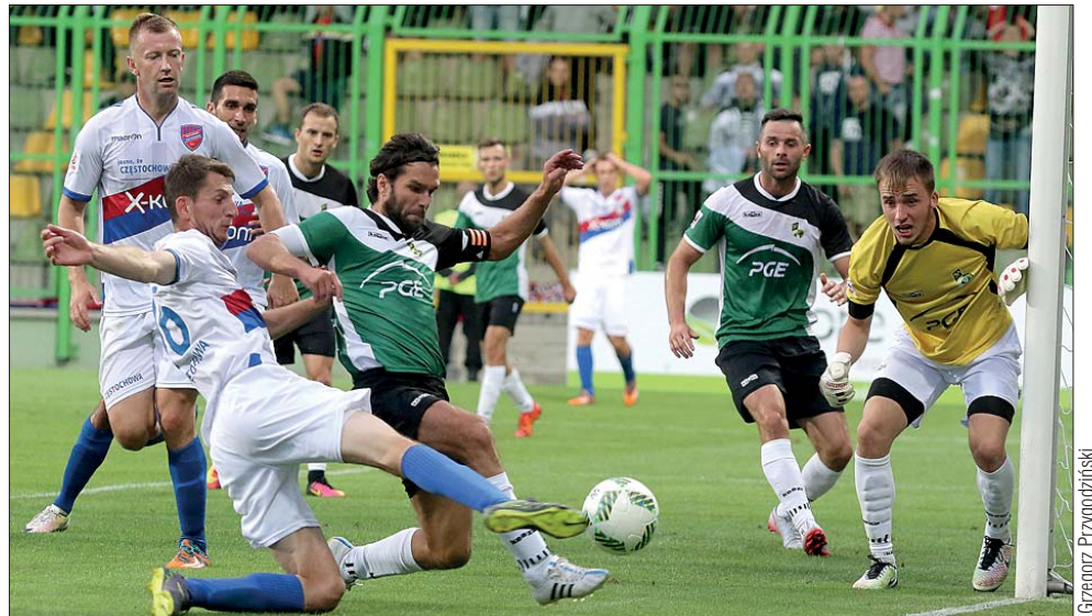
Podczas meczu było wiele akcji zapierających kibicom dech w piersiach