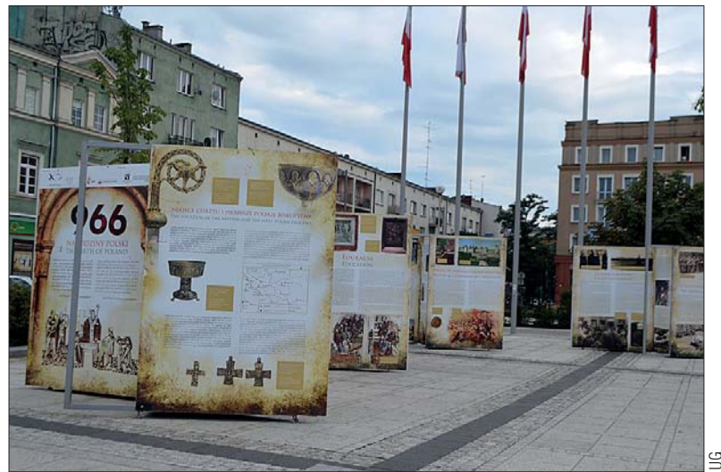
Na placu Biegańskiego do końca sierpnia można oglądać wystawę „966 – Narodziny Polski”

Zamierzeniem tej arcyciekawej wystawy jest pokazanie i wyjaśnienie dlaczego Mieszko I przyjął chrzest i jak to kluczowe dla naszego kraju wydarzenie wpłynęło na kształtowanie tożsamości naszego państwa i narodu. W efekcie powstała barwna opowieść o Polsce i ludziach, którzy wpłynęli na ukształtowanie jej potęgi i dziejowego, historycznego znaczenia. Na planszach zobaczymy, między innymi, pierwszą parafę książęcą, miejsce