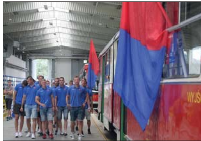
Zawodnicy zwiędzili zajezdnię MPK

3 sierpnia 2016 r., po Częstochowie kursował zabytkowy tramwaj, w którym piłkarze RKS Częstochowa rozdawali pasażerom darmowe bilety na mecz piłki nożnej. To efekt rozpoczętej współpracy pomiędzy klubem i Miejskim Przedsiębiorstwem Komunikacyjnym.