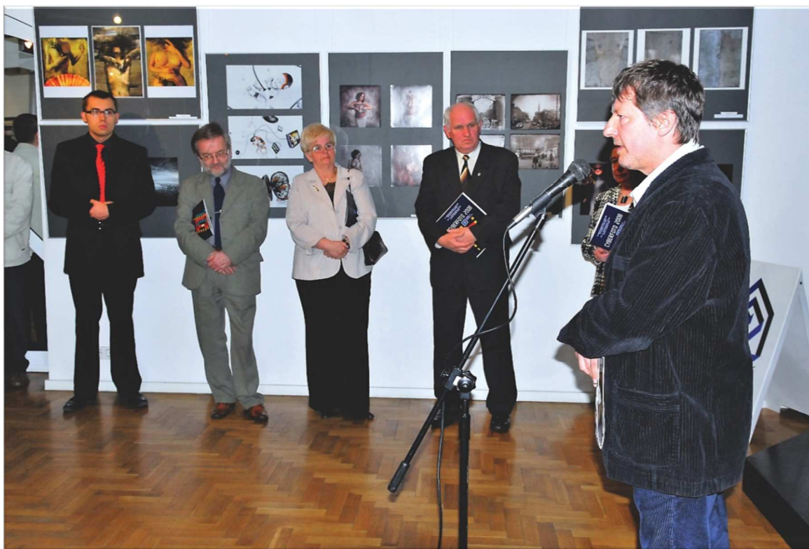
Fot.38. Międzynarodowy Konkurs Fotograficzny Cyberfoto, 2008 r.

Najważniejszym Konkursem z dziedziny fotografii był Międzynarodowy Konkurs Fotograficzny Cyberfoto. 365