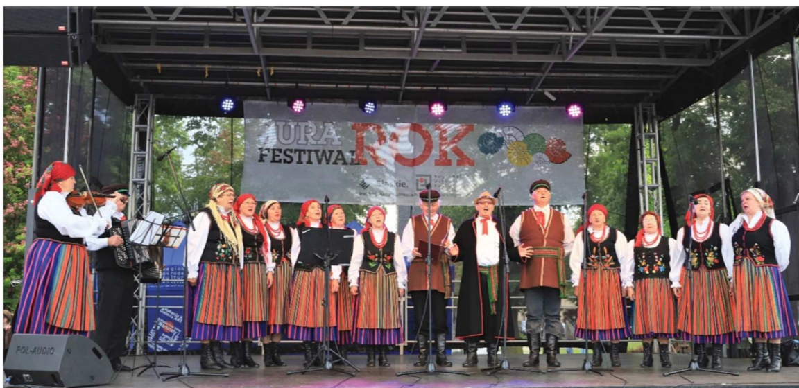
Fot. 34. Jura ROK Festiwal, Konięcpol