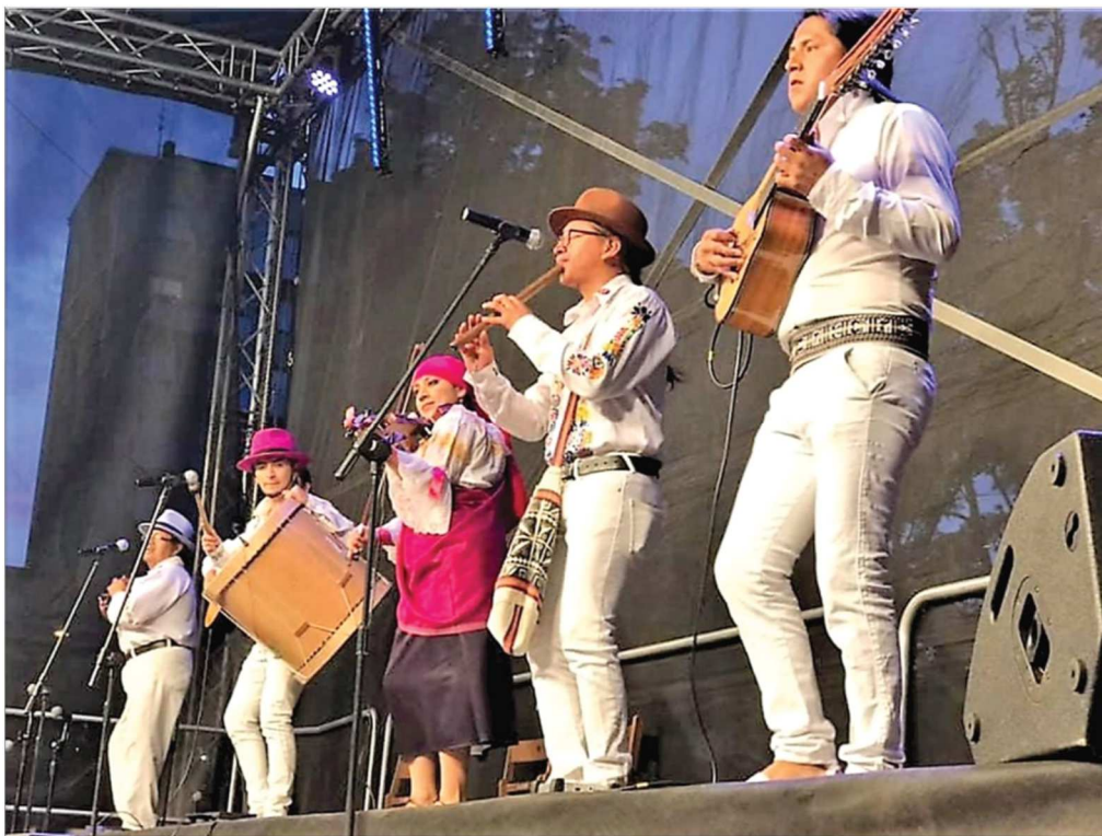
Fot. 37. Międzynarodowy Festiwal Folklorystyczny „Silesia”, 2019 r.

wydarzeniem unikatowym, gdyż publiczność w trakcie jednego wieczoru miała możliwość zobaczyć zespoły niezwykle różnorodne i prezentujące odmienne tradycje muzyczne i taneczne. 352