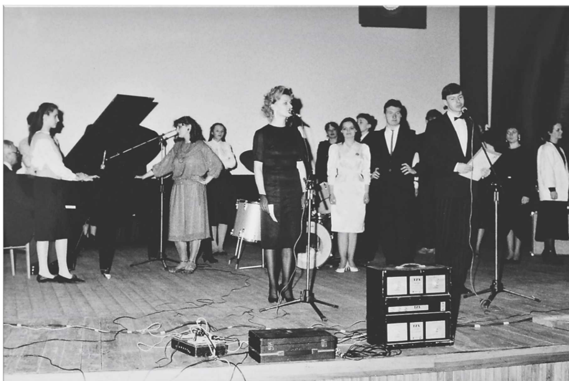
Fot. 8. Ogólnopolski Festiwal Piosenki Radzieckiej, 1987 r.

Pod koniec lat 70. i w latach 80. organizowano też Konkurs Piosenki, Poezji i Prozy o Warszawie, eliminacje do Ogólnopolskiego Konkursu Piosenki Radzieckiej, eliminacje do Festiwalu Piosenki Żołnierskiej w Kołobrzegu, Przegląd Amatorskich Zespołów Instrumentalno-Wokalnych, Minifestiwal Piosenki Dziecięcej.