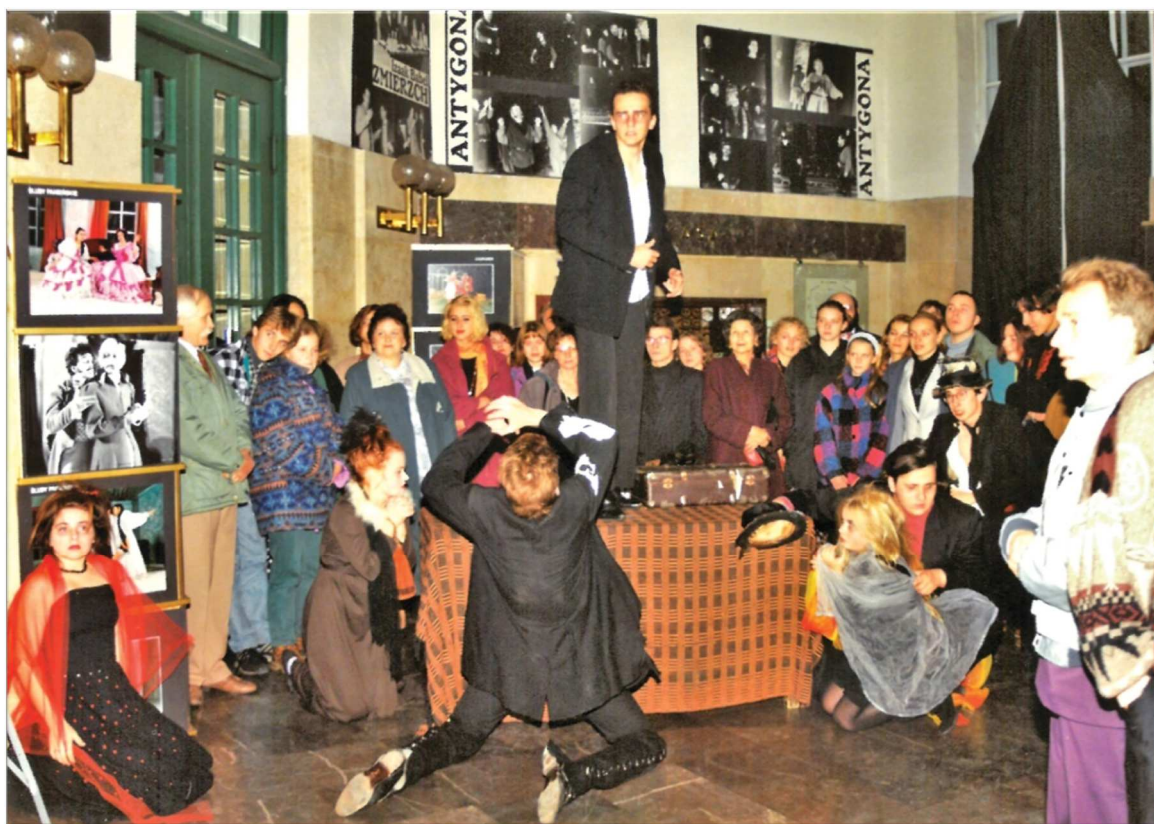
Fot. 17. Noc Teatralna „Mesis” 1994 r.

Rok później 10. jubileuszowa edycja Messis rozgrywała się pod przewodnim hasłem „W sklepie cynamonowym”; program wypełniony był wydarzeniami inspirowanymi twórczością Brunona Schulza i Stanisława Ignacego Witkiewicza. Imprezę uświetnił występ Teatru Witkacego z Zakopanego ze spektaklem Doktor Faustus . 151