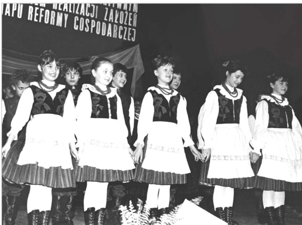
Fot. 1. Zespół Pieśni i Tańca „Częstochowa”