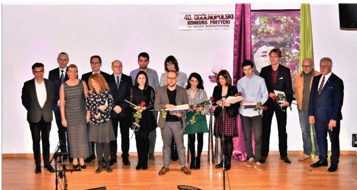
Fot. 28. 40. Ogólnopolski Konkurs Poetycki im. Haliny Poświatowskiej

Wśród wydarzeń związanych z Haliną Poświatowską proponowano również regionalne prezentacje recytatorskie i poezji śpiewanej.