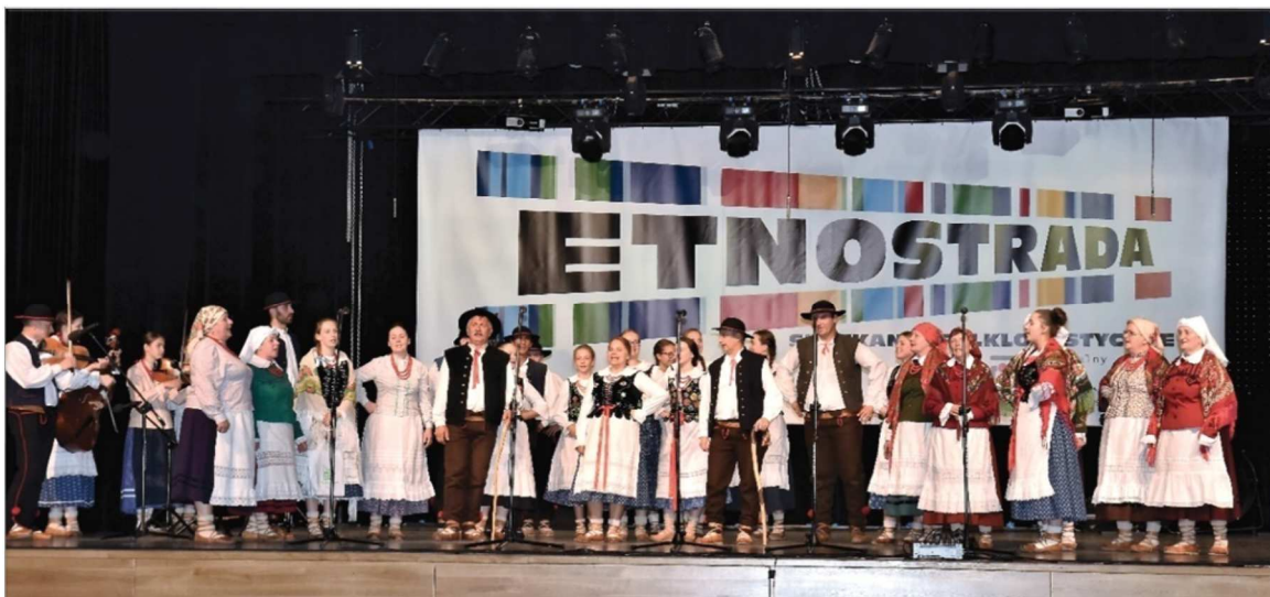
Fot. 33. „Etnostrada”

Ogromna dawka kultury ludowej była przekazywana podczas imprezy plenerowej Jura ROK Festiwal, na którą składało się wiele działań oraz bogaty program artystyczny.