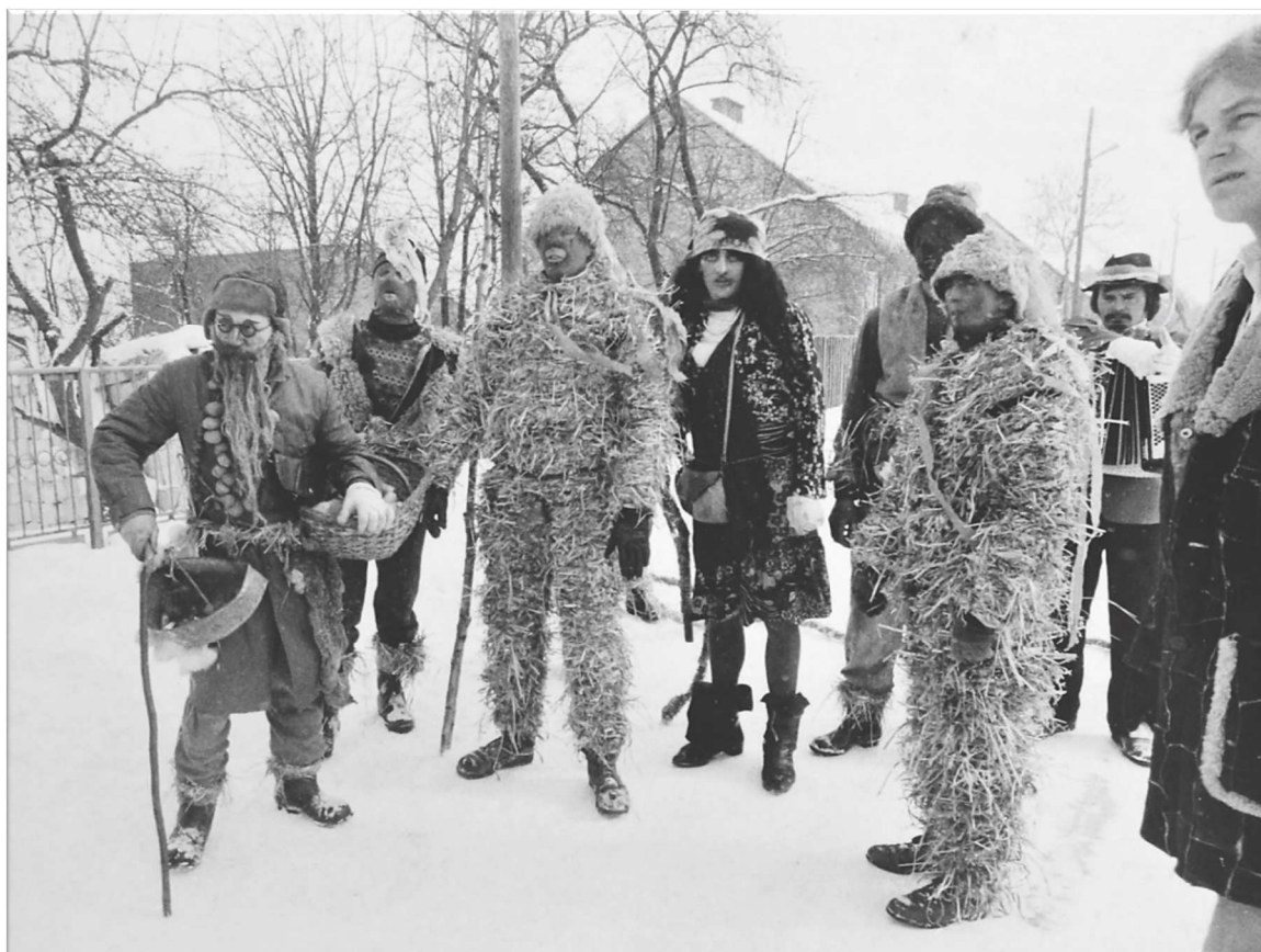
Fot. 7. „Misie” w Niegowie

Występujące zespoły podzielono na 4 kategorie: dziecięcą, teatralną, regionalną i instrumentalno-wokalną. Kilkanaście grup prezentowało wiele ciekawych propozycji artystycznych, takich jak występy wokalne, wokально-instrumentalne, taneczne, występy kapel ludowych, solistów. O dobrej jakości prezentacji świadczyła liczba przyznawanych nagród i wyróżnień.