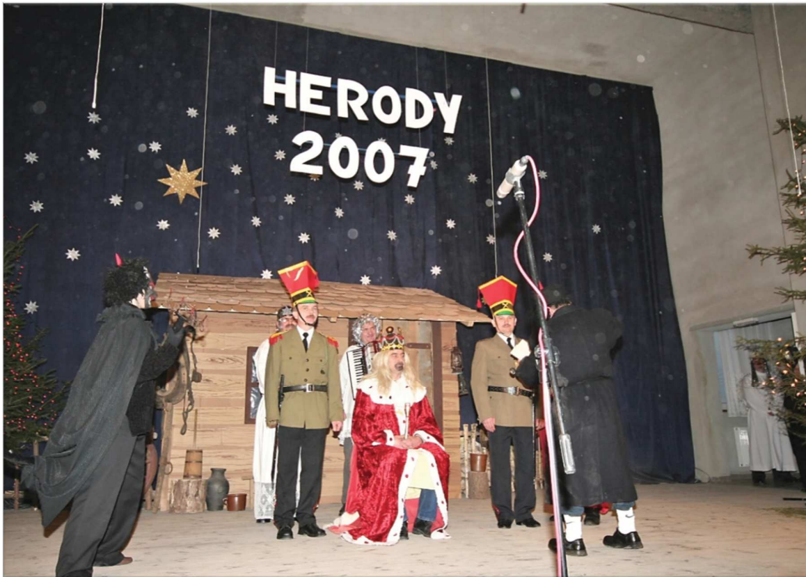
Fot. 32. Jurajski Festiwal Grup Kolędniczych i Zapustnych „Herody”, 2007 r.

Do ludowych tradycji sięgnięto także w roku 2008, kiedy to Regionalny Ośrodek Kultury w Częstochowie wraz z Gminnym Ośrodkiem Kultury w Przyrowie podjęły się współorganizacji Majówki. Głównym Organizatorem przedsięwzięcia był Zespół Ludowy „Cyganeczki” z Sygontki. Wydarzenie to miało na celu zrekonstruowanie tradycyjnego wieczoru majowego sprzed kilkadziesiąt lat.