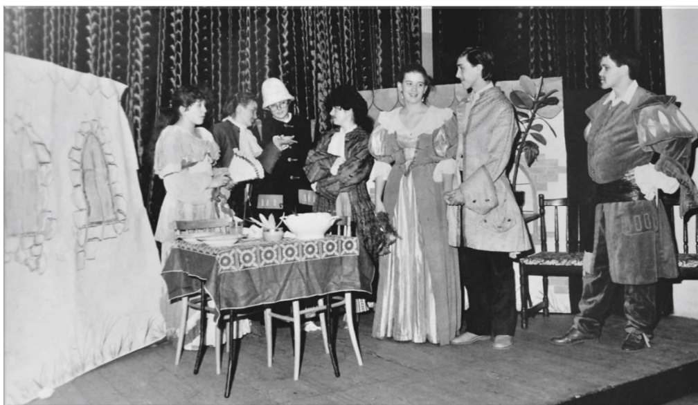
Fot. 3. Ogólnopolski Przegląd Teatrów Amatorskich, 1984 r.

Ważnym wydarzeniem były Wojewódzkie Przeglądy Teatrów Amatorskich, organizowane przez instytucję we współpracy z RSW „Prasa – Książka – Ruch” w Częstochowie. Amatorskie grupy teatralne zgłaszały się z całej Polski, przeglądy trwały kilka dni i cieszyły się uznaniem i renomą wśród wykonawców, jurorów i miłośników teatru. Grupy prezentowały spektakle o różnej tematyce i na wysokim poziomie artystycznym. 78