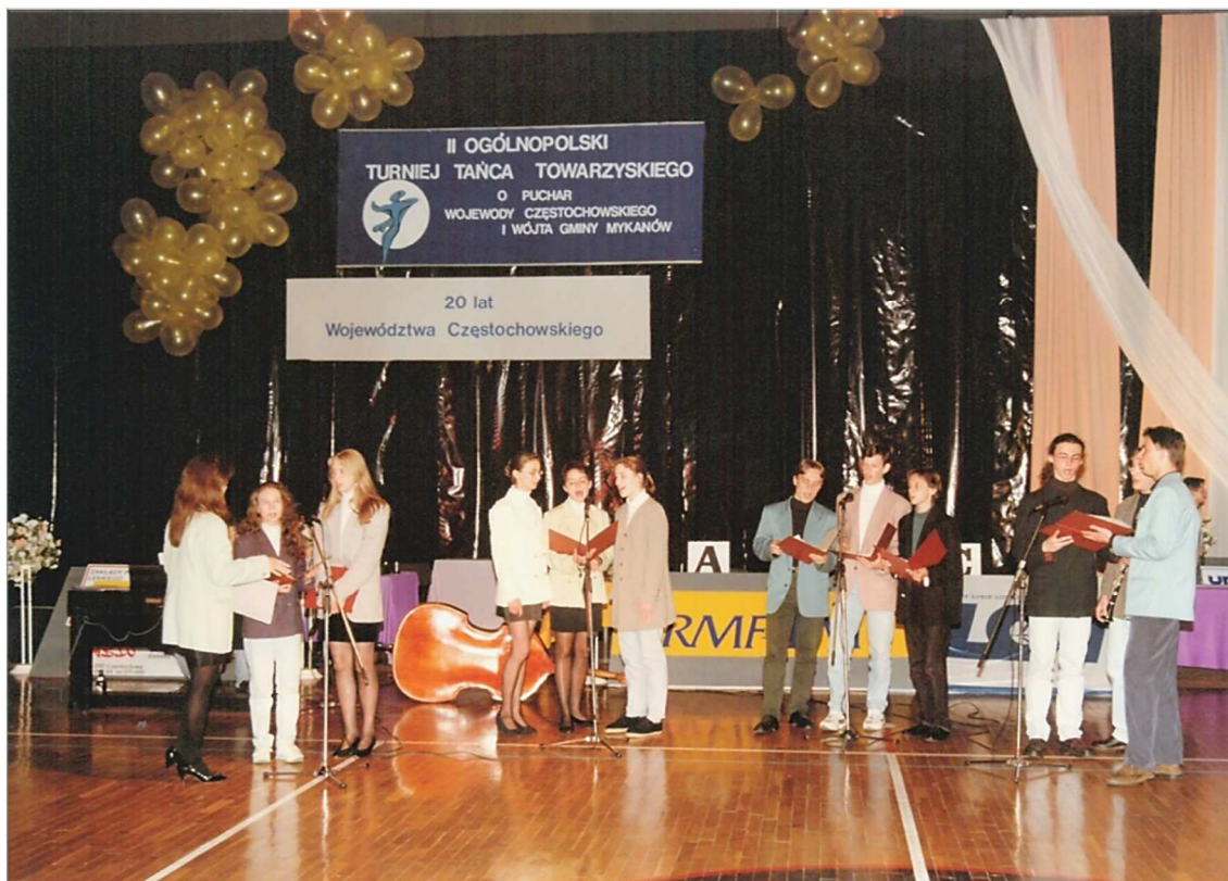
Fot. 24. Ogólnopolski Turniej Tańca Towarzyskiego o Puchar Wojewody Częstochowskiego i Wójta Gminy Mykanów

W 1992 r. po raz pierwszy w Częstochowie odbył się Turniej Tańca Towarzyskiego o Puchar Wojewody, organizowany we współpracy z Gminnym Ośrodkiem Kultury w Mykanowie oraz gdańskim Klubem Tańca Towarzyskiego Zorba, realizowany zgodnie z przepisami Polskiego Towarzystwa Tanecznego. W turnieju w częstochowskiej Hali „Polonia” udział brali głównie młodzi adepci tańca z województwa częstochowskiego, a także profesjonalni tancerze z polskich filii klubu Zorba. Pierwsza edycja została uznana za jedną z największych krajowych imprez tanecznych kategorii E i D.