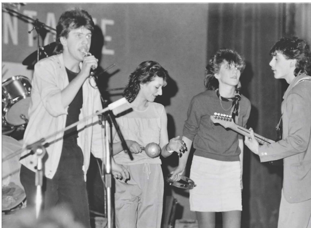
Fot. 10. Konfrontacje Piosenki Młodzieżowej, 1985 r.

muzyków-amatorów, uwrażliwienie na sztukę estradową. Na zajęciach, prowadzonych głównie dla młodzieży, realizowane były następujące zagadnienia: dykcja, emisja głosu, aranżacja, interpretacja tekstu. Obowiązkowa była nauka gry na wybranym instrumencie, dlatego członkowie grup wokalnych uczęszczali na lekcje do Ogniska Muzycznego w Częstochowie. 102 WDK współpracował także z Filharmonią Częstochowską, w której młodzi artyści, na mocy porozumienia między Wojewódzkim Domem Kultury a Filharmonią, mogli korzystać ze sceny i sprzętu nagłaśniającego. Uczestnicy zajęć w Centrum często reprezentowali województwo podczas licznych festiwali, konkursów, przeglądów i innych imprez kulturalnych.