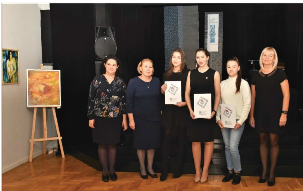
Fot. 36. Konkurs poezji śpiewanej „Żyje się tylko chwilę”

W ciągu wielu lat działalności pojawiały się rozmaite pomysły i imprezy kulturalne organizowane przez Regionalny Ośrodek Kultury lub współorganizowane z zaprzyjaźnionymi instytucjami. Niektóre odbyły się jeden lub kilka razy, inne pozostawały na długie lata i cieszyły się niegasnącym uznaniem. Tradycją stało się organizowanie pierwszego etapu przesłuchań do Międzynarodowego Festiwalu Kolęd i Pastoralek im. ks. Kazimierza Szwarlika. Cieszyły się dużą popularnością, gromadziły uzdolnione dzieci, młodzież, dorosłych, duety, chóry, zespoły z regionu. Najlepsi wykonawcy otrzymywali promocję do kolejnego etapu, który odbywał się w Będzinie. Bardzo często artyści-amatorzy, wyłaniani podczas eliminacji w Regionalnym Ośrodku Kultury w Częstochowie, w finale zajmowali miejsca na podium. Nawet w 2020 r., gdy z powodu niestabilnej sytuacji związanej z pandemią COVID-19 wiele wydarzeń zostało wstrzymanych, festiwal odbył się pierwszy raz w formule online, a sam odzew ze strony wykonawców był zaskakujący.