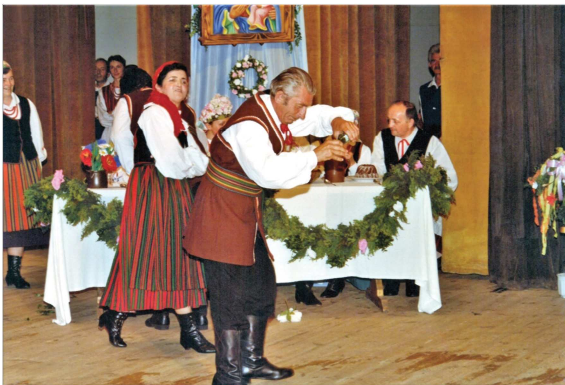
Fot. 22. Wesele Częstochowskie , 1995 r., scena Filharmonii Częstochowskiej

Ciekawym i ambitnym przedsięwzięciem była organizacja przedstawienia Wesele częstochowskie , które zakładało rekonstrukcję zwyczaju wesela z okolic Częstochowy w formie widowiska obrzędowego. W kulturze ludowej wesele było jednym z najważniejszych wydarzeń rodzinnych, ale także społecznych. 10 czerwca 1995 w Filharmonii Częstochowskiej odbyła się premiera, która jednocześnie wpisała się w obchody 20. rocznicy utworzenia województwa częstochowskiego. Niespodziewanie, duża liczba widzów przeszła najśmielsze oczekiwania.