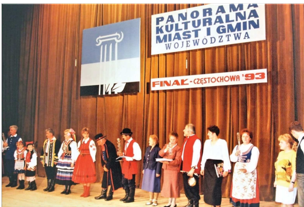
Fot. 11. Panorama Kulturalna Miast i Gmin Województwa Częstochowskiego

artystycznego, spotykali się tu ludowi śpiewacy i rockowi muzycy, wykonawcy poezji śpiewanej, tancerze i teatry obrzędowe, młodzi artyści i ci starsi wiekiem. Również dla mieszkańców miasta finał imprezy stanowił interesujące wydarzenie, które w panoramiczny sposób ukazywało, przybliżało i promowało amatorską twórczość artystyczną całego województwa.