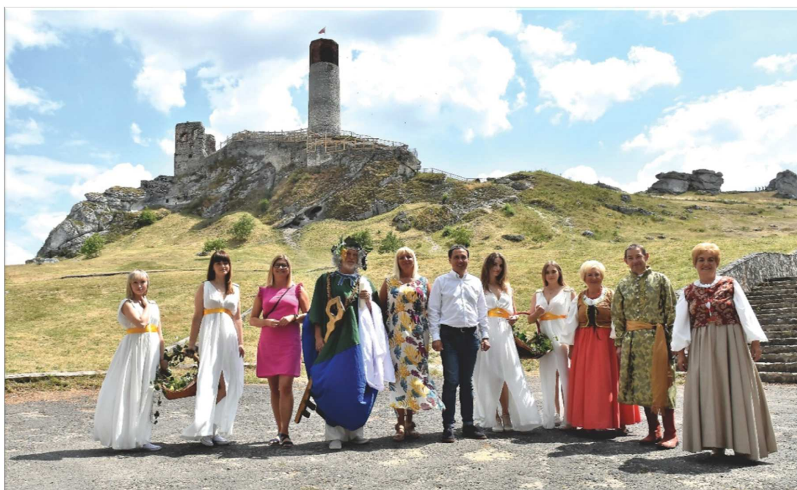
Fot. 39. Jurajski Festiwal Sztuki i Wina, 2019 r.