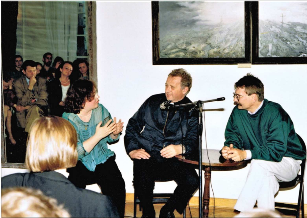
Fot. 13. Ks. Józef Tischner