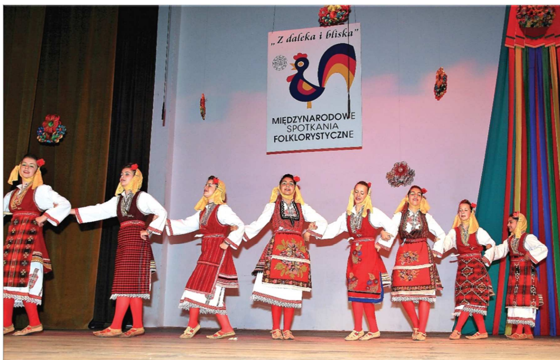
Fot. 31. Międzynarodowe Spotkania Folklorystyczne „Z daleka i bliska”, 2009 r.

Jeśli chodzi o promowanie kultury ludowej, to istotną rolę w działalności Regionalnego Ośrodka Kultury odgrywały Międzynarodowe Spotkania Folklorystyczne „Z daleka i bliska”. Impreza organizowana była do 1998 r., a o dużej randze wydarzenia świadczył fakt, że zostało ono objęte patronatem Międzynarodowej Organizacji Sztuki Ludowej IOV (The International Organization of Folk Art).