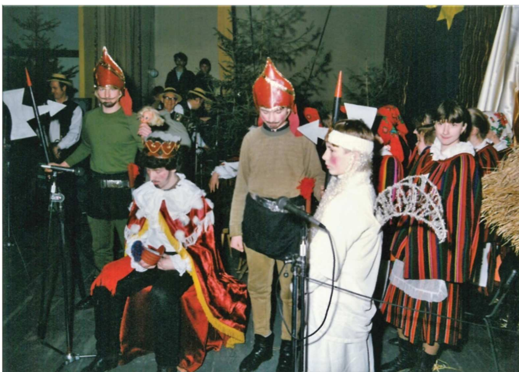
Fot. 20. Wojewódzki Przegląd Zespołów Obrzędowych „Herody”, 1994 r.

Pod koniec stycznia 1994 r. na zaproszenie Wojewódzkiego Ośrodka Kultury gościła w Częstochowie trzydziestoosobowa grupa herodów dziecięcych z Nowej Soli. Wystąpiła w sali widowiskowej WOK dla wychowanków Domów Dziecka oraz w Klubie Muzycznym Stacherczak dla szerszej publiczności Częstochowy. 185