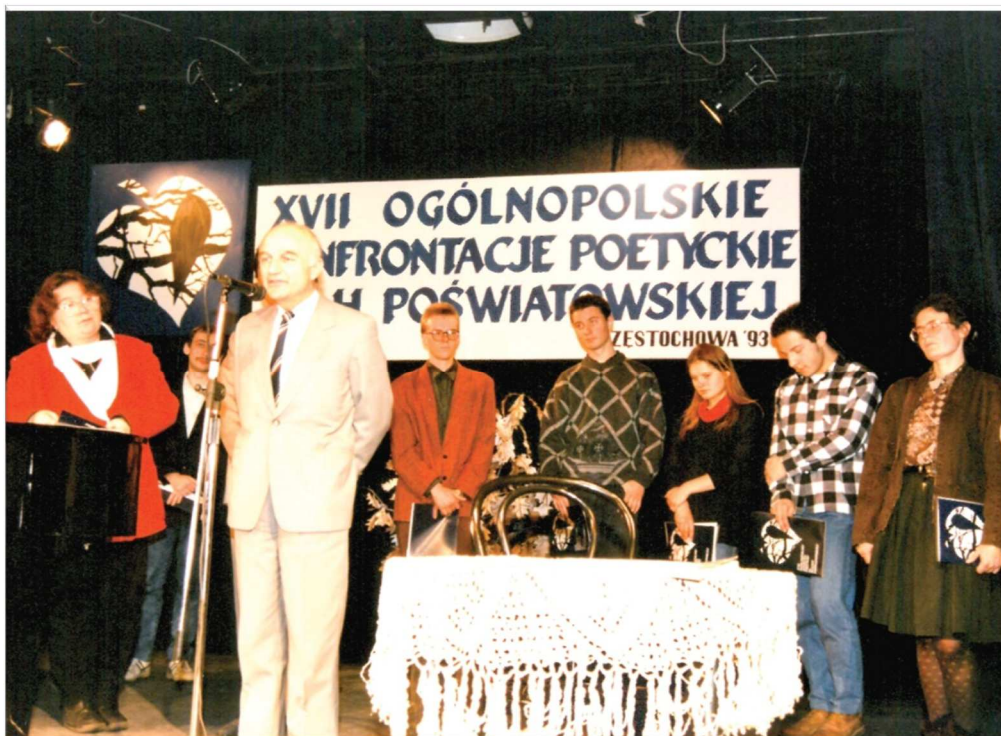
Fot. 16. Ogólnopolskie Konfrontacje Poetyckie im. Haliny Poświatowskiej, 1993 r.