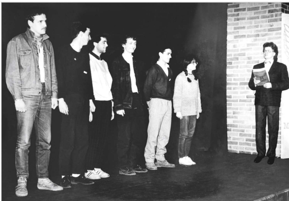
Fot. 2. Konfrontacje Poetyckie i Konkurs Recytatorski Poezji Lirycznej im. H. Poświatowskiej, uroczystość finałowa w Teatrze im. A. Mickiewicza w Częstochowie, lata 80.