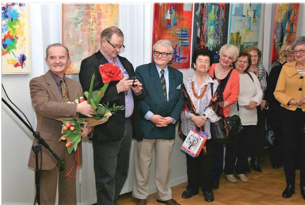
Fot. 30. Akt i abstrakcja – wystawa Grupy „Werniks”, 2015 r.