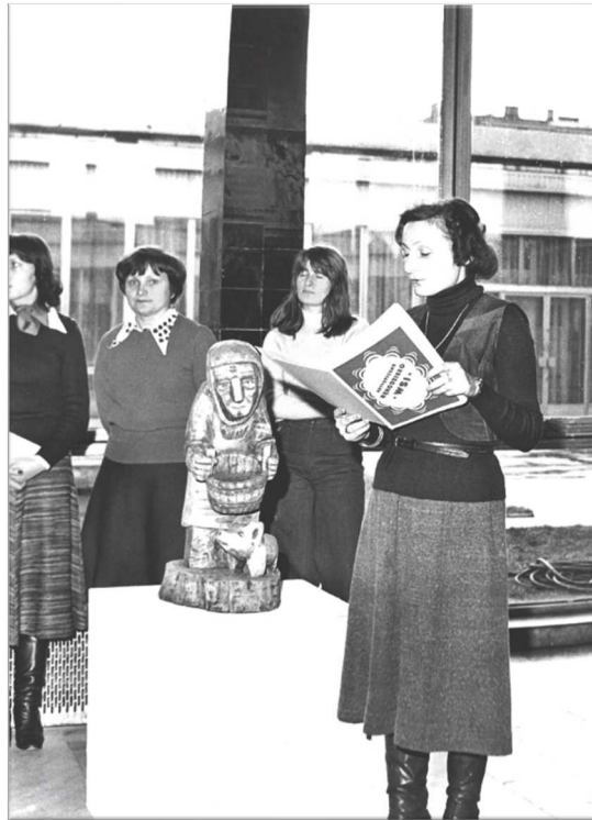
Fot. 5. Przegląd twórczości rękodzielniczej, prawdopodobnie w siedzibie BWA, lata 80.