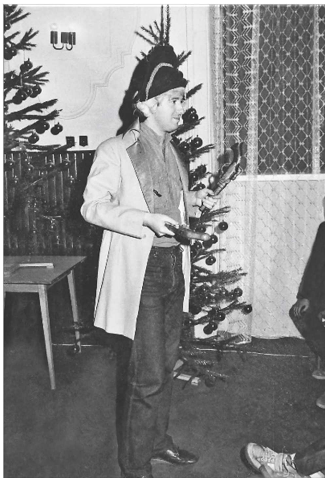
Fot. 4. Edukacja teatralna dzieci i młodzieży, 1986 r., siedziba WDK-u

Dużym zainteresowaniem publiczności cieszyły się także Wojewódzkie Przeglądy „Teatrów przy kawie”. Spotkania trwały do końca lat 80. Były organizowane przez WDK we współpracy z oddziałem wojewódzkim RSW „Prasa – Książka – Ruch” w Częstochowie oraz zarządem wojewódzkim ZSMP. Występy odbywały się w sali WDK. O ogromnym zainteresowaniu tą formą artystyczną świadczyła nie tylko liczba widzów, ale również uczestników – często w przeglądach brało udział ponad 20 amatorskich zespołów teatralnych działających przy Klubach Prasy i Książki w województwie częstochowskim. W roku 1989 WDK włączył się w realizację Ogólnopolskiego Festiwalu Teatrów Amatorskich OFTA, przeprowadzając etap wojewódzki dla zainteresowanych zespołów. Festiwal dawał możliwość prezentacji artystom teatrów wszelkiego rodzaju: lalkowych, żywego planu, obrzędowych, teatrów poezji i małych form. 79