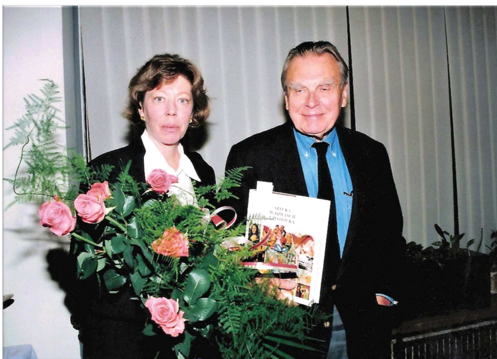
Fot. 15. Czesław Miłosz z żoną podczas „Sacrum w literaturze” w 1994 r.

Pojawienie się tego konkursu jury uznało za cenną i godną kontynuowania inicjatywę, będącą ważnym wkładem do współczesnej humanistyki. Podkreślano wagę i jakość imprez towarzyszących, bogactwo pomysłów, rozmach realizacyjny oraz znakomitą organizację.