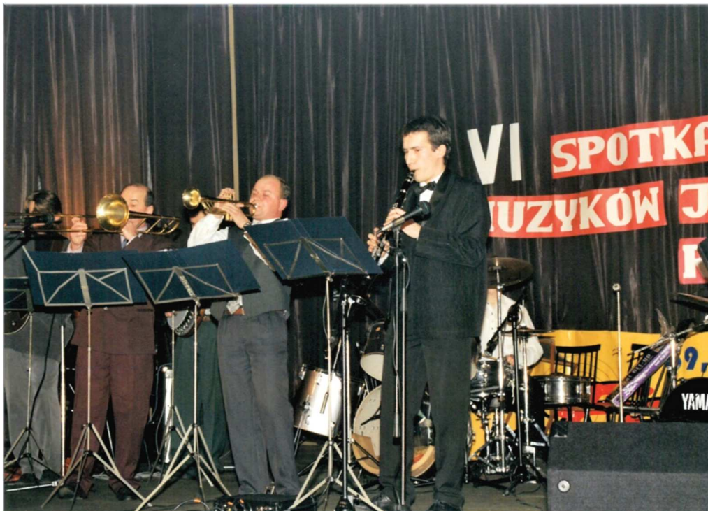
Fot. 23. Spotkania Muzyków Jazzowych w Rudnikach Wieluńskich, 1997 r.