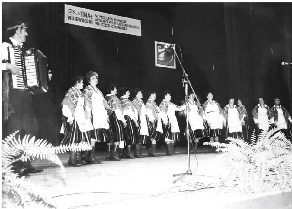
Fot. 6. Finał Międzywojewódzkiego Przeglądu Zespołów Artystycznych i Folklorystycznych Wsi Częstochowskiej, 1988 r.