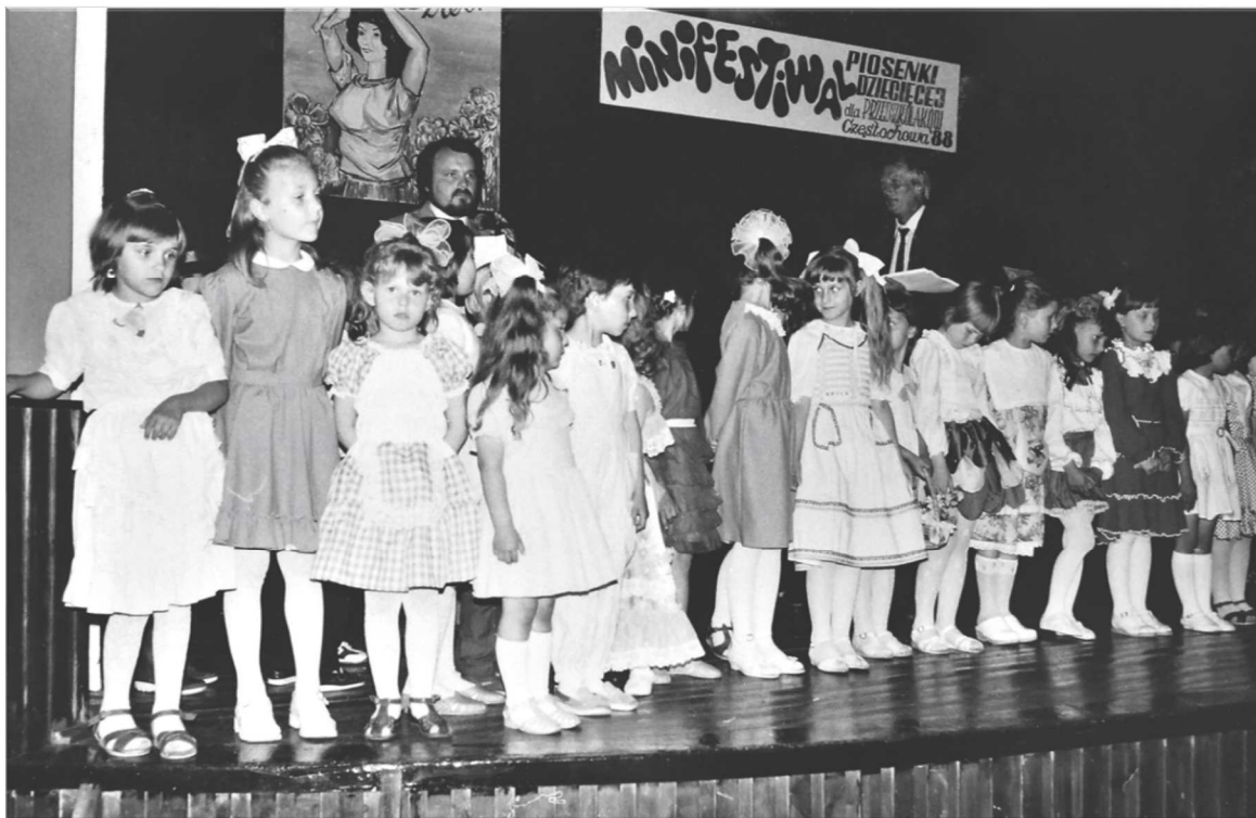
Fot. 9. Minifestiwal Piosenki Dziecięcej, 1988 r.