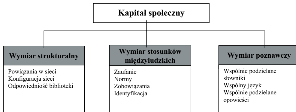
Rys. 1. Struktura kapitału społecznego