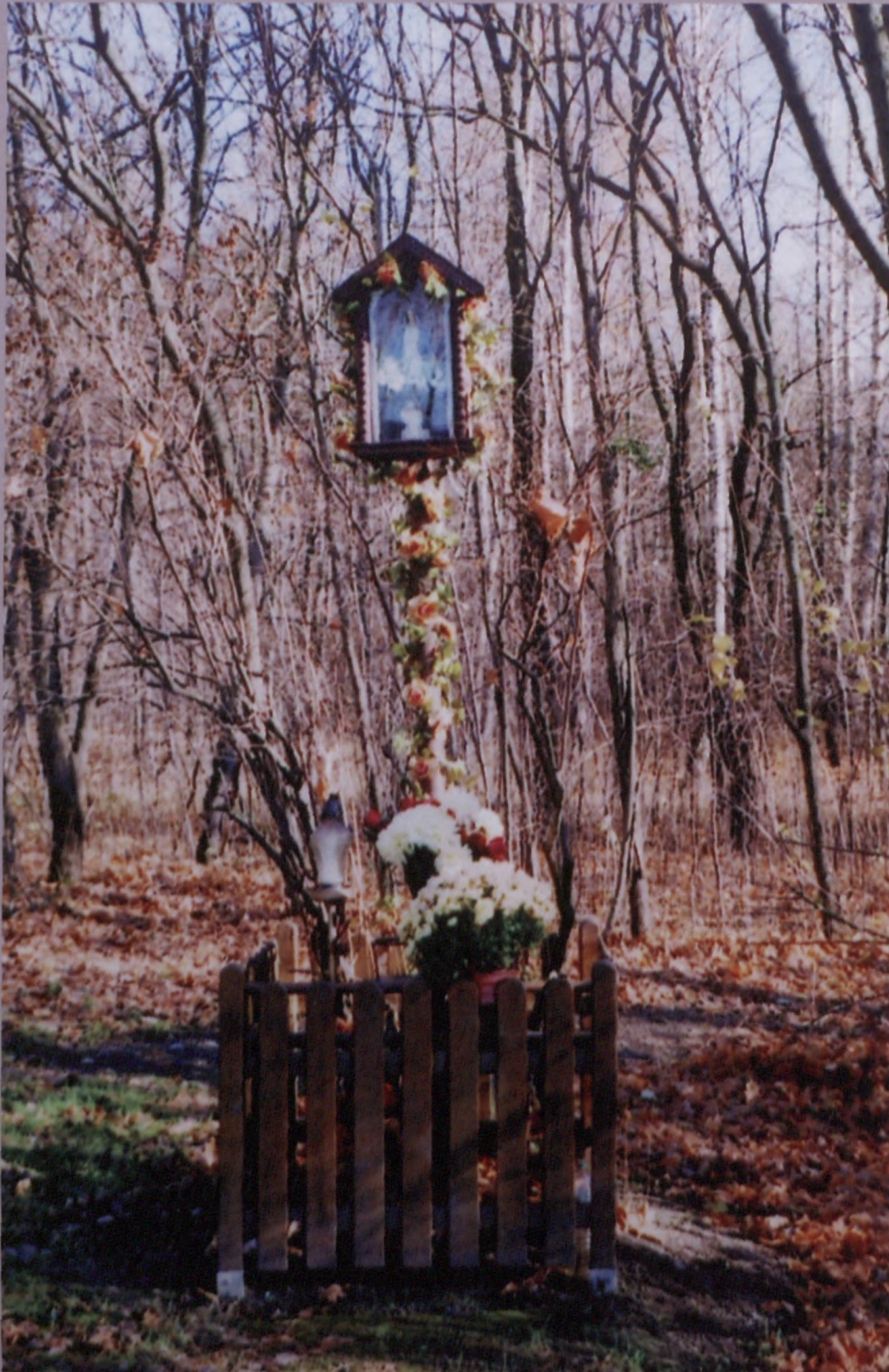
Kostuchna, 09.11.2010 r. Ul. Szarych Szeregów/droga do Murcek.