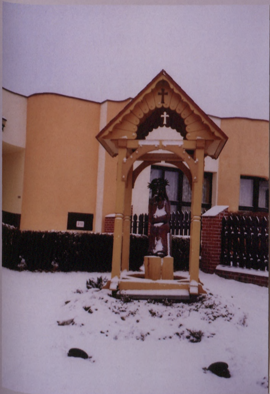
Kostuchna, styczeń 2011 Plac kościelny kościoła p.w. Trójcy Przenajświętszej. Kapliczka domkowa z figurą Chrystusa Frasobliwego