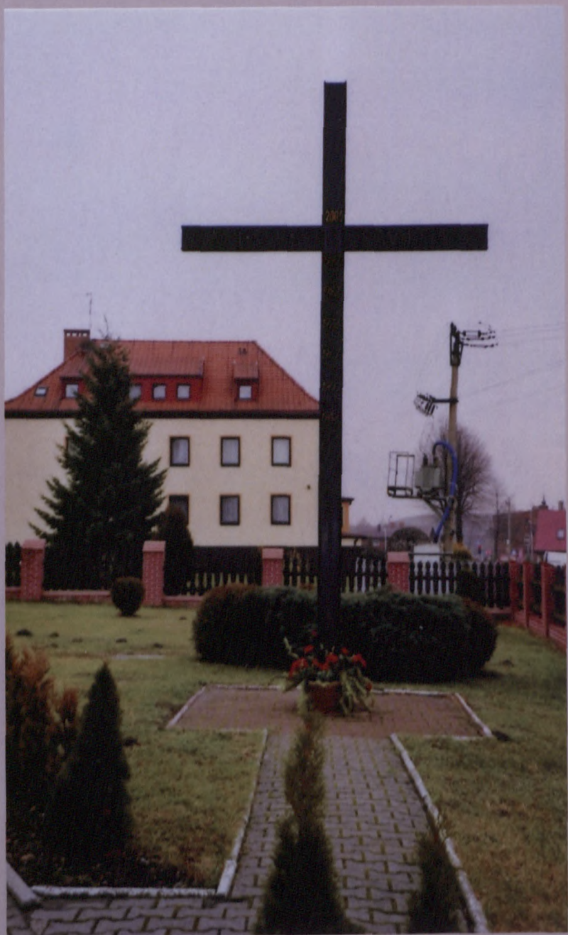
Kostuchna, 11.11.2010 Plac kościelny przy kościele p.w. Przenajświętszej Trójcy. Krzyż Misyjny.