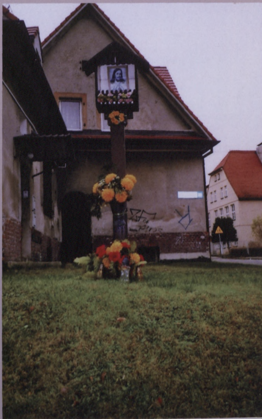
Kostuchna, 11.11.2010 Ul. Boya Żeleńskiego/Kazimierza Lepszego Kapliczka szafkowa