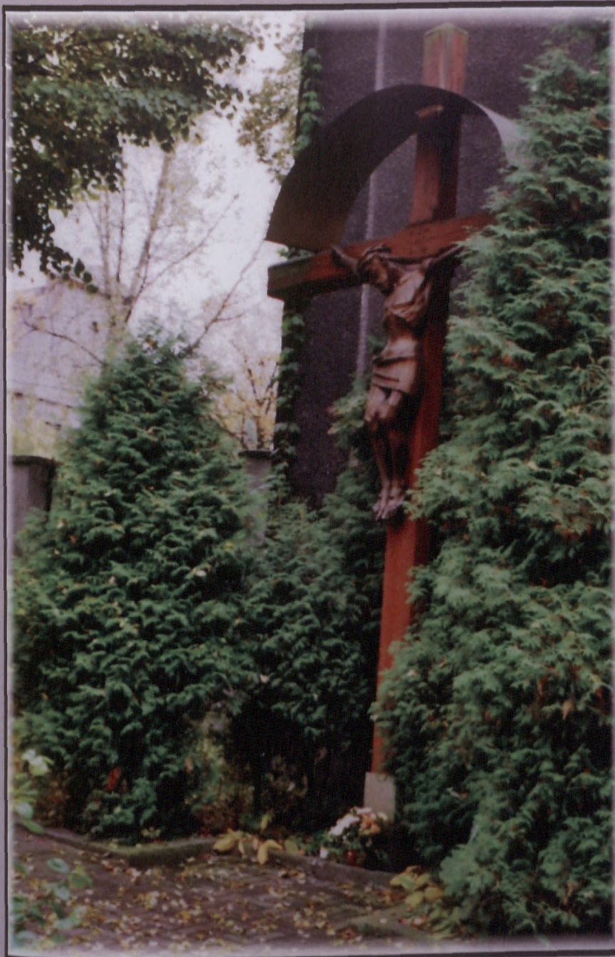
Centrum, 16.10.2010 r. Ul. Kilińskiego Wejście na dziedziniec kościoła p.w. św. św. Piotra i Pawła.