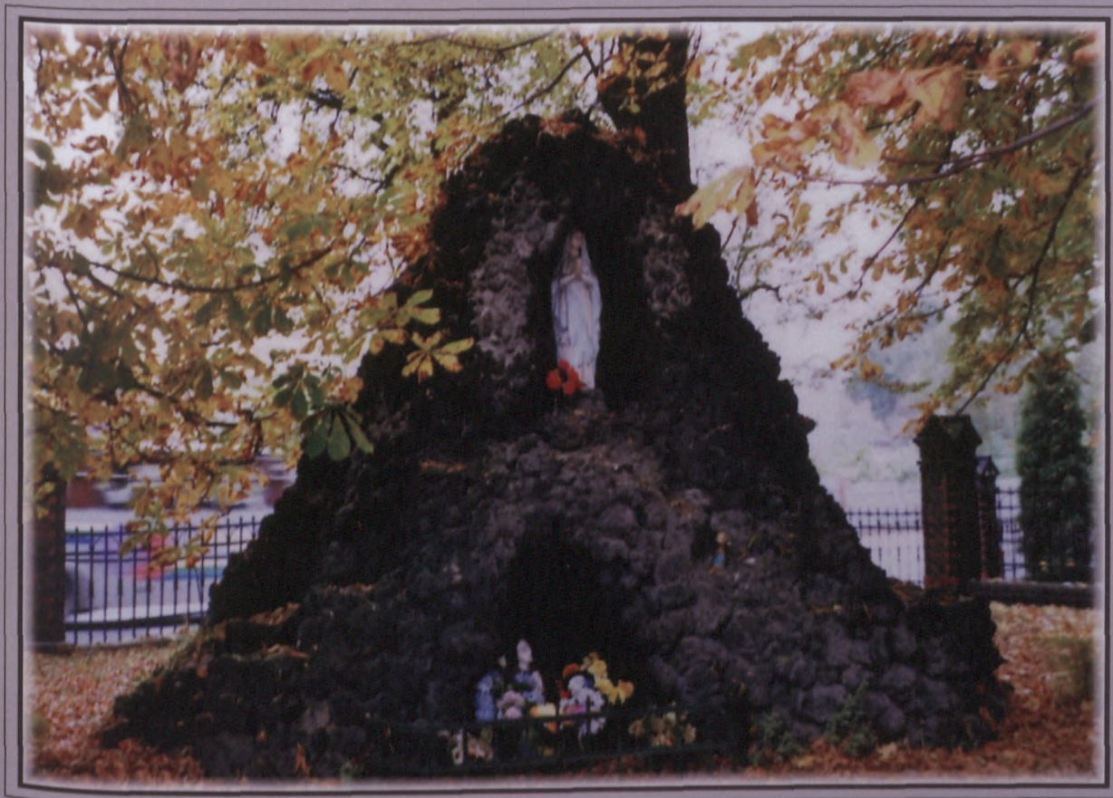
Centrum, 16.10.2010 r. Ul. Mikołowska Przy kościele p.w. św. św. Piotra i Pawła.