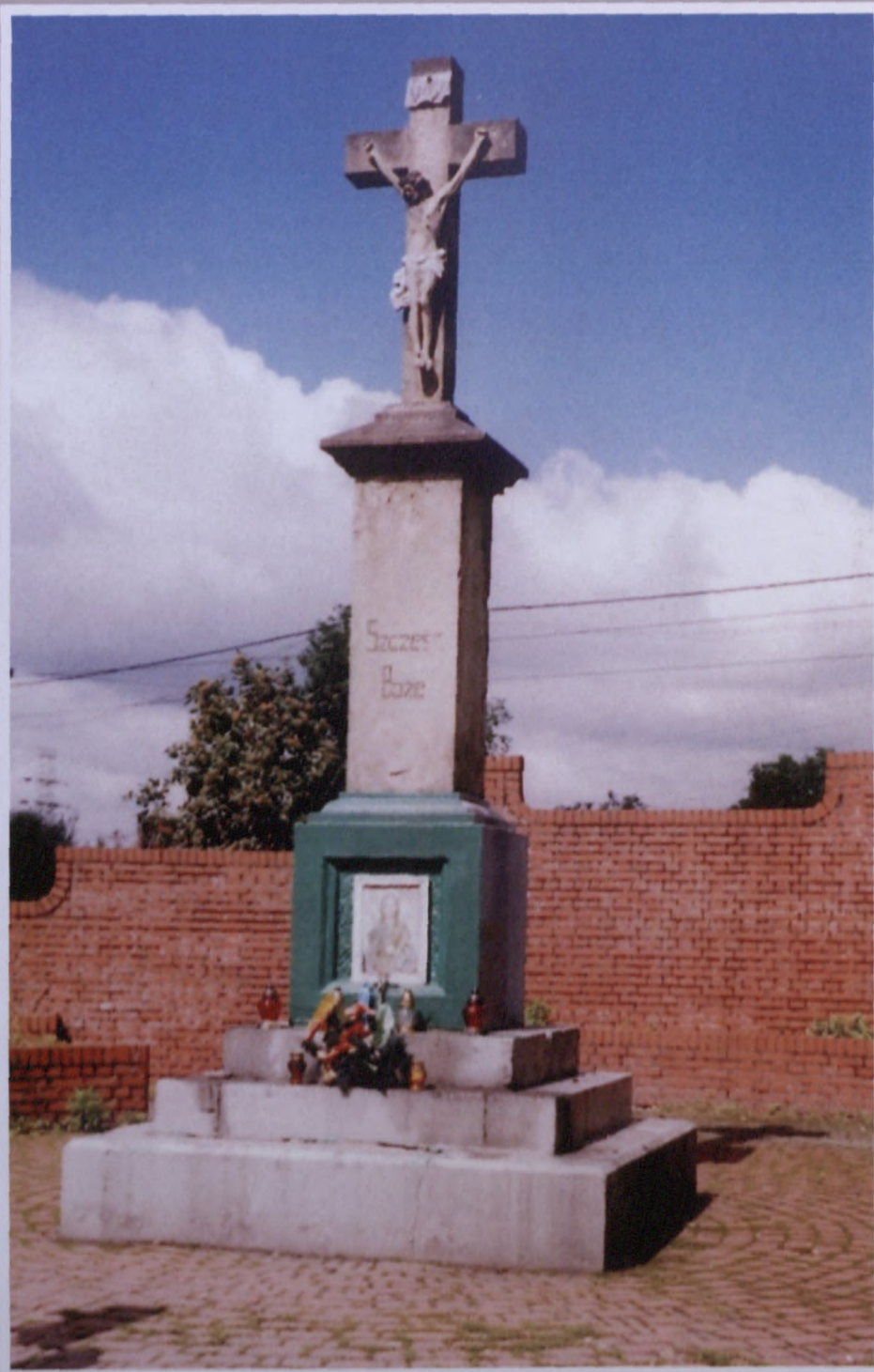
Załęże, 02.09.2010 r. Ul. Gliwicka - Łącznik (naprzeciw ulica Wiśniowa) Krzyż z figurą Chrystusa na kolumnie i cokole z XIX/XX w. ze sztucznego kamienia. Na kolumnie napis: Szczęść Boże