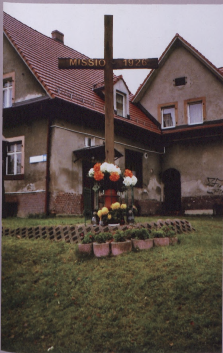
Kostuchna, 11.11.2010 Ul. Boya Źeleńskiego/Kazimierza Lepszego Krzyż Misyjny z 1926 r.