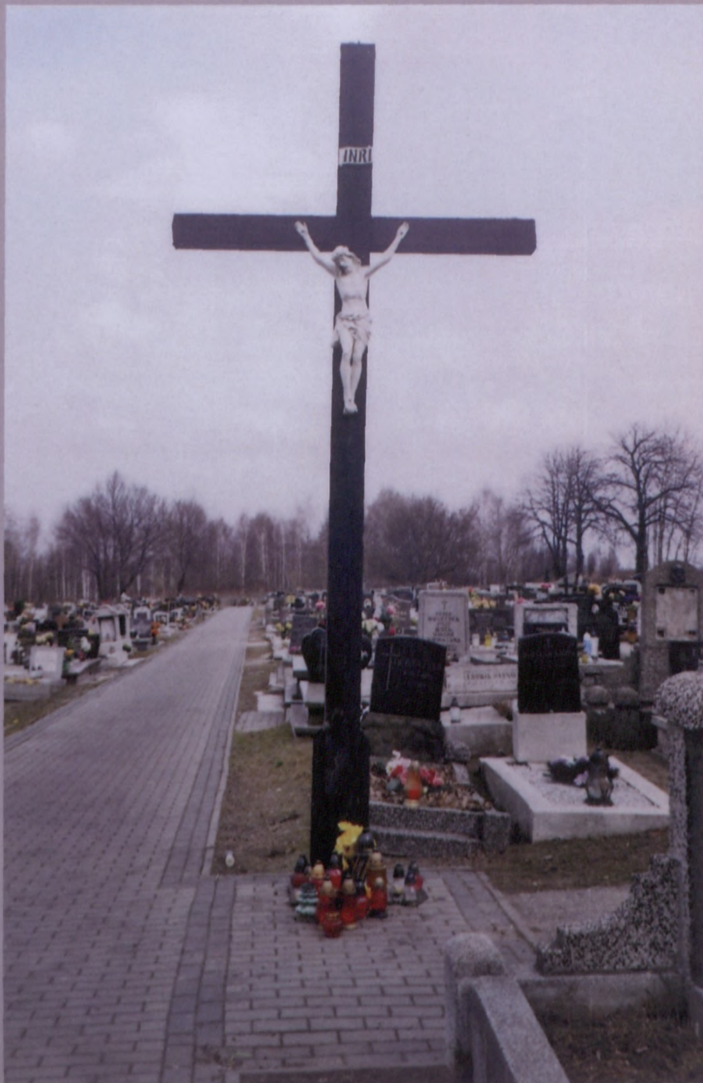
Janów, 27.03.2012 r. Krzyż drewniany na cmentarzu przy ulicy Cmentarnej. Figura Chrystusa z około połowy XIX w.