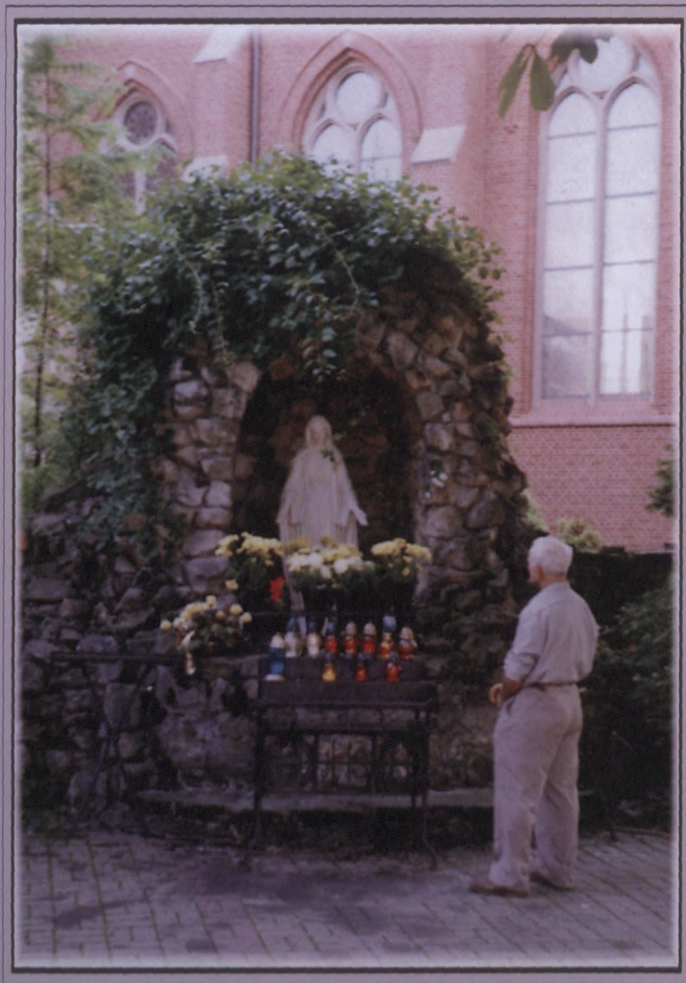
Bogucice, 11.08.2010r. Sanktuarium Matki Boskiej Bogucickiej z tyłu sklepiu parafialnego. Grota z figurą Matki Boskiej Niepokalanie Poczętej.