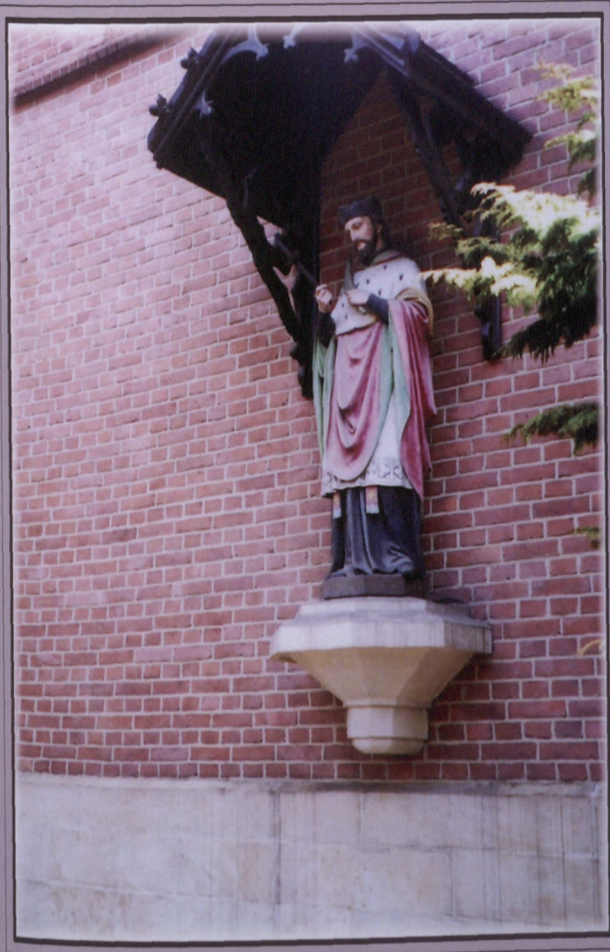
Bogucice, marzec 2012 r. Sanktuarium Matki Boskiej Bogucickiej. Kapliczka św. Jana Nepomucena na fasadzie Sanktuarium.