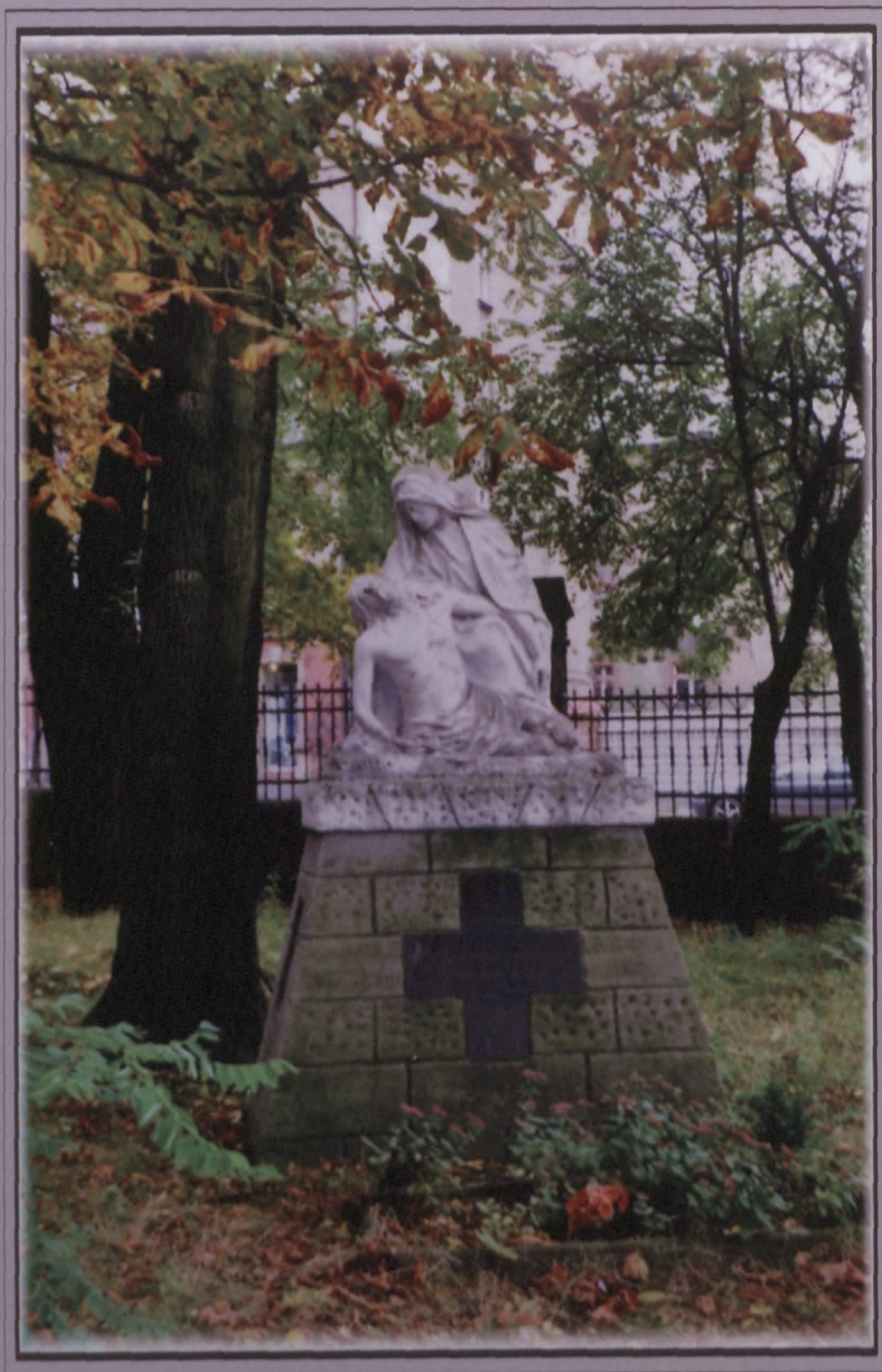
Centrum, 16.10.2010 r. Ul. Mikołowska Przy kościele p.w. św. św. Piotra i Pawła