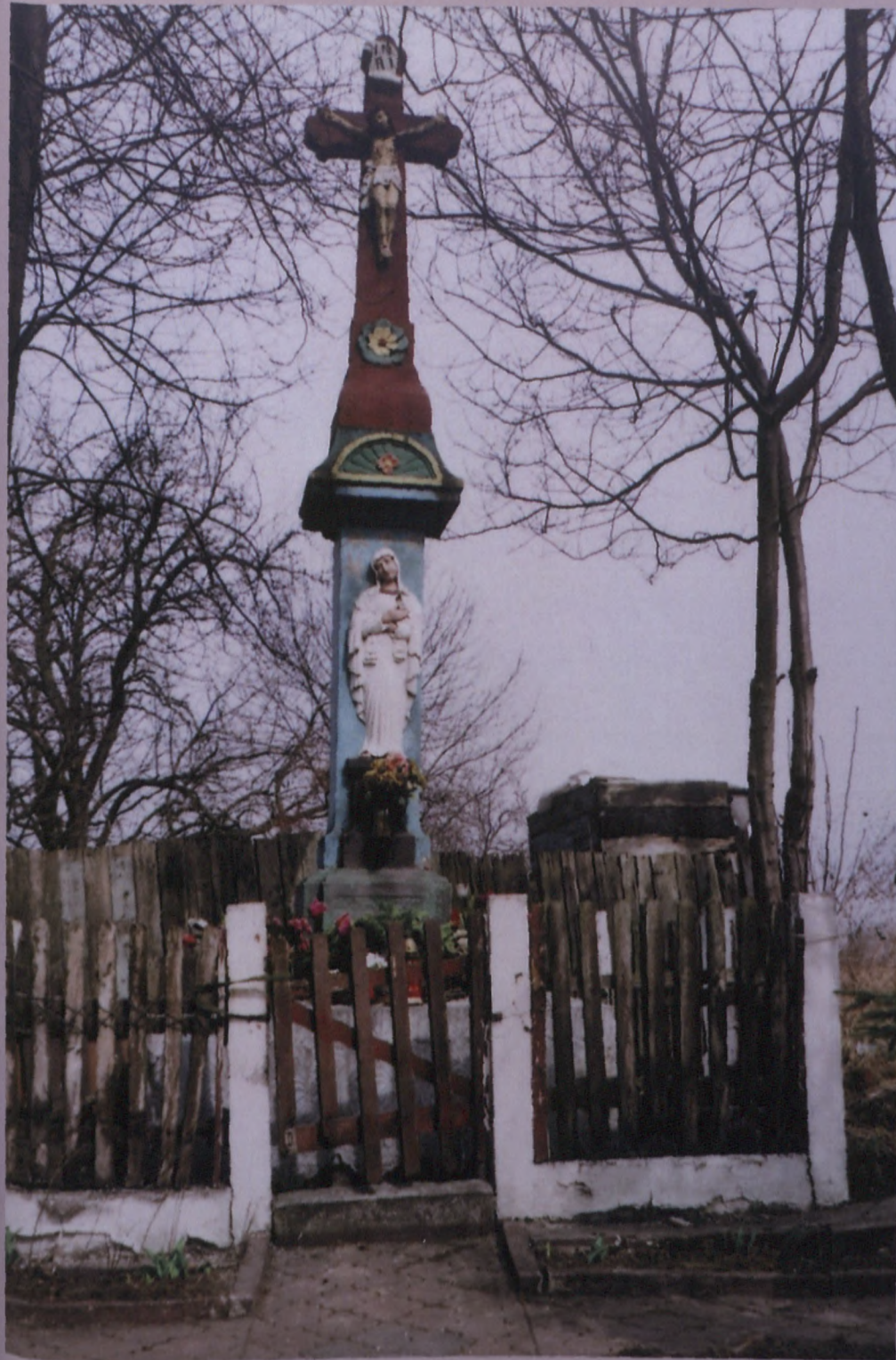
Janów, 27.03.2012 r. Ul. Oswobodzenia 139 Krzyż kamienny na cokole i kolumnie z około połowy XIX w. Na kolumnie figura MB Bolesnej.