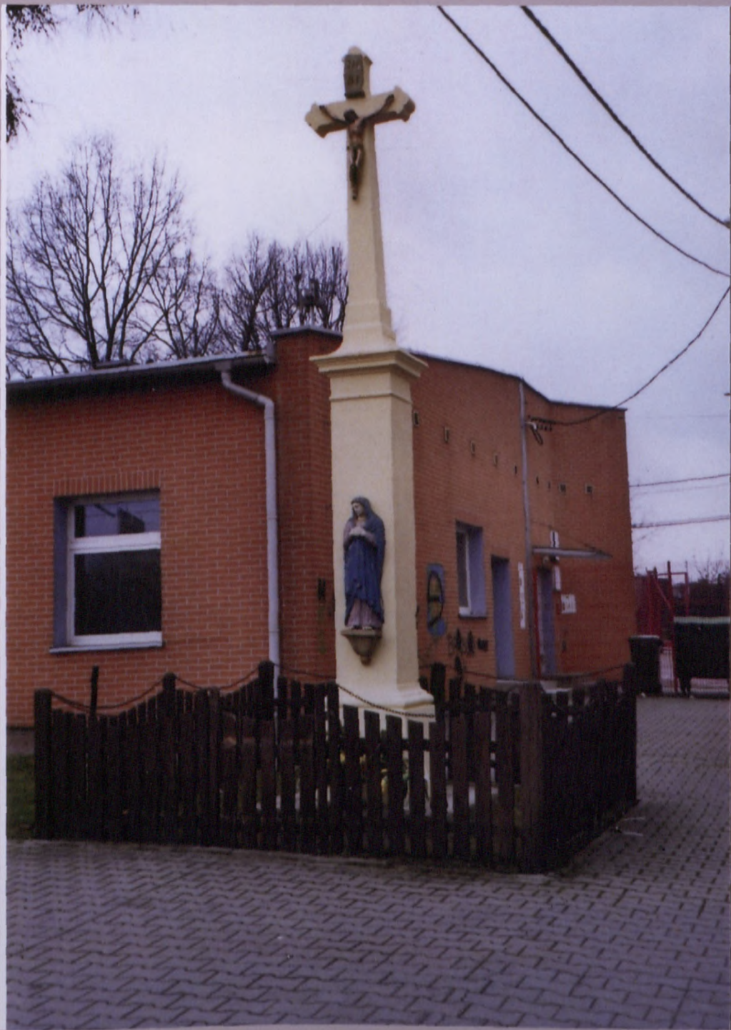
Zarzecze, 08.04.2012 r. Ul. Gen. S. Grota Roweckiego przy bud. nr 20 Krzyż kamienny z końca XIX w. na cokole i kolumnie. Na kolumnie figura Matki Boskiej Bolesnej.