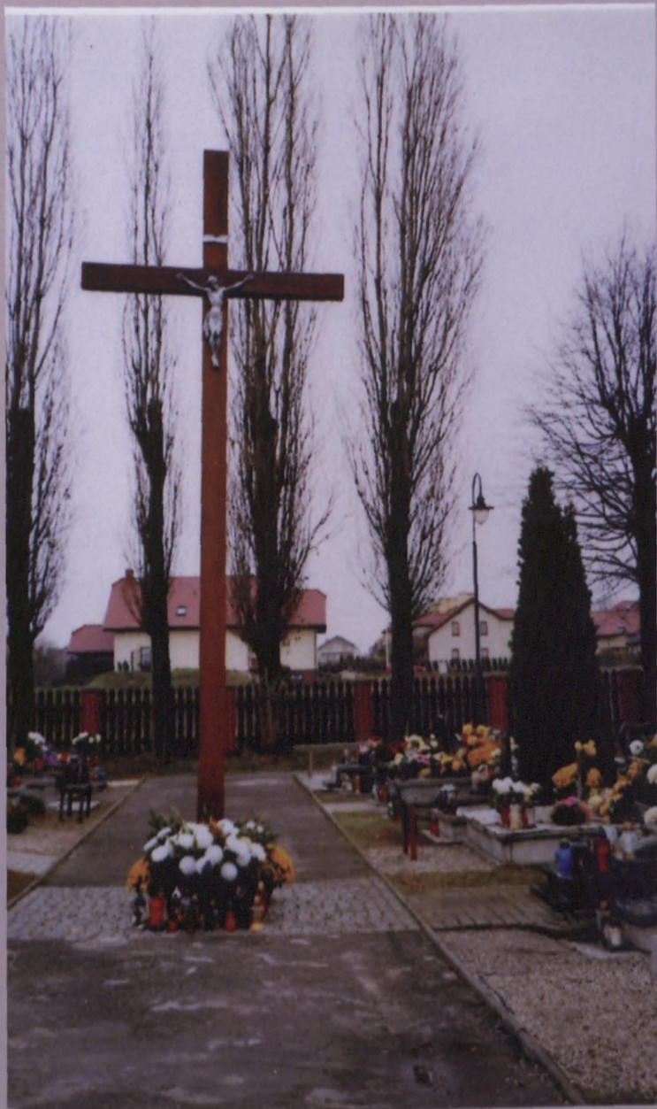
Kostuchna, 11.11.2010 Cmentarz parafialny Krzyż drewniany z 1991 r. z figurą Ukrzyżowanego.