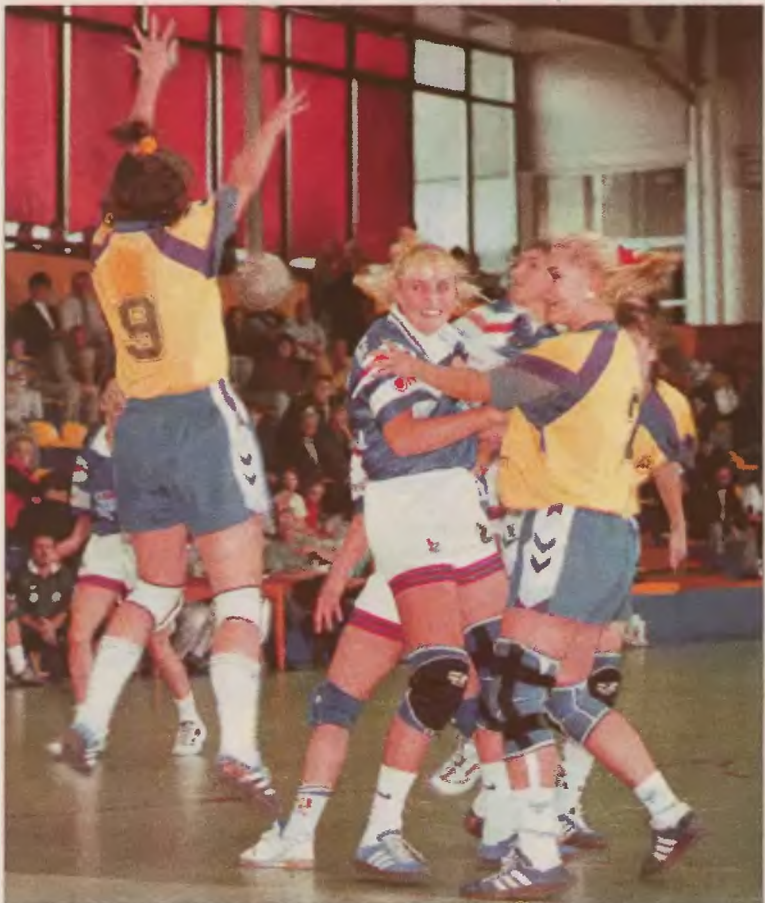
W naszym regionie odbędzie się tylko jedno spotkanie.