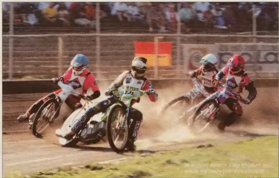
W pierwszej kolejce kilka spotkań zapowiada się niezwykle interesująco.

– Amica bez problemów powinna zwyciężyć, gdyż jest zespołem zdecydowanie lepszym. R.Mus.