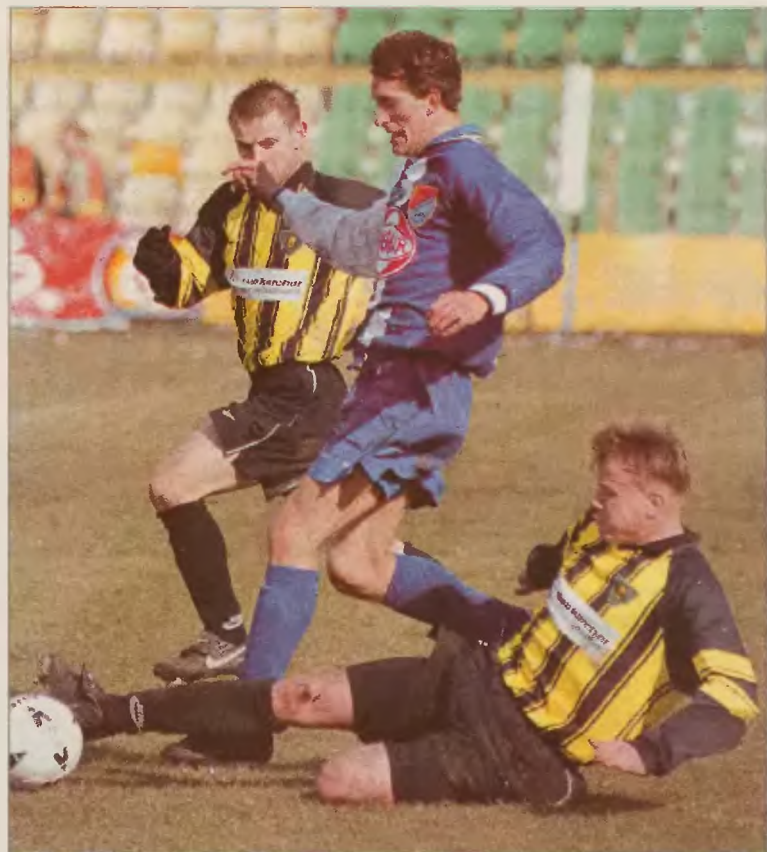
Piłkarze Rakowa nie liczą na cud. W Lubinie trudno im będzie nawet zdobyć punkt.

– Teraz jest już tak, że każdy gra dla siebie – przyznaje gołkiper. – Pokazanie się z dobrej strony może sprawić, że ktoś zawodnika za-