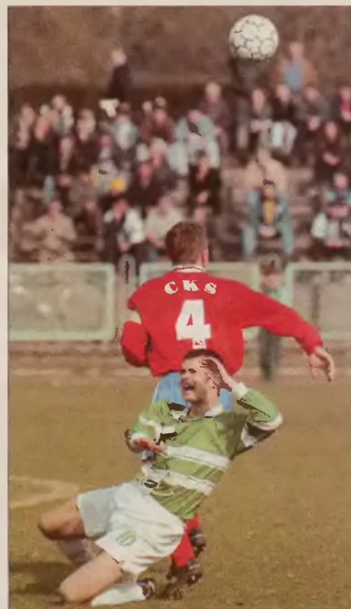
Trener CKS liczy na swoich piłkarzy.