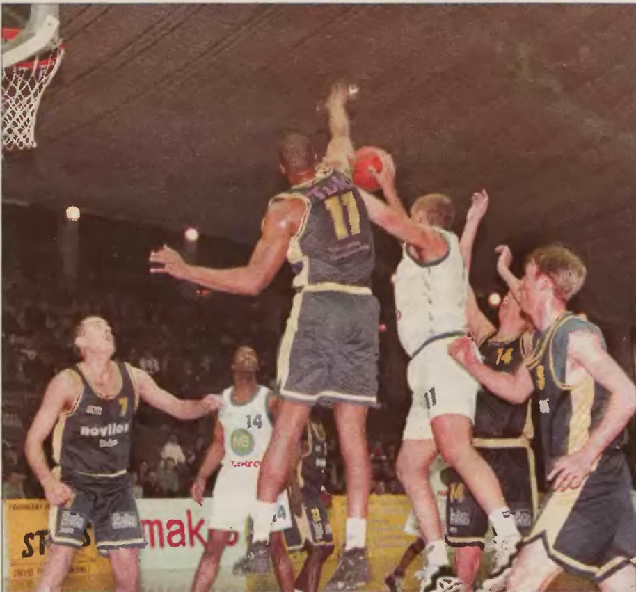
W play off koszykarze Zagłębia Maczki Bór Sosnowiec nie sprościli drużynie Komfortu Forbo Stargard.

– Jestem pewny, że przejdziemy wrocławian – dodaje Korytek. – Porobiłem już nawet ze znajomymi zakładami. Być może jestem nieoprawnym optymistą, ale ze Śląskiem powinniśmy sobie poradzić. Bardziej obawiałem się Nobilesu, z którym każdy mecz był bardzo dramatyczny. Teraz jestem spokojniejszy. (prass)