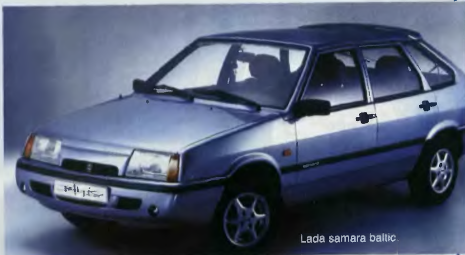
Lada samara baltic.

W zakładach w Niżnim Nowgorodzie z taśm fabryki GAZ zaczęły zjeżdżać nowe wolgi. Karoseria wygląda tak, jak dawniej. Dokonano za to wielu zmian konstrukcyjnych, dzięki którym unowocześniono ten archaiczny automobil. I tak nowa wolga ma silnik o mocy 150 KM, układ kierowniczy ze wspomaganiem, pięciobiegową skrzynię biegów i, z przodu, hamulce tarczowe. Nowe, wygodniejsze są też fotele, ale poza tym wszystko pozostało tak jak w samochodzie radzieckiej nomenklatury produkowanym już od kilkadziesiąt lat. Ze zbytem nie ma problemów, bo nowa wolga kosztuje tyle samo co najtańsze modele łady, czyli ok. 6,5 tys. dolarów, a jest przecież samochodem o wiele większym i wygodniejszym. Tymczasem cena najtańszych samochodów importowanych, za sprawą zaporowych cel i innego rodzaju opłat nie schodzi poniżej 11-12 tysięcy (tyle kosztuje czeska skoda felicia). Dlatego też zachodni producenci wspólnie z rosyjskimi biznesmenami podejmują coraz liczniejsze próby montażu, a nawet licencyjnej produkcji na terytorium Rosji. Rostow nad Donem słynie z wielkiej fabryki kombajnów, ale już od niedawna spośród zbożowych gigantów z taśm zakładów wyjeżdżają też koreańskie Daewoo – nie xie i espero. Co miesiąc Rostowczanie składają 400 samochodów. W Kalinin-