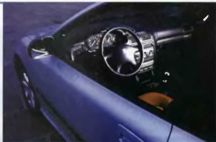
Nowości francuskiego koncernu model 406 coupé (u góry) oraz kombi 406 break.

Cena samochodu (z VAT-em) waha się w granicach od 55.353 do 73.608 zł. Opis-