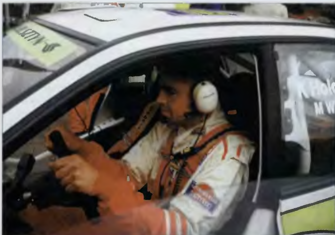
Mistrz Polski, zwycięzca „Kormorana”, Krzysztof Hołowczyc.

skim jeżdżący subaru imprezą 555. W uznaniu ich sukcesów w tym roku przyznano im numer „1” pod jakim dawniej startował Bublewicz, nieprzyznawany w tym rajdzie od jego przedwczesnej śmierci.