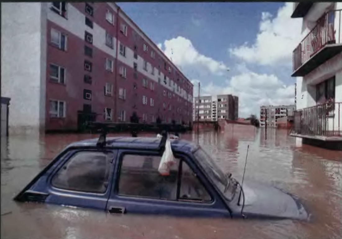
Wiele samochodów zalała powódź – czy będą jeszcze jeździły.

Zalany samochód trzeba przede wszystkim osuszyć. Najdłużej trwa suszenie foteli i tapicerki. Dokładnie trzeba wytrzeć kable i połączenia elektryczne. Należy