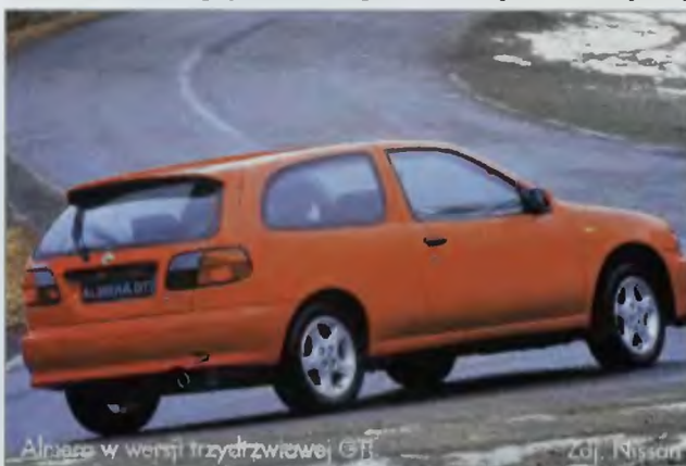
Almera w wersji trzydrzwiowej GTi

Ciekawostką konstrukcyjną zastosowaną w almerach jest system Multi-Link, znany z dużej maximy QX. Zapewnia niespotykany komfort jazdy i łatwość prowadzenia znany dotychczas tylko z aut wyższej klasy.