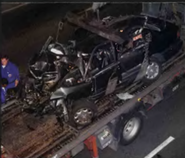
Wrak samochodu, którym jechała księżna Diana.