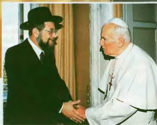
▲ Z Naczelnym Rabinem Izraela, Meirem Lau