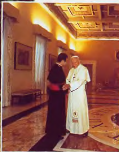
▲ Prywatnie w watykańskich apartamentach