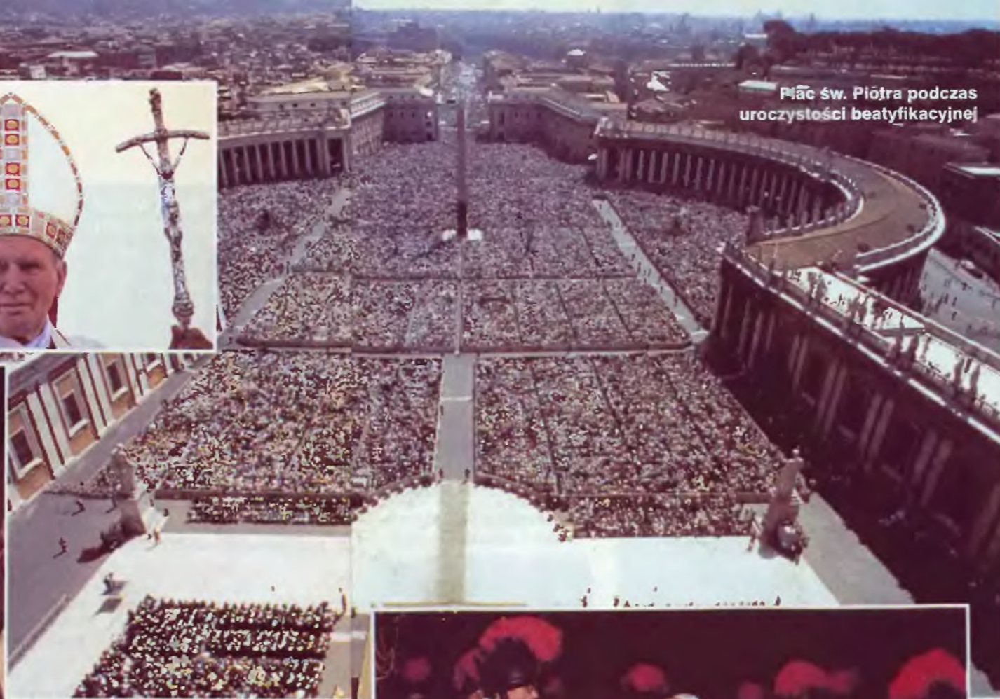
Plac św. Piotra podczas uroczystości beatyfikacyjnej