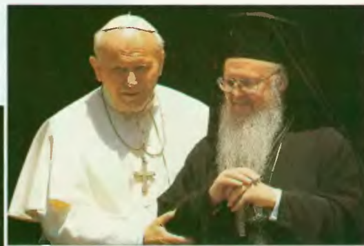
▲ Z Patriarchą Ekumenicznym, Bartłojem I