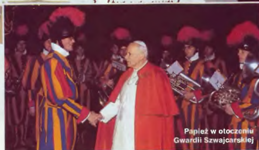
Papież w otoczeniu Gwardii Szwajcarskiej

Rola Stolicy Świętej jest wyjątkowa: spełnia ona zadania natury zarówno duchowej, jak i świeckiej, działa na arenie lokalnej i międzynarodowej. Papież jest głową Państwa Watykańskiego, zarządza sprawami ok. 500 obywateli Watykanu. Jako Następca św. Piotra przewodniczy kolegium wszystkich biskupów, z kolei jako biskup Rzymu zajmuje się sprawami swojej diecezji i jest odpowiedzialny za 2,6 miliona żyjących w niej katolików. Będąc najwyższym autorytetem w Kościele Katolickim, służy potrzebom ok. miliarda chrześcijan na całym świecie.