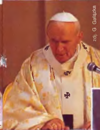
zof. G. Galazka