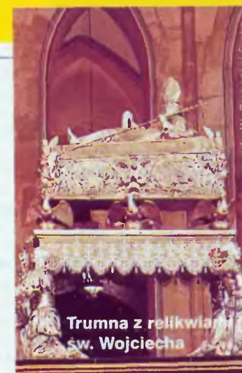
Trumna z relikwiami św. Wojciecha

Św. Wojciech, syn bogatego możnowładcy czeskiego, był zakonnikiem i misjonarzem. Służbę duszpasterską pełnił w prawie całej Europie. Nawracał pogan, troszczył się o najsłabszych. Kiedy w 994 roku