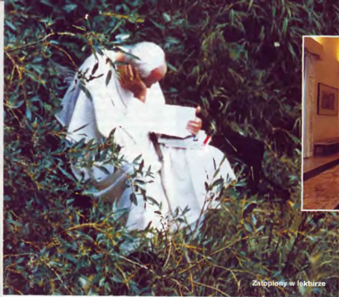
Zatopiony w lekturze