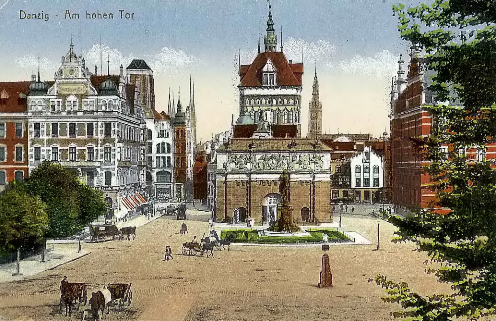
Danzig - Am hohen Tor