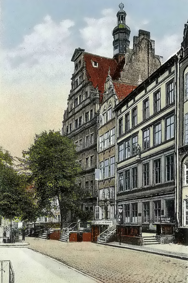
Danzig - Brotbänkengasse