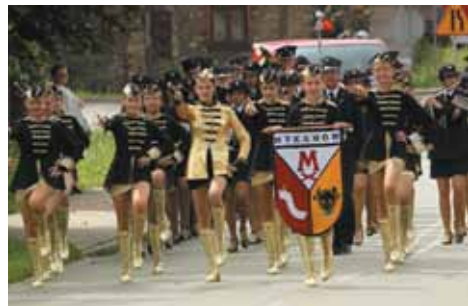
Przemarsz ulicami Mykanowa

Grand Prix Europy na żużlu, wyścig Tour de Pologne oraz Międzynarodowe Regaty Żeglarskie w Szczecinie w 2007 r. Kilkakrotnie grała w Warszawie podczas Koncertów Finałowych Wielkiej Orkiestry Świątecznej Pomocy w studio TVP, a także z okazji Jubileuszu 15-lecia WOŚP biorąc udział w koncercie galowym w Teatrze Buffo. Reprezentowała powiat częstochowski na międzynarodowych festiwalach we Friedrichshafen (Niemcy), Folklor Balkan Folk Fest (Bułgaria) i Mosciano Festival (Włochy). Wieloletnie osiągnięcia Młodzieżowej Orkiestry Dętej przy Ochotniczej Straży Pożarnej w Mykanowie zostały uwieńczone zdobyciem tytułu „Mistrza Polski Orkiestr Dętych OSP” na XXI Ogólnopolskim Festiwalu Orkiestr Dętych OSP w Krynicy Górskiej w 2011 r.