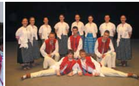
Festiwal Folklorystyczny Orlawa – Czechy 2008