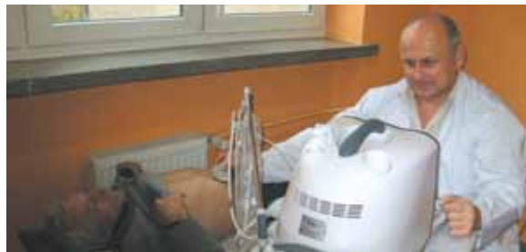
Wykonywanie badania USG