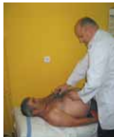
Badanie kontrolne pacjenta

Doktor Rachwalik dał się poznać jako znakomity lekarz oraz inicjator akcji promujących zdrowy styl życia, takich jak: badania mammograficzne, badania profilaktyczne i przesiewowe w zakresie schorzeń narządu wzroku, słuchu, chorób układu oddechowego, krążenia, chorób gruczołu piersiowego, jak również układu kostno-stawowego. Swym działaniem od 16 lat udowadnia, że służba zdrowia może funkcjonować w imię zasady – najważniejsze jest dobro pacjenta.