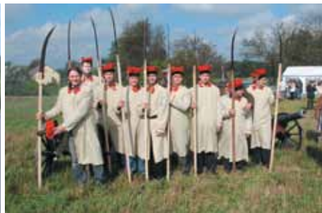
Uczestnicy rekonstrukcji bitwy pod Melchowem