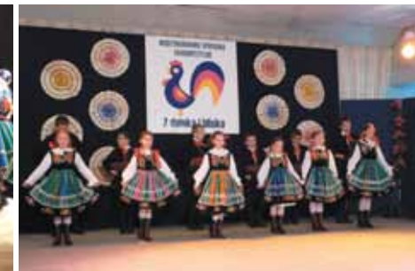
Międzynarodowe Spotkania Folklorystyczne „Z daleka i bliska”