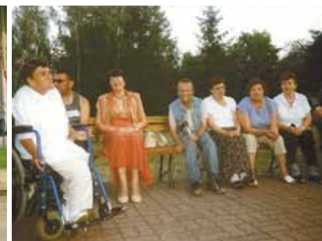
Odpoczynek podczas spaceru