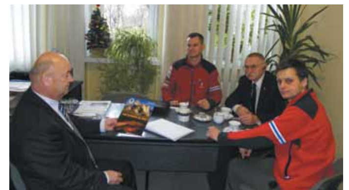
Ratownicy u wicestarosty

ZAPAMIĘTAJ !!! TELEFON ALARMOWY W GÓRACH I NA JURZE 601 100 300