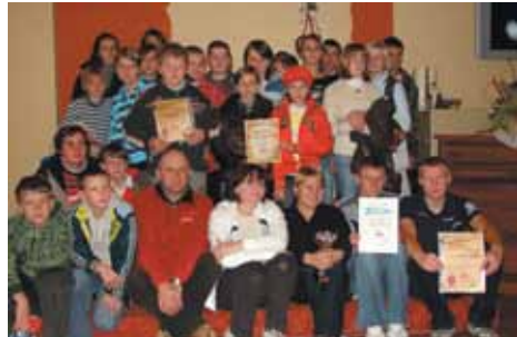
9 zlot sk PTSM Glucholazy