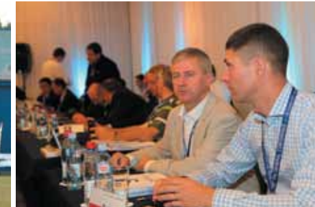
Konferencja Międzynarodowej Federacji Lotnictwa Sportowego