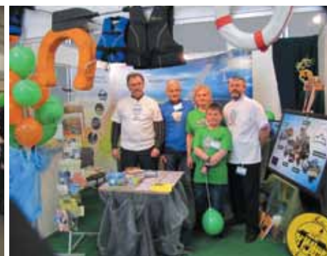
Stoisko na targach