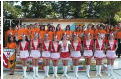
Folklor Balkan Folk Fest (Bułgaria)