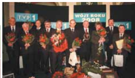
Wręczenie wyróżnienia Wójt Roku 2008