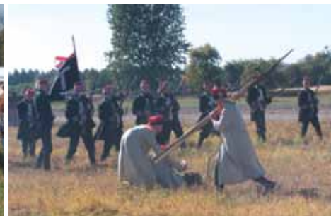
Inscenizacja bitwy pod Melchowem