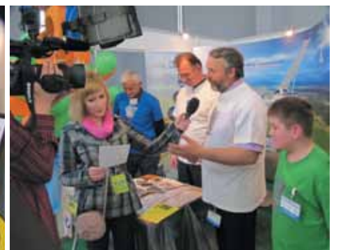
Udzielanie wywiadu dla TV