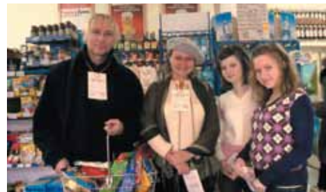
Podczas zbiórki żywności