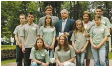
Dzień Dziecka w Pałacu Prezydenckim, 2006 r.