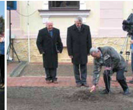
Uroczystość oddania do użytku nowego budynku Urzędu Gminy w 2006 r.