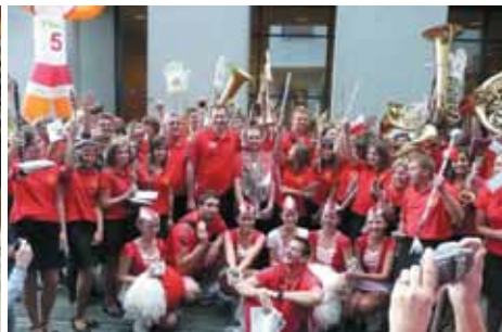
Powitanie w Warszawie reprezentacji Polski siatkarzy po zdobyciu Mistrzostwa Europy we wrześniu 2009