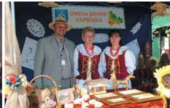
Promocja gminy Janów na targach turystycznych