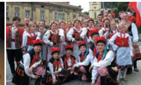
Zwiedzanie miasta podczas Festiwalu Folklorystycznego Orlawa