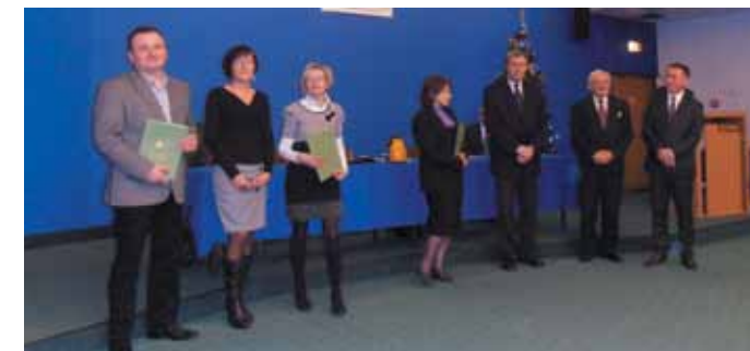
Uroczystość w Katowicach