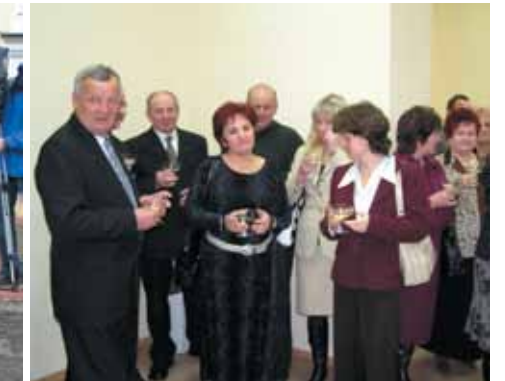
Przyjęcie z okazji oddania do użytku nowego budynku Urzędu Gminy