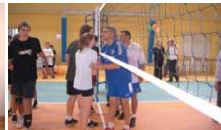
Kosmiczny Mecz - nauczyciele - uczniowie, z okazji Dnia Edukacji Narodowej