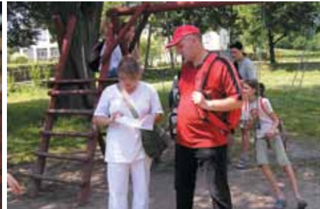
Przed wyruszeniem na trasę bystrzanowickiej majówki