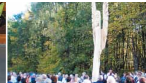
Figura „Olsztyńskiego Anioła Stróża”