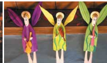
„Aniołki”, figurki z liczącej obecnie 350 rzeźb kolekcji