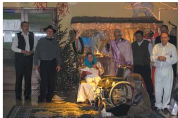
Jasełka w wykonaniu zespołu Rodzina