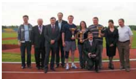
Śląska Spartakiada Związku Młodzieży Wiejskiej