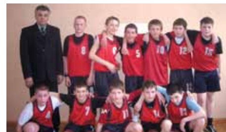
Drużyna piłkarska SP w ramach projektu Szkoła Marzeń