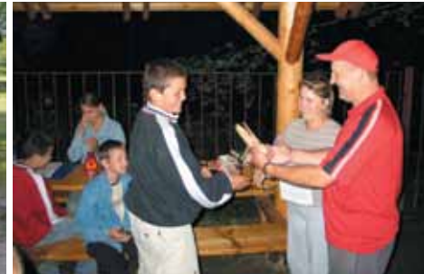
SK PTSM w Siedlcu, rozdanie nagród