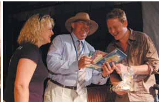
Promocja gminy Janów na Jurajskim Lecie Filmowym w Złotym Potoku