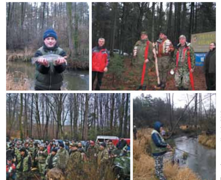
Zawody pstrąg - Kocinka 2012