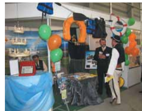
Promowanie gospodarstwa agroturystycznego