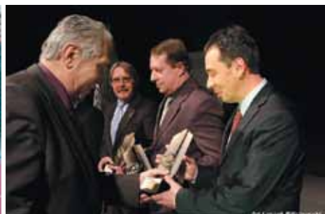
Wręczenie nagród Jurajski Produkt Roku 17.12.2010