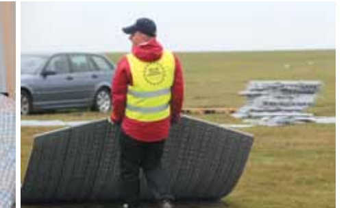
Mistrzostwa Europy Modeli Samolotów Latających na Uwięzi