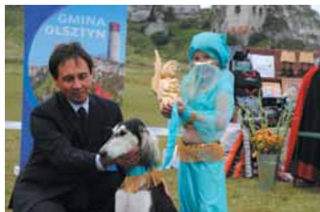
III Ogólnopolski Festiwal Chartów w Olsztynie 10.09.2011