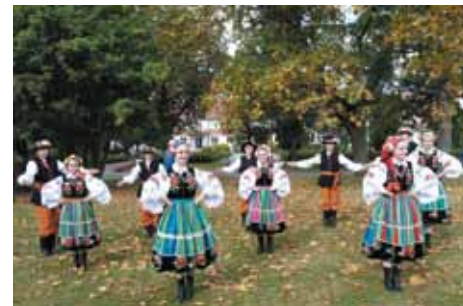
XIX Ogólnopolski Festiwal Folklorystyczny „Dziecko w folklorze”, Baranów Sandomierski, park zamkowy

Zespół powstał w 1998 roku z inicjatywy Zarządu OSP we Wrzosowej. Swoją nazwę przyjął z chęci podkreślenia więzi z rodzinną miejscowością, jak również z faktu, iż większość członków zespołu pochodziło z Wrzosowej i okolic. Obecnie zespół liczy 120 osób, w większości mieszkańców gminy Poczesna. W swoim bogatym repertuarze posiada wszystkie polskie tańce narodowe oraz tańce i pieśni regionów: częstochowskiego, krakowskiego lubelskiego, łowickiego, rzeszowskiego i śląskiego. Swoją program artystyczny zespół prezentuje podczas licznych występów krajowych i zagranicznych, na których zdobywa prestiżowe nagrody. Najważniejsze osiągnięcia to: III miejsce w kategorii zespoły taneczne na XIX Ogólnopolskim Festiwalu Folklorystycznej Twórczości Dziecięcej „Dziecko w folklorze”, I miejsce (w kategorii gimnazja) i III miejsce (szkoły ponadgimnazjalne) na VII Przeglądzie Dziecięcych i Młodzieżowych Wokalistów Powiatu Częstochowskiego. Wrzosowianie trzykrotnie byli gościem honorowym na uroczystościach w Grecji, Serbii i Macedonii, gdzie pełnili funkcję ambasadora kultury polskiej. Zespół działa w czterech kategoriach wiekowych, a dodatkowo w 2011 roku powstała 5-osobowa kapela. Kadre zespołu stanowią: Justyna Wilk – choreograf, Katarzyna Kaźmierczak – instruktor tańca, Dorota Wiśniewska-Klekot – instruktor śpiewu oraz Anna Jaśkiewicz – instruktor muzyczny i szef kapeli. Opiekę merytoryczną nad zespołem sprawuje dyr. Centrum Kultury Anita Imiołek.