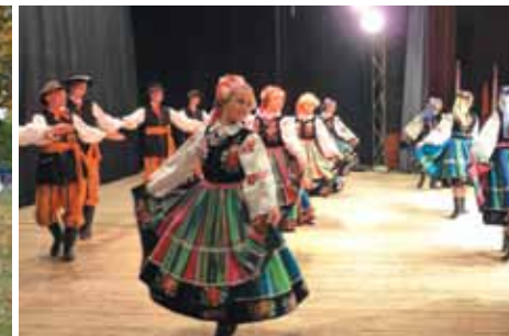
Koncert finałowy XIV Międzynarodowych Spotkań Folklorystycznych „Z daleka i bliska”