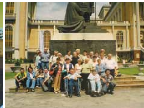
Wycieczka z podopiecznymi