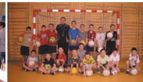
Wiosenny turniej koszykówki pod patronatem Starosty Częstochowskiego