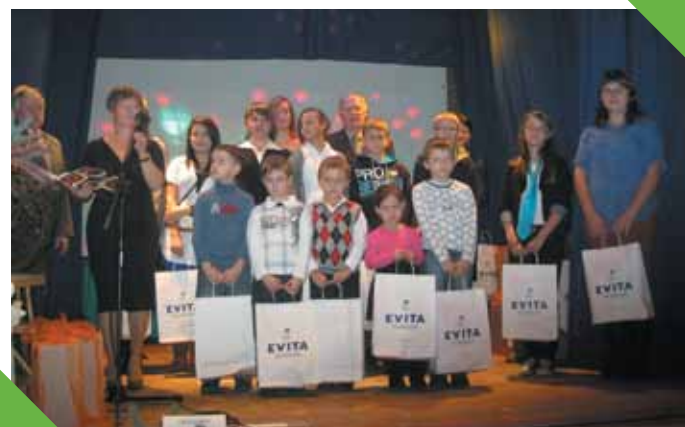
Autorzy najlepszych prac piernikowych