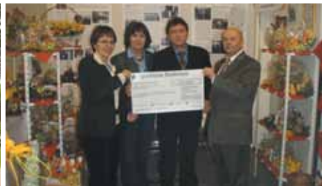
Spotkanie z przedstawicielami powiatu bodeńskiego