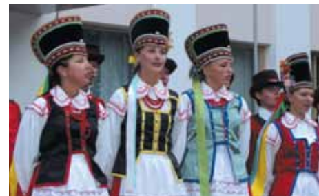
Podczas występów w Śniatyniu (Ukraina)