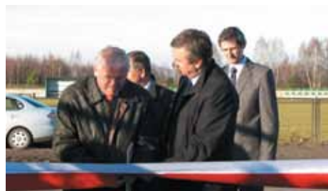
Otwarcie Orlika w Aleksandrii