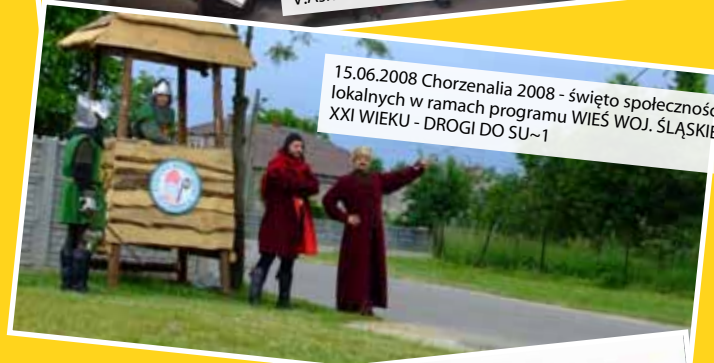
15.06.2008 Chorzenalia 2008 - święto społeczności lokalnych w ramach programu WIEŚ WOJ. ŚLĄSKIEGO XXI WIEKU - DROGI DO SU-1