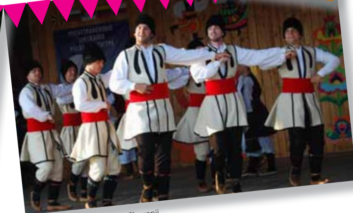
Vidovdan Serbska Grupa ze Słowenii