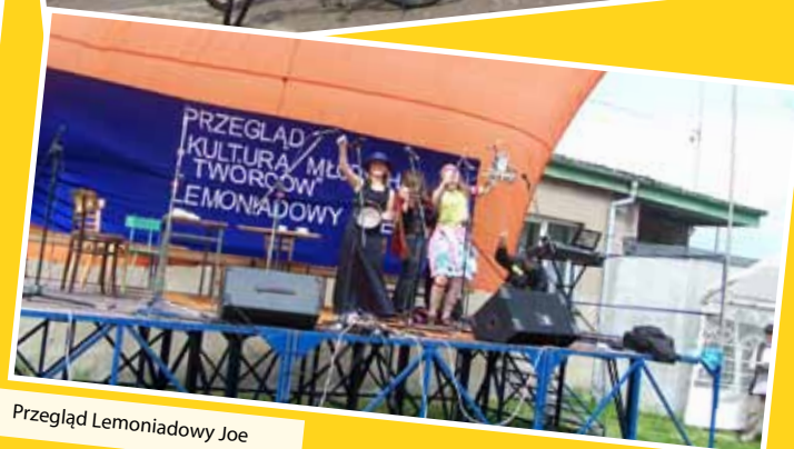
Przegląd Lemonyadwy Joe