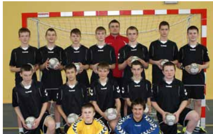
Gimnazjum w Lelowie, mistrzowie powiatu i rejonu