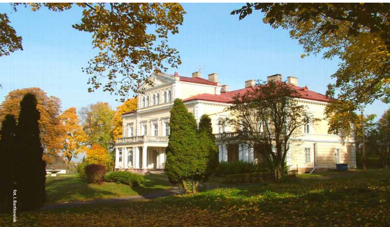
fol. I. Bartkowiak

BEZPŁATNY BIULETYN INFORMACYJNY STAROSTWA POWIATOWEGO W CZĘSTOCHOWIE