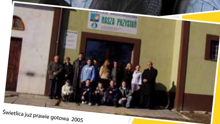
Świetlica już prawie gotowa 2005