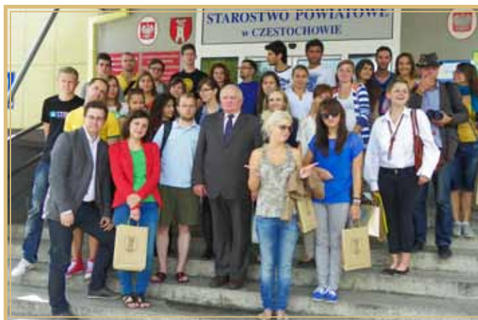
Pamiątkowe zdjęcie przed starostwem