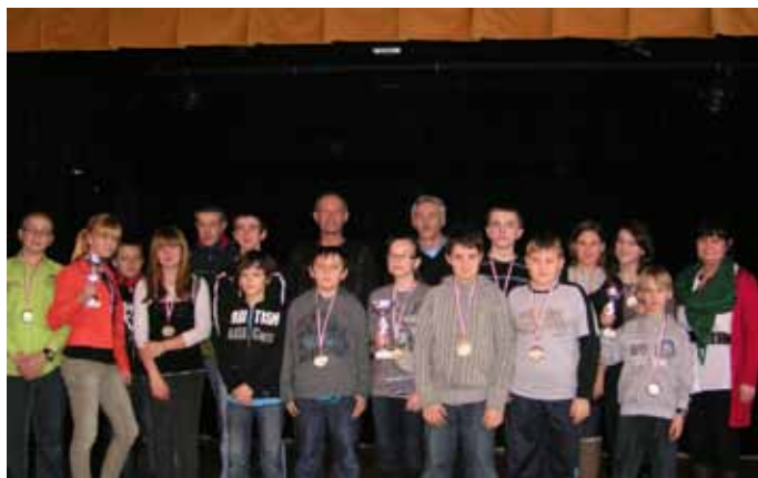
Najlepsi szachiści szkół podstawowych i gimnazjów