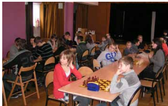
Oczekiwanie na rozpoczęcie Mistrzostwa Powiatu w szachach