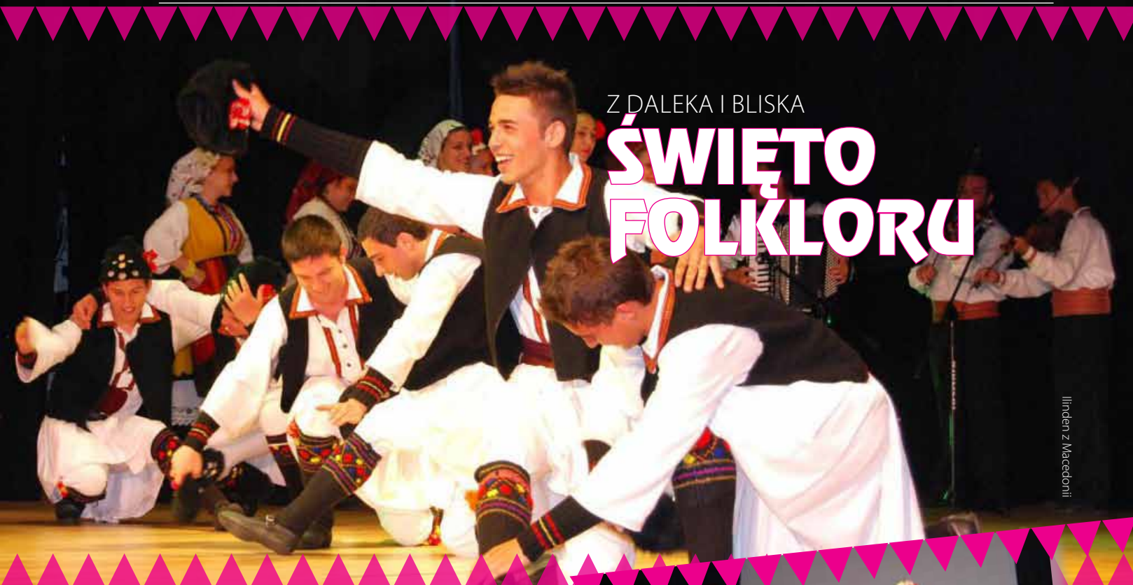
Ilinden z Macedonii

Już po raz piętnasty odbyły się Międzynarodowe Spotkania Folklorystyczne „Z daleka i bliska”. Tegoroczne święto folkloru rozpoczęło się tradycyjnie 4 lipca w Poczesnej Dniem macedońskim. Przez kolejne dni mieszkańcy Kamienicy Polskiej poznawali tradycje ludowe Serbii, w Przyrowie odbył się Dzień bułgarski, a w Jurajskim Grodzie w Piasku zgromadzeni podziwiali występy zespołu z Litwy. Oczywiście, oprócz grup zagranicznych w poszczególnych koncertach uczestniczyły zespoły pieśni i tańca z powiatu częstochowskiego: Przyrowskie Nutki, Janowianie, Kamienica oraz Wrzosowianie z Wrzosowej. Kilkudniowe zmagania artystyczne zakończył barwny korowód na Placu Biegańskiego w Częstochowie i koncert galowy w Klubie Politechnik. Jak podają organizatorzy imprezy, w trakcie wszystkich międzynarodowych spotkań zaprezentowało się na scenach ponad 5 tysięcy wykonawców z Czech, Słowacji, Ukrainy, Litwy, Białorusi, Niemiec, Włoch, Francji, Belgii, krajów bałkańskich, Rosji, a nawet z USA i Kanady.