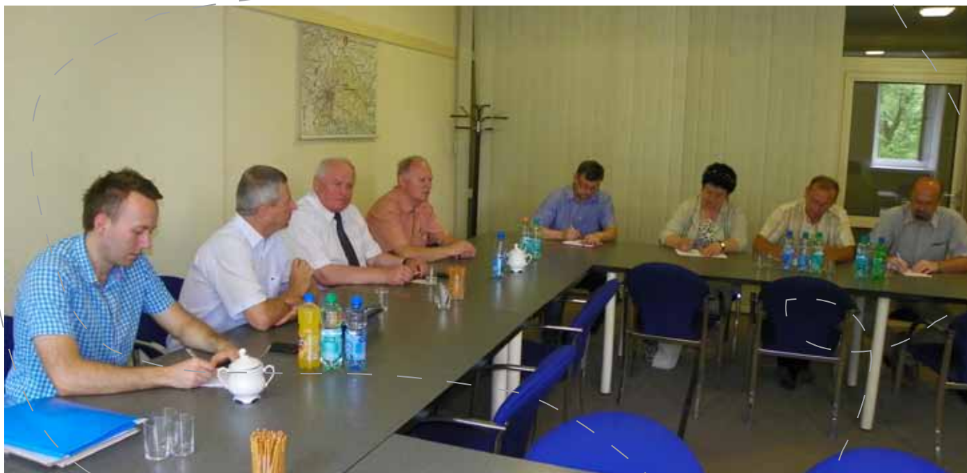
Spotkanie w starostwie

Akademia lotnicza - taką nazwę będzie nosił przygotowywany przez Aeroklub Częstochowski projekt, o którym rozmawiano podczas spotkania zorganizowanego 3 lipca w Starostwie Powiatowym w Częstochowie. Celem projektu skierowanego do młodzieży szkół gimnazjalnych i ponadgimnazjalnych z powiatu częstochowskiego jest popularyzacja lotnictwa i modelarstwa.