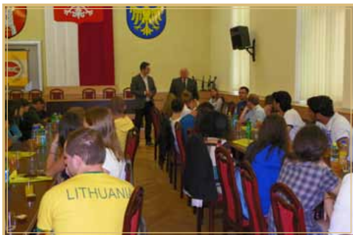
Spotkanie ze starostą w sali sesyjnej