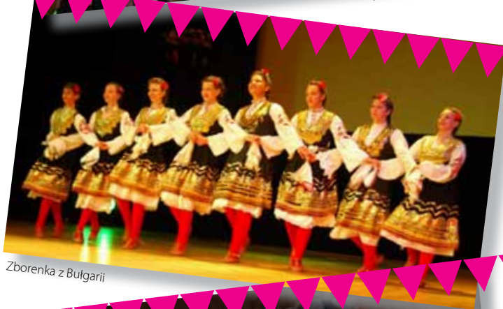
Zborenka z Bułgarii