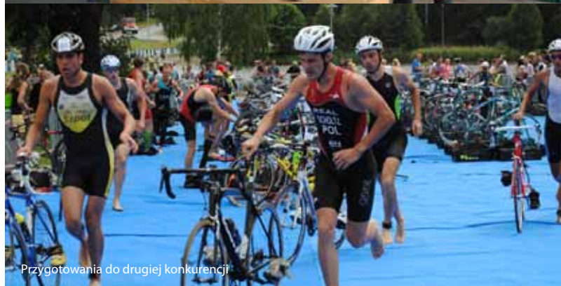
Przygotowania do drugiej konkurencji