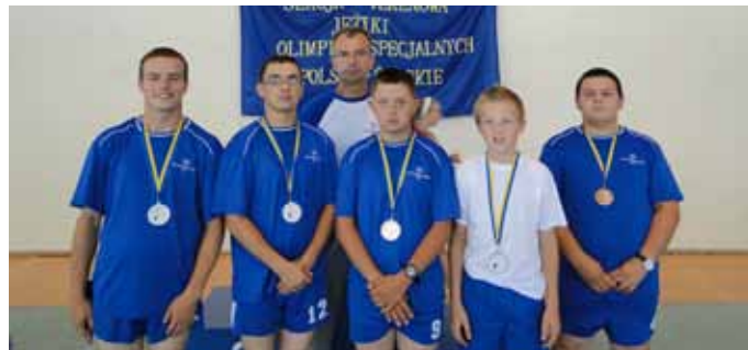
Jeżyki z Bogumiłka