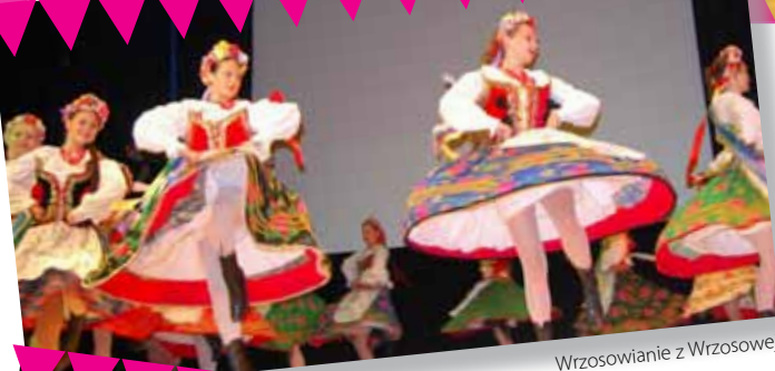
Wrzosowianie z Wrzosowej