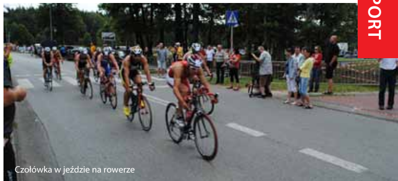
Czołówka w jeździe na rowerze