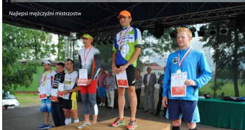
Najlepsi mężczyźni mistrzostw