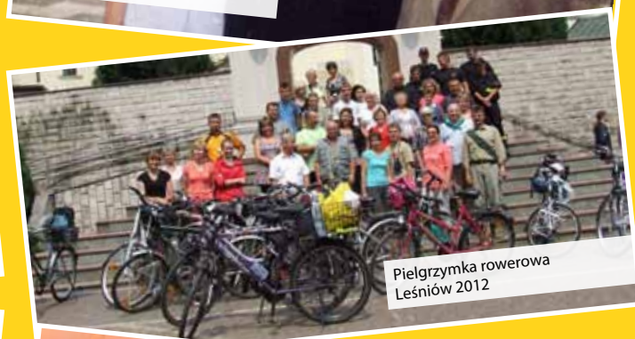
Pielgrzymka rowerowa Leśniów 2012