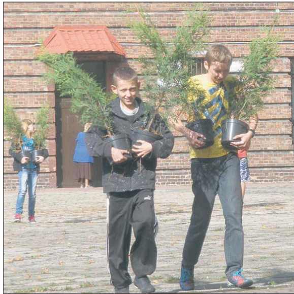
Szkoła kupiła 357 sadzonek – tuje i ligustry

Akcja, w której wzięło udział 115 uczniów trwała dwa dni: 5 i 10 października. Włączyli się do niej rodzice, nauczyciele i pracownicy administracyjno-usługowi szkoły. Dodatkowe koszty prowadzenia akcji pokryła Rada Rodziców naszego gimnazjum. Całemu przedsięwzięciu towarzyszyła typowo jesienna pogoda – temperatura 10 – 15 stopni C, słońce raz po raz wyglądające