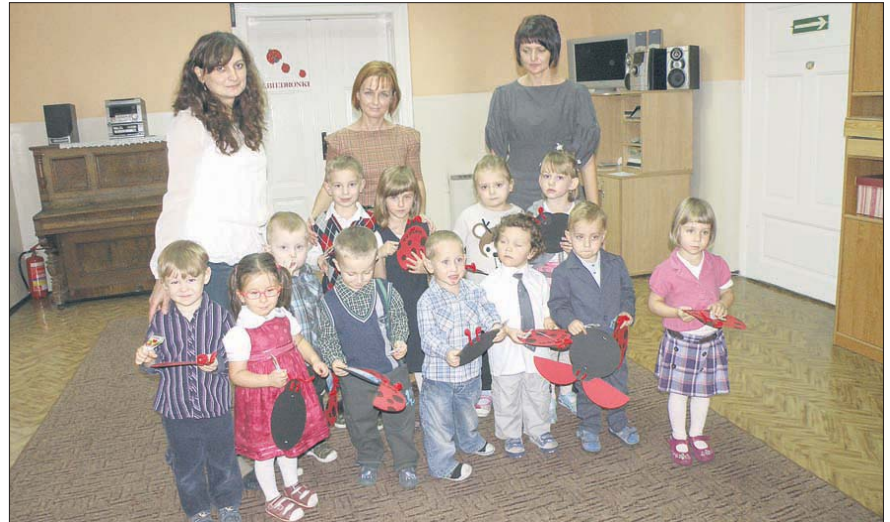
Dzieciaki przed oficjalnym przyjęciem do przedszkolnej społeczności wystąpili przed rodzicami i gronem pedagogicznym

P iętnaścioro nowo przyjętych dzieci do laryskiego Przedszkola nr 2 zostało pasowanych na pełnoprawnych członków tej społeczności przedszkolnej.