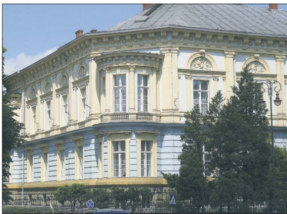
Neorenesansowa willa Fränklów w Prudniku

Nie ma tego złego, co by na dobre nie wyszło. Parcie Napoleona w 1806 r. na wschód skutkowało zajęciem Berlina i ewakuacją władz Prus do Królewca (Kaliningrad). Po powrocie do stolicy Prusacy podjęli próbę reorganizacji administracji, której niewydolność obnażył zwycięski atak Napoleona.