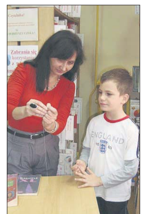
Przedszkolaki poznały urządzenia stosowane przez niepełnosprawnych

Biblioteka co roku włącza się w obchody Międzynarodowego Dnia Białej Łaski, podczas których wspólnie z wychowawcami i dziećmi z Przedszkola nr 4 prowadzi działania na rzecz ludzi z ograniczeniami zdrowotnymi, wierząc, iż wzory zachowań wyniesione z bibliotecznych spotkań staną się w dorosłym życiu standardem i przyczynią się do przełamania stereotypu osoby niepełnosprawnej jako niezaradnej i potrzebującej stałej pomocy. W bieżącym roku z okazji święta Białej Łaski biblioteka przygotowała zajęcia, podczas których przedszkolaki poznały urządzenia stosowane przez niepełnosprawnych, formy czytelnicze tych osób oraz do-