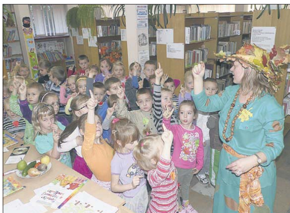
Spotkanie z przedszkolakami poświęcone było obecnie trwającej porze roku

Spotkanie z przedszkolakami poświęcone obecnie trwa-