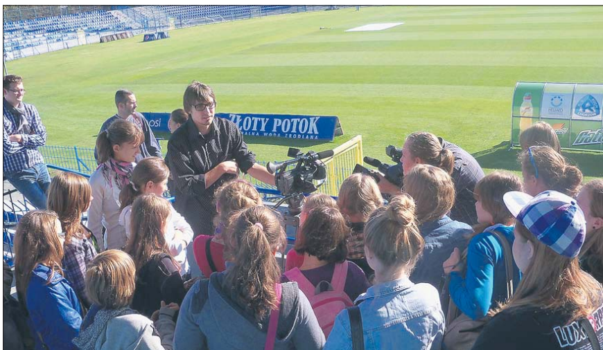
Młodzież dowiedziała się m.in jak wygląda przygotowanie do transmisji telewizyjnej

Młodzi adepci pióra pod okiem doświadczonych redaktorów „Dziennika Zachodniego” zgłębiali tajniki dziennikarstwa sportowego podzieleni na grupy: prasową, fotograficzną oraz internetowo-telewizyjną. Wraz