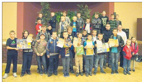
W turnieju zmierzyło się 29 młodych szachistów

Organizatorem imprezy był Gminny Ośrodek Sportu i Rekre-