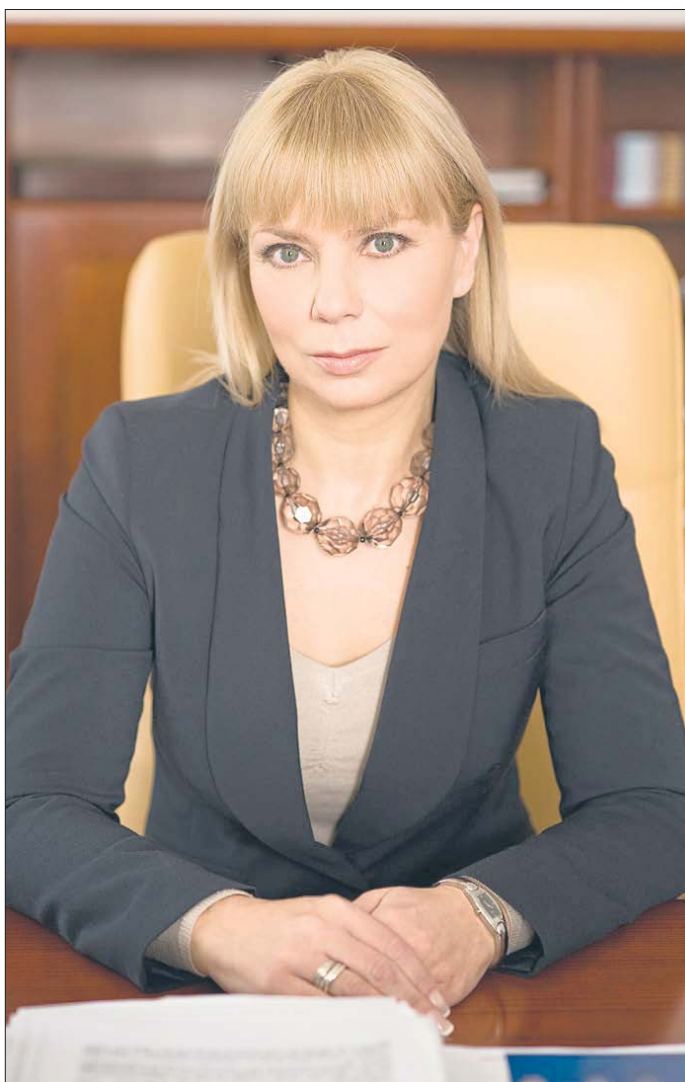
Minister rozwoju regionalnego Elżbieta Bienkowska

Silniejsze wsparcie dla miast, to temat, który wyczuwaliśmy już wcześniej w rozmowach z ministrami z innych krajów UE i komisarzami z Brukseli. Ten pomysł rozdzieli się w UE już od jakiegoś czasu.