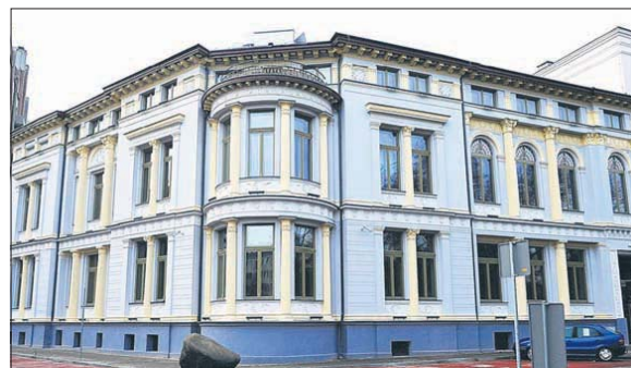
Willa Goldsteinów przy pl. Wolności w Katowicach

W okresie międzywojennym na parterze kamienicy otwarto