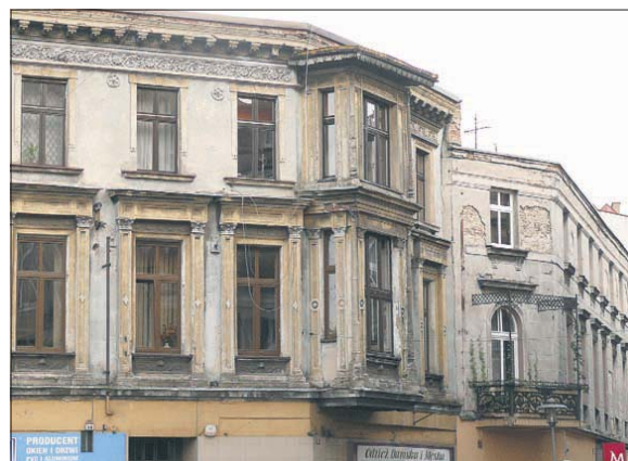
Kamienica przy ul. Rynek 17 w Mysłowicach