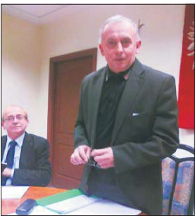
Tuż przed poniedziałkową komisją radni otrzymali materiały dotyczące śmieci

Od poniedziałku radni Imielina mają pierwsze projekty uchwał, dotyczących uregulowań gospodarki odpadami w mieście. Choć nie ma jeszcze propozycji wysokości opłat za ich zbiórkę, to pozostałe elementy odbioru odpadów są już znane.