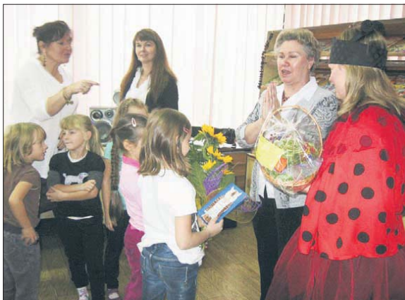
Dzieci zainspirowane opowiadaniem Ewy Musiorskiej stworzyły prace plastyczne, które podarowały pisarce na spotkaniu autorskim

16 października w bibliotece przy ul. Mikołowskiej odbyło się spotkanie z jaworznicką poetką i autorką opowiadań dla dzieci Ewą Musiorską, w którym uczestniczyły dzieci z Przedszkola nr 12 oraz uczniowie klas I ze Szkoły Podstawowej nr 9.