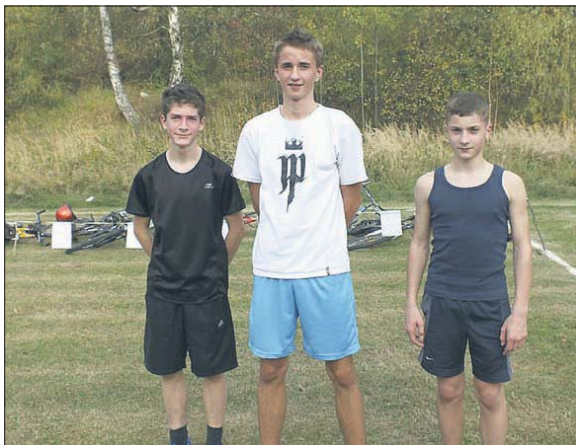
Zwycięzcy biegowo-rowerowych mistrzostw

12 października uczestnikom Pierwszych Mistrzostw Gimnazjum nr 4 w Crossduathlonie zostały wręczone cenne nagrody. Mistrzostwa odbyły się 4 października na stadionie KS Stal Brzezinka przy ulicy Leśnej.