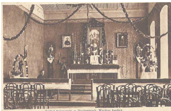
Wnętrze kaplicy Zakładu Salezjańskiego w Mysłowicach z ok. 1934 r. Pocztówka wydana nakładem Zakładu.

W myśl reguły zakonu, myślowicka placówka była instytucją przeznaczoną dla uboższej młodzieży. Nauczano w niej wiedzy teoretycznej i praktycznej nauki rzemiosła. Na ten cel świetnie nadawały się hale dawnej fabryki, które przystosowano na warsztaty i pracownie. Pierwszym dyrektorem był ksiądz Masłowski, do pomocy miał 6 ojców, 3 braci i 3 kleryków. Salezianie prowadzili ożywioną działalność: urządzano jasełka, nabożeństwa w kaplicy, funkcjonował chór, zespół instrumentalistów, kółko teatralne, dbano o wychowanie fizyczne. W jed-