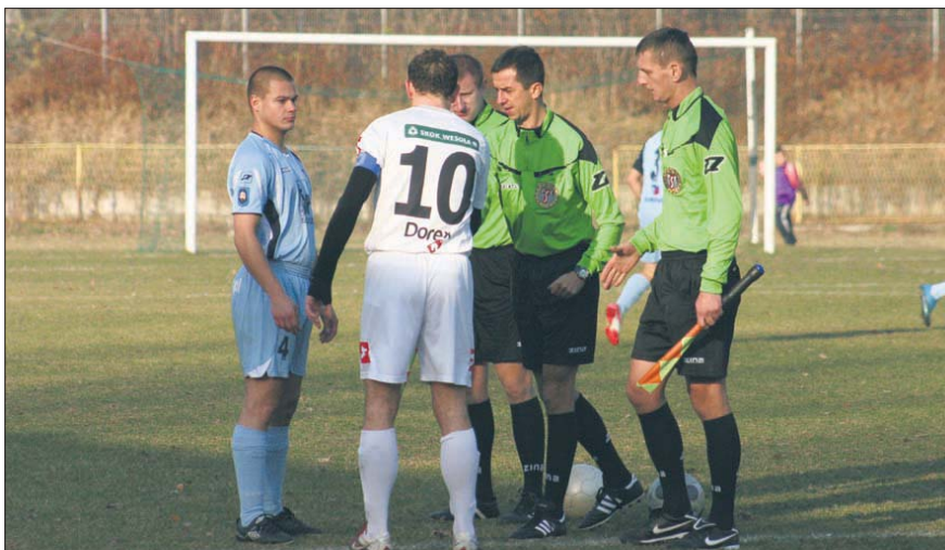
Wesola potwierdza prymat w Mysłowicach