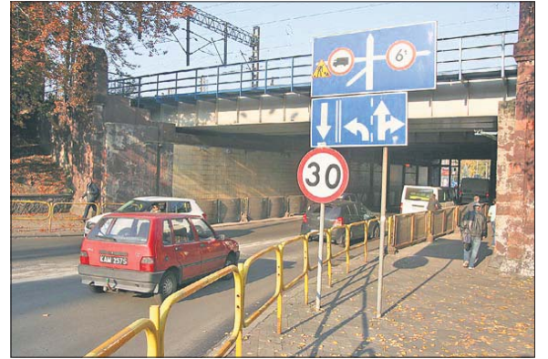
Właściciel wiaduktu nie zamierza go remontować w najbliższym czasie

Jak informuje rzecznik magistratu Kamila Szal, właściciel obiektu – PKP Zakład Linii Kolejowych – w najbliższym czasie nie planuje remontu wiaduktu, dlatego ograniczenie zostało wprowadzone bezterminowo. – Ograniczenie wprowadzono