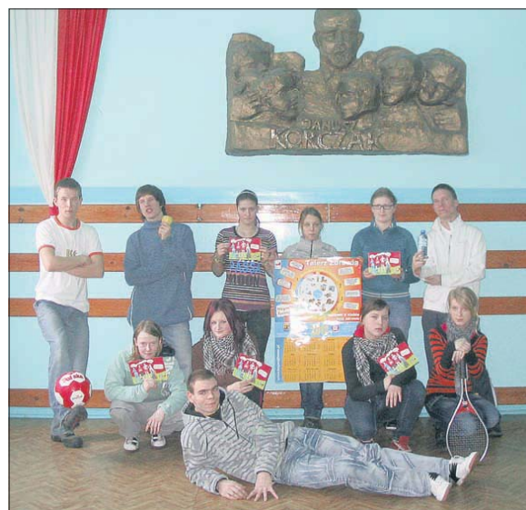
Zespół Szkół Specjalnych im. Janusza Korczaka w Mysłowicach 26 października obchodzi święto swojego patrona

W tym dniu nauczyciele będą przepytywać i oceniać uczniów