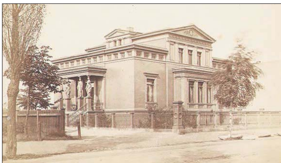
Willa Grundmanna w Katowicach

Głównym architektem zmian był Heinrich Friedrich Karl von Stein, minister stanu (odpowiednik wiceszefa rządu). Stein powołał dwa równorzędne organy samorządowe Zgromadzenie Radnych Miejskich i Kolegium Magistratu. Władze miasta (Kolegium Magistratu) odpowiadały przed Zgromadzeniem Radnych, które kontrolowało wydatki publiczne. Na Śląsku wprowadzono reformę administracyjną z lekkim poślizgiem w 1816 r. Na jej mocy mianowano Opole stolicą rejencji. Mysłowice weszły w skład powiatu bytomskiego. Nowy podział administracyjny, i co za tym idzie stworzenie podstaw samodzielności całej prowincji śląskiej, a także miast i gmin korzystnie wpłynęły na ruch budowlany i wzbogacenie tkanki urbanistycznej o monumentalne gmachy ratuszy, sądów, szkół i szpitali.