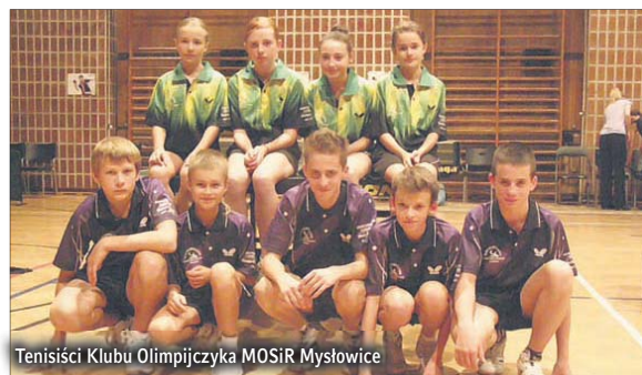
Tenisисти Klubu Olimpijczyka MOSiR Mysłowice