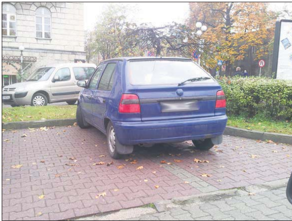
Podwójne parkowanie choć naganne, to nie jest karalne

Tam, gdzie trudno o miejsca parkingowe takie zachowania irytują szczególnie. Z kierowcą, który zajął dwa miejsca parkingowe nasz czytelnik zetknął się we wtorek przed Urzędem Miasta.