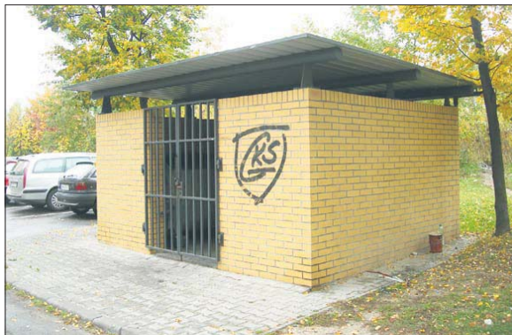
Przy Wielkiej Skotnicy 34 zamiast zsympu jest śmietnik na zewnątrz budynku