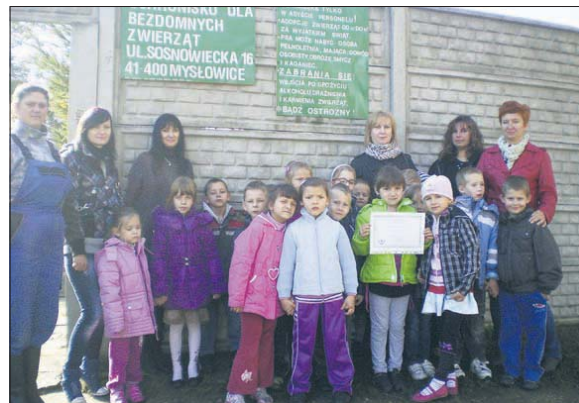
Na zakończenie akcji przedszkolaki wybrały się do schroniska i przekazały zebrane dary