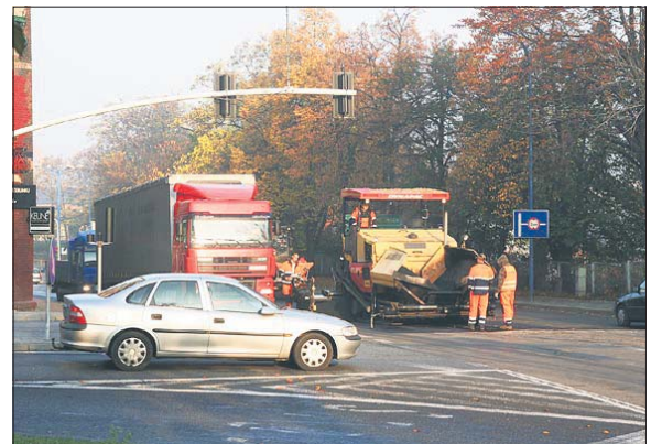
as W poniedziałek rano skrzyżowanie było zakorkowane

Roboty obejmują wymianę nawierzchni na odcinku od skrzyżowania z ul. Krakowską do skrzyżowania z Mikołowską. W niedzielę drogowcy sfrzowali asfalt, w poniedziałek rano położyli asfalt na dwóch pasach.