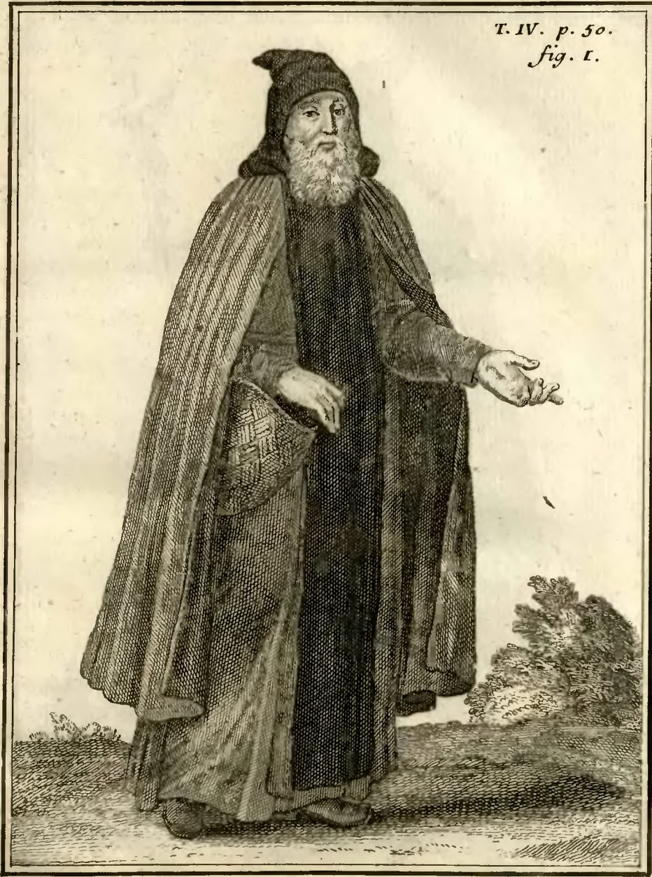
Religieux de l'ordre des pauvres Volontaires, en Allemagne.