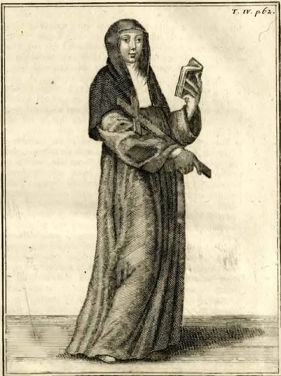
Religieuse de l'ordre de S. Ambroise, et de S. te Marceline.