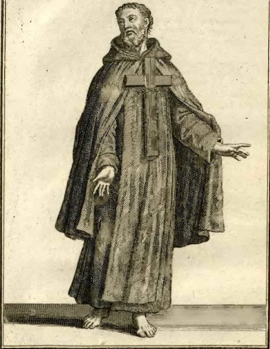
Ermite de S. t Jean Baptiste de la Penitence.