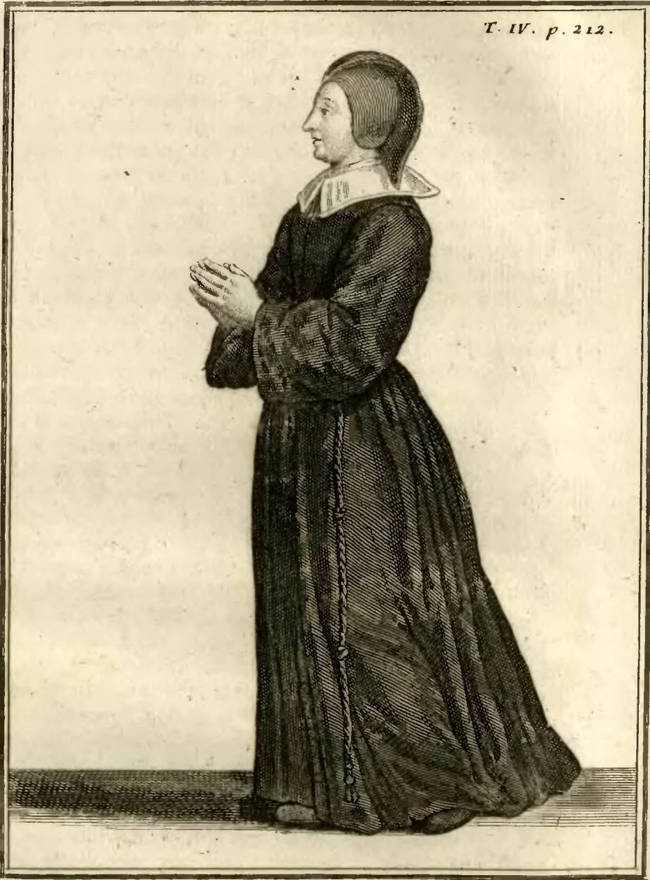
Ursuline du Comté de Bourgogne.