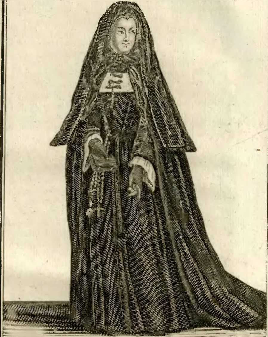
Ancien habillement des Dames Religieuses de la Royale Maison de S. t Louis a S. t Cyr au Chœur les Dimanches et les fêtes et dans les Cérémonies avant l'an 1760