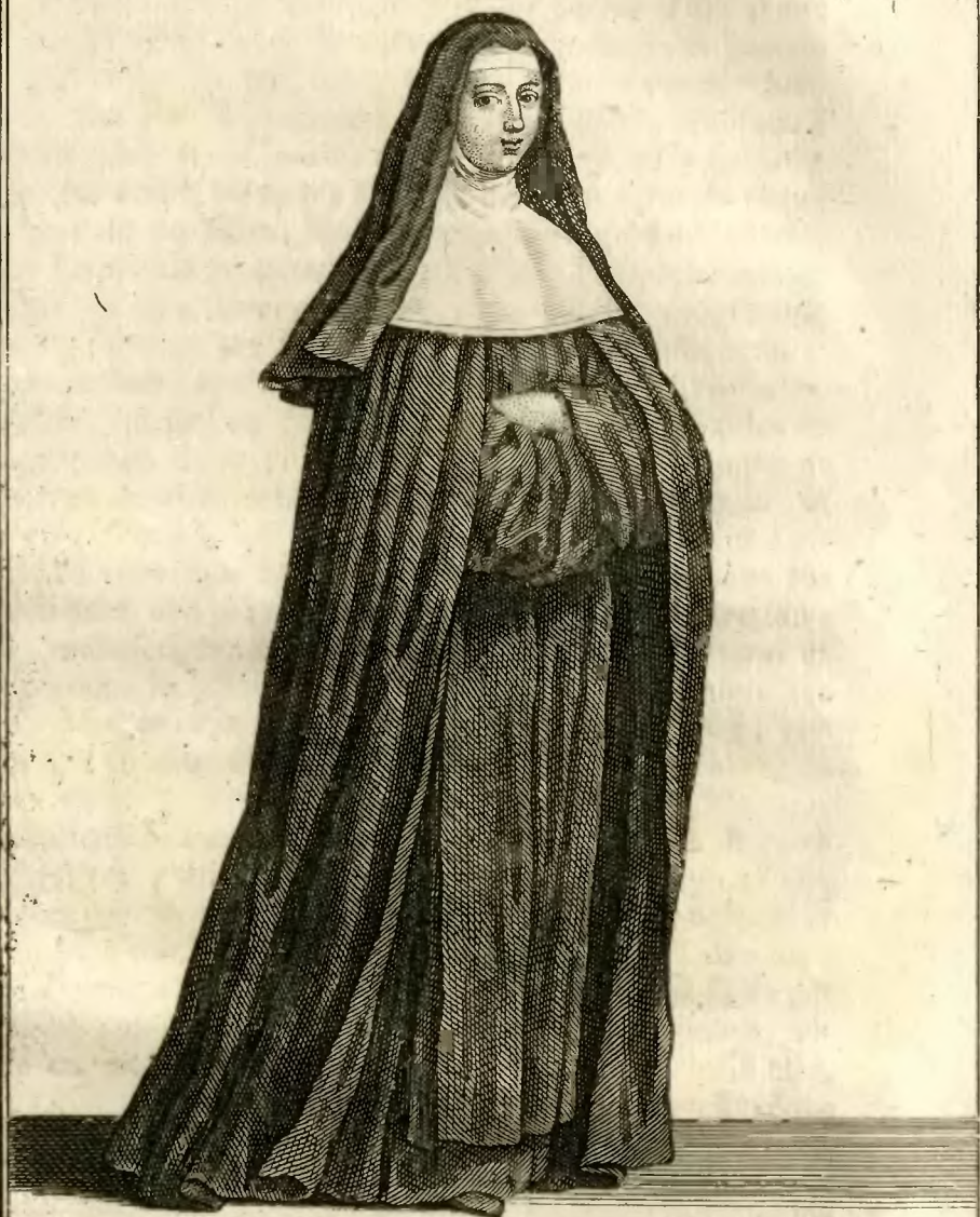
Religieuse de la Congregation de S. t Joseph, 95. dite de la Trinité Créée, en habit de Chœur.