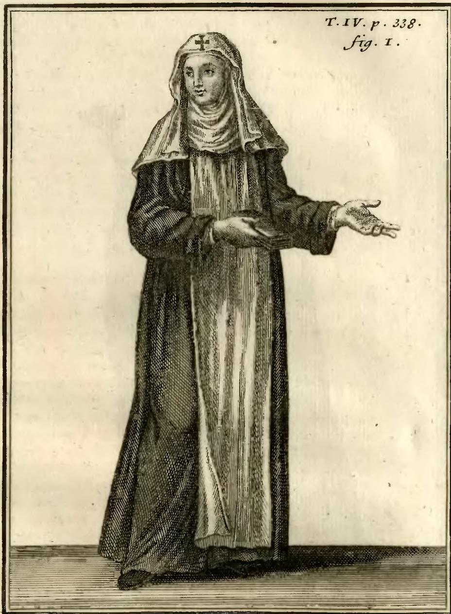
Religieuse de l'ordre de la Presentation de N.D. c en Italie.