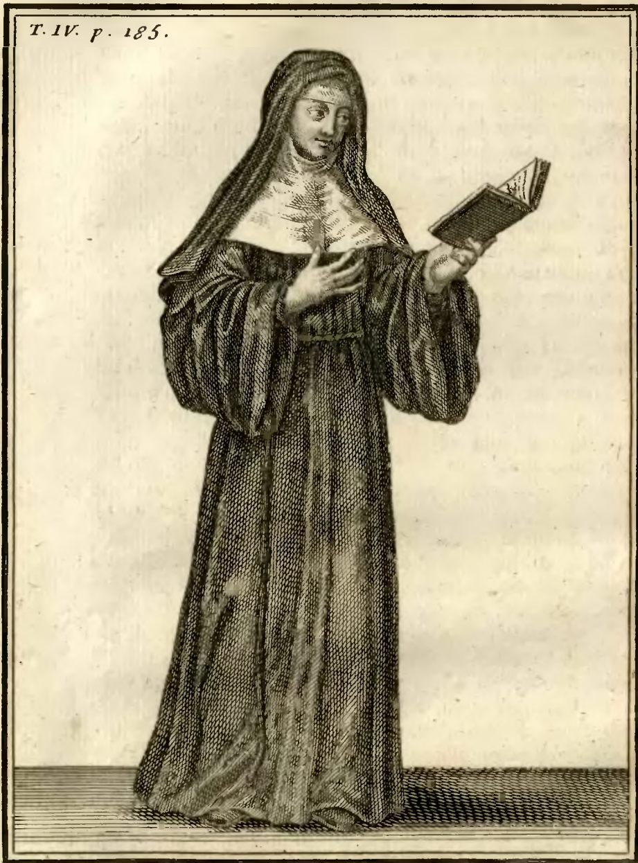
Ursuline de la Congregation de Lion.