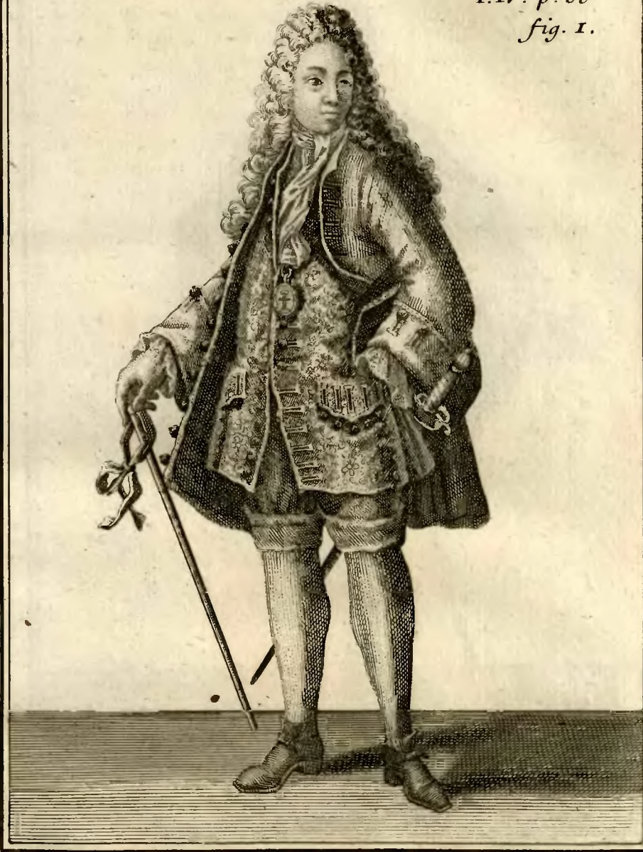
Chevalier Couronné de l'ordre de S. Georges, en Allemagne.