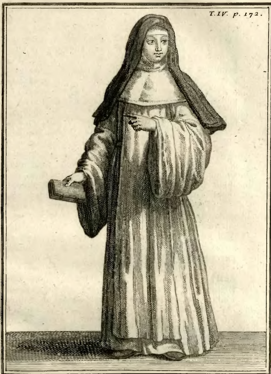
40. Ursuline de la Congrégation de Toulouse en habit ordinaire les jours ouvriers. Boilly scul. f.