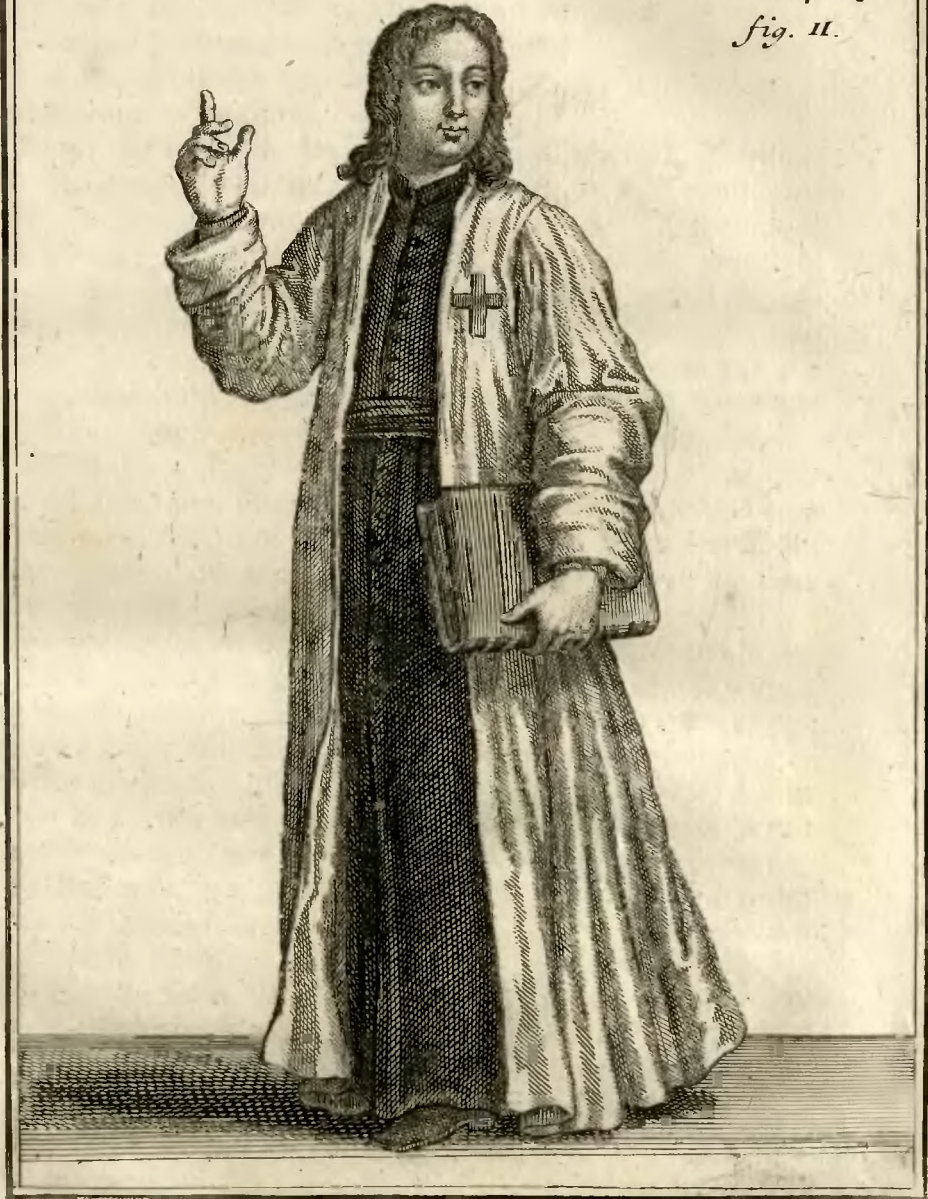
20. Chevalier de l'ordre de S. Georges dans la Carinthie, en habit d'Eglise.