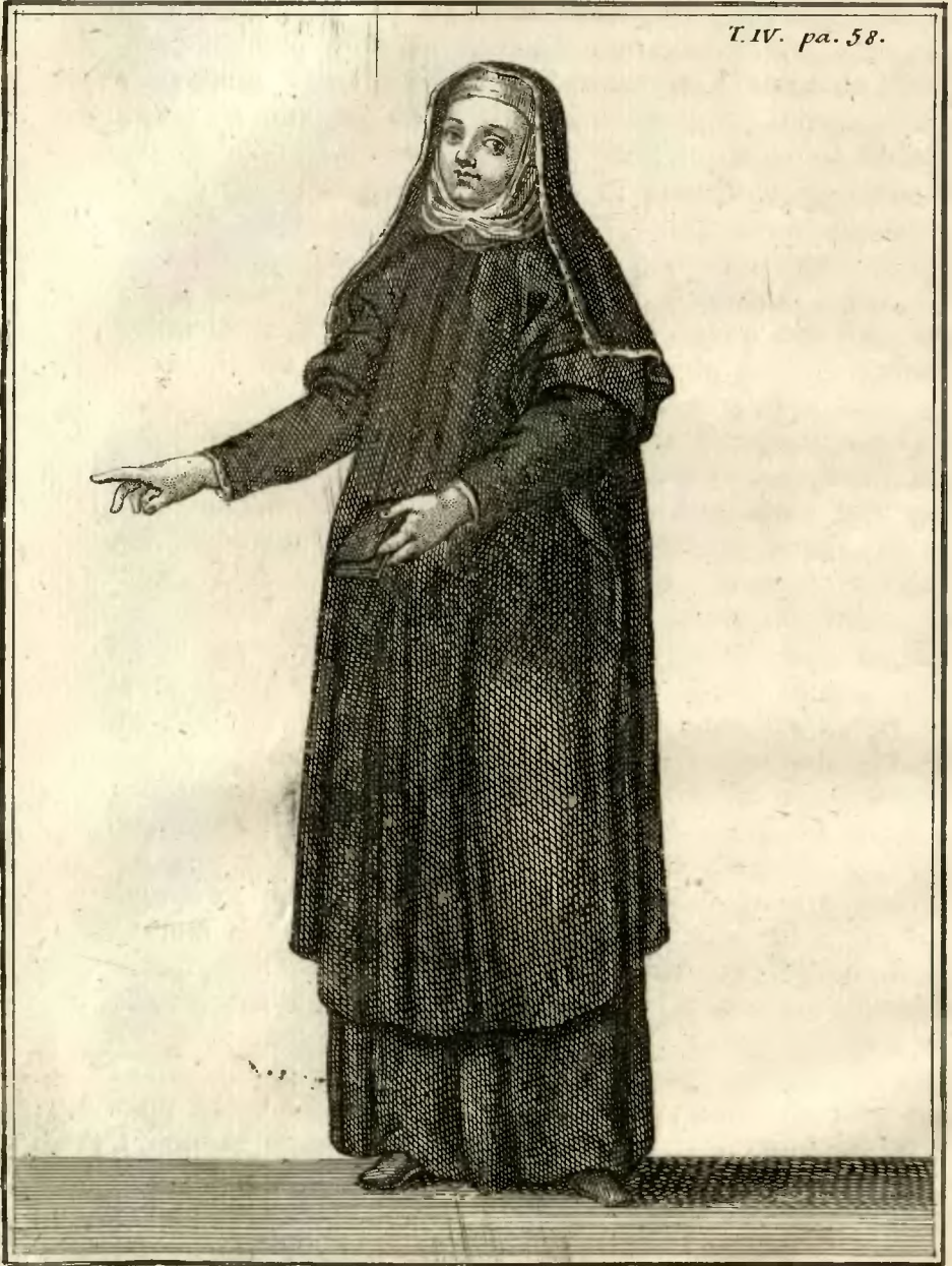
17. Religieuse de l'ordre de S. Ambroise, ad nemus.