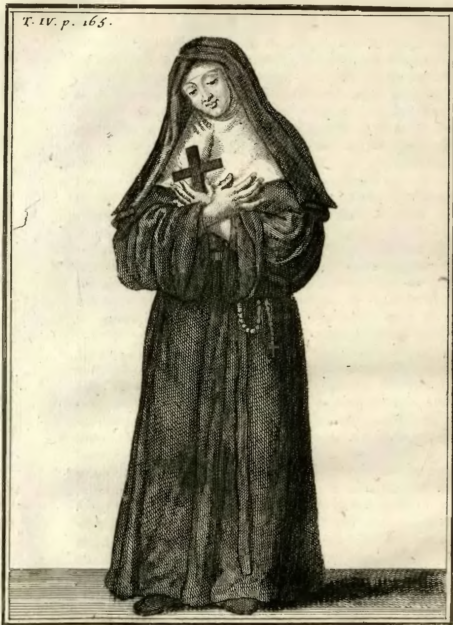
Ursuline de la Congregation de Paris.