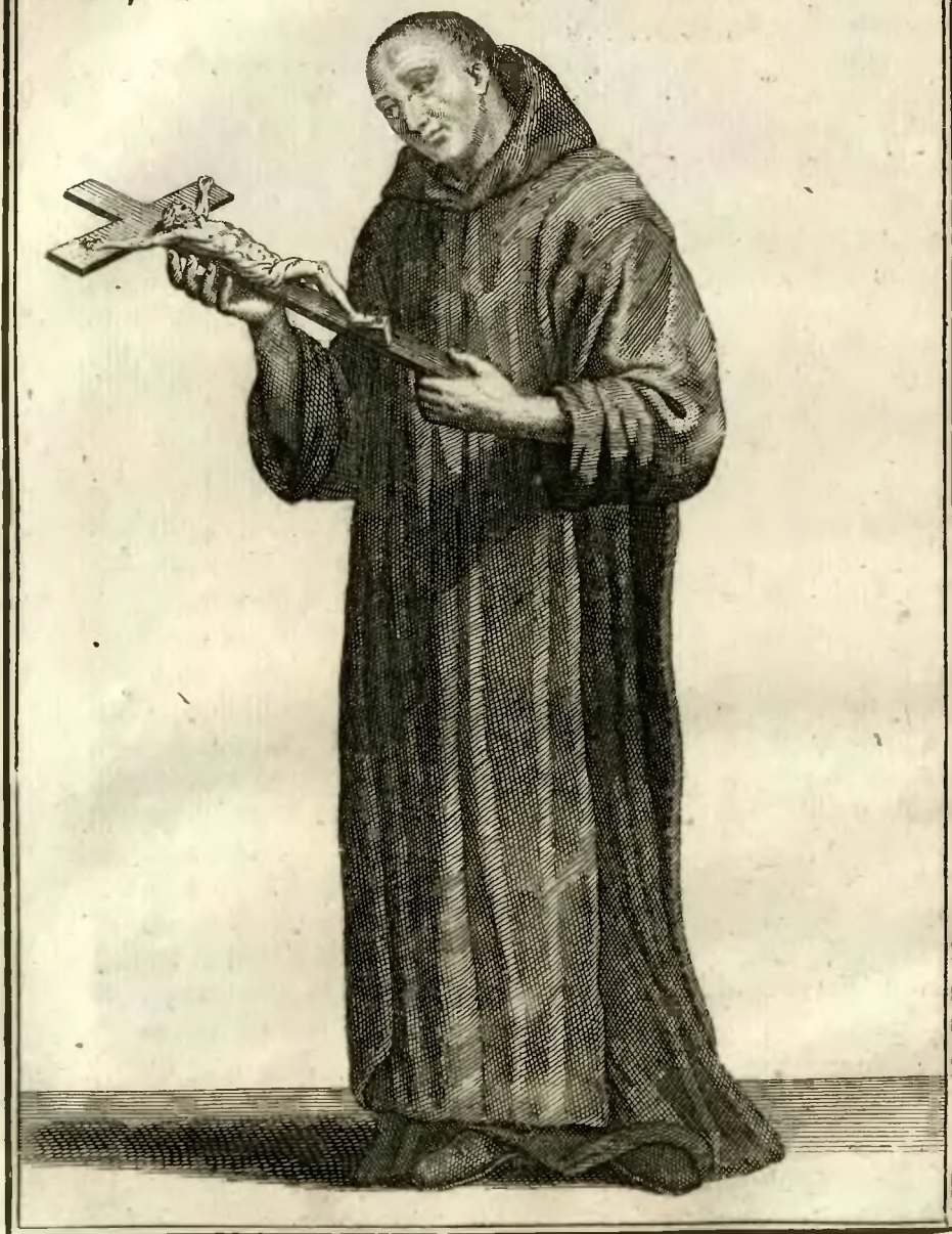
Religieux Hospitalier, de l'ordre de S. t Jean de Dieu.