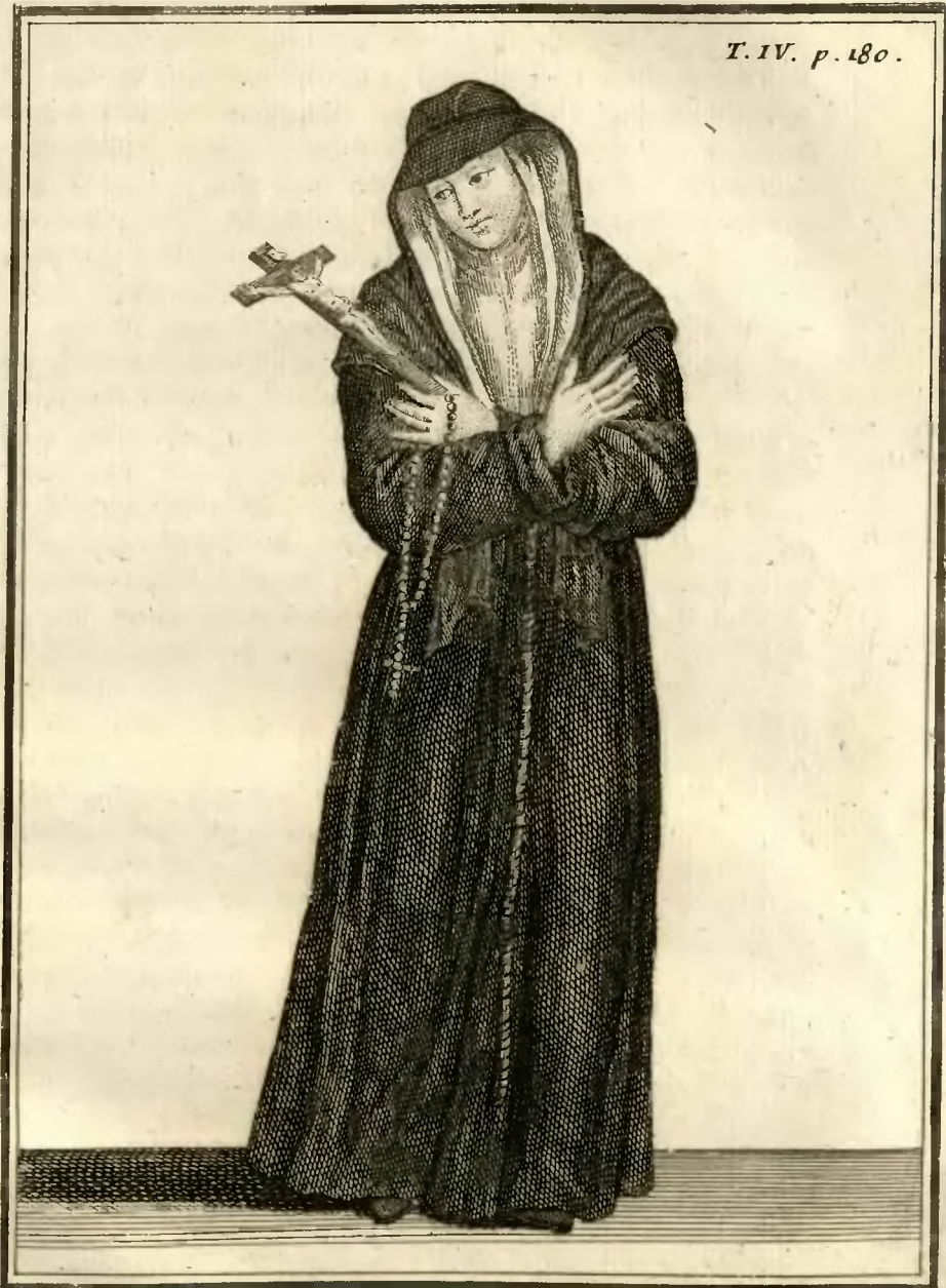
Ancien habillement des Religieuses Ursulines, de la Congregation de Bordeaux.