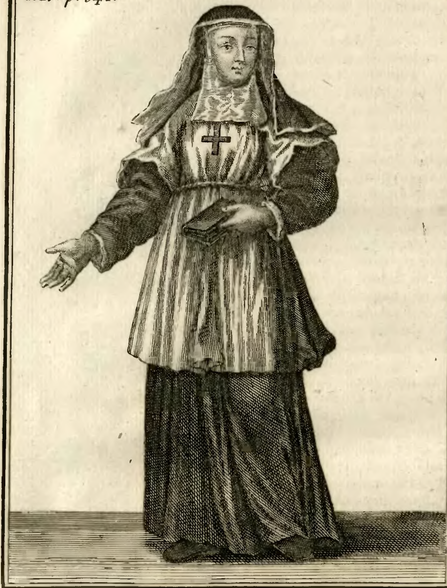
Religieuse Philippine, à Rome.