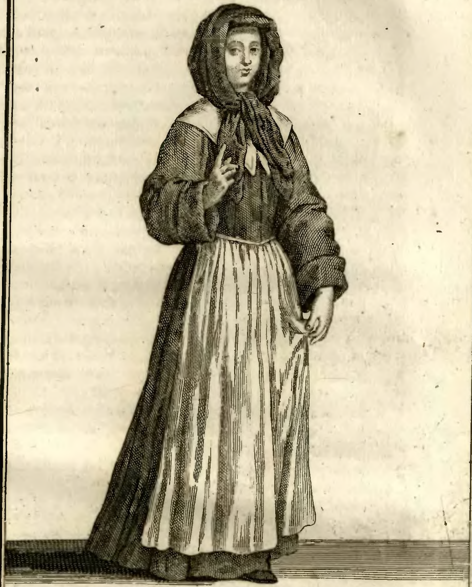
Ancien habillement des Religieuses Hospitalières. de S. t Joseph.