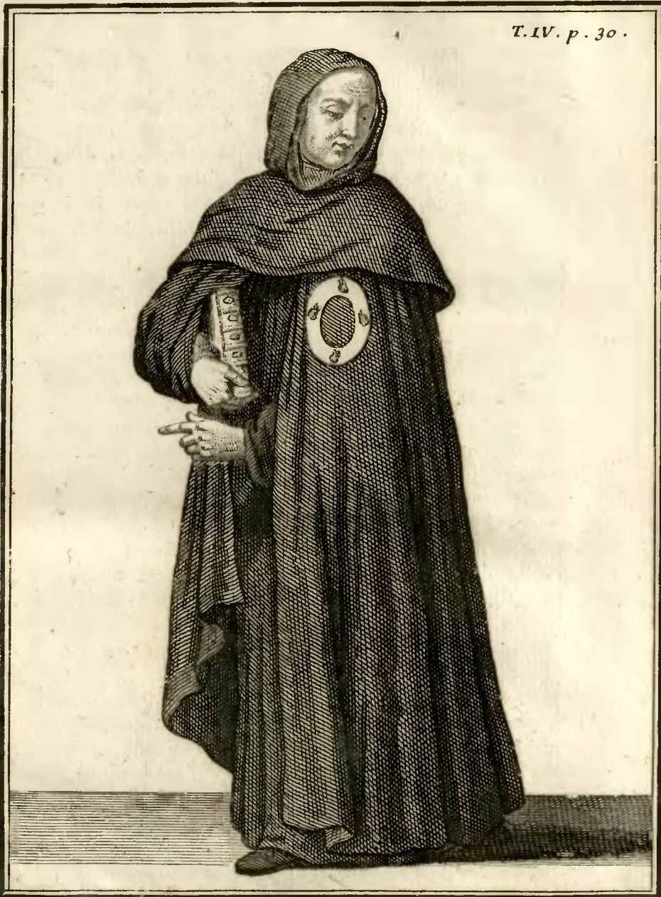
Rèligieux Diaacre de l'ordre de s. te Birgitte.