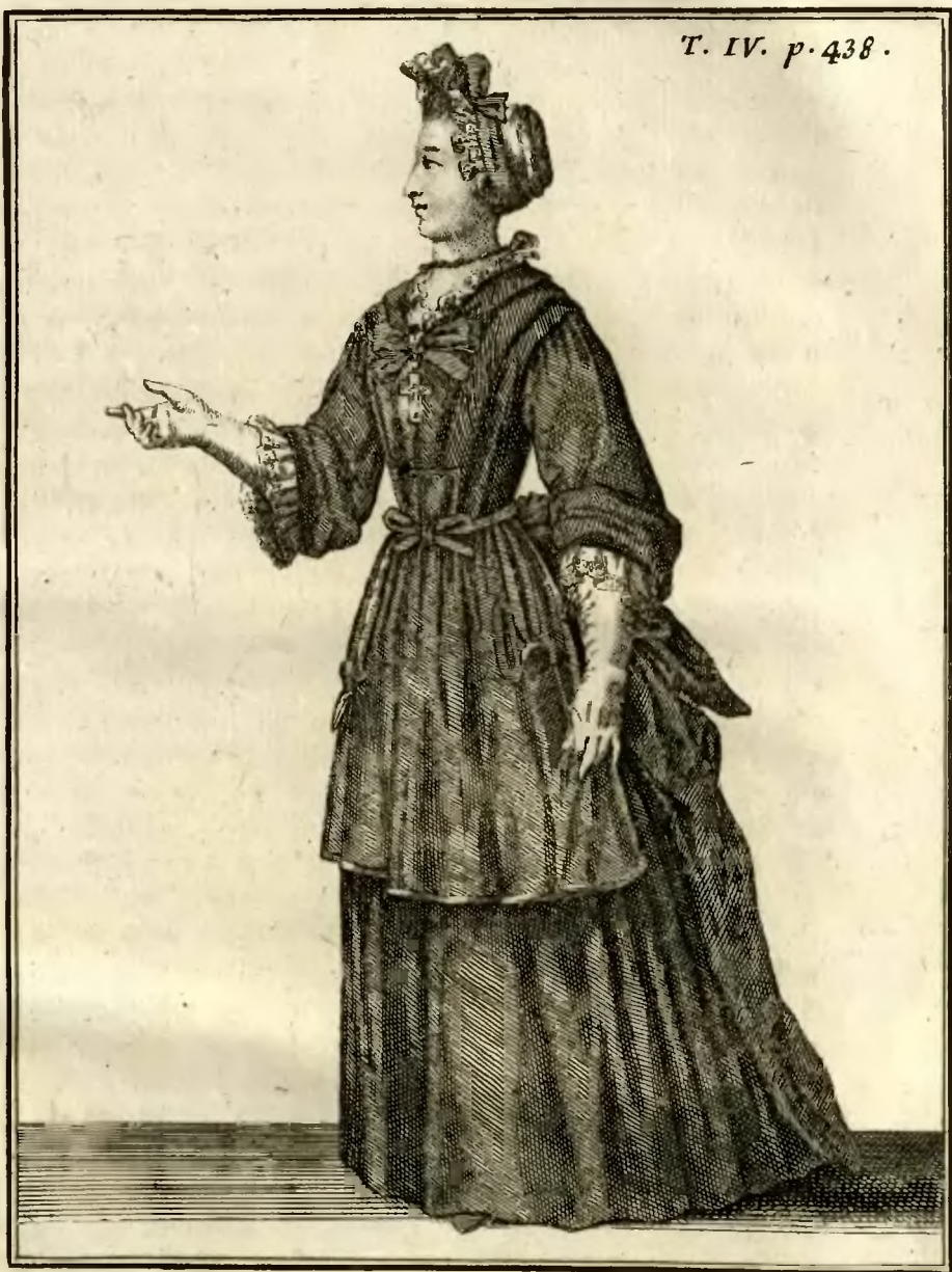
Demoiselle de la Royale Maison de S t Louis à S t Cir, des deux premieres Classes, qui porte la Croix que l'on donne aux Chefs de chaque bande ou famille.