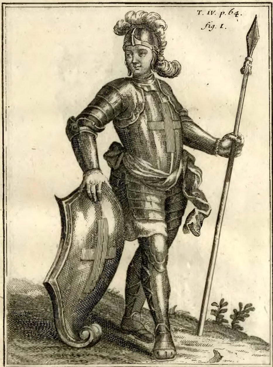
19. Chevalier de l'ordre de S. Georges, dans la Carinthie. D'Alty, de Jean. F.