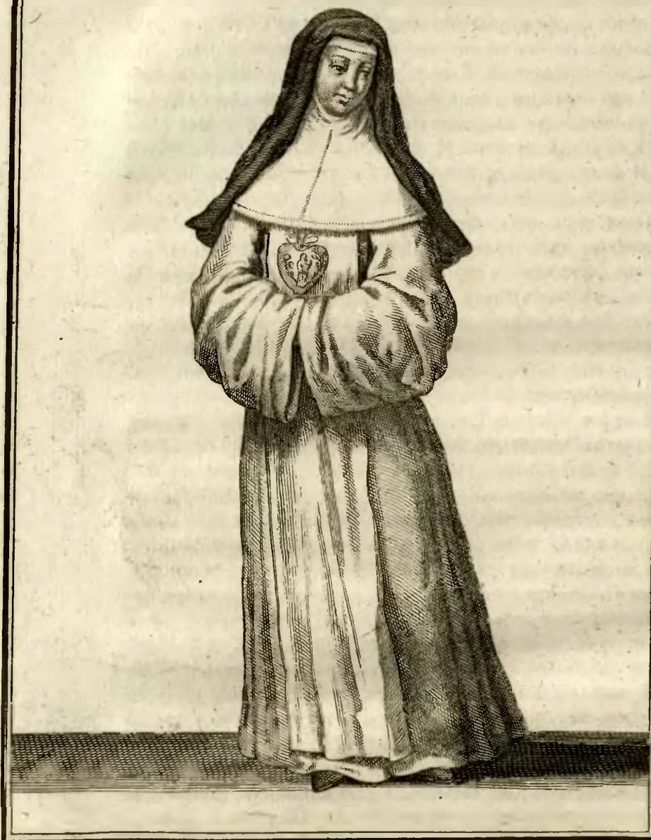
Religieuse de l'ordre de N. e Dame de Charité en habit ordinaire.