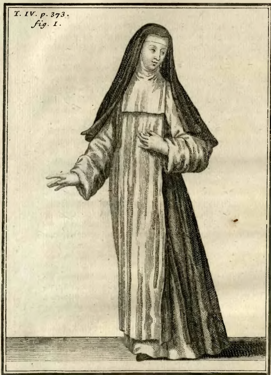
Religieuse hospitalière de Loches, en habit ordinaire les jours ouvriers.