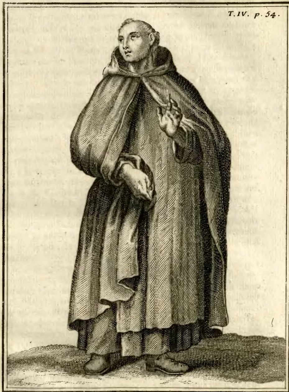
Religieux de l'ordre des Apostolins.