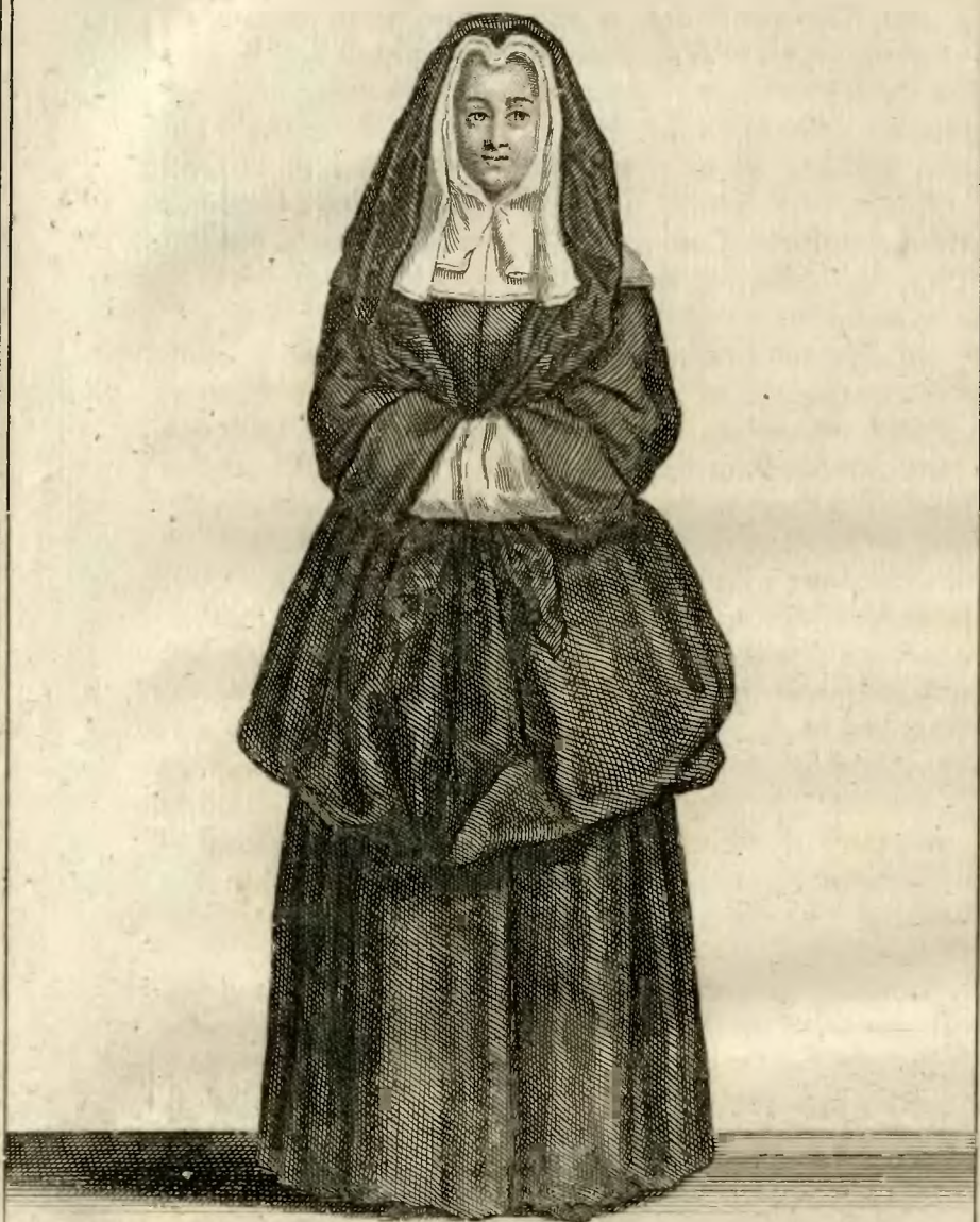
Soeur de la Congregation de S. t Joseph, 92 pour le gouvernement des filles Orphelines, à Bordeaux. Duflos f.