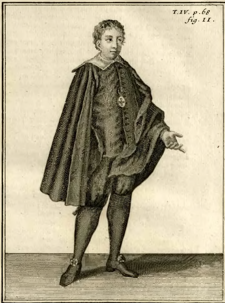
Chevalier supposé de l'ordre de S. Georges, à Gennes.