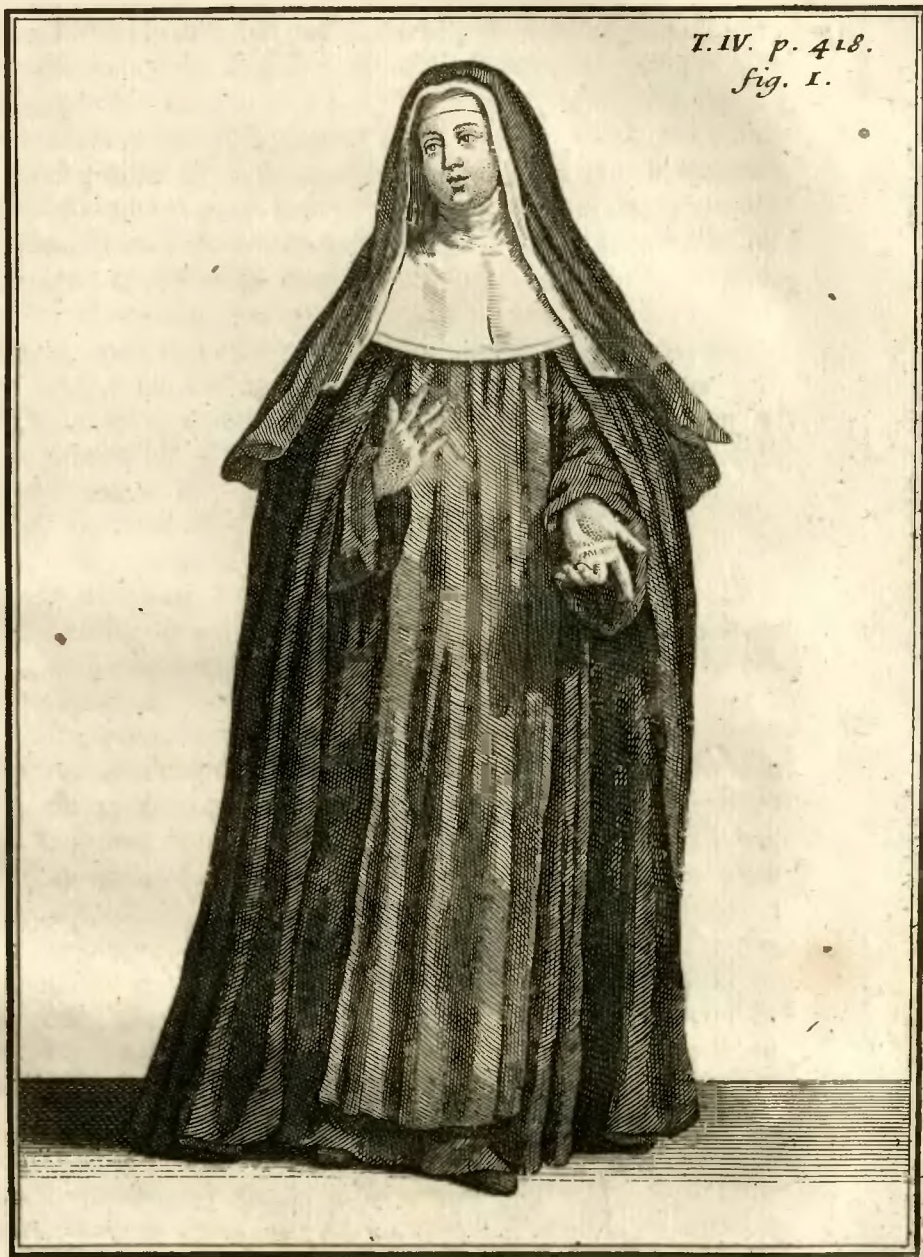
Ancien habillement des Religieuses de la Congregation de S. t Joseph, dites de la Trinite' Creée .