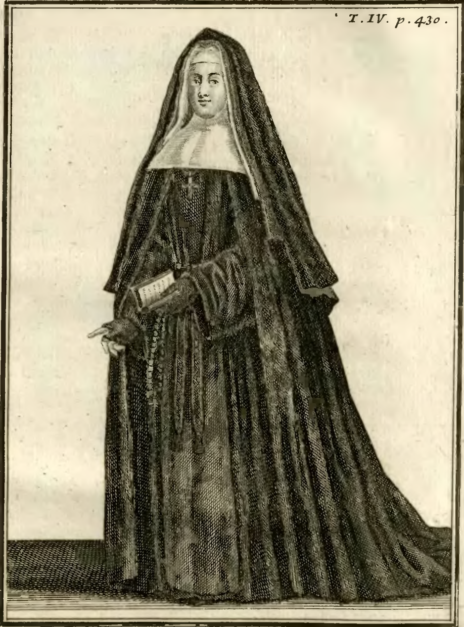
Dame Religieuse de la Royale Maison de S. t Louis à S. t Cir, en habit de Chœur les Dimanches et les Fêtes, et dans les Cérémonies, depuis l'an 1707.