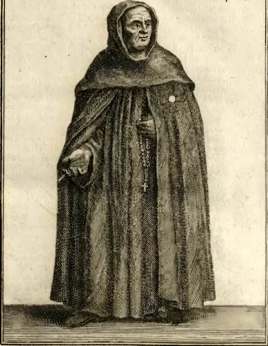
Religieux Prestre de l'Ordre de S. te Birgitte.