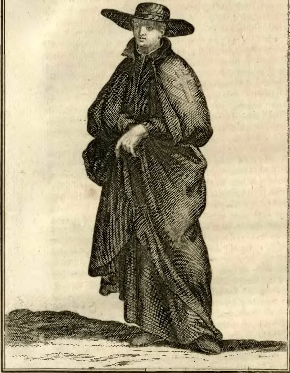
Clerc Régulier, Ministre des Infirmes.