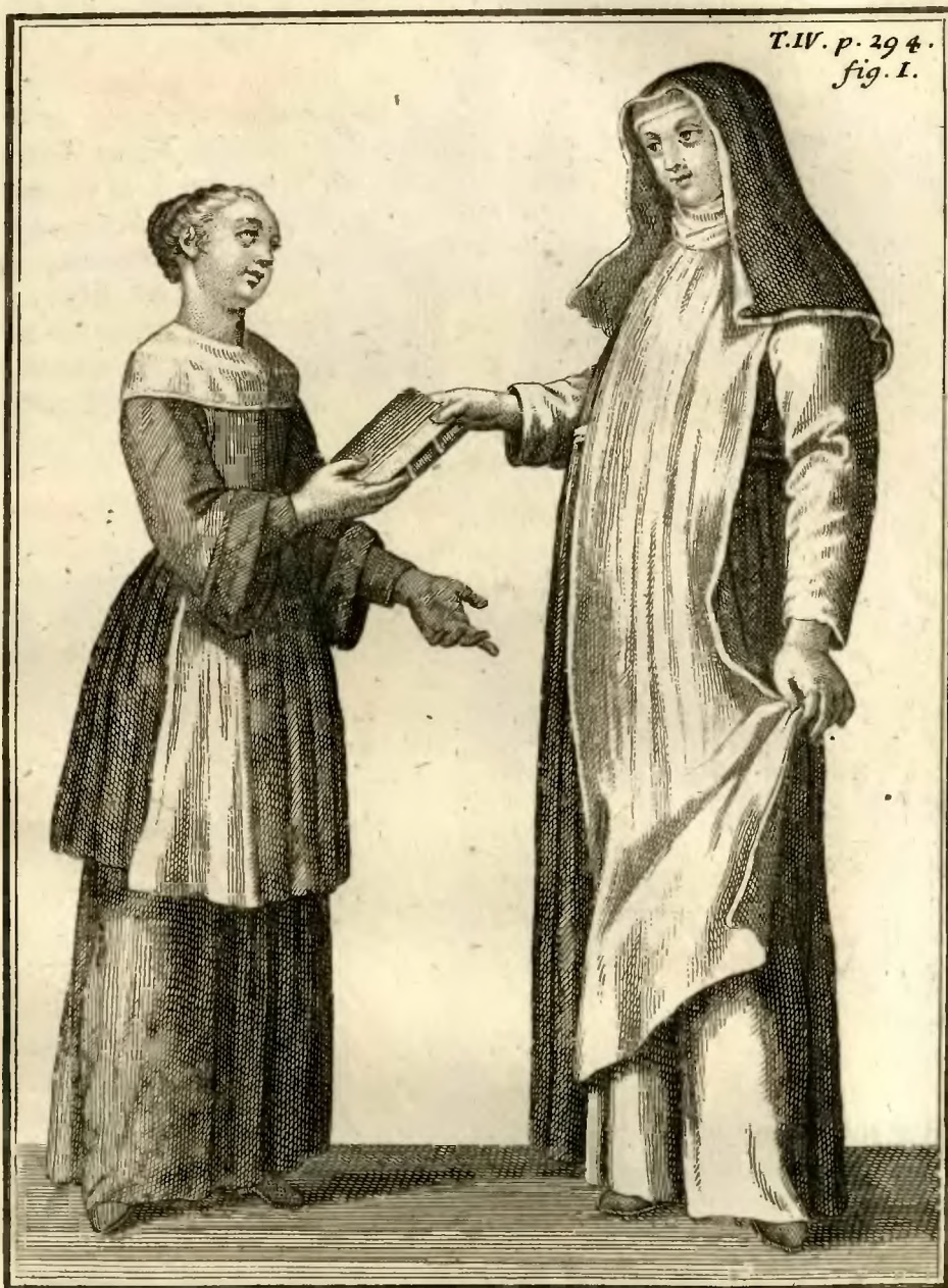
Religieuse Augustine de S. te Catherine des Cordiers, à Rome.