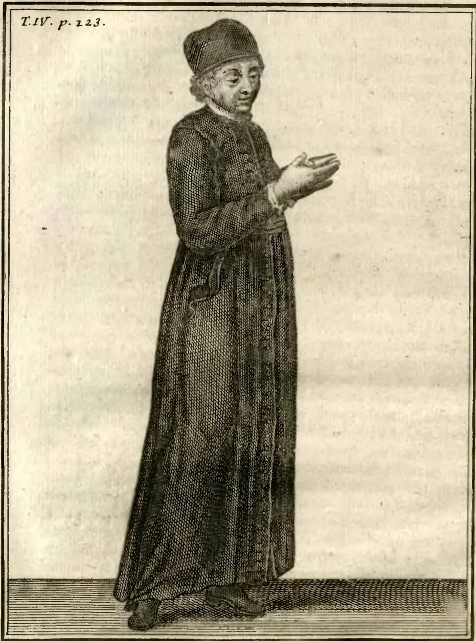
Clerc Regulier du Bon Jesus.