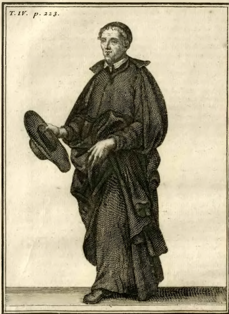
Clerc Régulier Somasque.