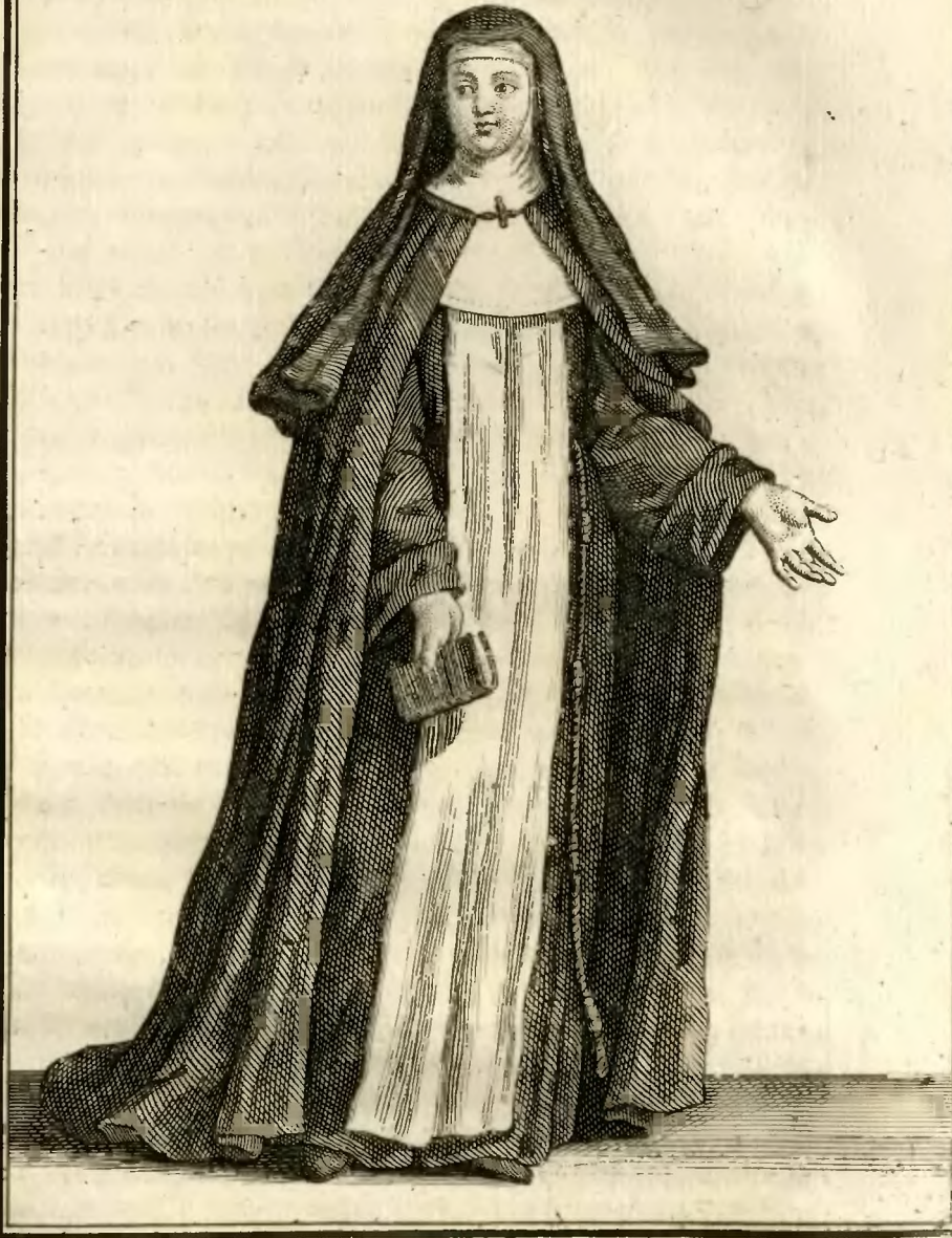
Religieuse Hospitalière de l'ordre de la Charité de Nôtre Dame, en habit de Cérémonies.