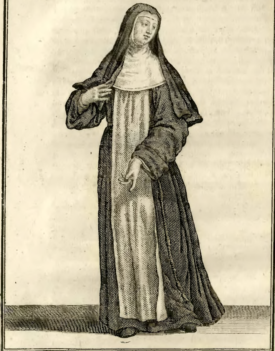
Religieuse Hospitaliere de l'Ordre de la Charité de Nôtre Dame.