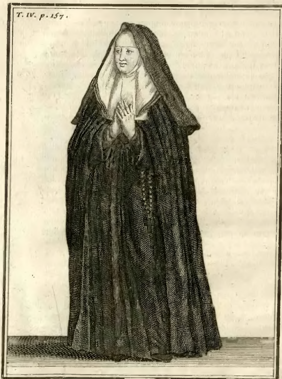
Ancien habillement des Religieuses Ursulines, de la Congregation de Paris.