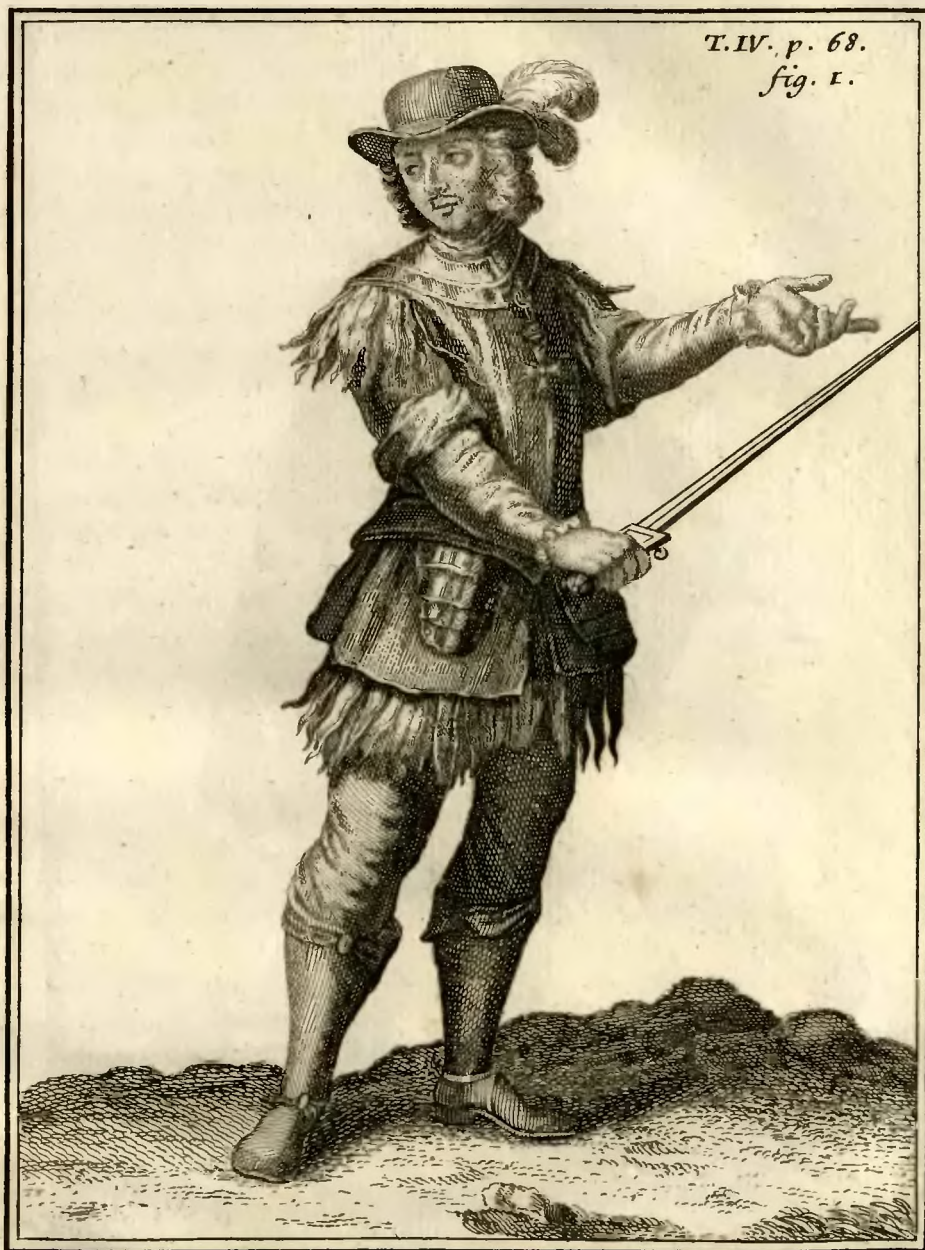
Chevalier de l'ordre de S. Georges, à Rauennes.