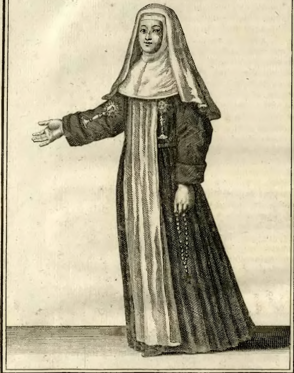
Religieuse de l'adoration perpétuelle du S. Sacrement 98. à Marseille, en habit ordinaire .