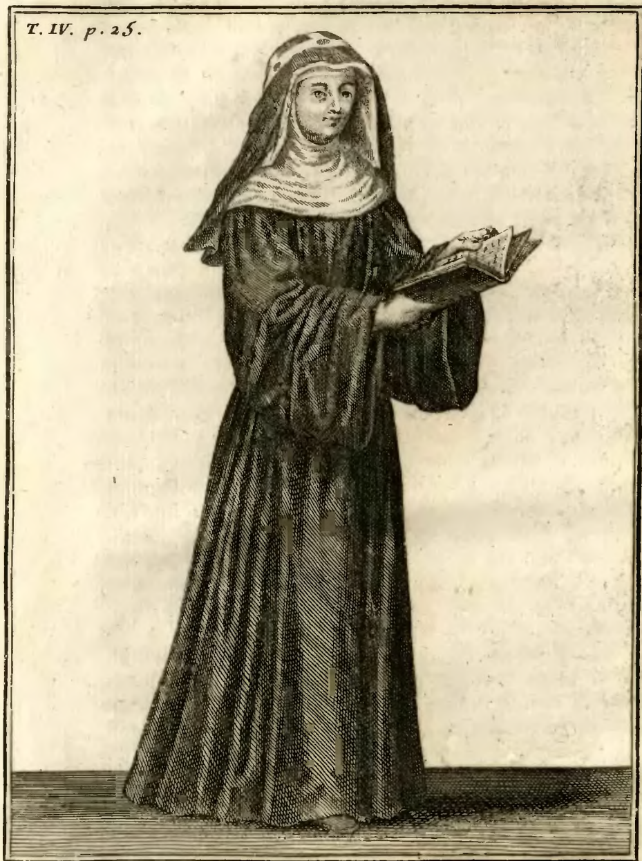
Religieuse de l'Ordre de S te Birgitte en habit ordinaire.