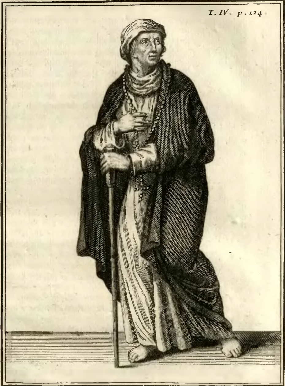
Sœur de la Société du Bon Jésus.