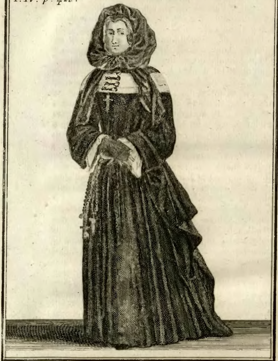
Ancien habillement des Dames Religieuses de la Royale Maisn de S. t Louis à S. t Cir, avant l'an 1707.