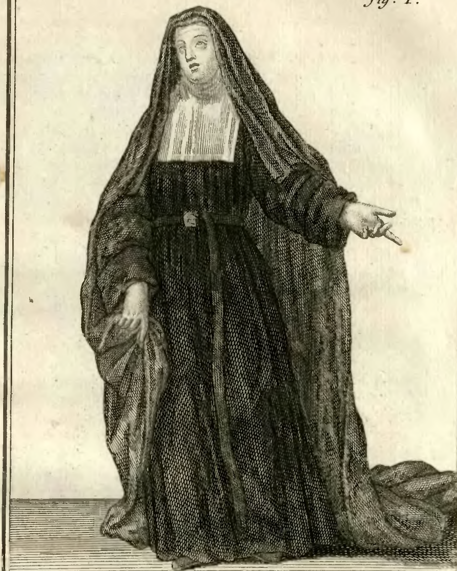
Religieuse Hospitalière de Loches 82. avec un grand voile dans les grandes Cerémonies.