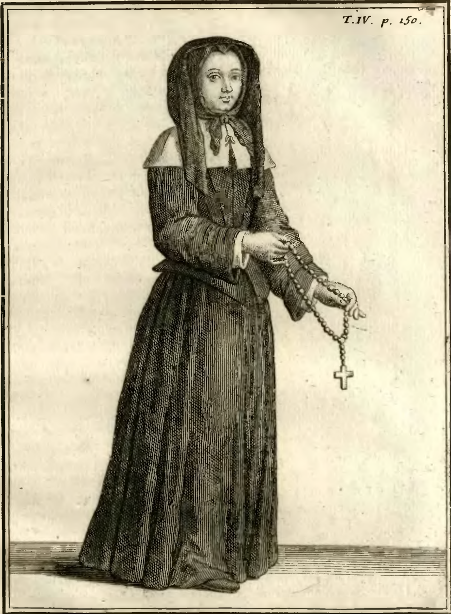
Ancienne Ursuline Congrégée en Provence.