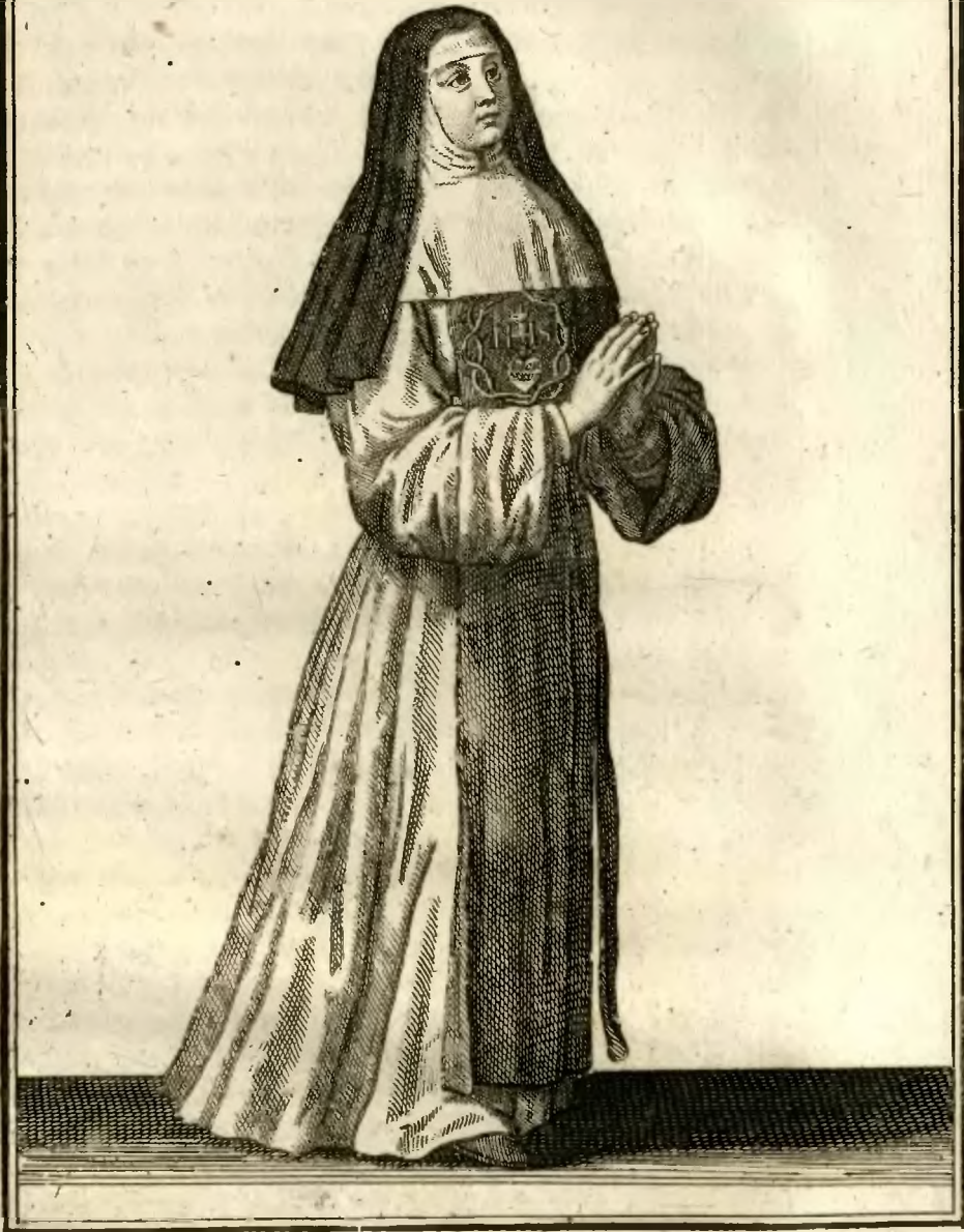
Religieuse de l'ordre du Verbe incarné, en habit ordinaire.