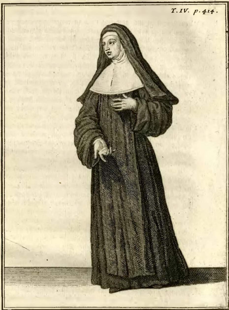
Religieuse de la Congregation de S. t Joseph, dite de la Trinité Créée, en habit ordinaire.