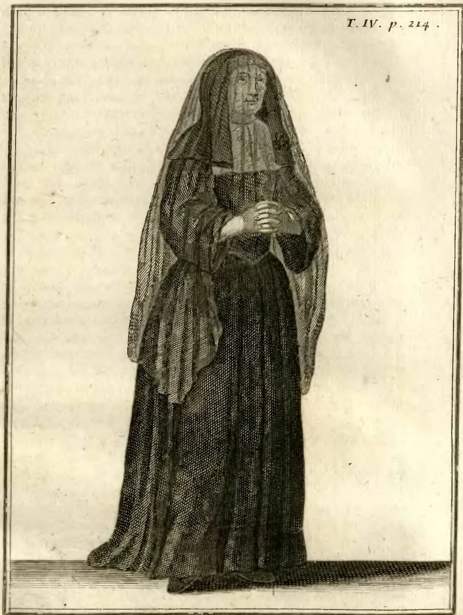
Ursulinè en suisse.