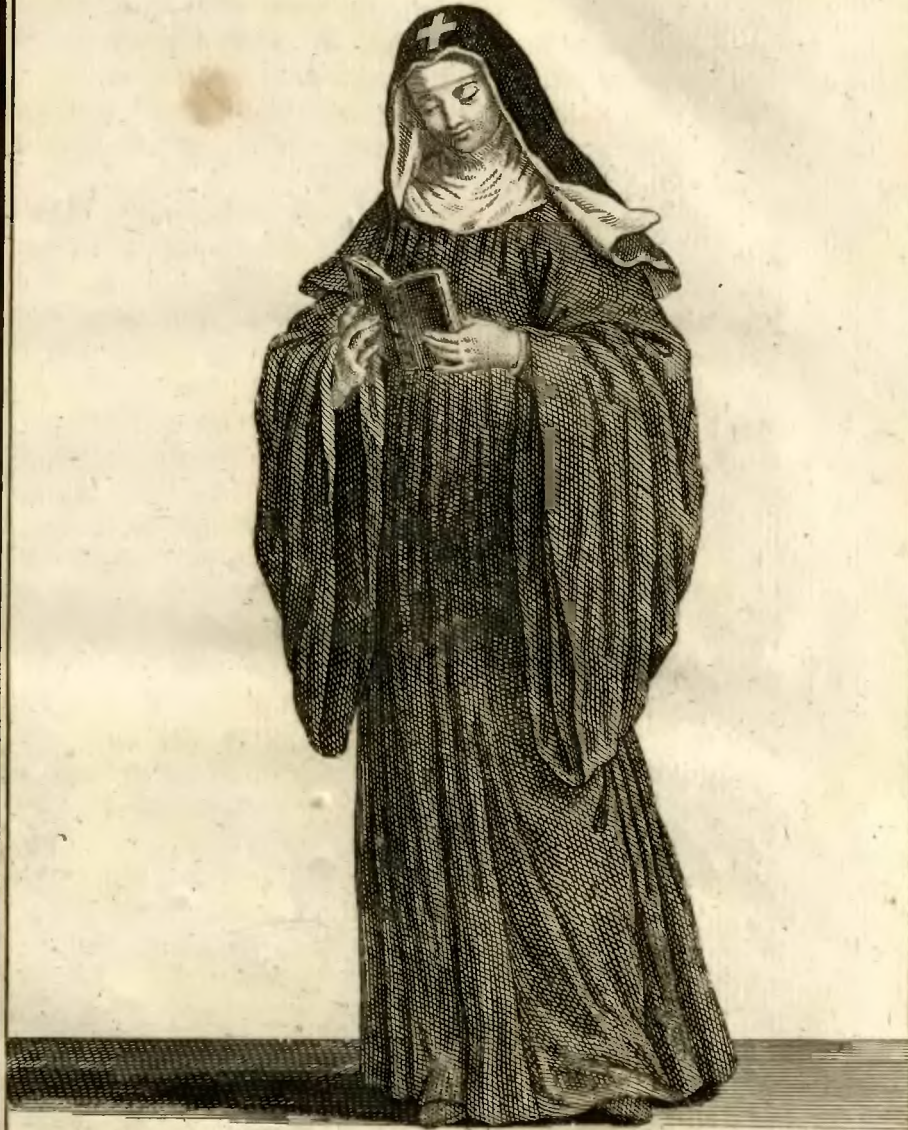
Religieuse de l'ordre de S. te Birgitte, dite de la Recollection.