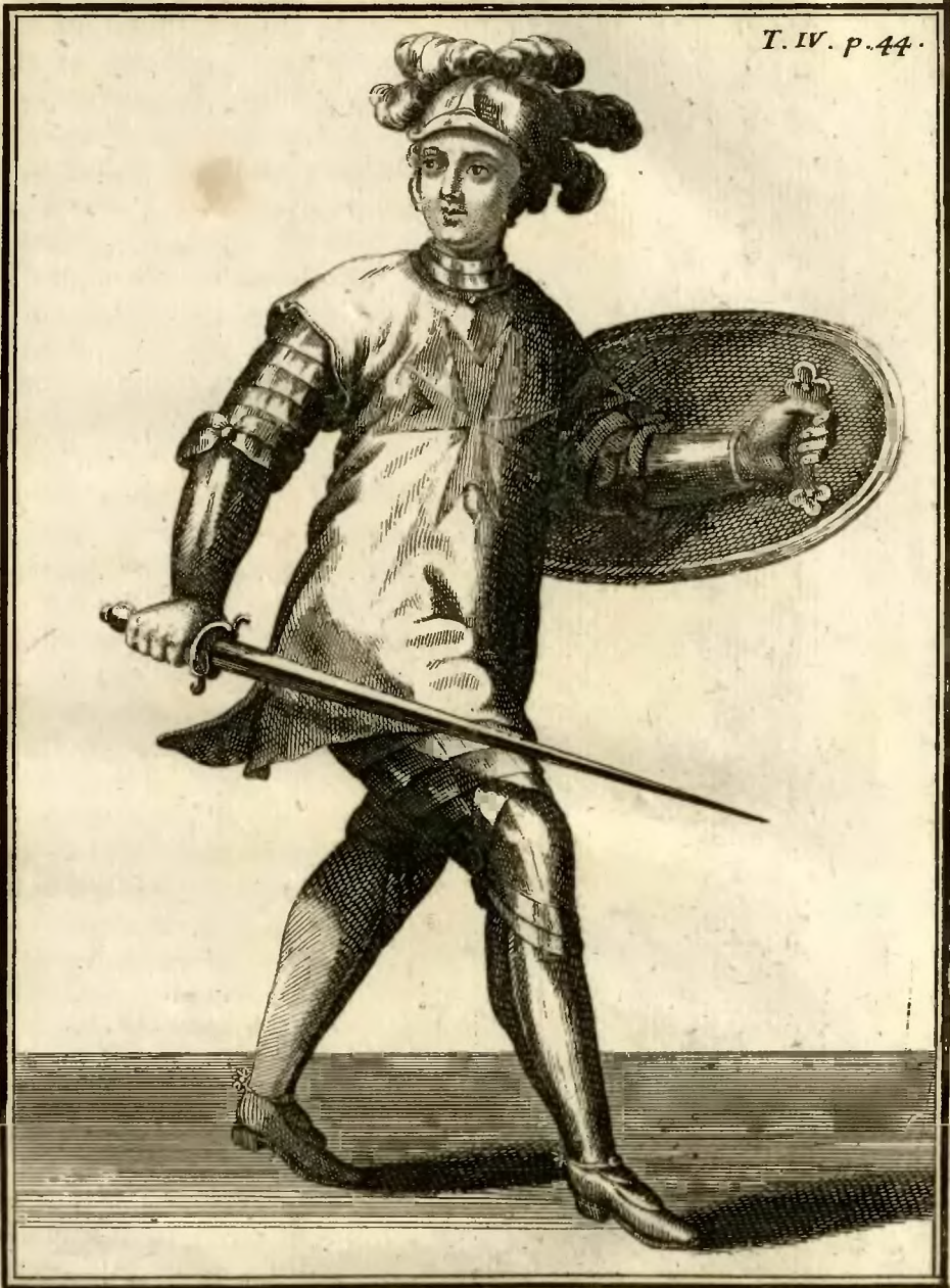
Chevalier supposé de l'ordre de S. te Birgitte.