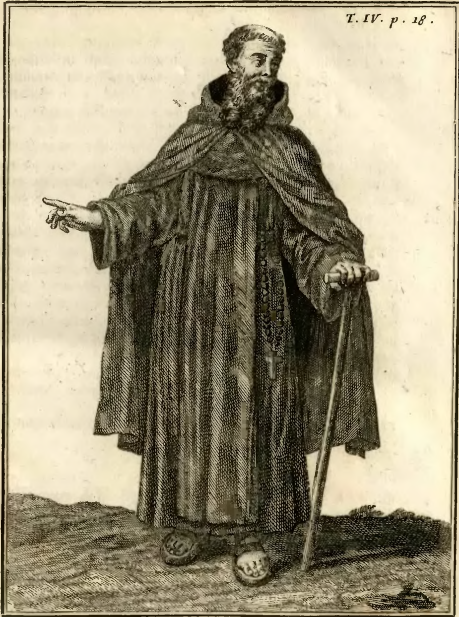
Religieux Ermite de Saint Jerome, de la Congregation de Fiesoli.