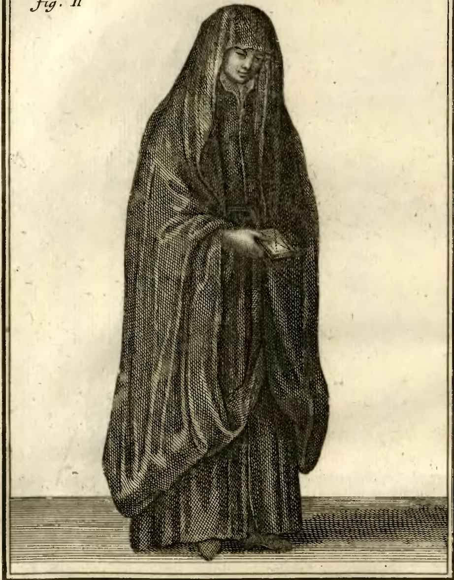
Ursuline de Parme, allant par la Ville.