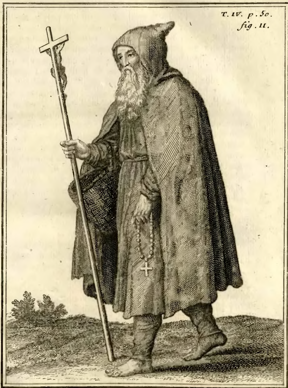
Religieux de l'ordre des pauvres Volontaires, en Flandres.