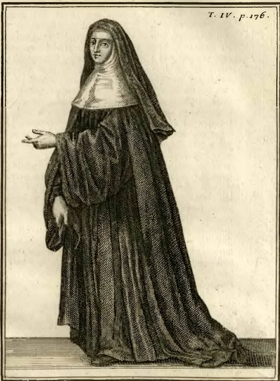
Ursuline de la Congregation de Toulouse, en habit de Cérémonie et allant à la Communion.