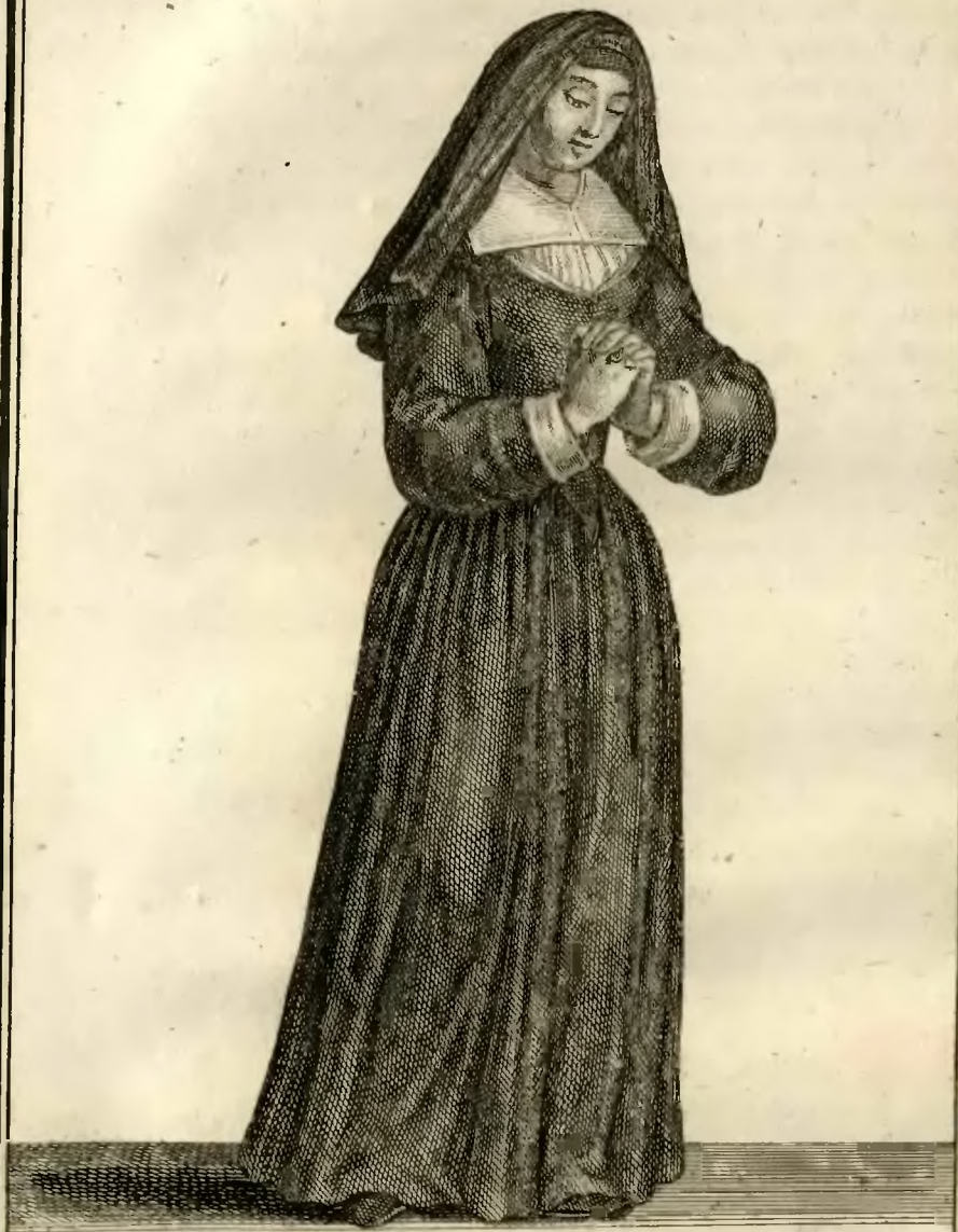
Ancien habillement des Religieuses de l'ordre 69. de la Visitation de Notre Dame.