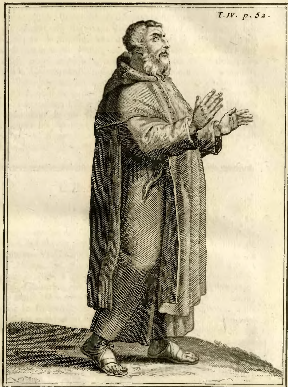
Religieux de l'ordre de S. Ambroise ad Nemus.