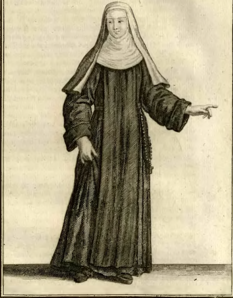
Sœur Converse de l'ordre des Annonciades Célestes.