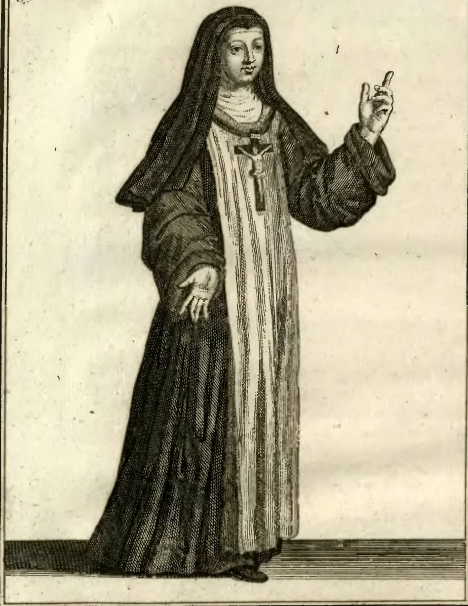
Religieuse de l'ordre de N.D. e de Miséricorde, en habit ordinaire.