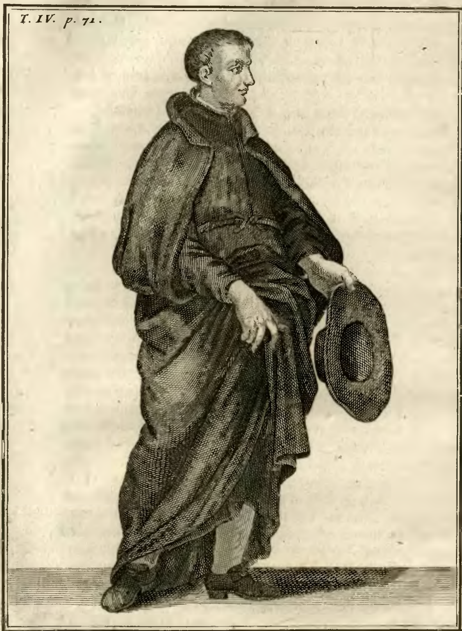
Clerc Regular Theatin.