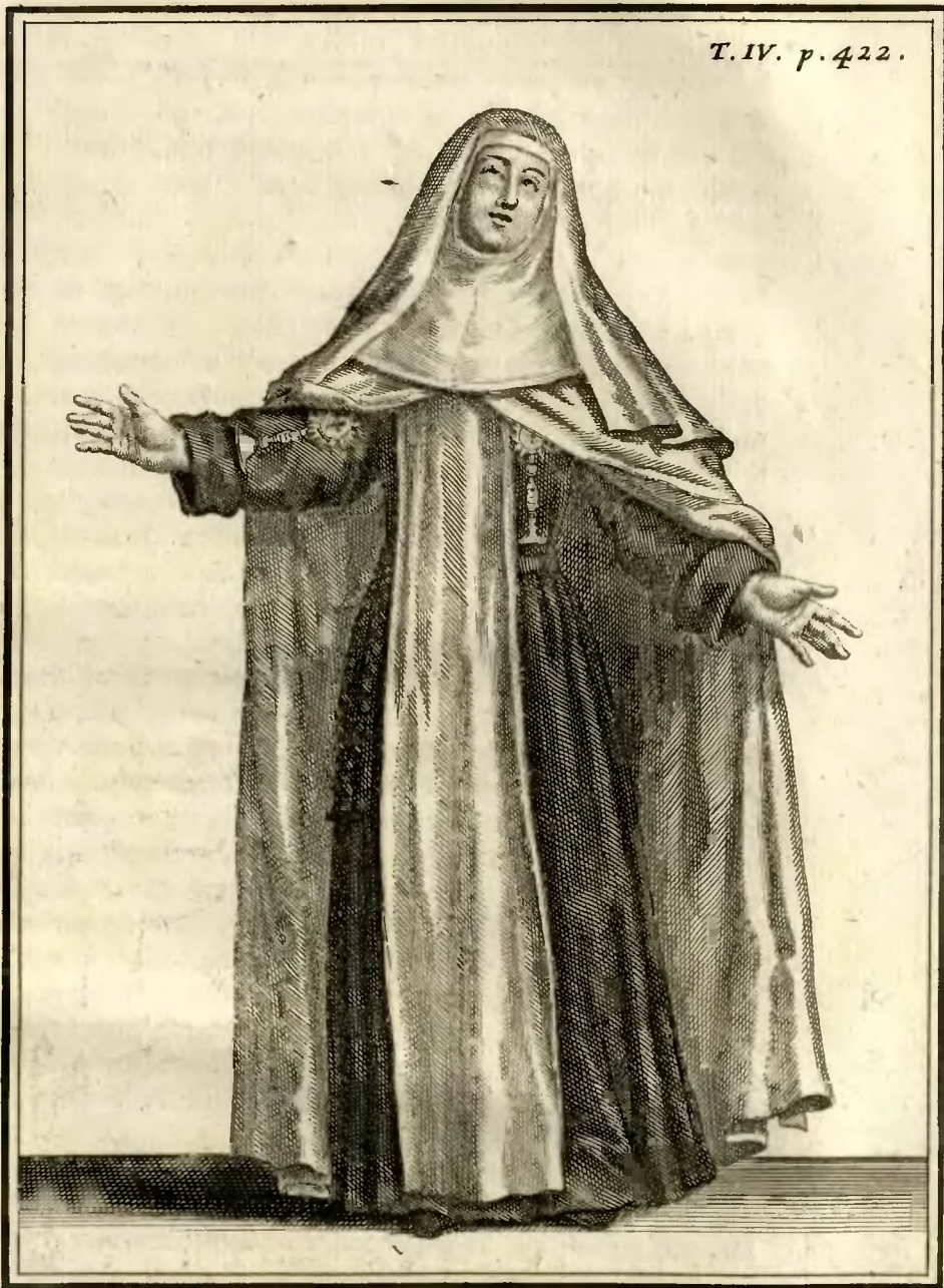
Religieuse de l'adoration perpétuelle du S. Sacrement à Marseille, en manteau .