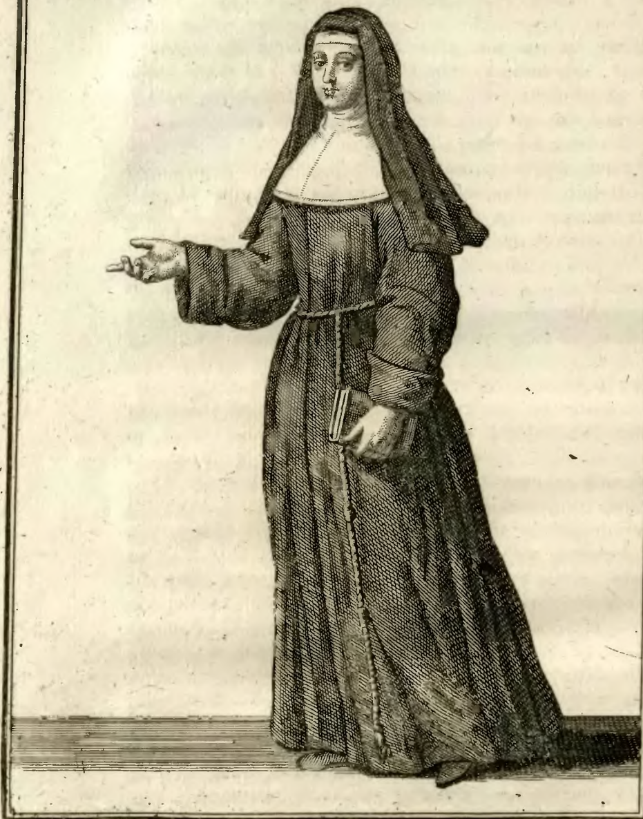
Religieuse de l'ordre des Hospitaliers de S. Joseph.