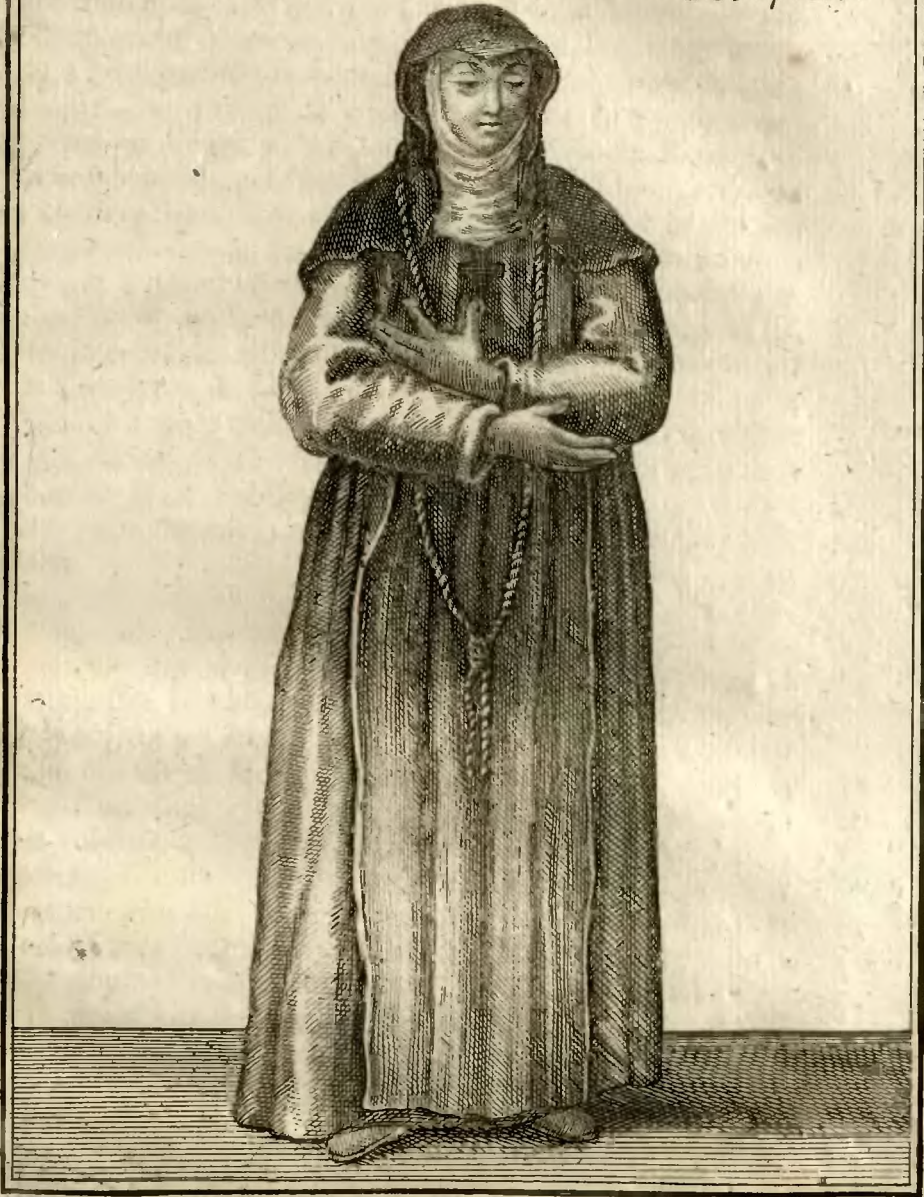
Religieuse de l'ordre des Angeliques.