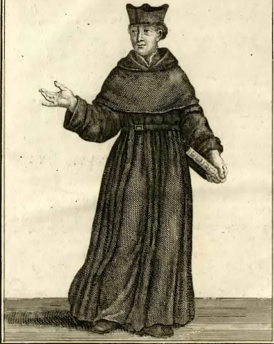
Religieux Ermite de S. Jérôme de la Congrega- tion du B. Pierre de Pise, en habit ordinaire.