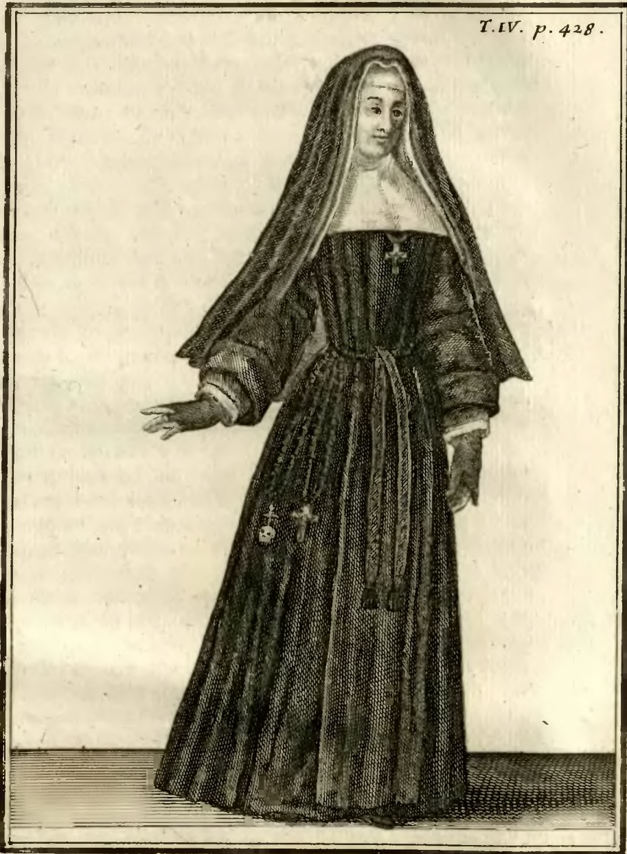
Dame Religieuse de la Royale Maison de S. t Louis à S. t Cir, en habit- ordinaire, depuis l'an 1707.