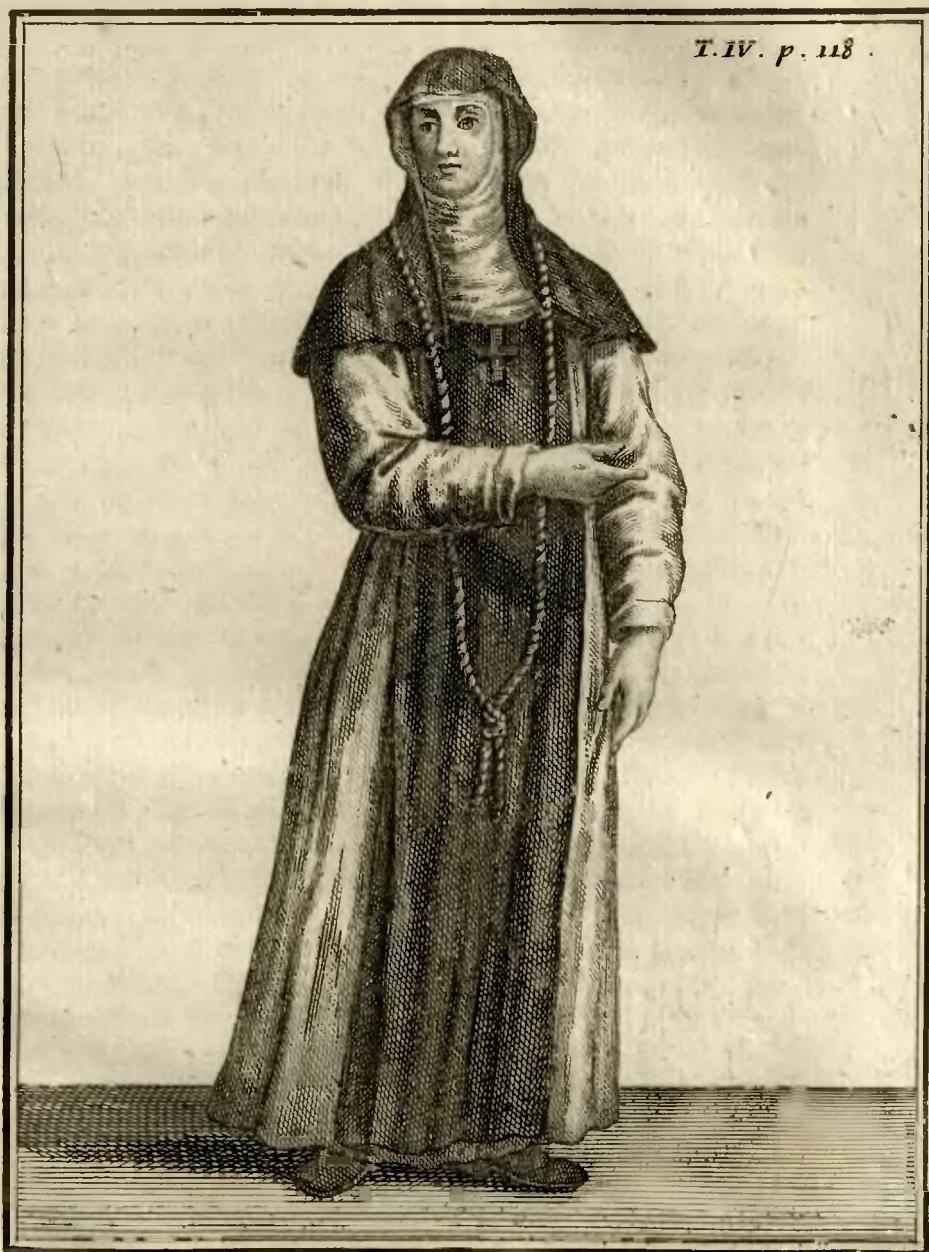
Soeur Converse de l'Ordre des Angeliques.