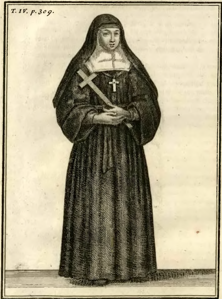
Religieuse de l'ordre de la Visitation de N. e Dame. 68.