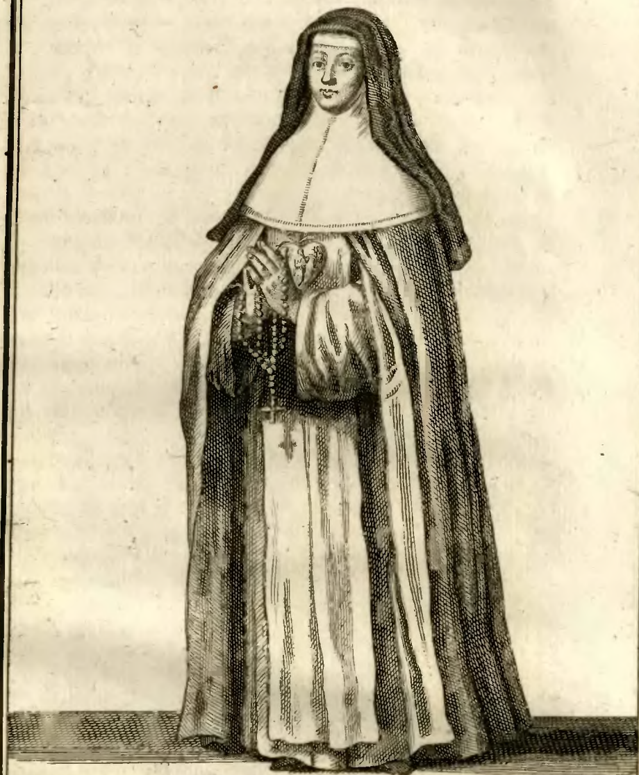
Religieuse de l'Ordre de N e Dame de Charité, en habit de Cérémonies.