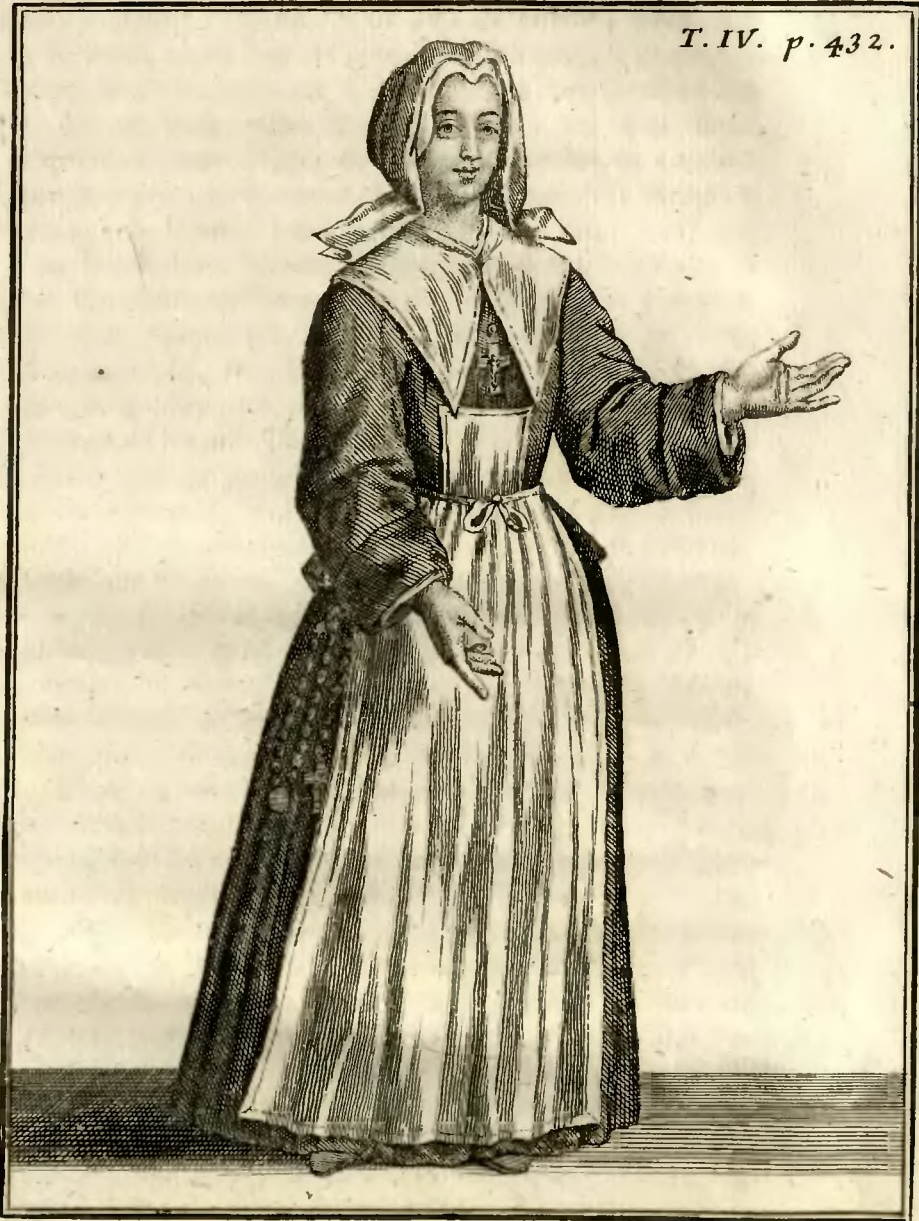
Ancien habillement des Sœurs Converses de la Royale Maison de S. t Louis à S. t Cir, avant l'an 1707.