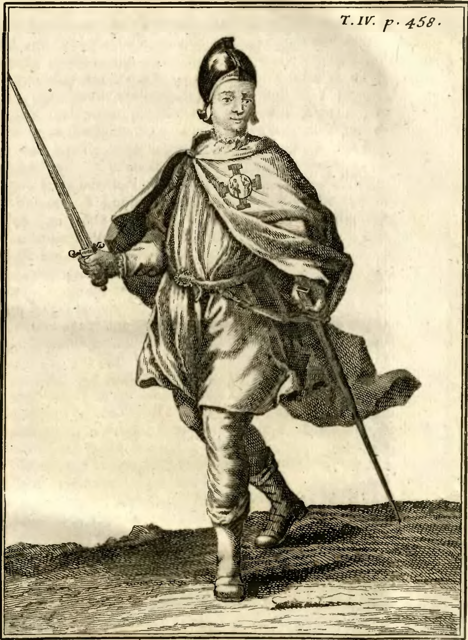
Chevalier de l'Ordre de S. t Jean et de S. t Thomas