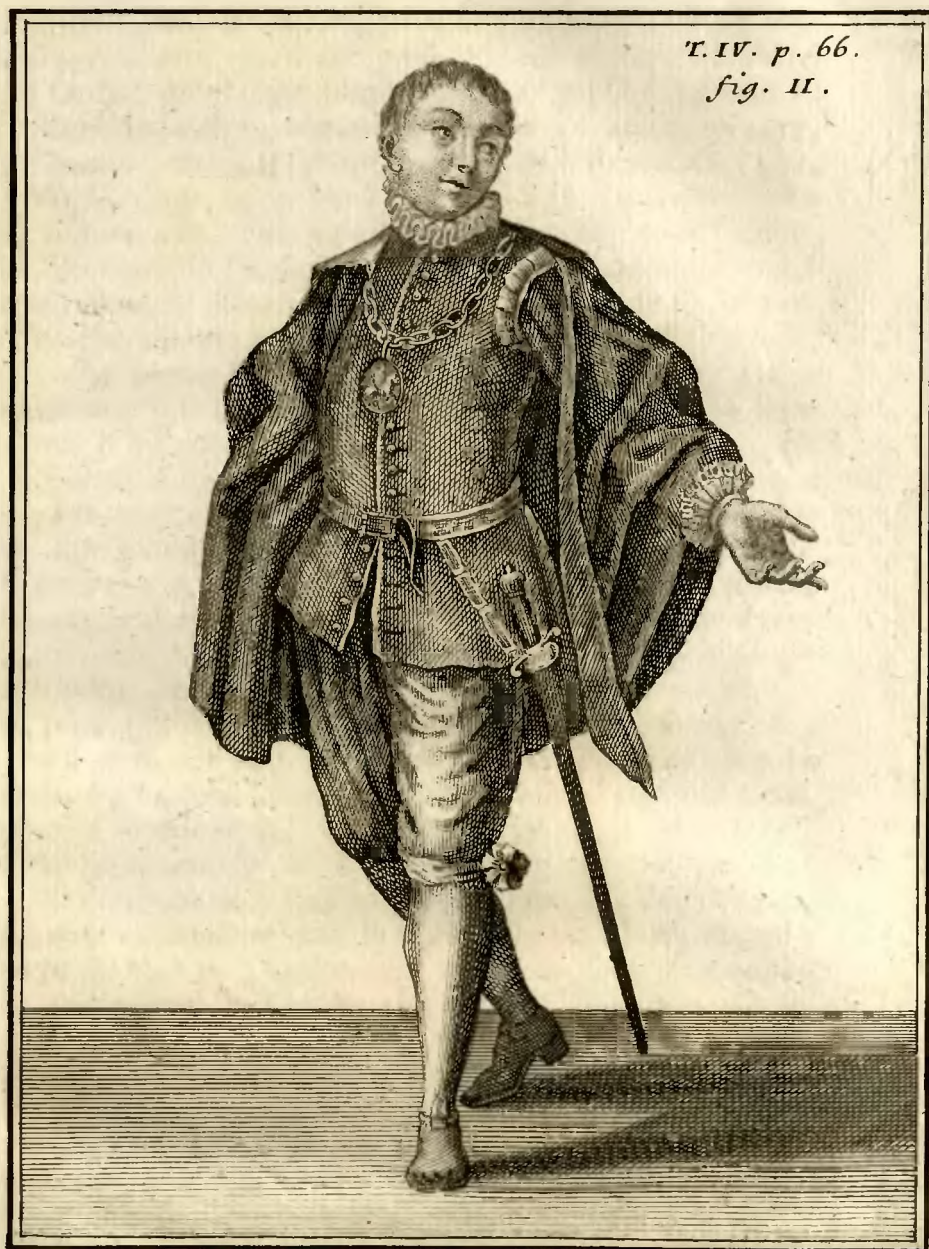
Chevalier supposé de l'ordre de s. Georges, à Rome.