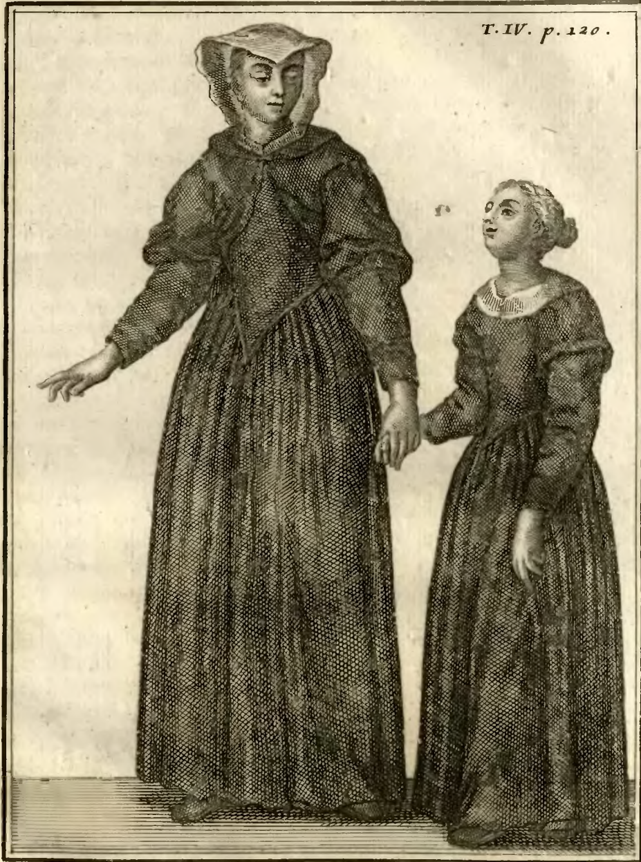
Soeur de la Congregation des Guastalines.