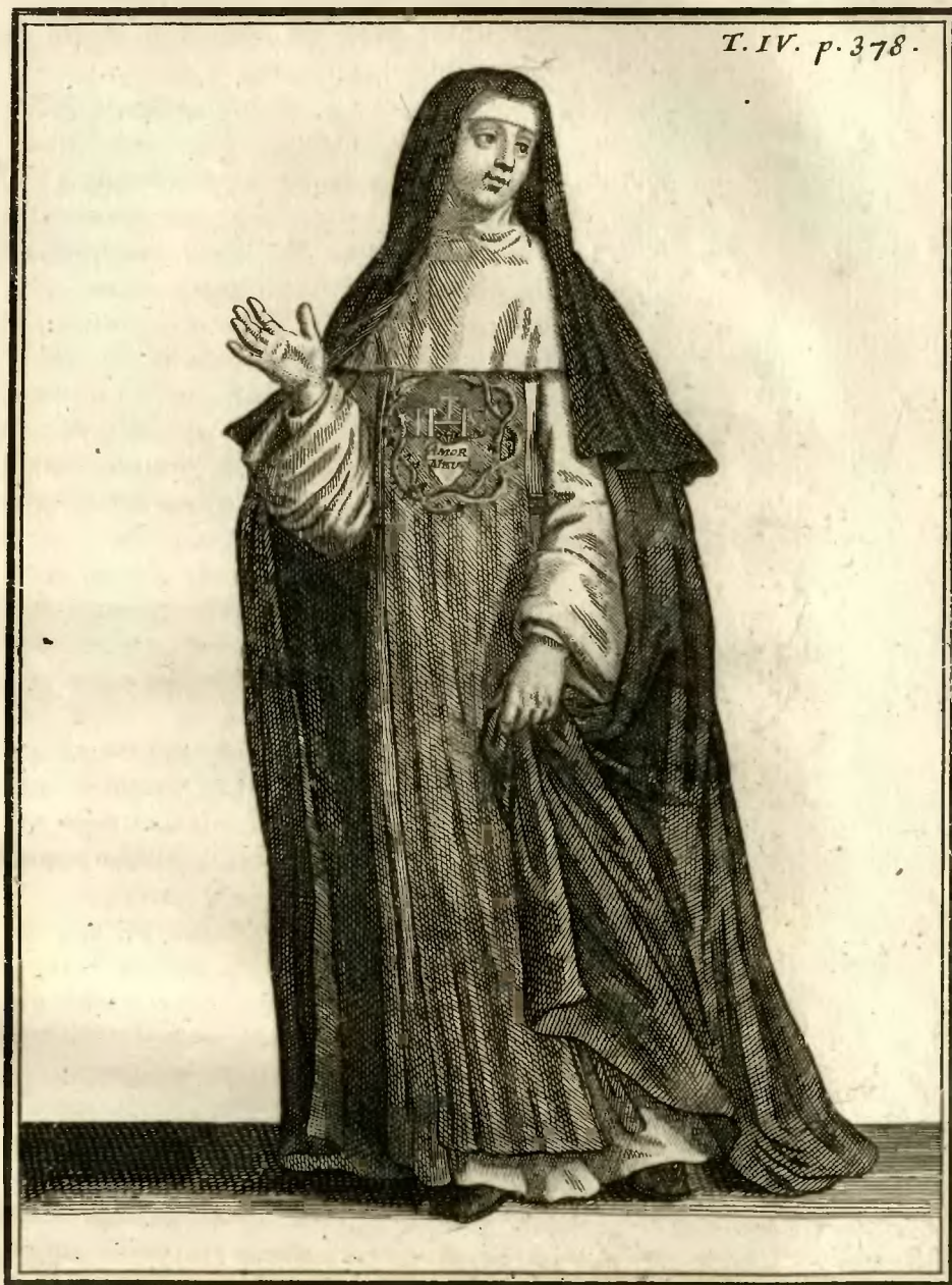
Religieuse de l'Ordre du Verbe incarné, en habit de Cérémonies.