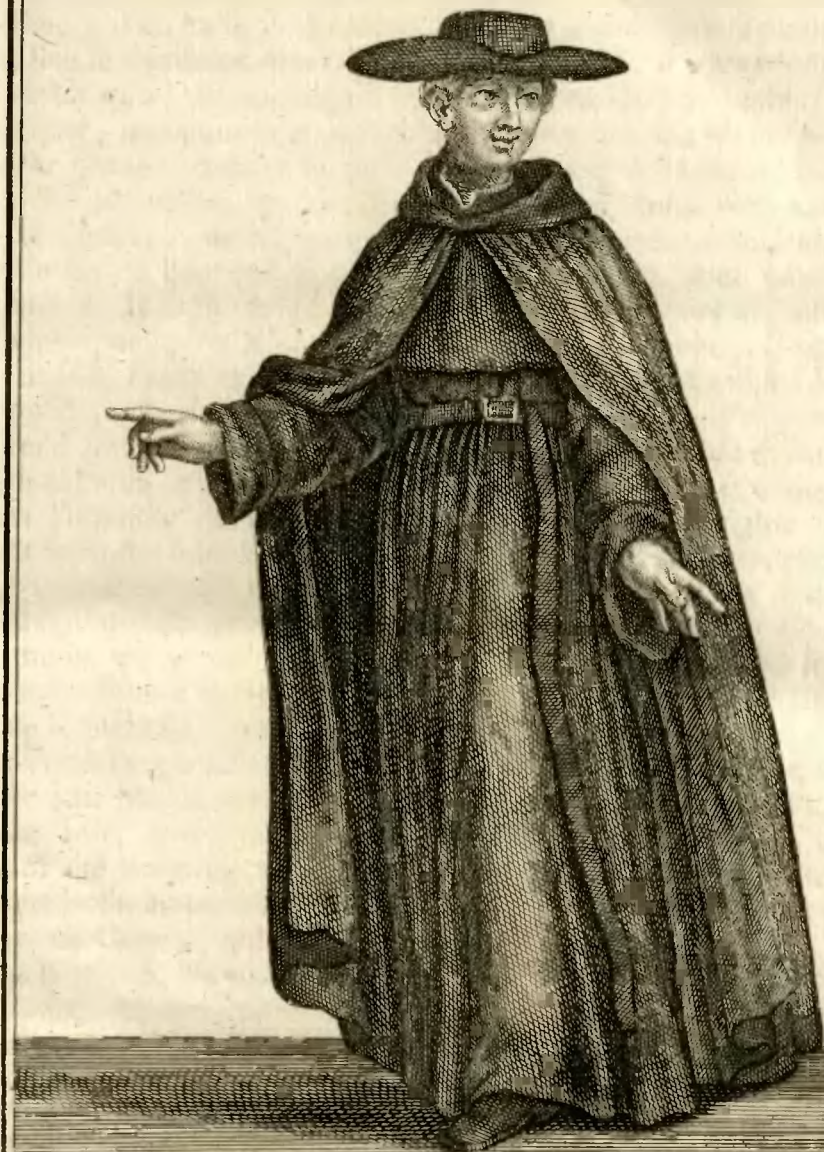
Religieux Ermite de Saint Jerome de la Congregation du B. Pierre de Pise.