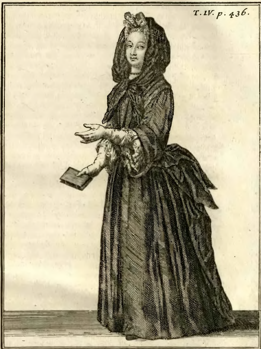
Demoiselle de la Royale Maison de S. t Louis à S. t Cir, des deux premières Classes, allant au Chœur.