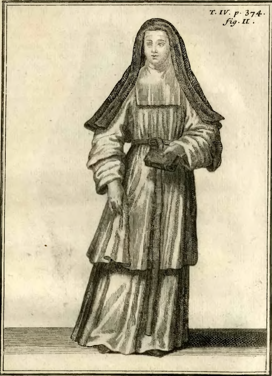
Sœur Converse hospitalière de Loches.