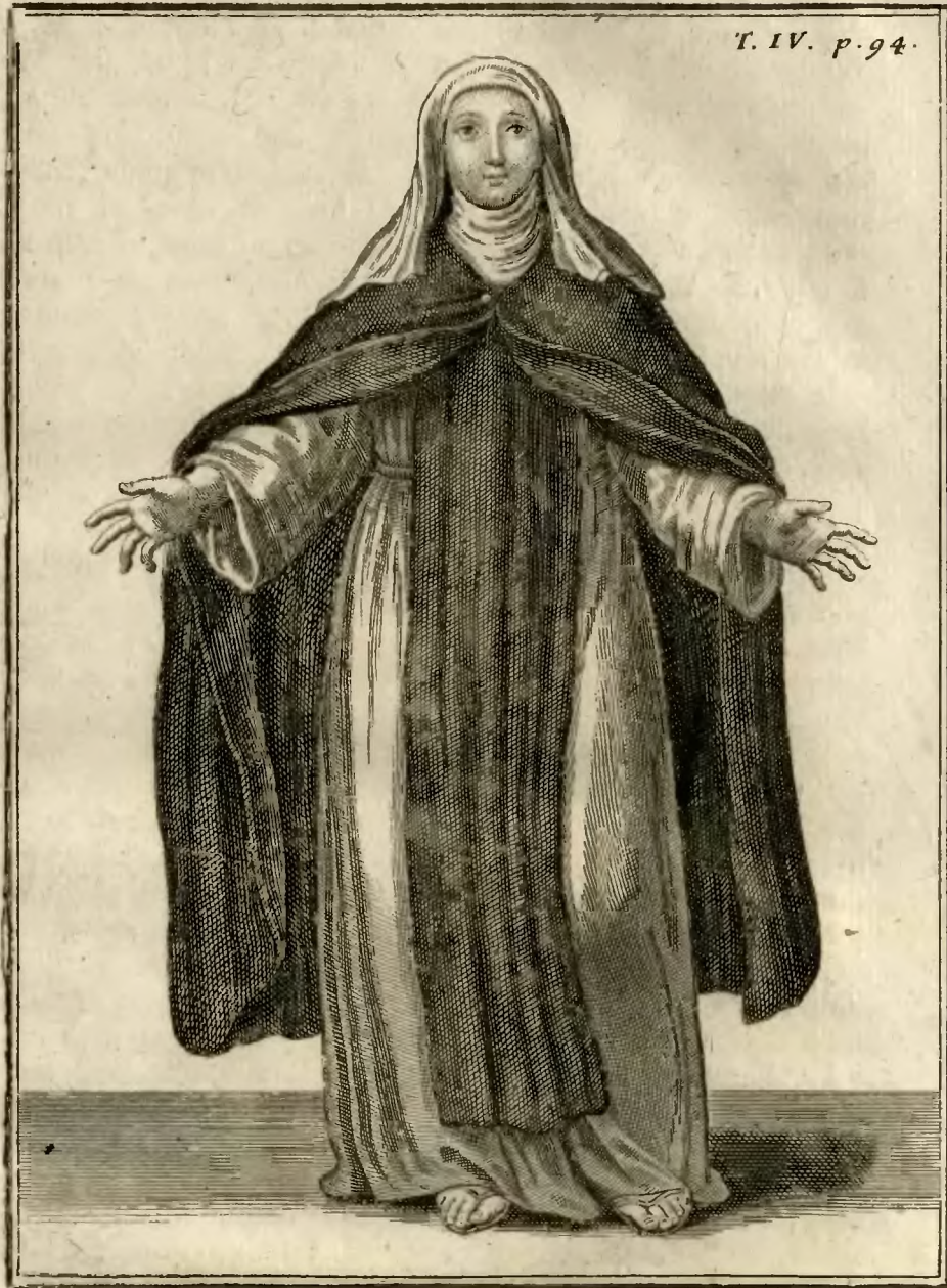
Religieuse Theatine de l'Ermitage.