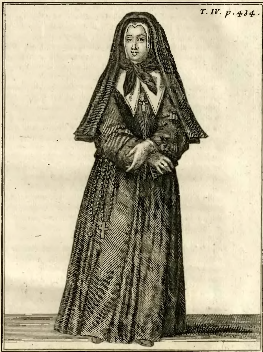
Ancien habillement des Sœurs Converses de la Royale Maison de S. t Louis à S. t Cir, lorsqu'elles étoient au Chapitre, au Parloir où qu'elles alloient Communier.