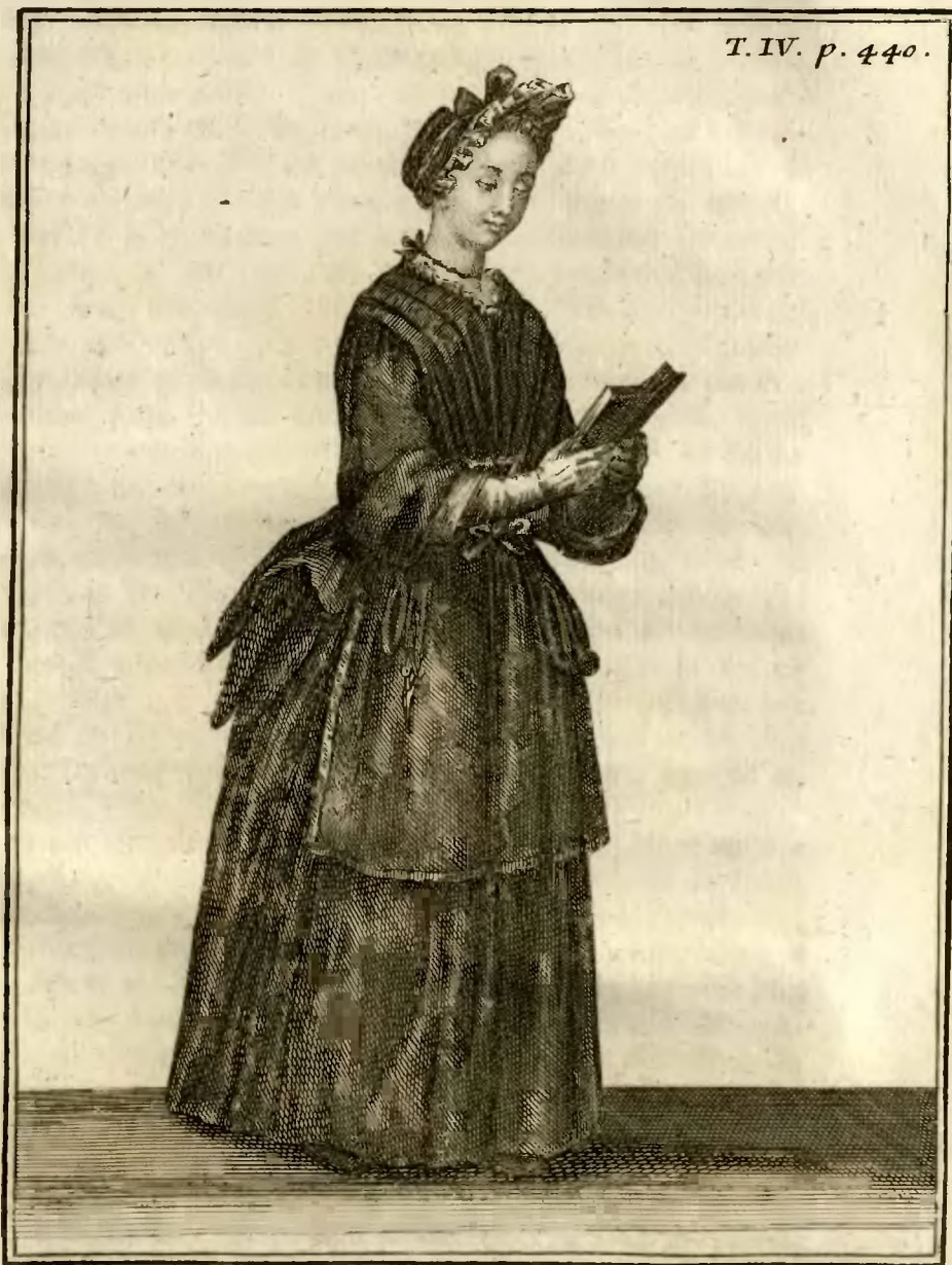
108 Demoiselle de la Royale Maison de S. t Louis à S. t Cir, de l'une des deux dernières Classes, qui n'a point la Croix de distinction. D. de la p.