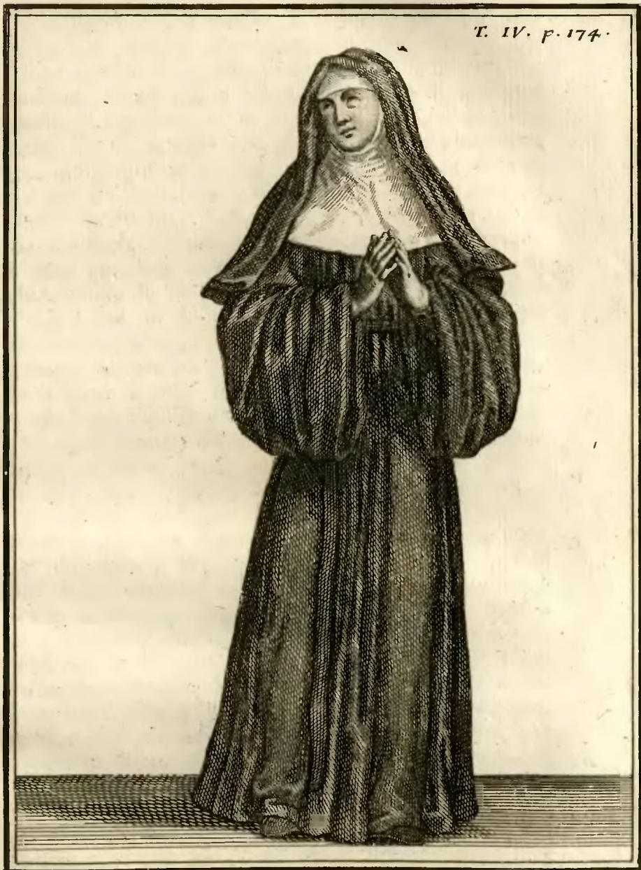
Ursuline de la Congregation de Toulouse, en habit ordinaire les Dimanches et festes.