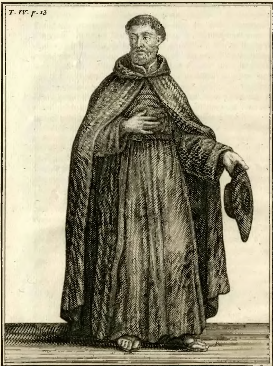
Religieux Ermite de S. Jérôme, Reformé, de la Congregation du B. Pierre de Pise, en Allemagne