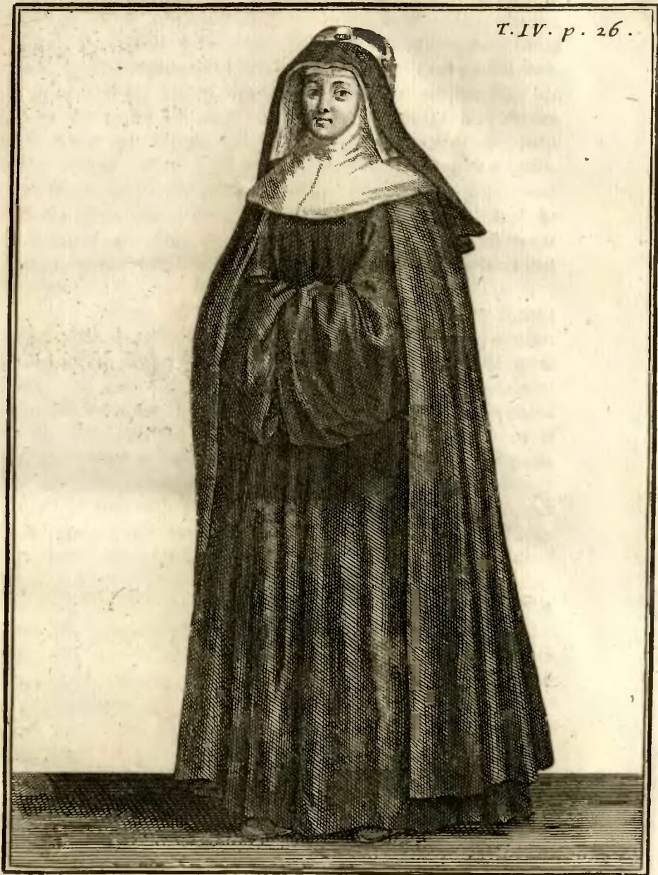
Religieuse de l'ordre de Sainte Birgitte, avec le manteau.