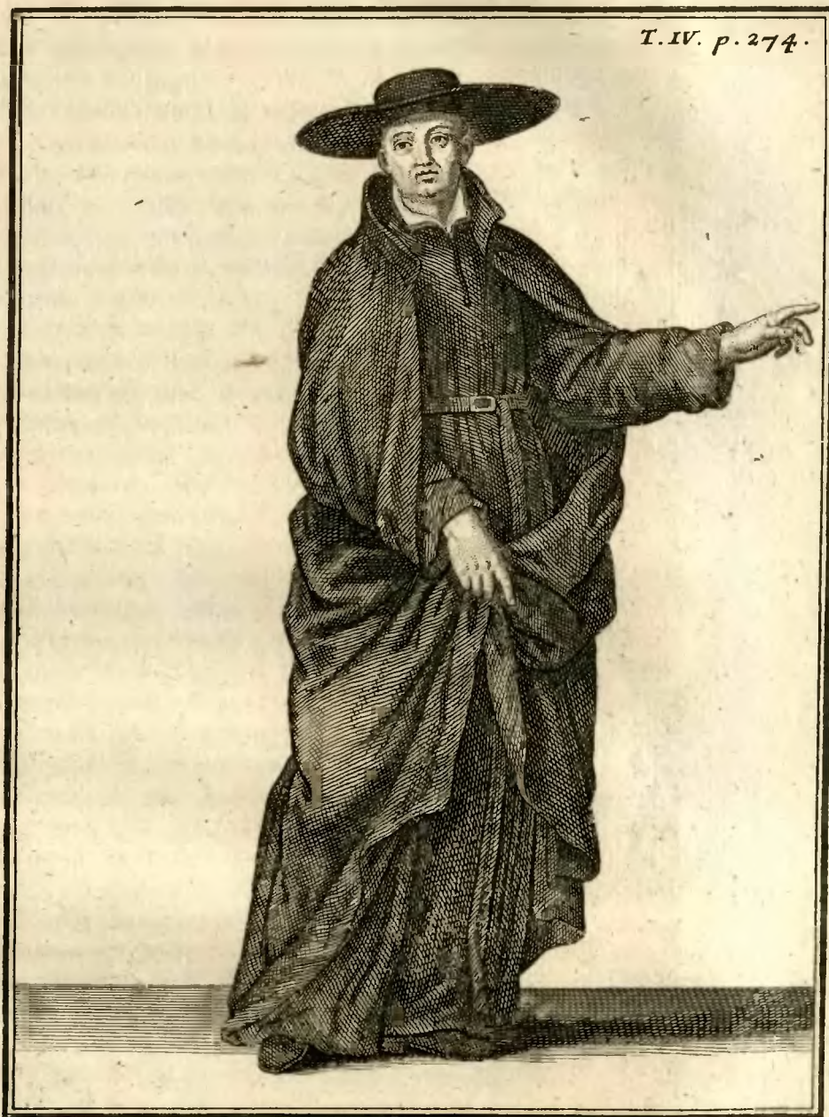
Clerc Régulier Mineur.