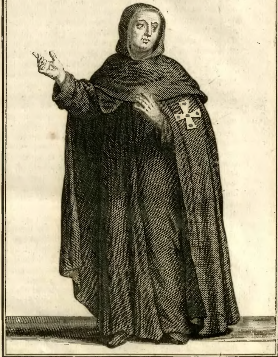
Religieux Convers de l'ordre de S. te Birgittè.