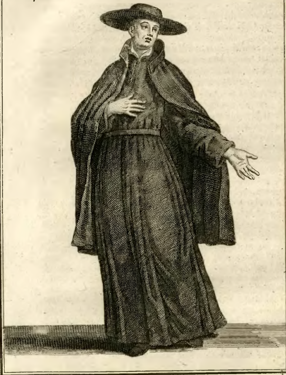
Clerc Regulier Pauvre de la Mere de Dieu, des Ecoles pieuses.