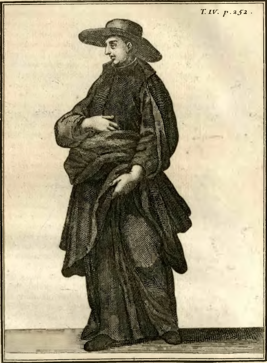
Clerc Regulier de la Mere de Dieu, de Lucques.