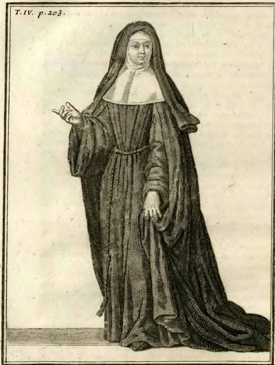
Ursuline de la Còngrègation d'Arles. .