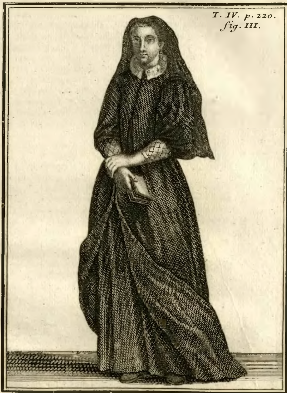
Ursuline en quelques villes d'Italie