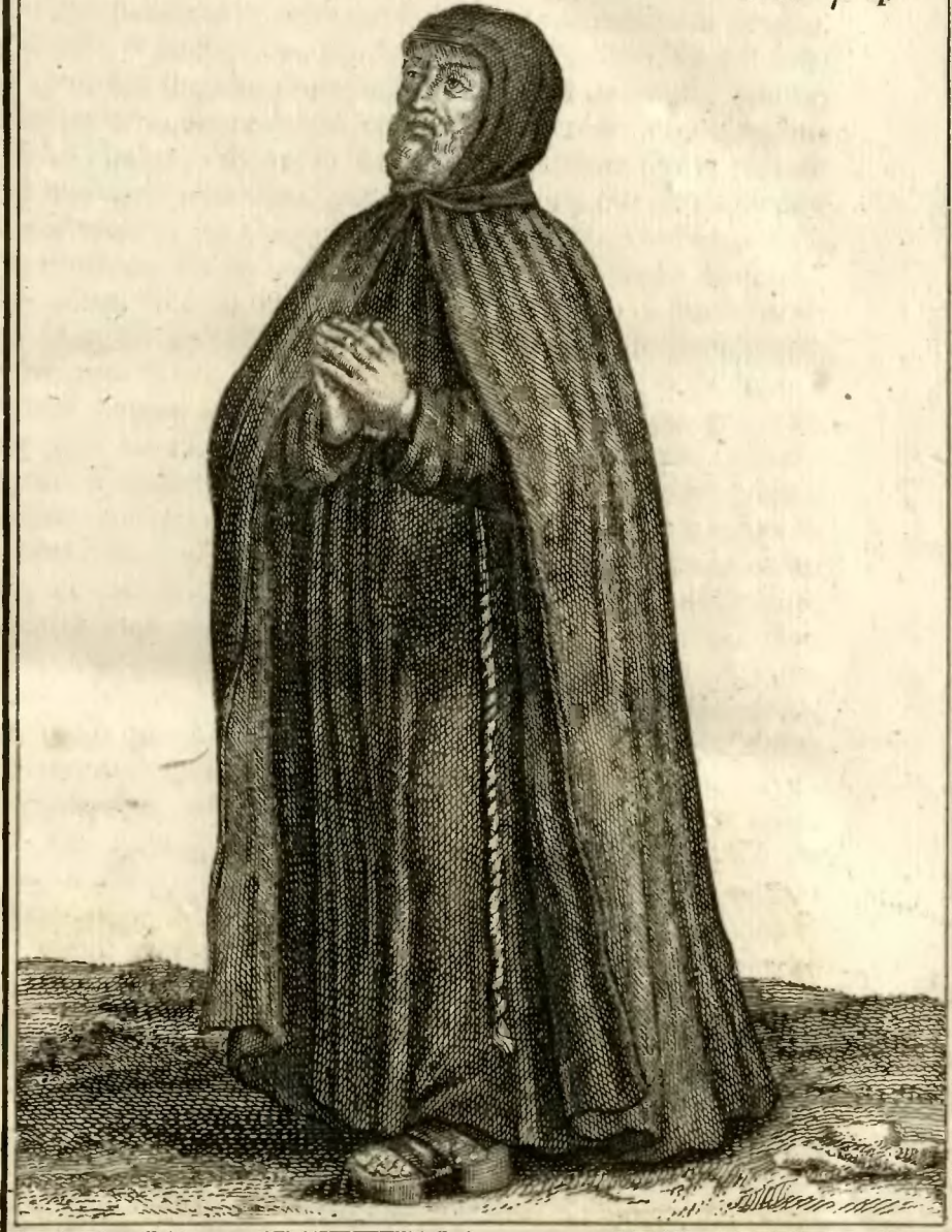
3. Ancien habillement des Religieux Ermites de S. Jerome de la Congregation du B. Pierre de Pise.