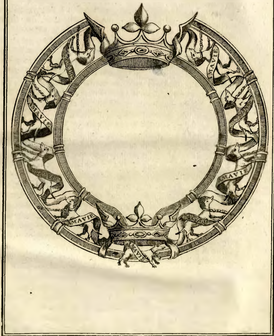
Collier de l'Ordre de l'hermine.