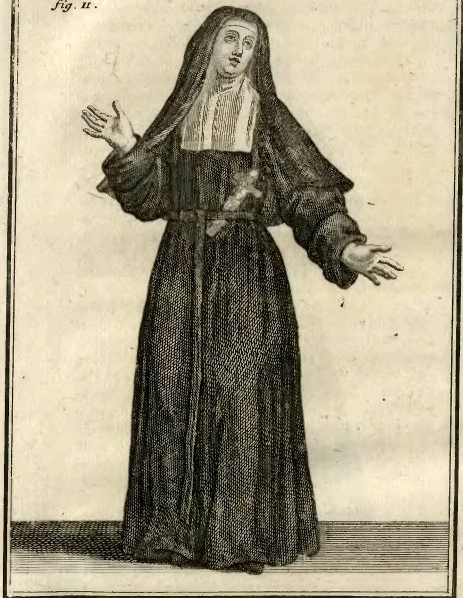
Religieuse hospitalière de Loches, en habit de Choeur, à certains jours, et dans quelques Cérémonies.