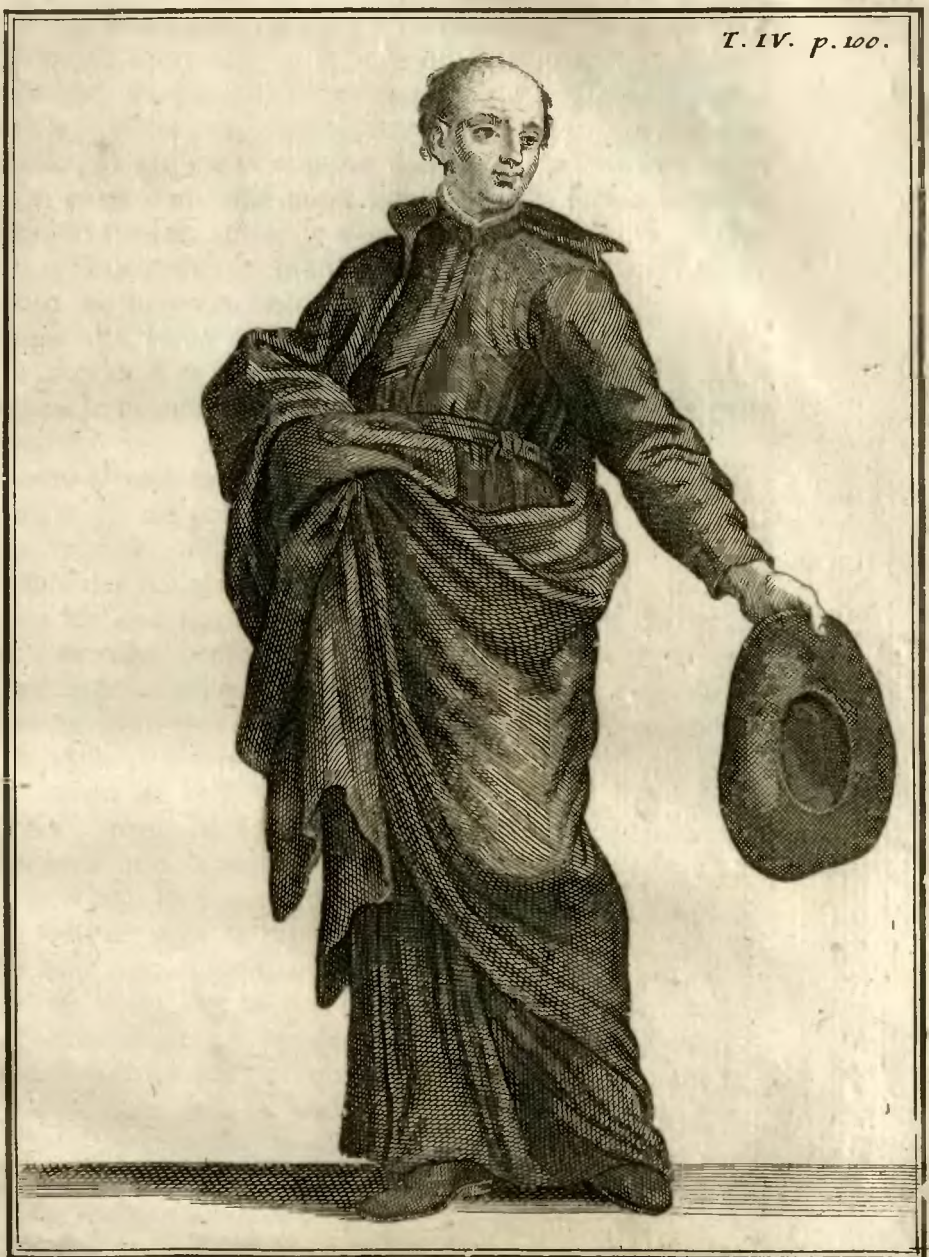
Clerc Regulier Barnabite.