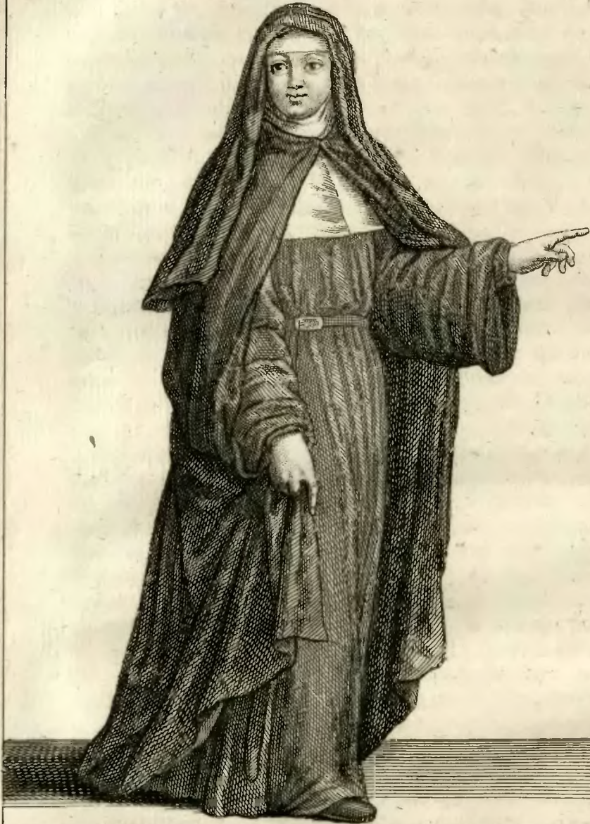
Ursuline de la Congrégation de Tulle en habit de Cérémonie