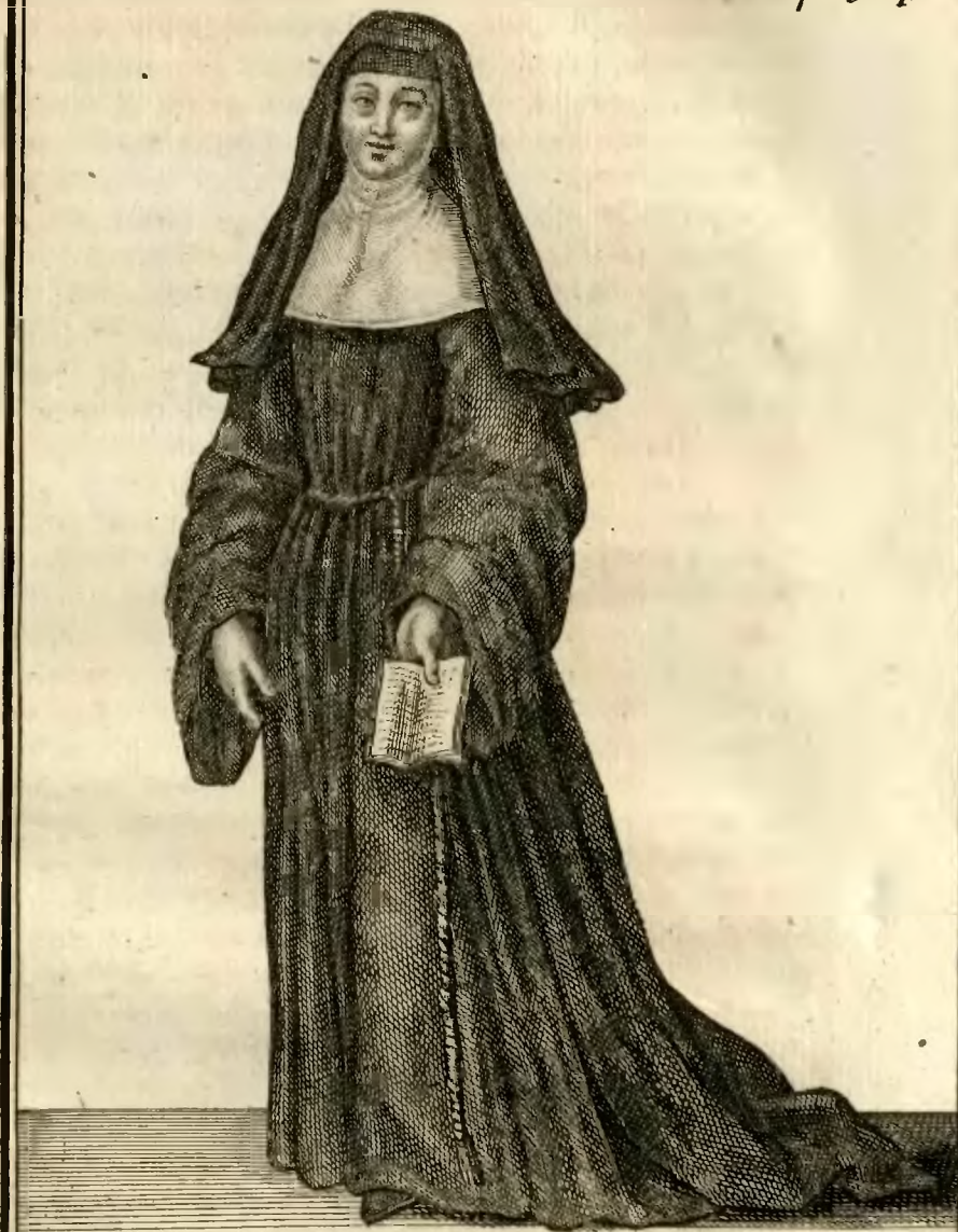
Religieuse de l'ordre de la Presentation de n. e Dame, en France.