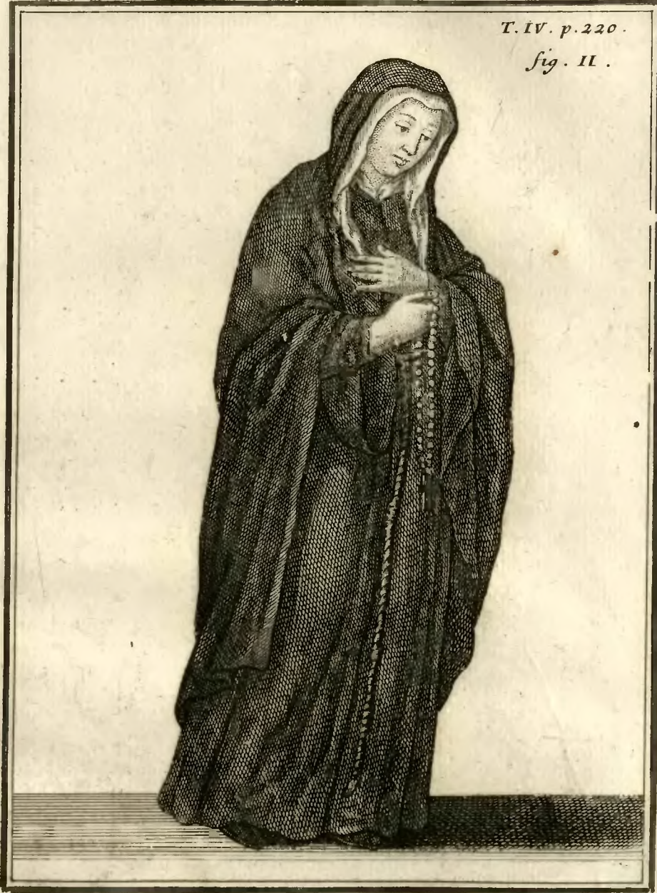
Ursuline de Foligny, allant par la ville.