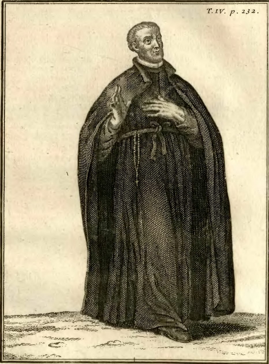
Prêtre de la Doctrine Chrétienne, en France.