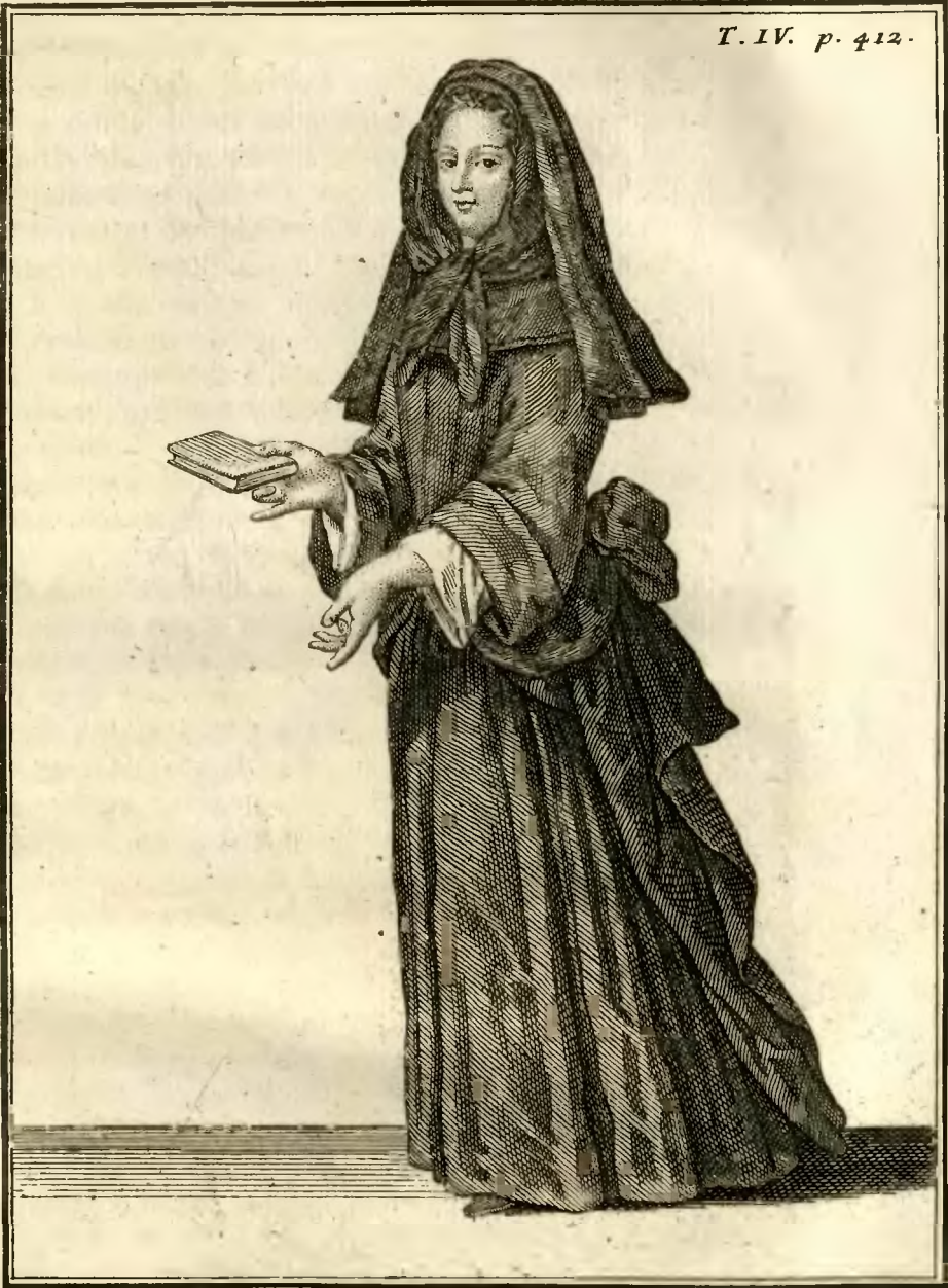
Sœur de la Congregation des filles de S. t Joseph, dites de la Providence, à Paris.