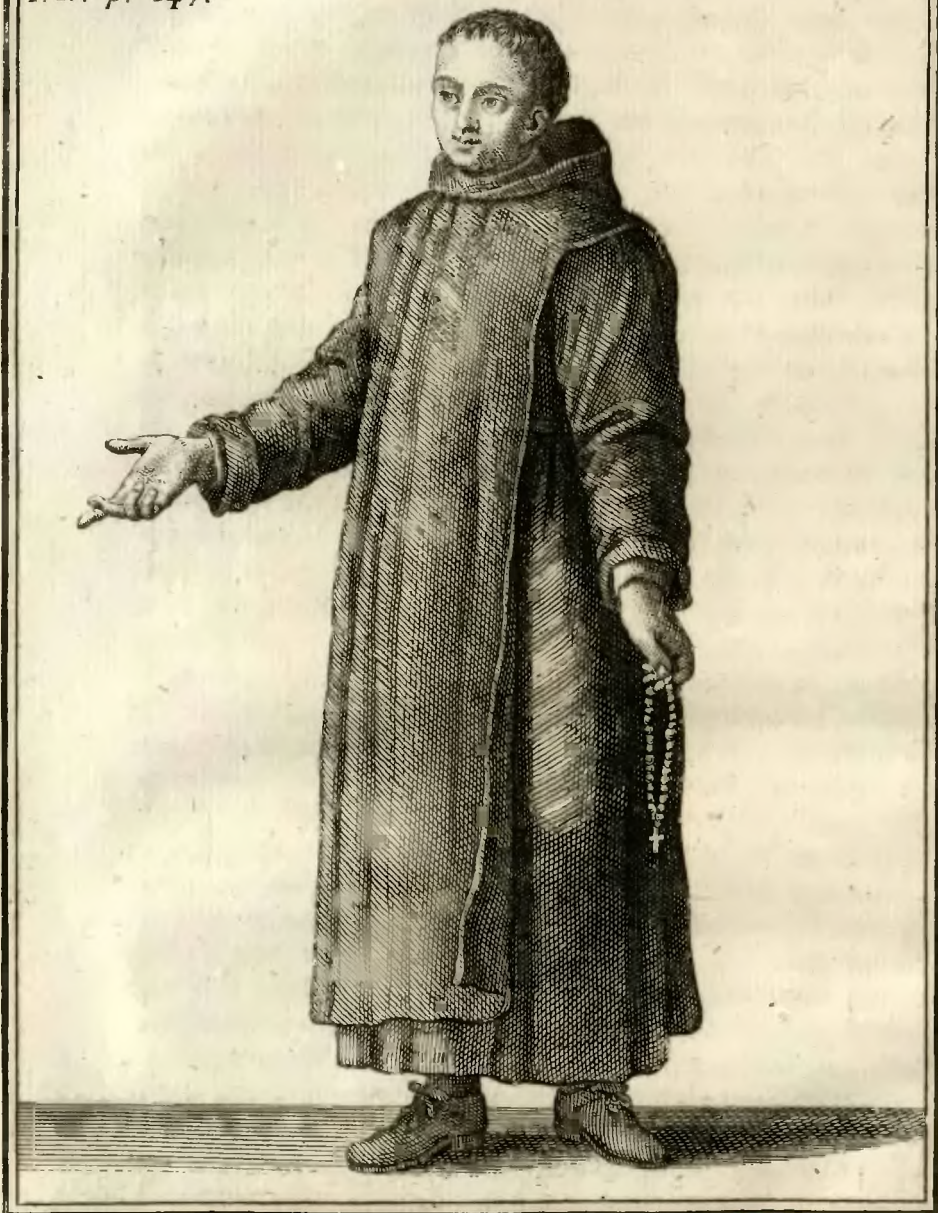
Religieux Hospitalier; de l'ordre de la Charité de S. Hippolyte.