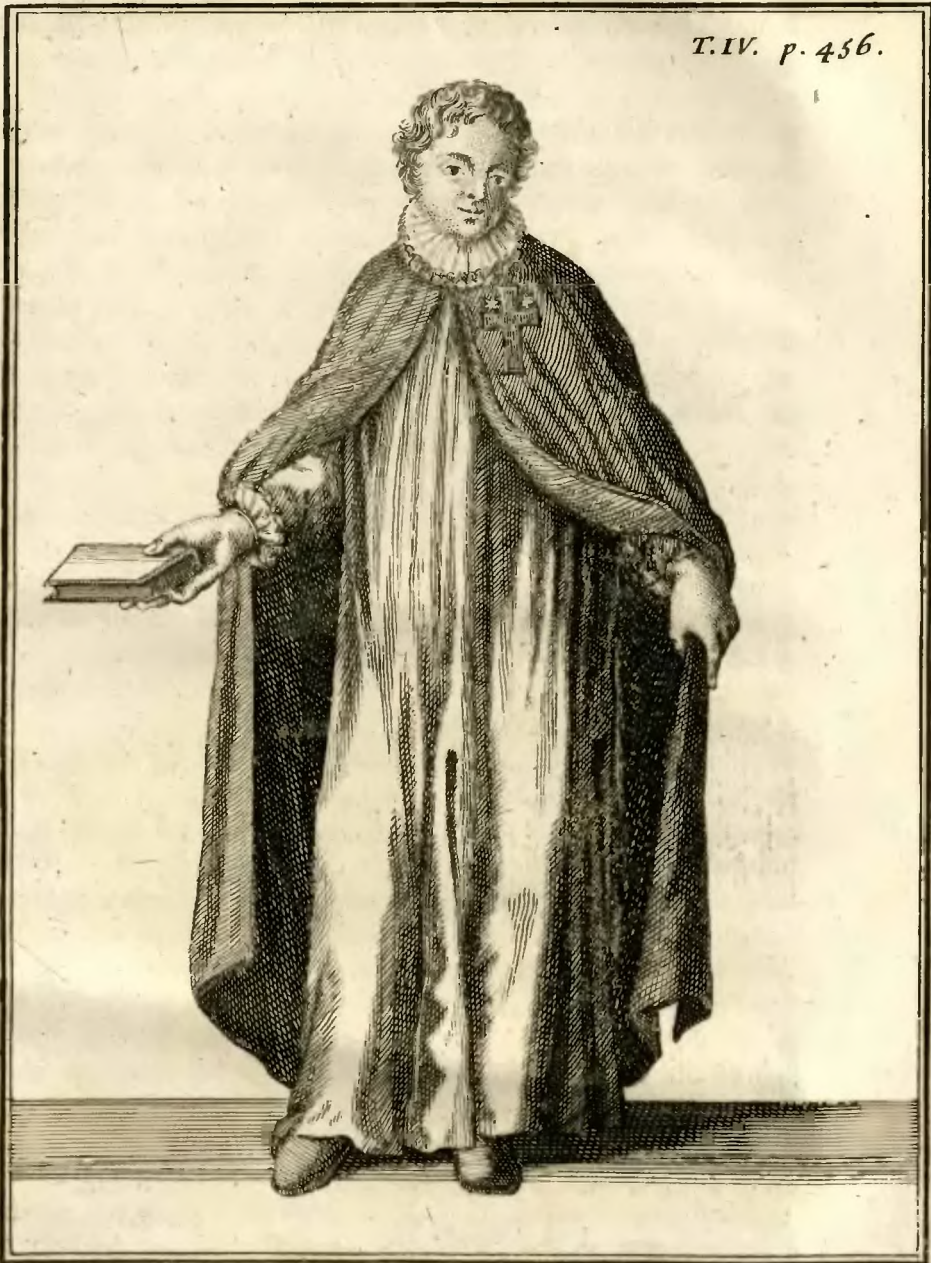
Chevalier de l'Ordre de la Glorieuse Vierge Marie.