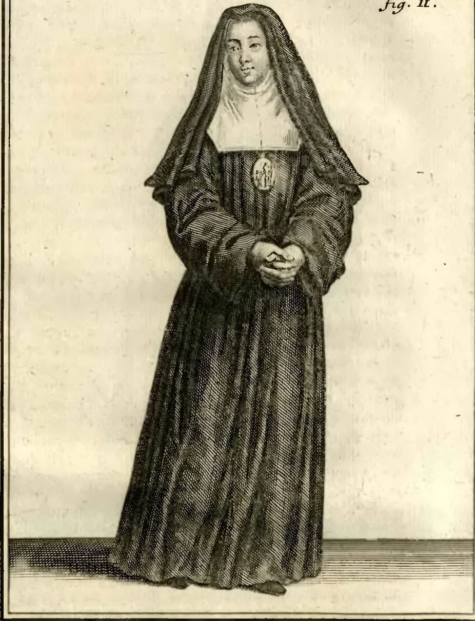
97 Sœur de la Congregation de S. t Joseph, pour l'éducation des filles Orphelines, à Rouen.