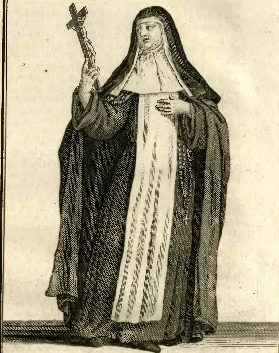
Religieuse de l'ordre de N. Dame du Refuge, en habit de Ceremonies.