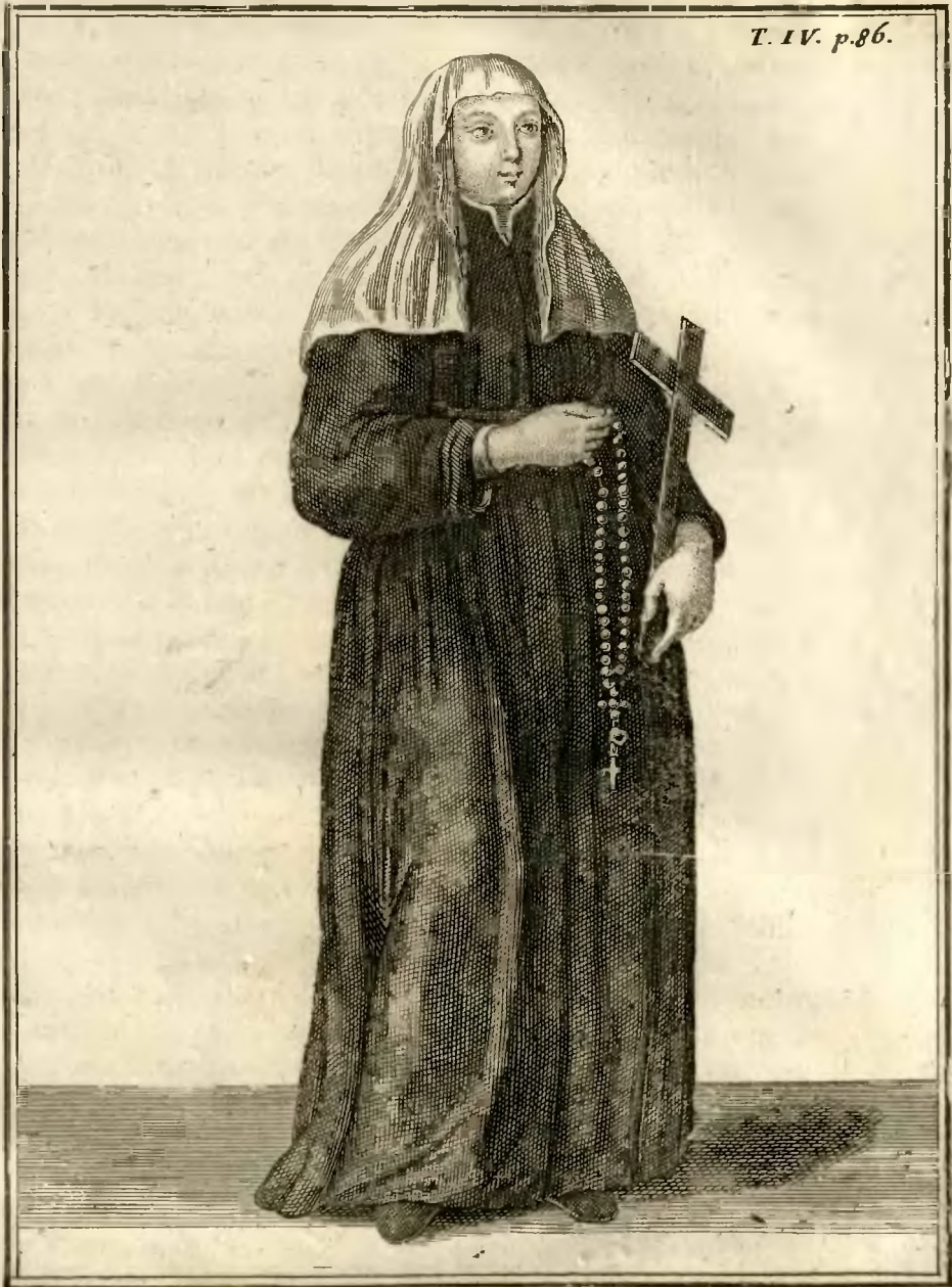
Sœur Theatine de la Congregation.