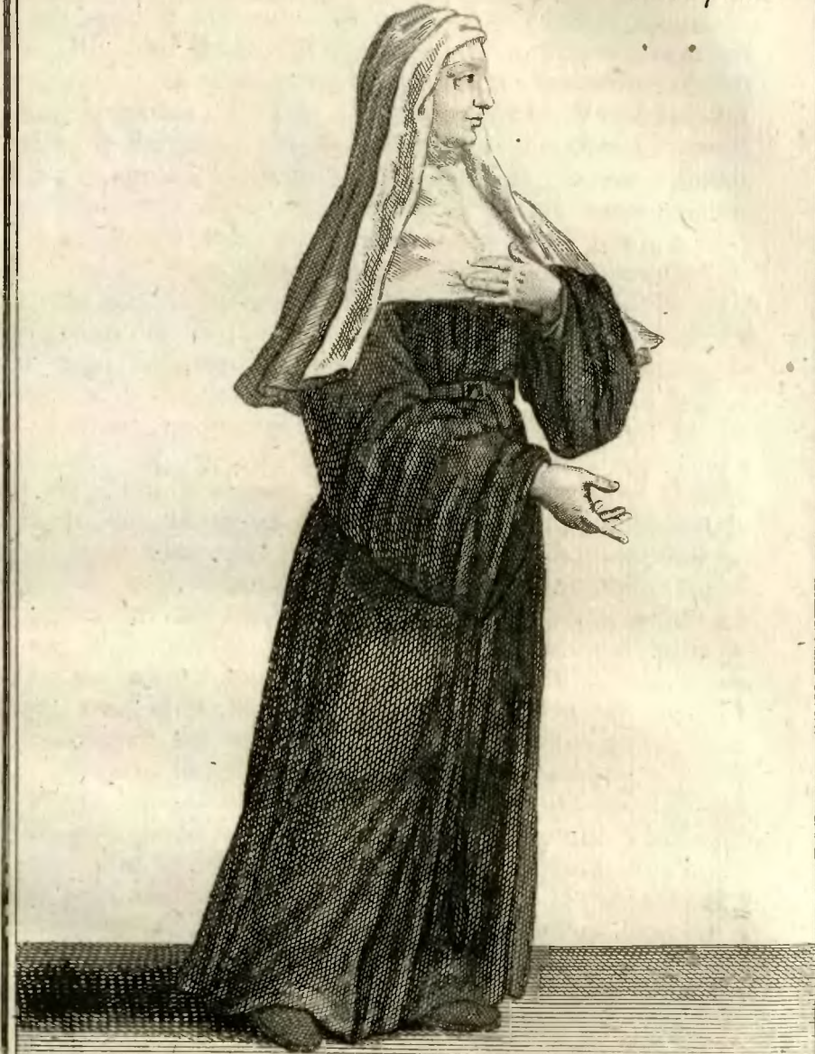
Sœur Converse Ursuline, de la Congrégation de Paris.