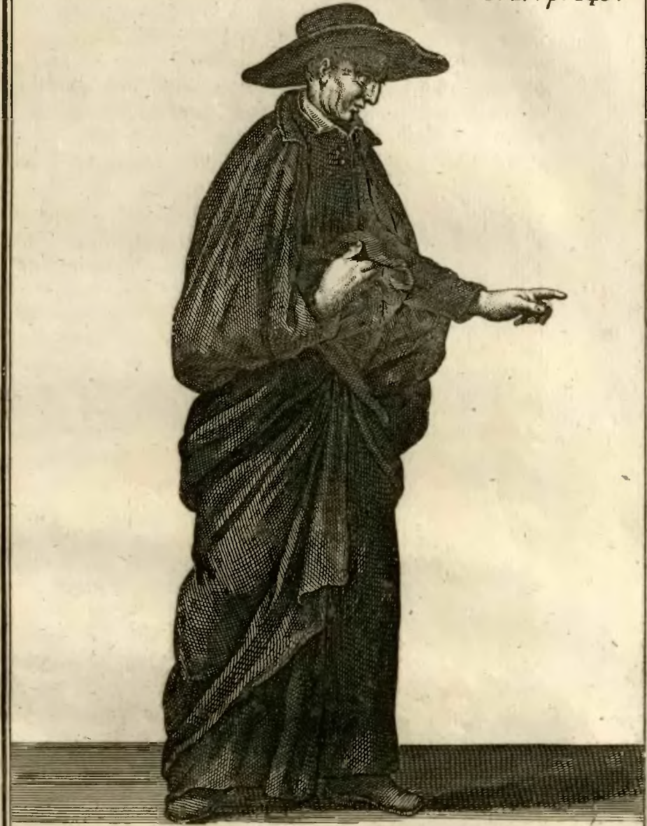
Prêtre de la Doctrine Chrétienne, en Italie .