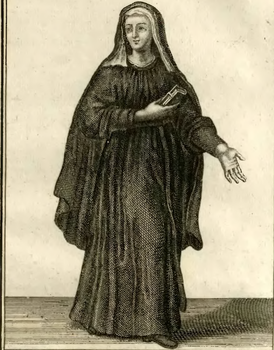
Ursuline du Monastère des SS. Rufine et Seconde, à Rome.