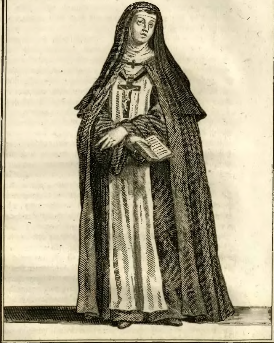
Religieuse de l'ordre de N.Dame de miséricorde, en habit de Cérémonies.