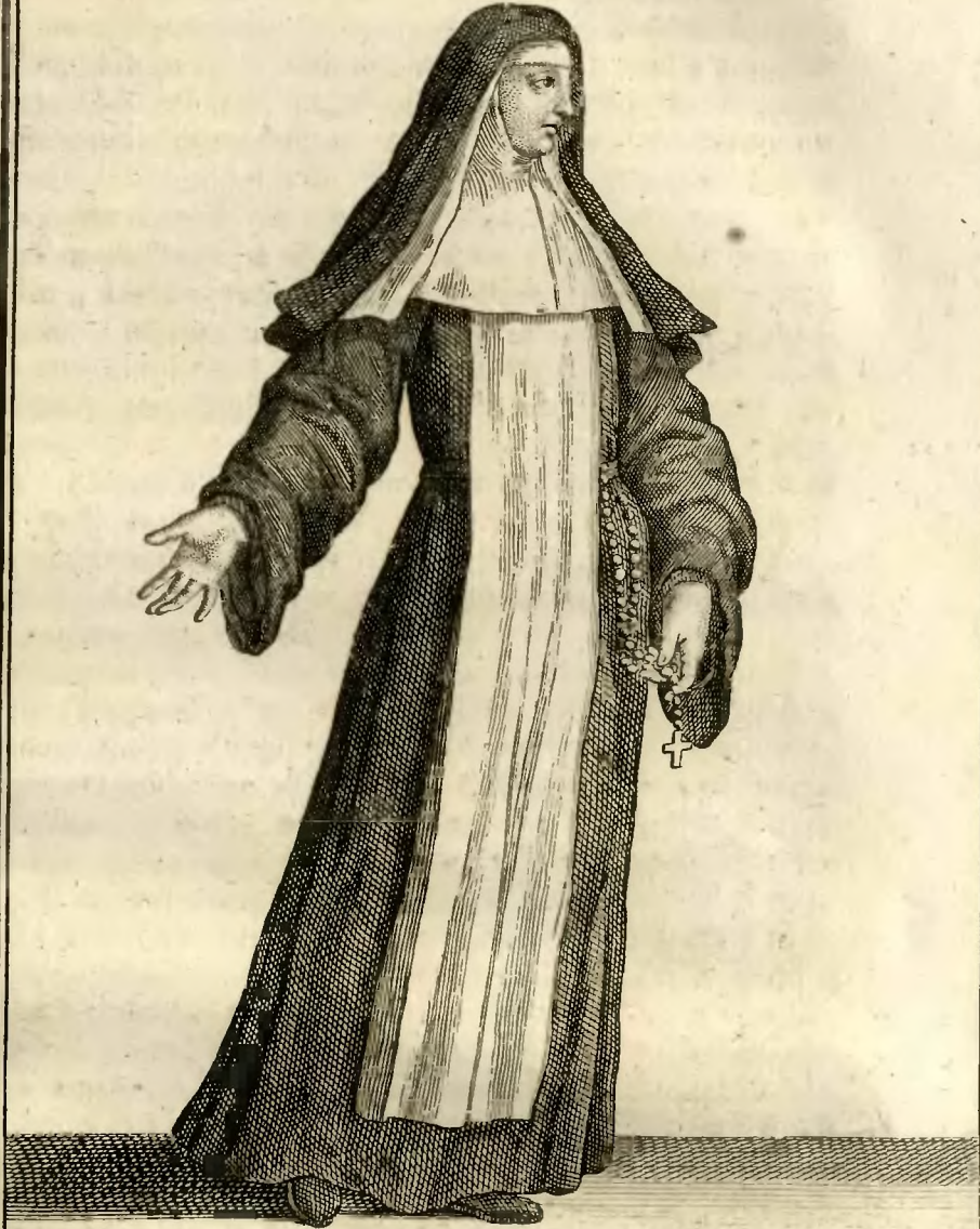
Religieuse de l'Ordre de N. Dame du Refuge, en habit ordinaire.