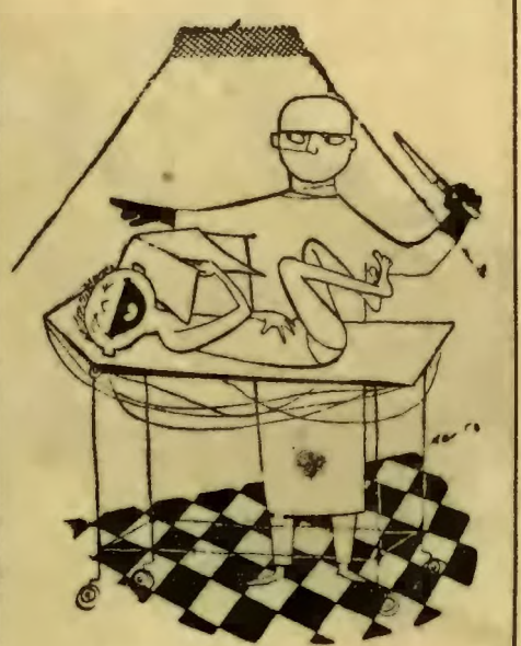
Chirurg: Zabierzcie mu do licha tego „Kocyndra”

Komenda hufca będzńskiego wyzwa pozostałe hufce Chora- wi Śląskiej do zorganizowania podobnej pracy społecznej har- cerzy.