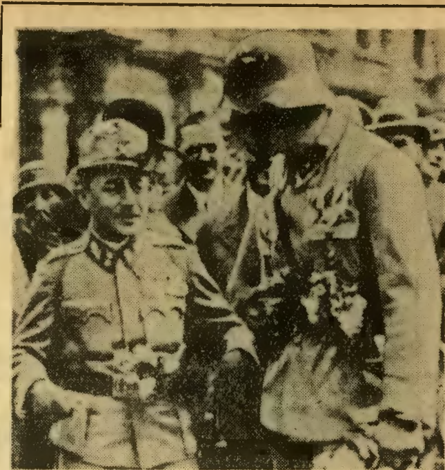
Podobnie jak Mussolini również Dollfuss lubił paradować w mundurze wojskowym. Zresztą i pod innymi względami stał się upodobnił do swego mistrza, o czym dowiedzieć się z publikowanego obok reportażu.

Zgłoszenia przyjmuje oraz udziela informacji o możliwości uzyskania mieszkań rodzinnych Dział Zatrudnienia i Spraw Socjalnych przy ul. Gen. Sikorskiego 115.