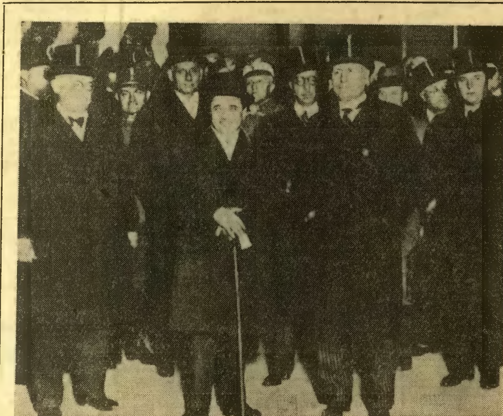
„Mały” dyktator i „duży” dyktator w czasie jednego z licznych spotkań. — Spotkania te miały charakter „kursów” ideologicznych, ponieważ Benito Mussolini pouczał swego kolegę dr. Engelberta Dollfussa jak rozciągać faszyzm w Austrii. Przyjaźń zapowiadała się świetnie, dopóki do gry nie wchodził się ten trzeci... czyli Adolf Hitler.