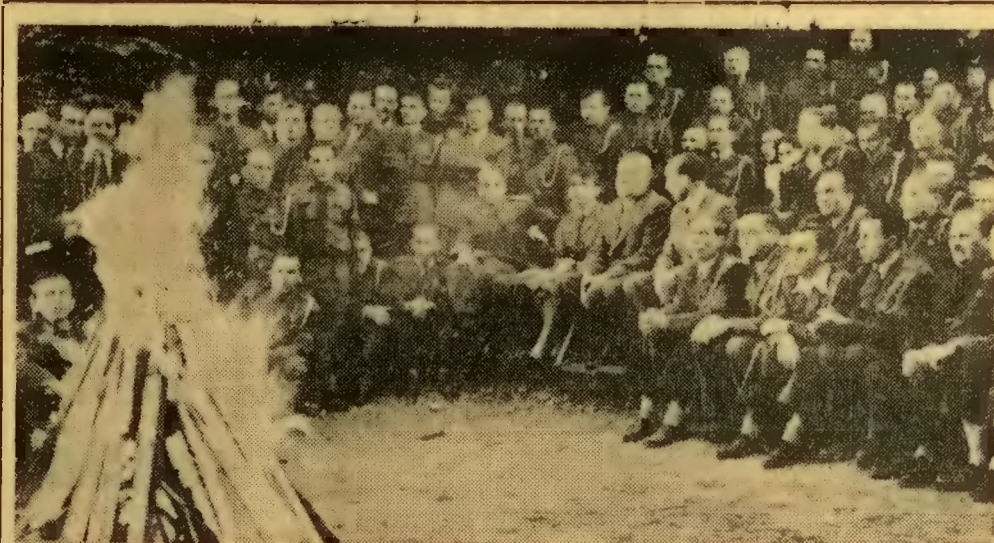
Jak już podawaliśmy, 31 maja br. prezes Rady Ministrów Józef Cyrankiewicz gościł u siebie członków zarządu komendanta hufców harcowskich. Na zdjęciu: przy ognisku w parku przed Pałacem Namieśnikowskim, w którym odbyło się spotkanie z premerem J. Cyrankiewiczem