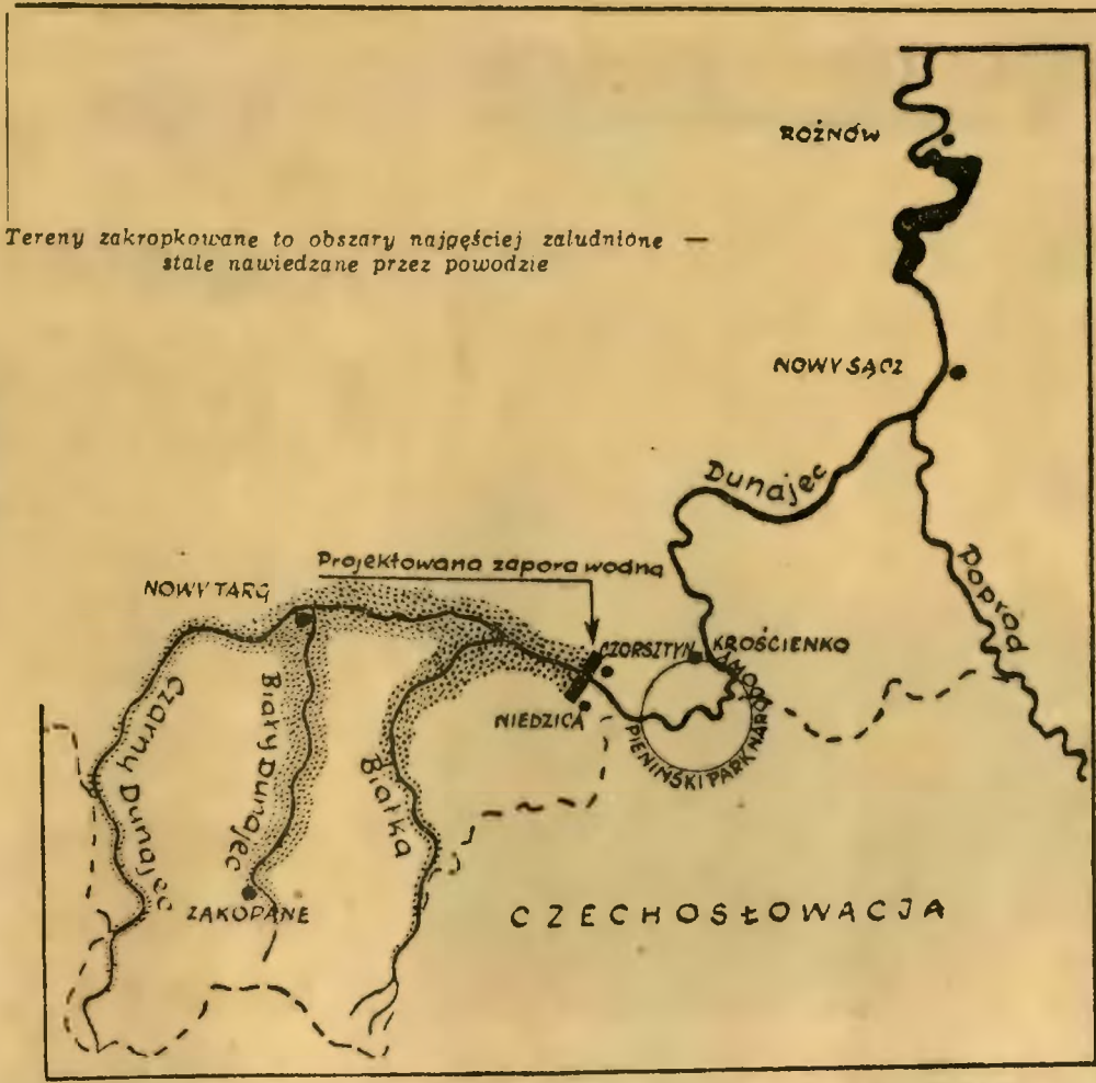
Tereny zakropkowane to obszary najczęściej zaludnione — stale nawiedzane przez powodzie

Wróćmy jednak do sprawy zasadniczej, albowiem projektanci udowodniali, że zbiornik w Czorsztynie uratuje nas od powodzi Tym-