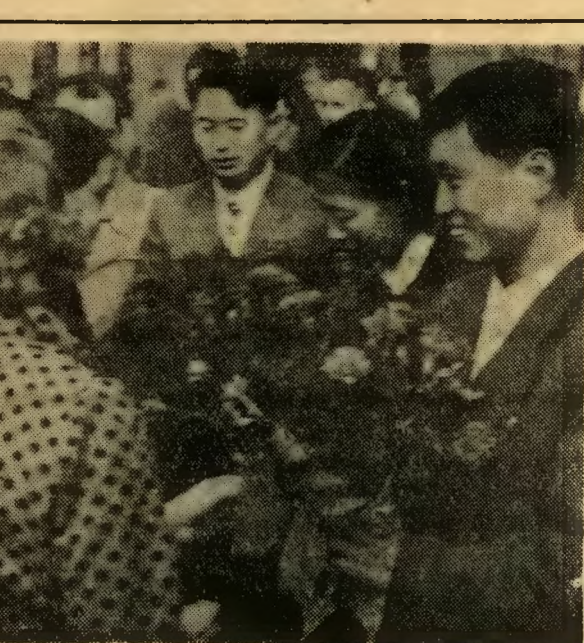
Serdeczne uśmiechy, kwiaty, podarunki dla delegacji chińskiej młodzieży.

Cenimy również przyjaźń łączącą nas z 600-milionowym narodem Chin Ludowych i jego armią.