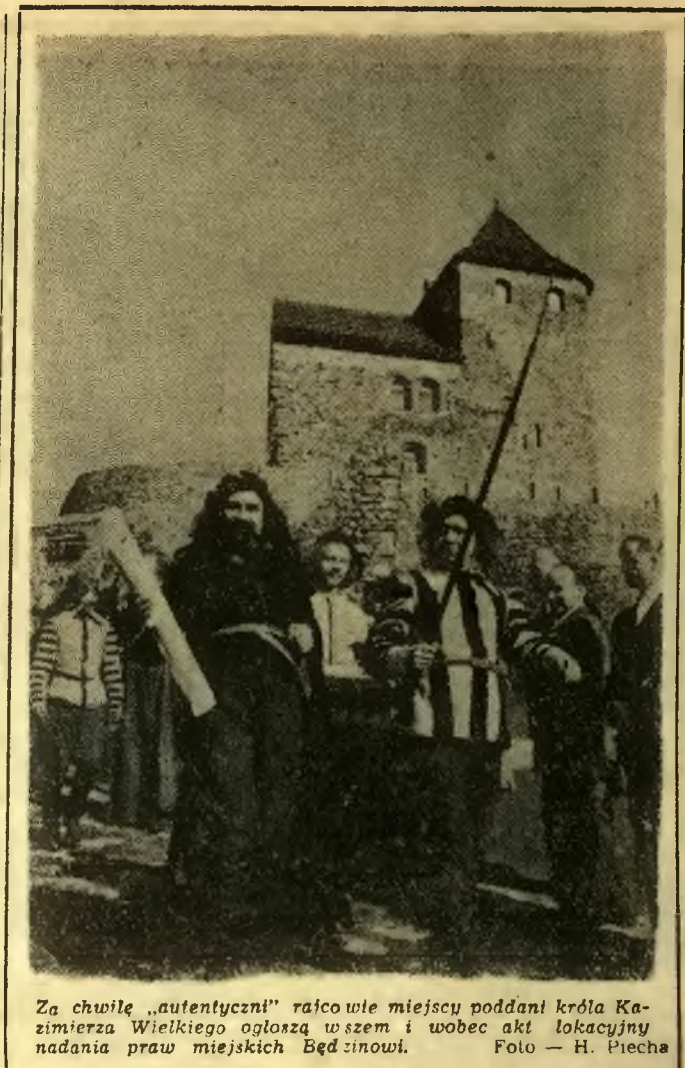
Za chwilę „autentyczny” rańca wie miejscy poddani króla Kazimierza Wielkiego ogłoszą u siebie i wobec akt lokacyjny nadania praw miejskich Będzinowi.

Zł 5.000 — nr 432147. Zł 1.000 — nr nr 2209, 45888, 57445, 208123, 225013, 423282, 469063, 504087, 527063, 660808, 753350, 916294, 916989, 970067. Zł 500 — nr nr 4372, 15349, 57448, 61041, 73105, 145251, 162598, 171189, 208123, 225014, 225018, 225019, 239051.