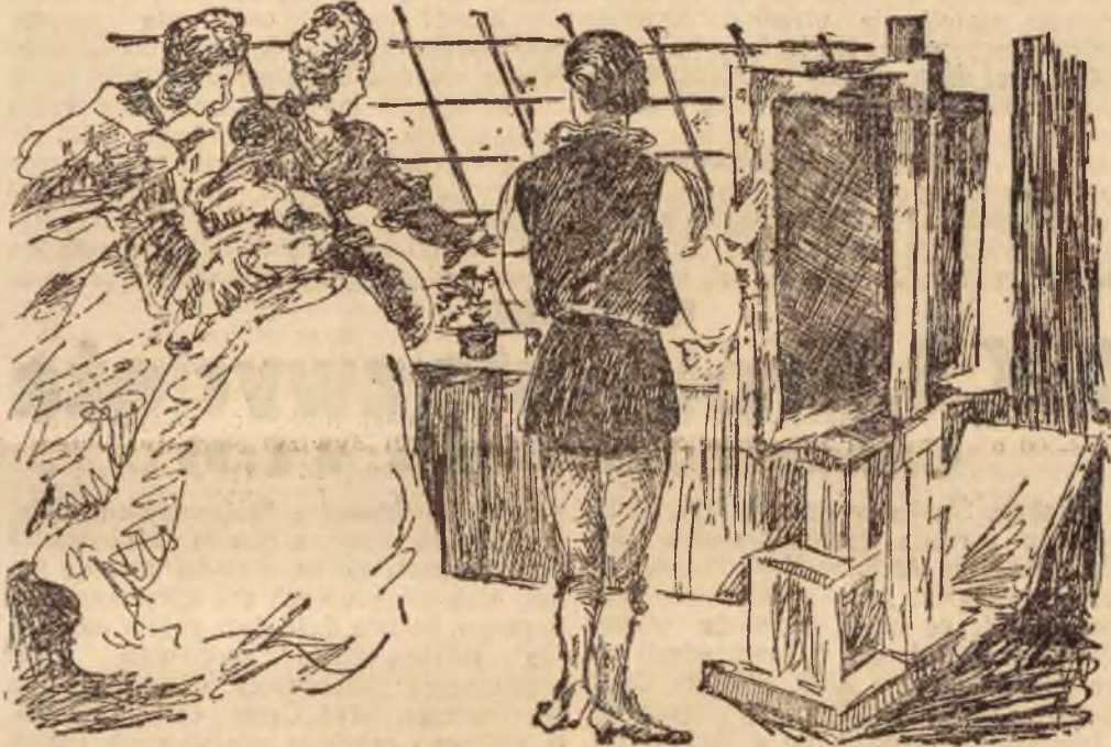
Margrabina Pompadour wyjrzała przypadkowo przez okno