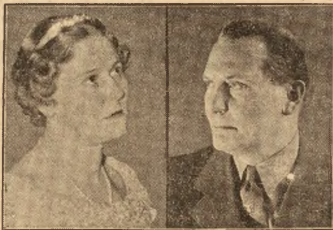
Na ilustracji nowożeńcy mi.

Na marginesie tej najnowszej imprezy, warto przypomnieć, co szeptacie sobie „plotkarski“ Berlin na ucho na temat ponownego małżeństwa Goeringa. Utrzymuje się mianowicie dotąd plotka, łącząca ściśle nazwiska Thyssen i Goeringa. Thyssen — to jeden z największych potentatów przemysłu niemieckiego. Należał on do najzamożniejszych wielbicieli Hitlera i na organizację dawał sumy ol-