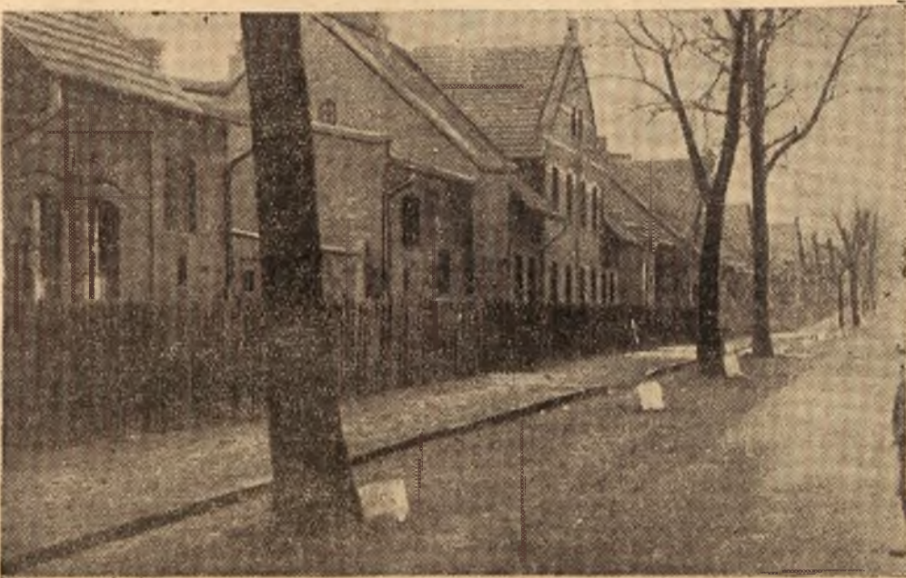
W Rybnickiej Kuźni walą się domy.