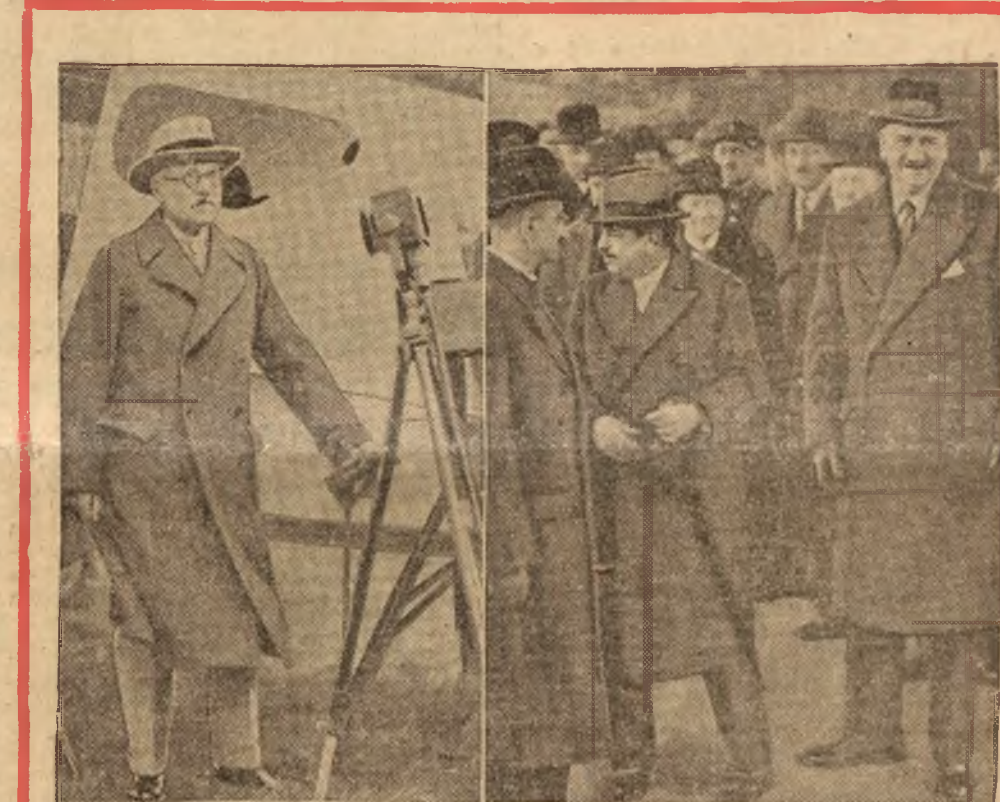
W przeddzień konferencji w Stresie: Premier angielski MacDonald przemawia przed odlotem z Londynu do mikrotonu. Na prawo: premier francuski Flandin oraz minister spraw zagranicznych Laval przed odjazdem z dworca paryskiego.

Wylosowane Bony wykupywane są przez Kasy Urzędów Skarbowych po 100 złotych za Bon 25-złotowy.