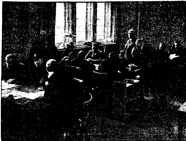
Punkt zborny dla Niemców, wracających do kraju.

Do pięknego słomkowego kapelusza, przypięta była ozdoba w postaci szklanej imitacji kilku gron wina. Widocznie