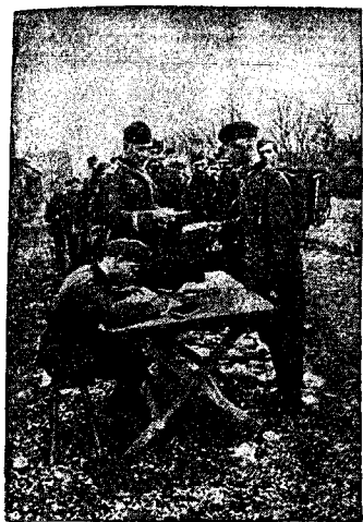
Wyplata żołdu żołnierzom niemieckim na froncie zachodnim.