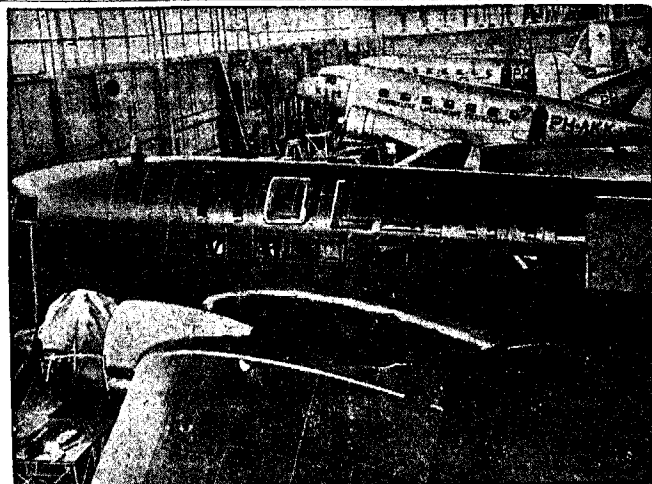
PANSTWA NEUTRALNE ZNACZA SWE SAMOLOTY. Aby uchronić swe samoloty od ostrzelania, holenderskie towarzystwo komunikacji olinowej KLM, belgijskie — Sabena i szwedzkie — ARA, znaczą swe samoloty linią koloru pomarańczowego. — Na ilustracji holenderski samolot komunikacyjny, oznaczony linią pomarańczową i nową krajową.

Londyn, 2 grudnia. Minister gospodarki wojennej oświadczył, że w wypadku, gdyby państwa neutralne próbowały swoje okręty handlowe z załadowanymi towarami niemieckimi pochożenia, zabezpieczyć towarzyszącymi okrętami wojennymi, to Anglia ma prawo zmusić okręty do zatrzymania się i prawo zabrania, oraz ma prawo zarekwirować wiezione towary.