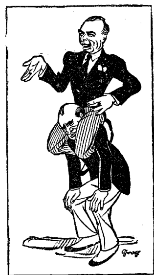
HORE-BELISHA i DALADIER. „Unia między Anglią i Francją jest teraz nierozdzielna - kochany Daladier!”

ców, Włoch, Japonii i Z. S. R. R. Współpraca wzajemna tych czterech narodów mogłaby się z czasem szeroko rozwinąć; naturalnie nie może ona sięgać granicy wpływów kontynentalnych Japonii. Shiratori dodał na koniec, że zawarcie związku Japonia - Niemcy - Włochy - Rosja Sowiecka uregulowałyby konflikty w Chinach. Uporządkowanie takie uznano za bardzo konieczne. Japonia dzieło obrony narodowej uważa za wykonane. Shiratori zakończył swoje przemówienie apelem do Rosji Sowieckiej, by zastanowiła się nad nawrotem do nacjonalizmu.