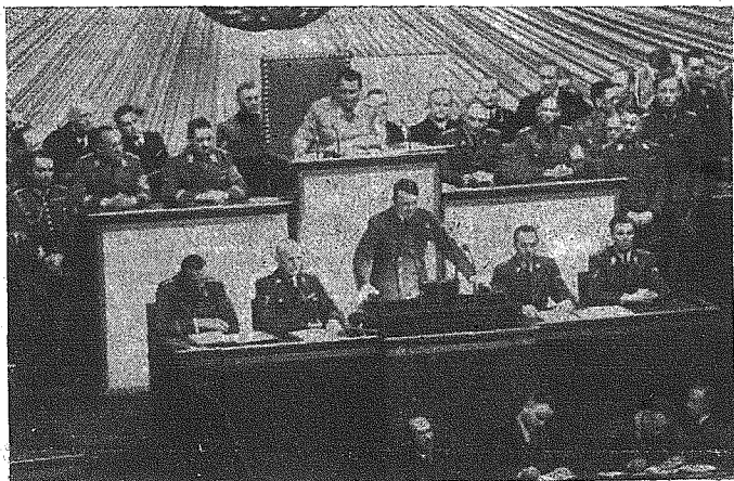
Historyczne posiedzenie Reichstagu po zwycięskiej kampanii bałkańskiej. — Kanclerz Hitler przemawia.

Bagdad, 8 maja. — Lotnicy angielscy zrzucili ułotki, skierowane do ludności Iraku, w których oświadczają, że Anglicy nie zagrażają niepodległości ludów arabskich. W związku z tym prelegent radia bagdadzkiego stwierdza, że w Iraku znana jest wartość angielskich ułotek i przyrzeczeń i nie przywiązuje się do nich żadnego znaczenia. Ułotki angielskie będą miały w Iraku takie samo powodzenie, jak w innych krajach. Anglia dojdzie do przekonania, że z Irakiem walczą wspólnie cały naród arabski.