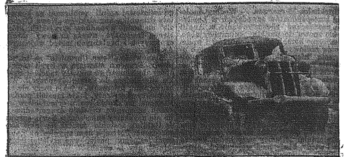
Płonące angielskie samochody wojskowe

Rzym, 18 czerwca. — Włoski komunikat wojenny z wtoru brzmi następująco: „W nocy z 15 na 16 czerwca bombardowano bazę marynarki La Valetta. Na terenie Afryki północnej, na froncie Sollum, trwała w ciągu wczorajszego dnia bitwa o nie słabnącem nasileniu. Nieprzyjacieli, przeciwko którym kierowane były kontrataki włoskie i niemieckie jednostek pancernych, poniosł poważne straty. W pierwszym dniu bitwy zniszczono przeszło 60 angielskich wozów pancernych. Jednostki włoskiej i nie-