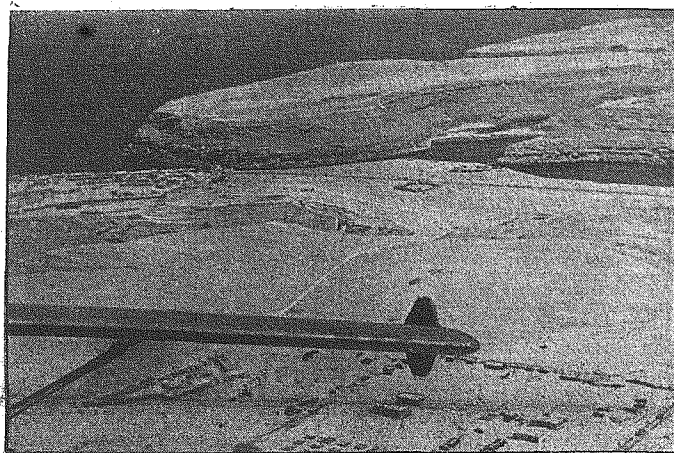
Widok na miasto i port Bardii nad granicą egipską

Po zwiedzeniu Montserratu w Barcelonie, arcybiskup Lyonsa ks. kardynał Gerlier wraz z towarzyszącym mu biskupem Carcassonne udał się w drogę powrotną do Francji.