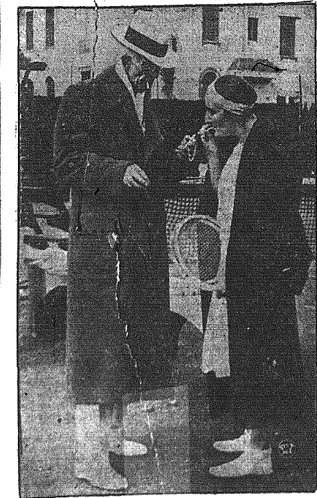
Król — po meczu. Sędziwy władca jest ciałem jeszcze jednym z czołowych tenisistów Szwecji, o czym niedługo będzie przekonali się zapalczywi młodsi od niego.