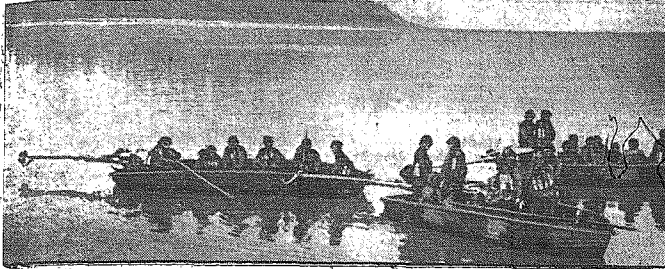
Oddziały fińskie nad Jeziorem Ładoga. — W łodziach szturmowych Jadą Finowie obsadzać wyspy.