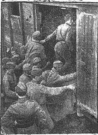
Na lewo: „Na Berlin!... — Iecz jako Jeńczy Jadą bolszewicy. — Na prawo: Sowietkie kobiety-żołnierze, wzięte przez Niemców do niewoli.