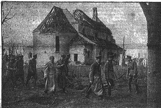
Jeszcze jedno zdjęcie ze spotkania Hitlera — Mussolini w Kwaterze Głównej na Wesołdzie. — Obaj wodzowie mocarstw osi przechodzą w otoczeniu swej świty okno zniszczonego przez bolszewików kościoła.

Dzisiaj wiele się już zmieniło w starej Europie a świeży powiew kieruje zwycięskim pędem armii europejskich na wschód, tak, że odnosi się wrażenie jak gdyby cień Boga przesunął się po ziemi.