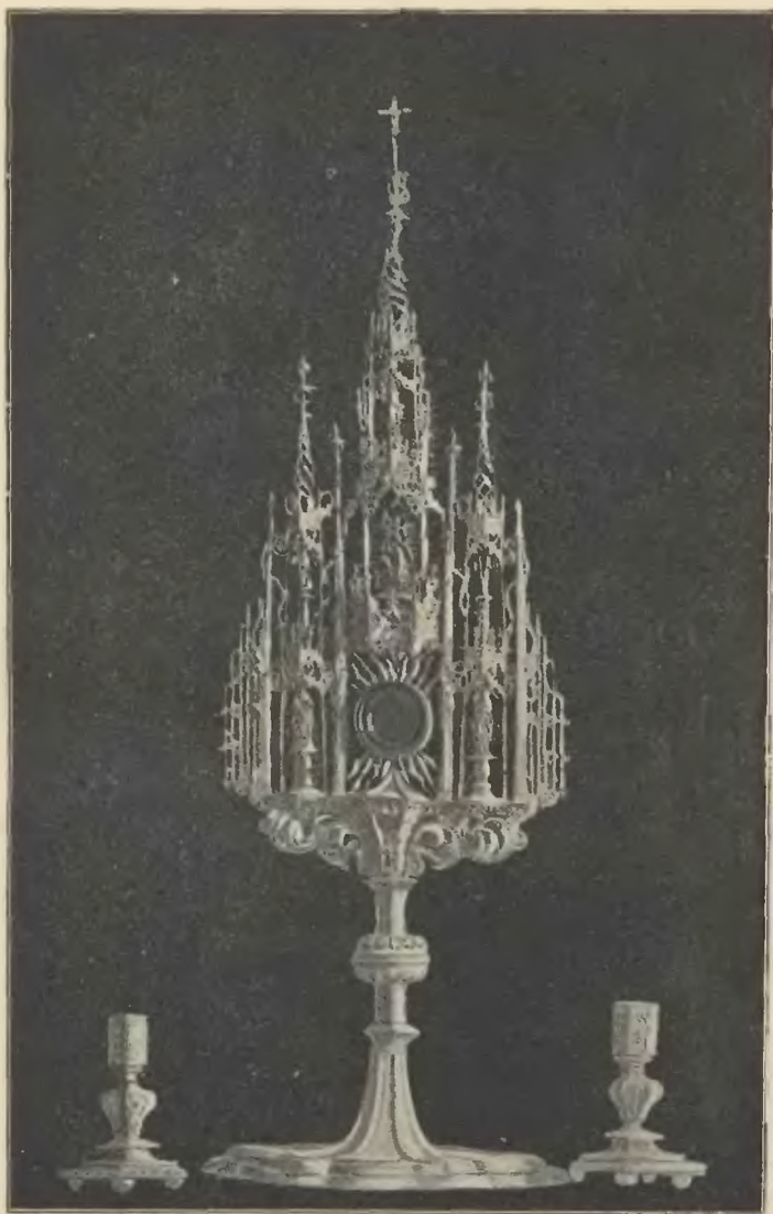
MONSTRANCYA, zwana ZYGMUNTOWSKĄ.