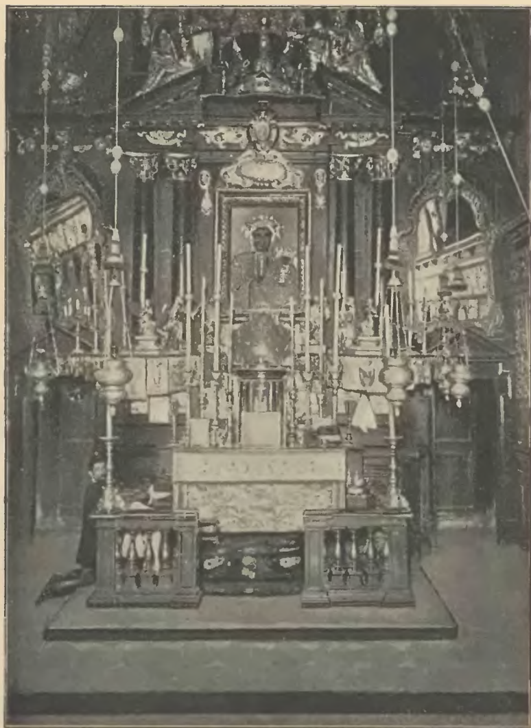
ÓLTARZ Z CUDOWNYM OBRAZEM MATKI BOSKIEJ CZĘSTOCHOWSKIEJ.