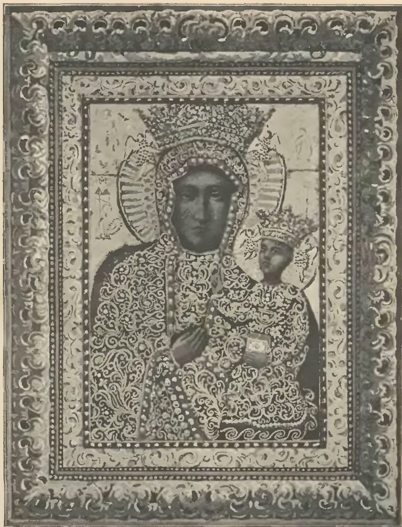
CUDOWNY OBRAZ MATKI BOSKIEJ CZĘSTOCHOWSKIEJ.