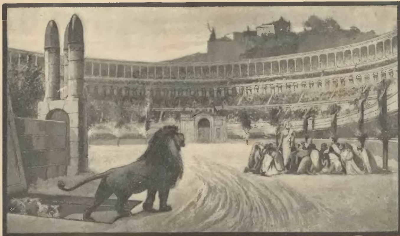
MĘCZEŃSTWO CHRZEŚCIJAN W CYRKU NERONA.

Do opowiadania „Z życia pierwszych chrześcijan.”