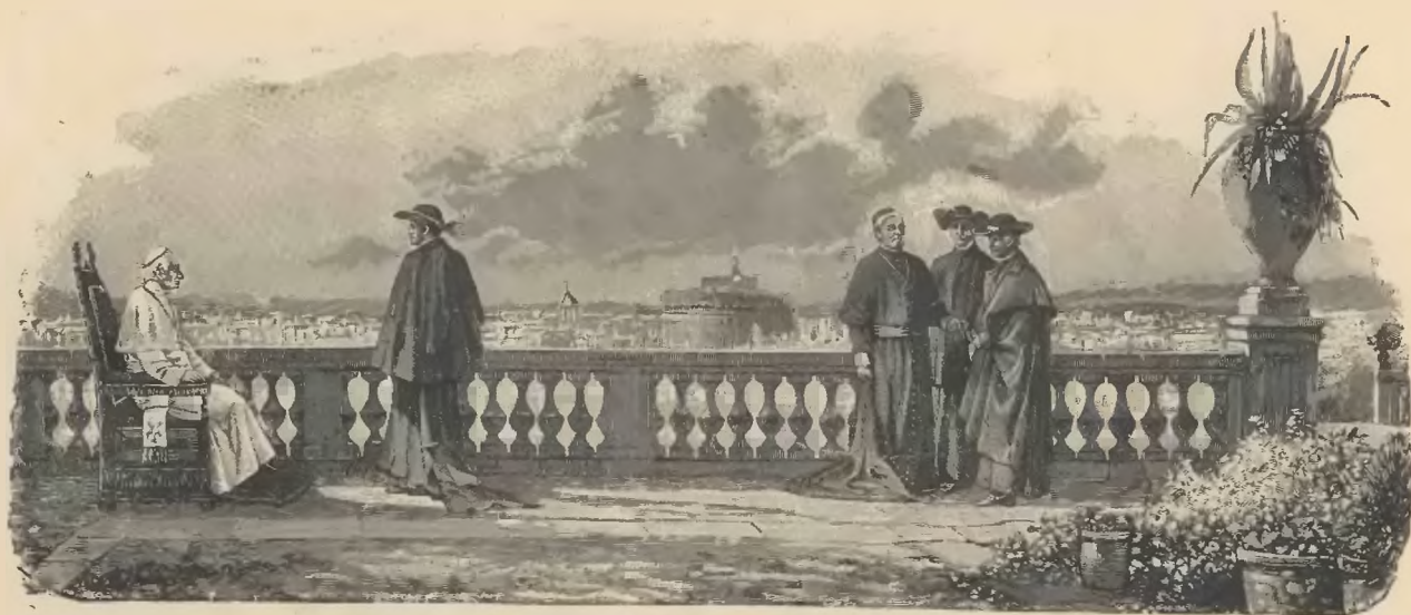
Jego Świątobliwość LEON XIII, 1 Wielki Papież, w chwili wypoczynku na tarasie w ogrodach watykańskich.