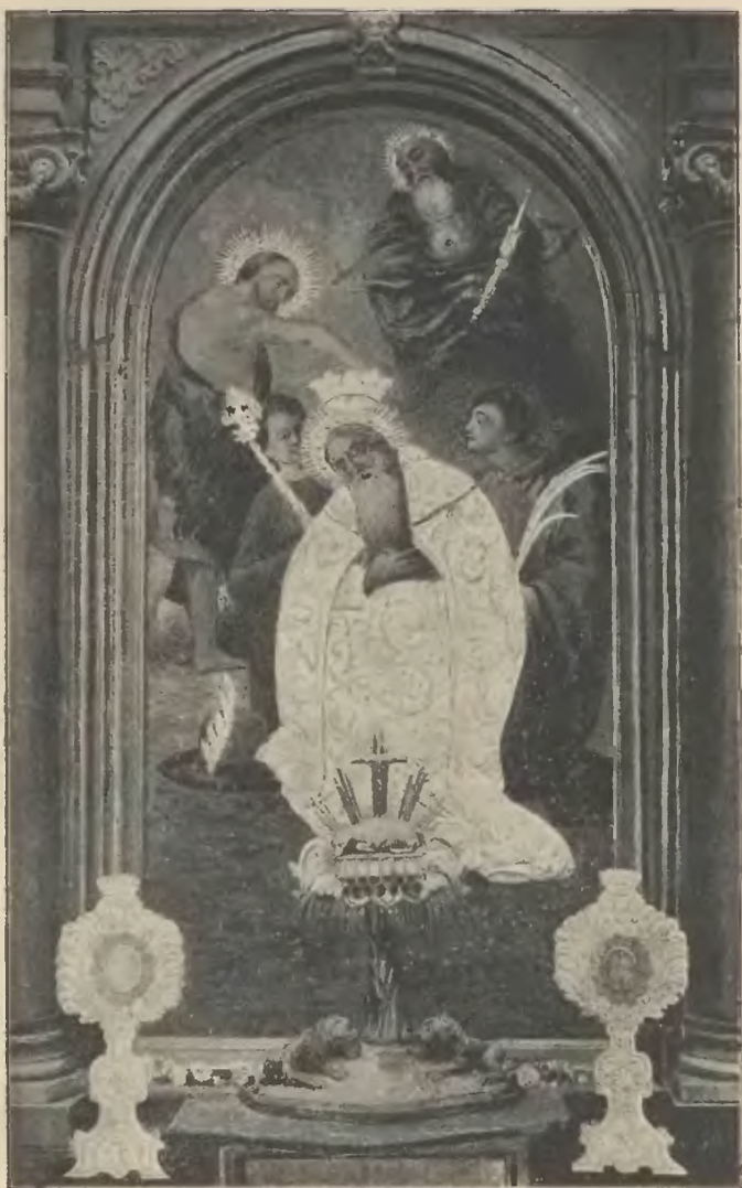
OBRAZ ŚWIĘTEGO PAWŁA PUSTELNIKA W KOŚCIELE JASNOGÓRSKIM.