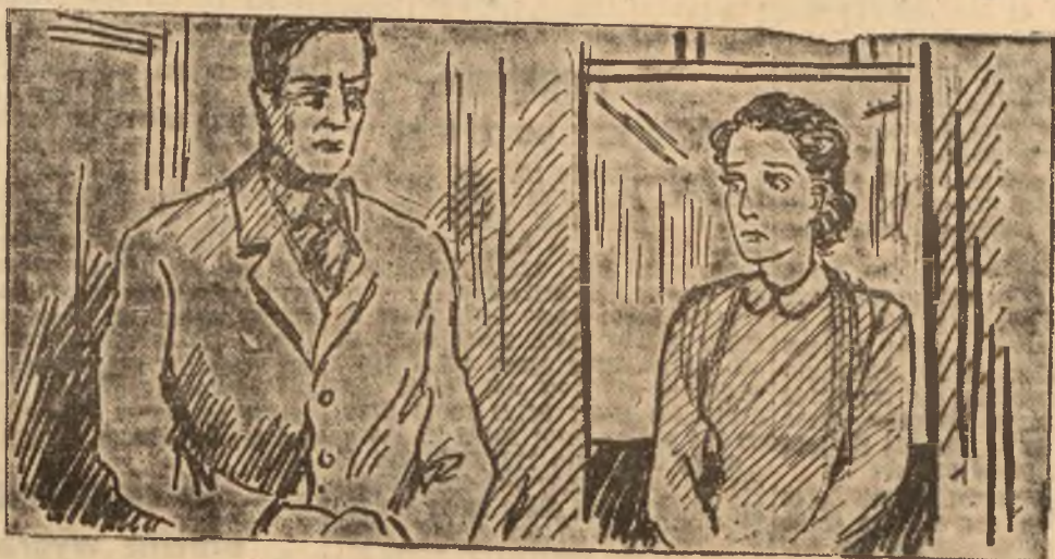
Na twarzy szeryfa odbiło się zakłopotanie

Na twarzy szeryfa odbiło się zakłopotanie.