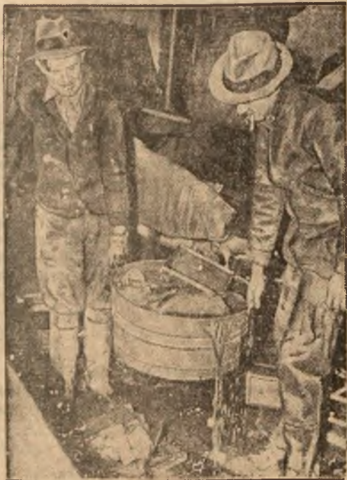
Mieszkańcy Louisville szukają w ziarnie swęge dobytku po ustąpieniu wód rzeki Ohio.