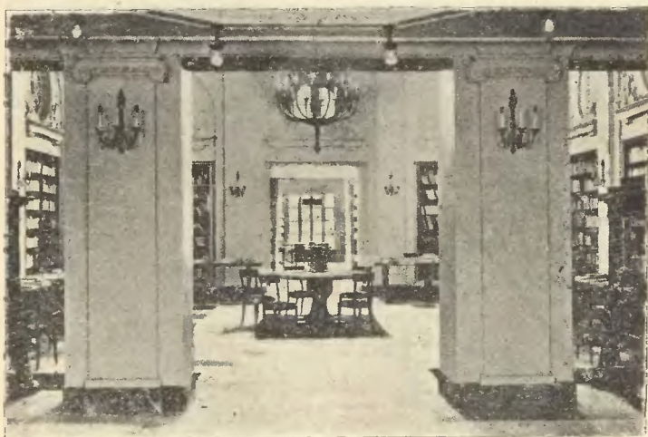
PERSPEKTYWICZNY WIDOK W GŁĄB KSIĘGARNI „BIBLIOTEKA POLSKA“