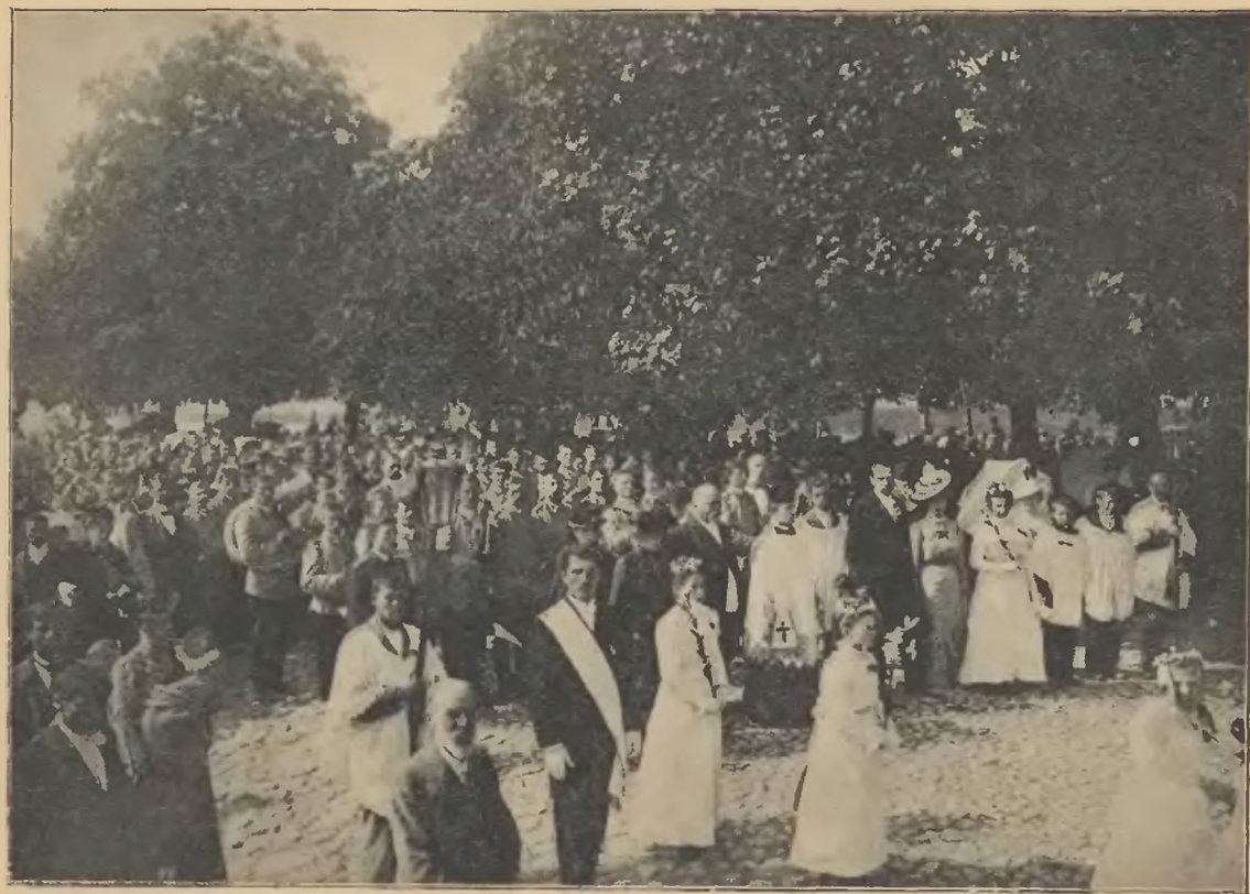
Kompania wrocławska pod przewodnictwem swych pasterzy.