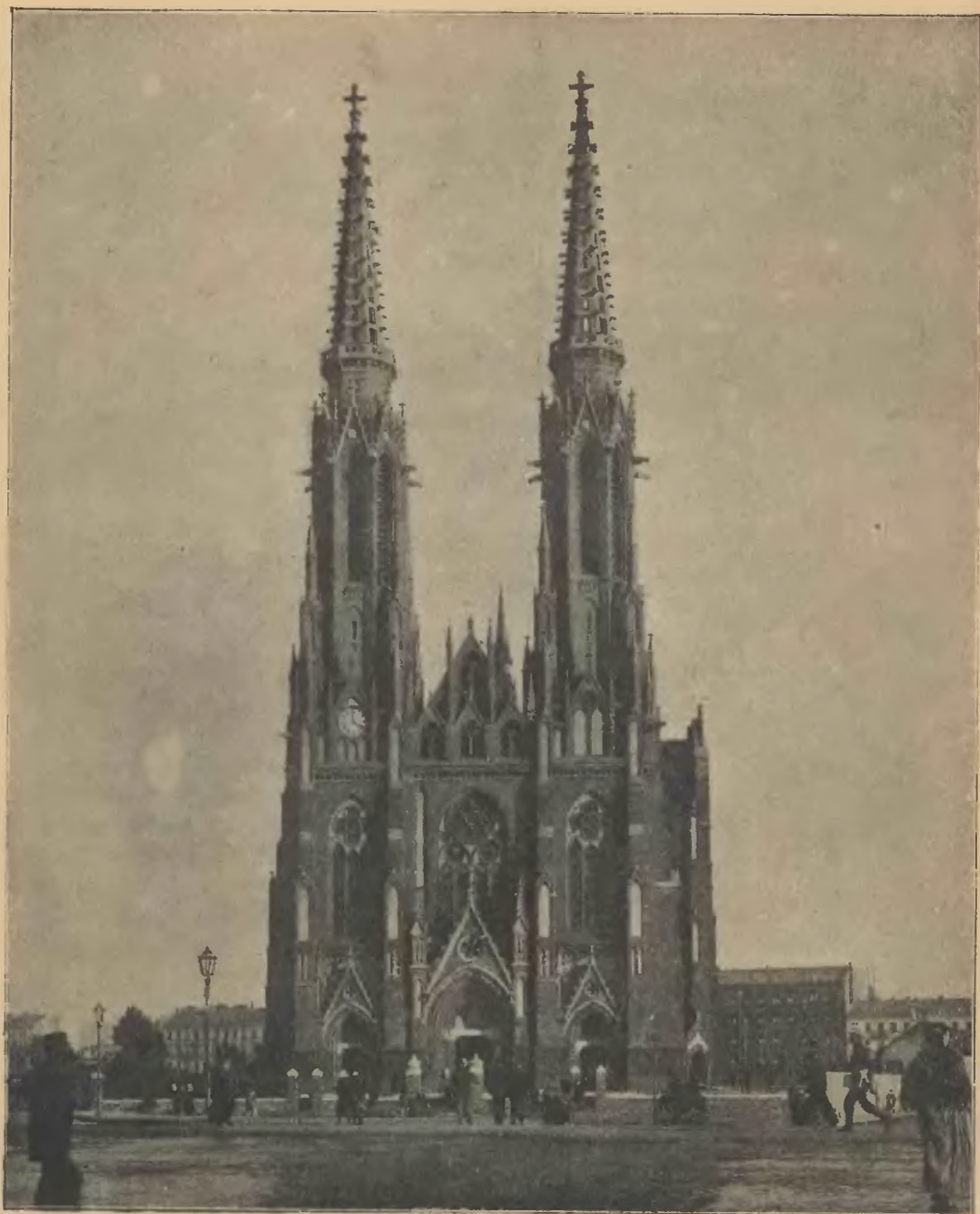
Nowy kościół na Pradze, w Warszawie.