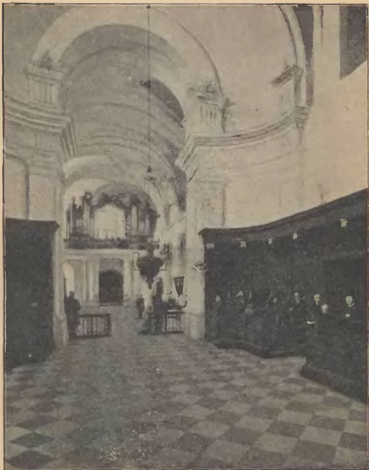
Wnętrze świątyni głównej w klasztorze Świętokrzyskim.