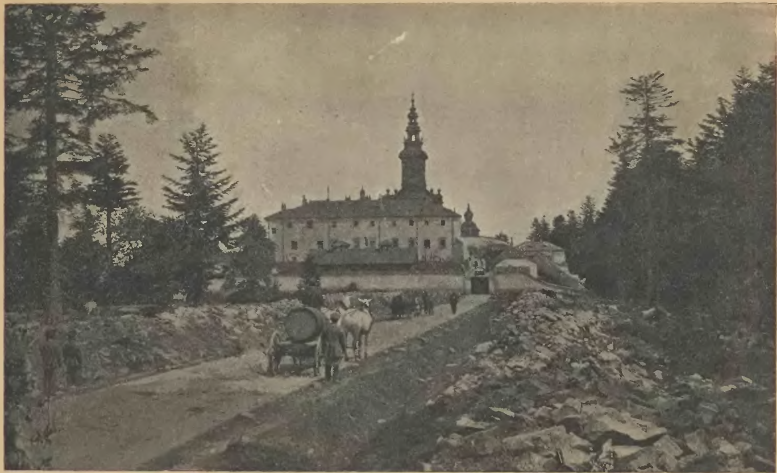
Klasztor Świętokrzyski na Łysej Górze.