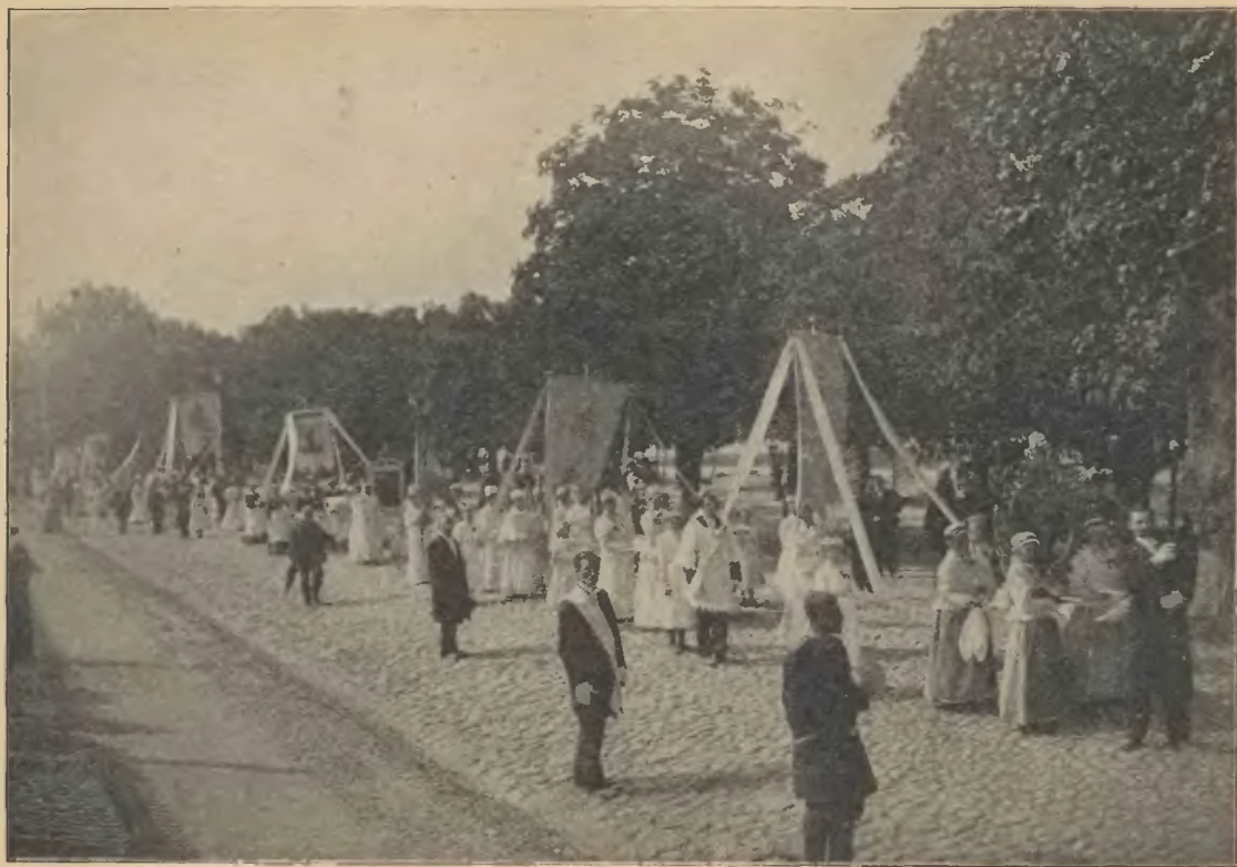
Kompania włocławska u stóp Jasnej-Góry.