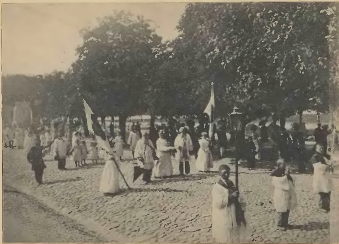
Kompania włocławska w pochodzie uroczystym.