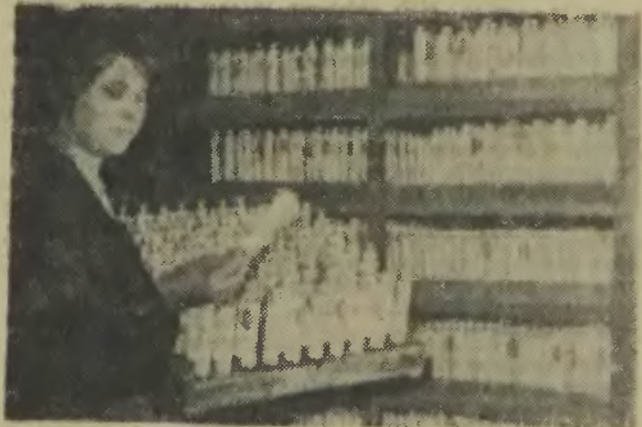
Gotowe tubki na krem

My już mieli kłopotu z nabyciem pasty do zębów. Z drugiej strony produkcja tych tub oplać się także „Mewie”, gdyż tylko nieznacznie wzrosło wkład pracy i zużycie materiałów. (zbg)