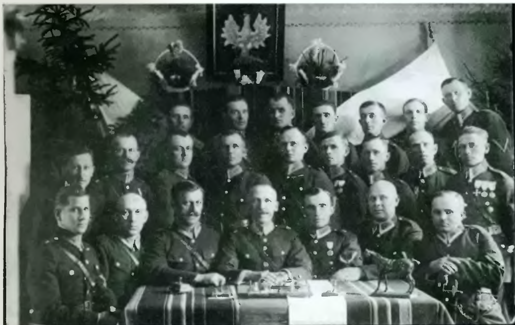
Komisariat Policji Państwowej w Czeladzi z 1938 roku