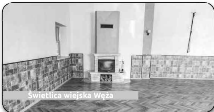
Świetlica wiejska Węza