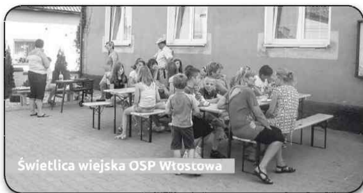
Świetlica wiejska OSP Włostowa