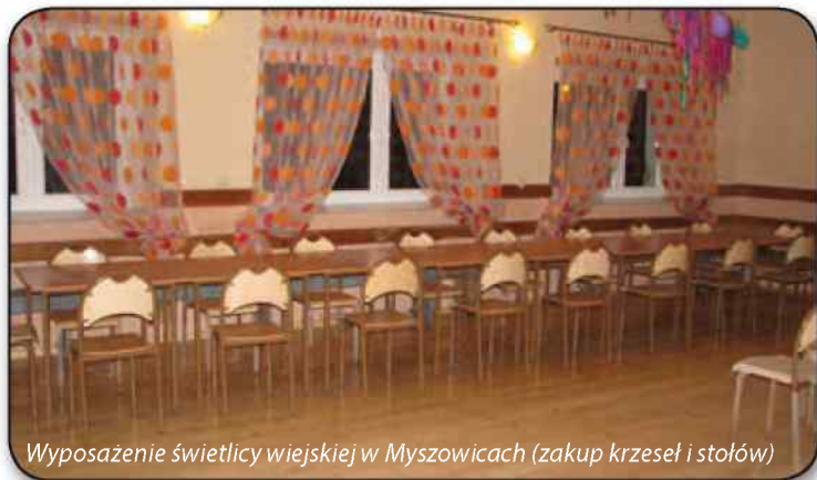
Wypożyczenie świetlicy wiejskiej w Mysowicach (zakup krzeseł i stołów)

Więcej o finansowaniu rozwoju obszarów wiejskich na str. 4,5