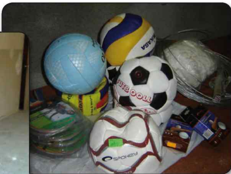
Zakup sprzętu sportowego w Rynarcicach