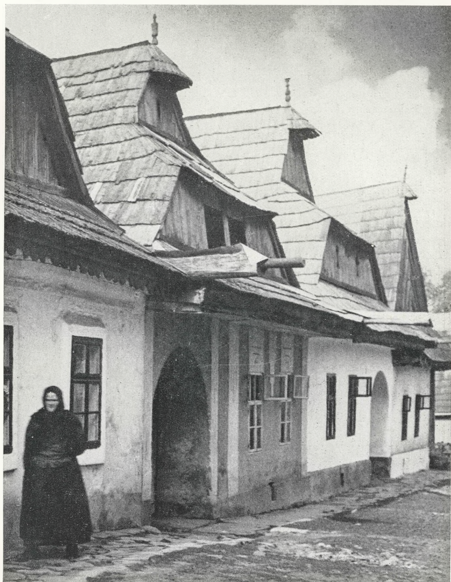
Zinsdach und Schopfdächlein