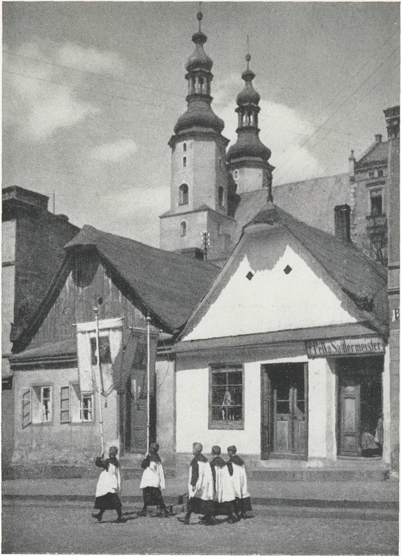
Simsdach und Schopfdächlein