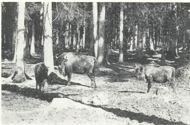
Wisentkub mit Kälbern