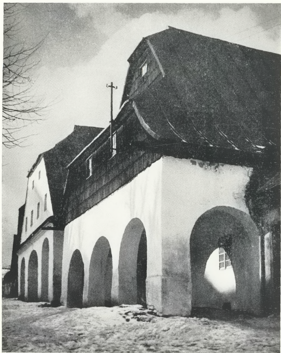
Eimsdach und Schopfdächlein