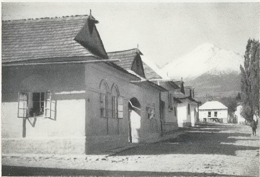
Simsdach und Schopfdächlein

Kieferstädtel bei Gleiwitz Neu-Walddorf, Zips