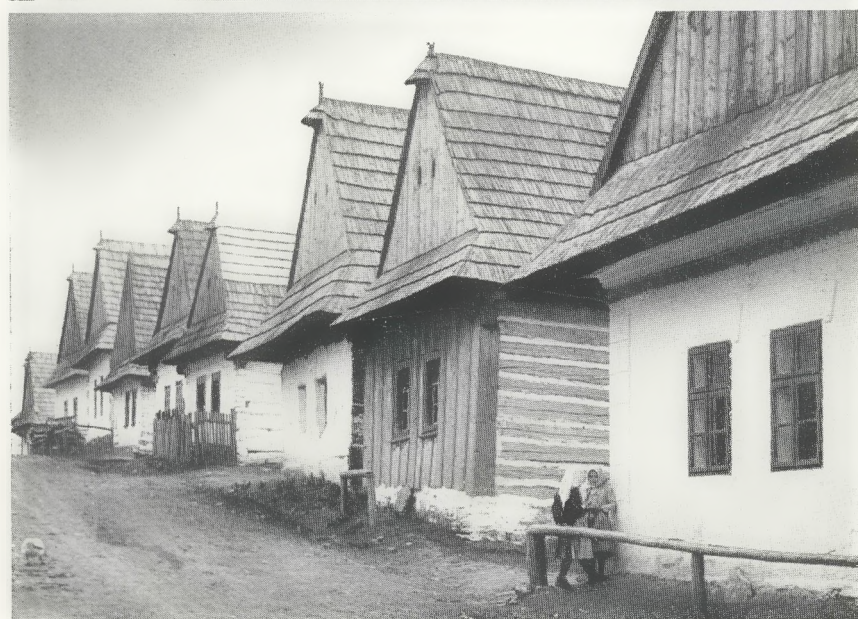
Simsdach und Schopfdächlein