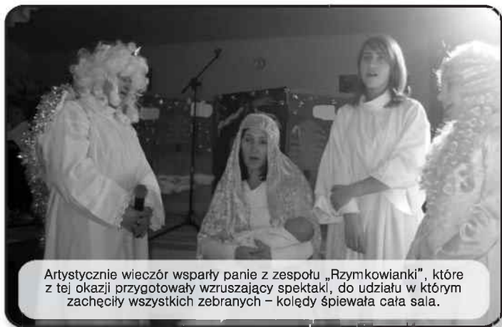
Artystycznie wieczór wsparły panie z zespołu „Rzymkowianki”, które z tej okazji przygotowały wzruszający spektakl, do udziału w którym zachęciły wszystkich zebranych – kolędy śpiewała cała sala.