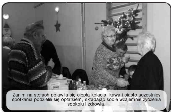
Zanim na stołach pojawiła się ciepła kolacja, kawa i ciasto uczestnicy spotkania podzielili się opłatkiem, składając sobie wzajemnie życzenia spokoju i zdrowia.