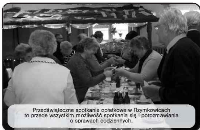
Przedświąteczne spotkanie opłatkowe w Rzymkowicach to przede wszystkim możliwość spotkania się i porozmawiania o sprawach codziennych.