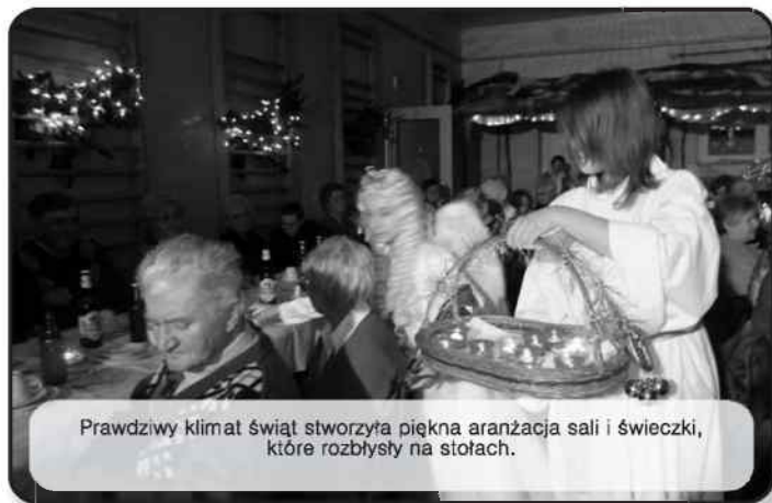
Prawdziwy klimat świąt stworzyła piękna aranżacja sali i świece, które rozbiły na stołach.