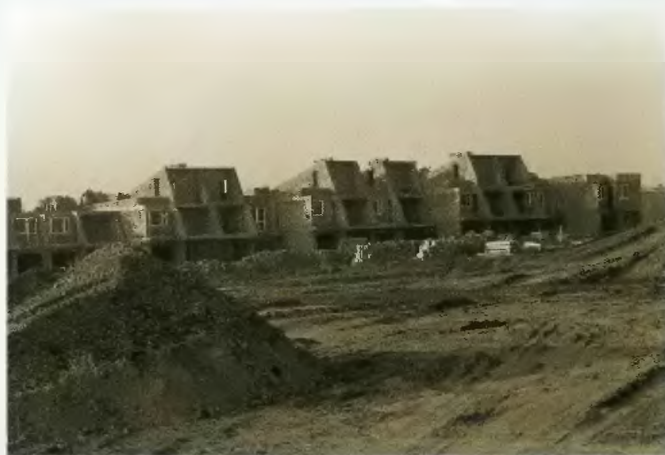
Osiedle domków jednorodzinnych „Słoneczne”