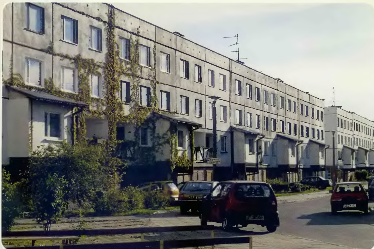
Osiedle „Dziekana III”