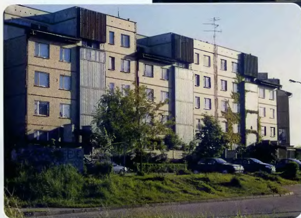
Budynki przy ulicy Norwida