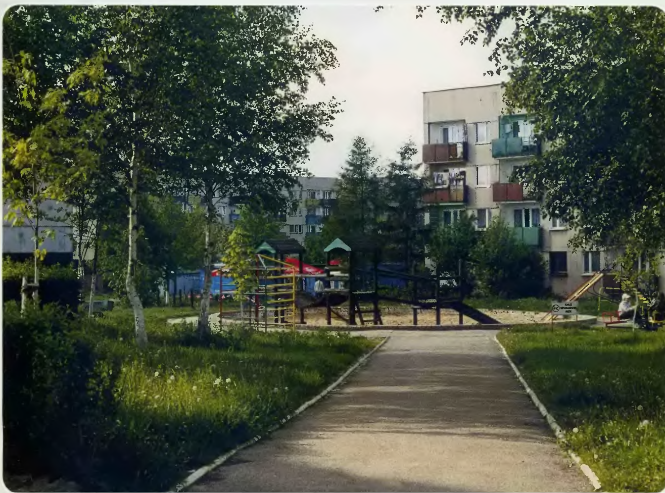
Osiedle Piłsudskiego (dawniej Rożka)