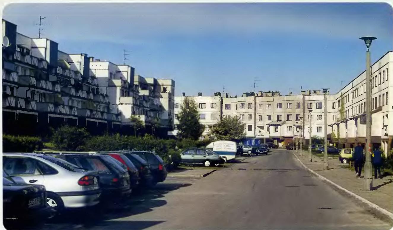
Osiedle „Dziekana III”