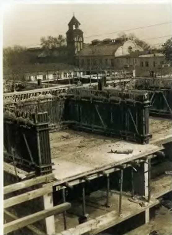
Budynki przy ul. Miłej