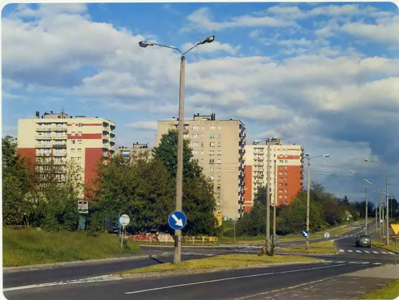
11 kondygnacyjne budynki przy ulicy M. Auby