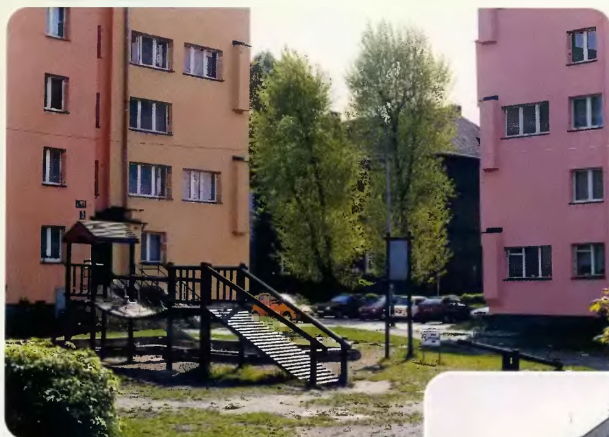
Budynki przy ul. Dehnelów,