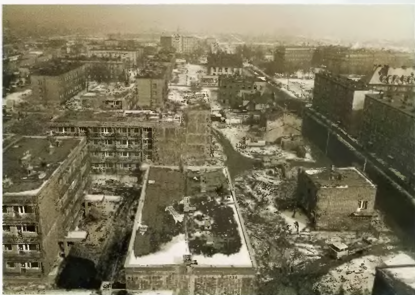
11 kondygnacyjne budynki przy ul. Ogrodowej

O kres lat 70-tych i 80-tych w Spółdzielni to intensywny rozwój budownictwa mieszkaniowego i infrastruktury towarzyszącej. Działyły już wtedy świetlice osiedlowe, proponujące dzieciom i młodzieży udział w licznych imprezach kulturalnych i kółkach zainteresowań m. in. fotograficznym, sportowym, plastycznym itd. Nie ulega wątpliwości, że to właśnie Spółdzielnia w znaczący sposób przyczyniła się do wielu pozytywnych zmian zachodzących w wyglądzie i architekturze miasta. Powstające osiedla rozwiązały problemy mieszkaniowe wielu Czeladziom jak i rodzinom przybyłym z innych regionów. Na koniec grudnia 1980 r. wielkość zasobów Spółdzielni