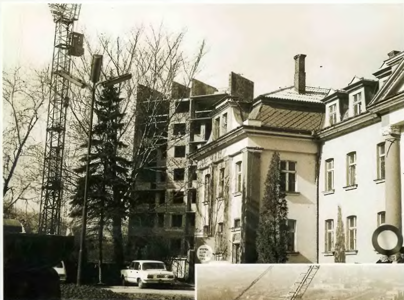
11 kondygnacyjne budynki przy ul. Dehnelów

P ierwsze budynki stanowiące majątek nowopowstałej Spółdzielni to głównie zasoby dzisiejszego osiedla Musiała, Sadek, Górnicza, oraz starsze bloki osiedla Dziekana.