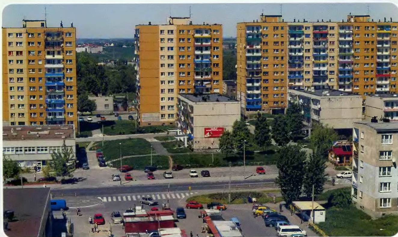
11 kondygnacyjne budynki przy ulicy Ogrodowej