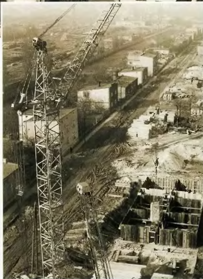
Budynki przy ul. Ogrodowej