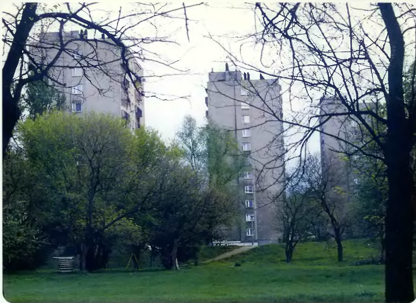
Budynki 11 kondygnacyjne przy ul. Dehnelów