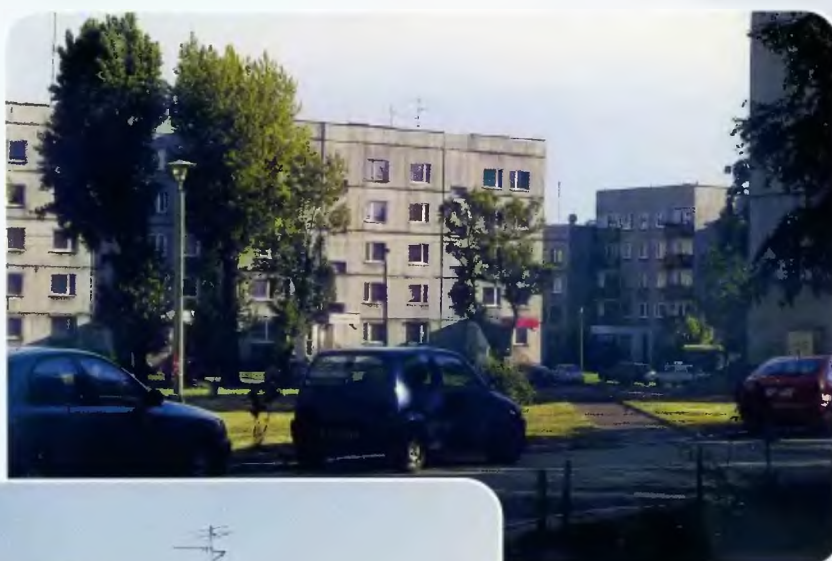
Osiedle „Dziekana II”