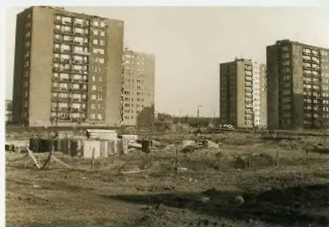
11 kondygnacyjne budynki przy ul. M. Auby