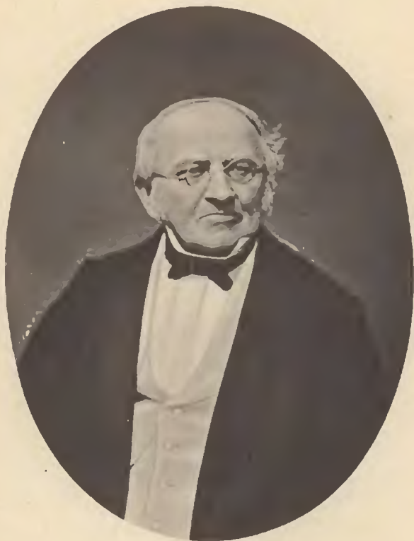
Heinrich Robert Goeppert.