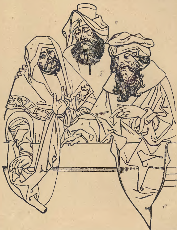
Gruppe der drei Männer der hlg. Anna aus dem Altar Nr. 8