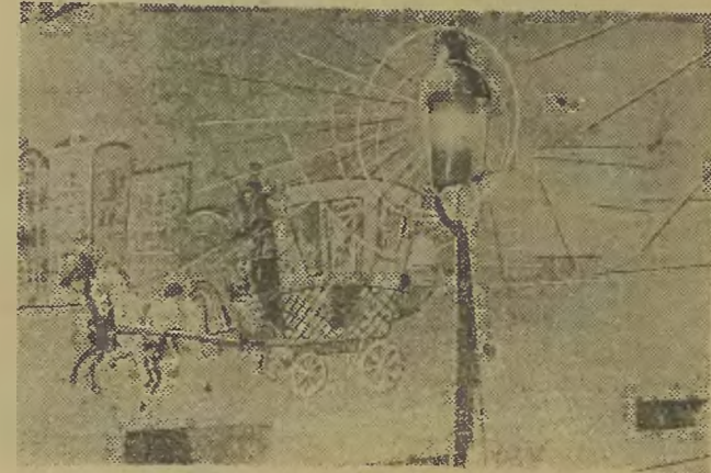
...i nastrojowa latarenka i wspaniały dyliżans... (włacz)