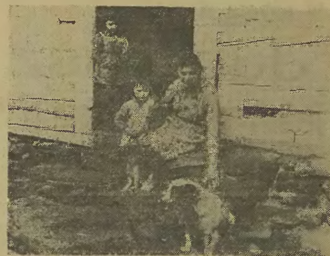
Ciepło, butów już nie trzeba

O starym szlaku przypomniał sobie miejscowy GS. W nowej kawiarence, o dumnym nazwie „Pod Pocztą”, zamieszkały artysta plastyk ucyzarował na ścianie mile panneau. Jest tu i nastrojowa latarenka i wspaniały dyliżans z parą rączych rumaków... (włacz)