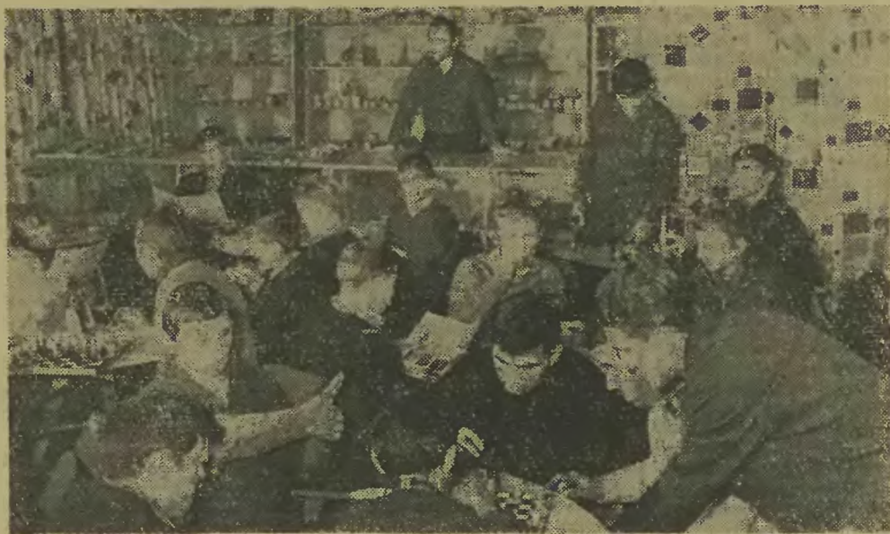
Przy lekturze i grach rozrywkowych — wraz z chłopcami ich opiekunowie.

biają od 16.00 do 18.00 — czeka na nich ciepły, smaczny posiłek, a później — miła kulturalna rozrywka. Mają też świetne warunki do nauki — spokój i odpowiednie wyposażenie wnętrz.