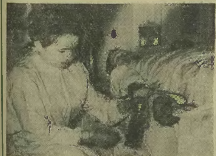
Sam zabieg pobierania krwi jest prosty. Odbывается jednak w warunkach pełnej higieny.

Przykład mieszkańców Ligoty znajduje niewątpliwie naśladowców. (kow)