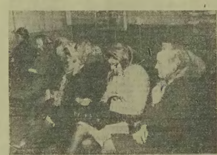
Może się dziś lepiej powiedzieć? Miejsce pracy nie brak, brak niestety niezbędnych kwalifikacji

będzie mógł zatrudnić do 1975 roku 15 tysięcy osób. W tym czasie trzeba wyszkolić robotników o wielu kwalifikacjach. Spełnić to zadanie może prawidłowo rozbudowane szkolnictwo zawodowe. Ale to temat osobny.