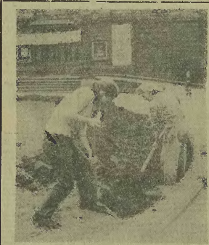
Pracownicy Zieleni Miejskiej przystąpili już do wstępnych prac przy klombie wokół „teatralnej” fontanny.

kontraktacji warzyw, która w 1970 r. ma osiągnąć 1.500 ton w skali rocznej. (Ho)