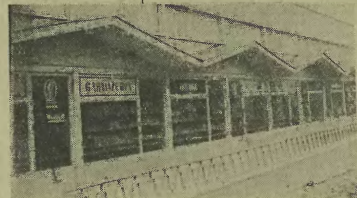
Front pawilonu handlowo-usługowego otwartego na ZORze VI.

Przyczyny wypadku bada Prokuratura Powiatowa w Bielsku-Białej. (ib)