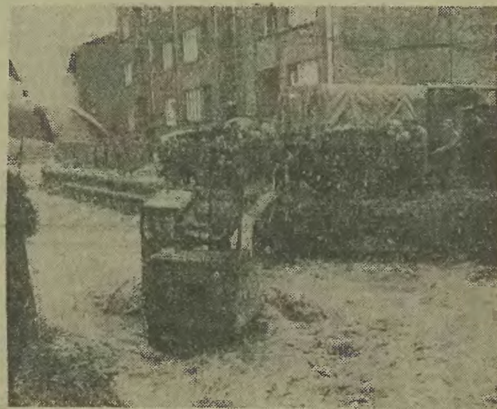
Dużym zaskoczeniem dla brygad pracujących przy budowie nakrycia Niwki był nagły przybór wody. Najbardziej ucierpiała koparka.

O szkodach, wyrządzonych przez powódź w powiecie bielskim, (Ciąg dalszy na str. 2)