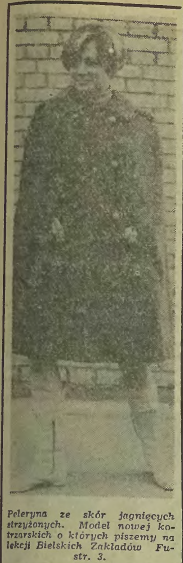
Peleryna ze skór jagnięcych strzyżonych. Model nowej kurtki z kapturkiem o których piszemy na łamach Bielskich Zakładów Fu- str. 3.