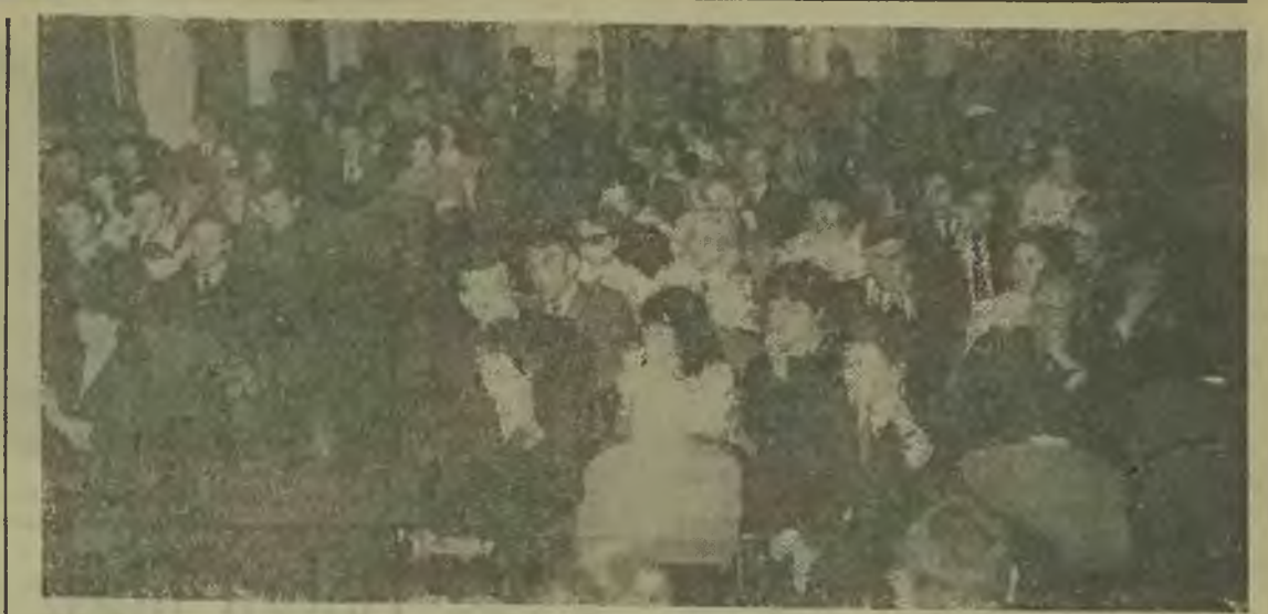
Młody aktyw ZMS z terenu miasta podczas sesji popularno-naukowej.

Rok bieżący zapowiada dalszą poprawę w tym zakresie. Pierwszy kwartał, w skali Zjednoczenia notuje 100-procentowe wykonanie planu. Znow ZPW Rychnińskiego przedstawia się najgorzej: styczeń 109,3, a marzec — 104,4. Jeszcze lepiej ilustrują to wyniki w ramach miesiąca. Pierwsza dekada marca w ZPW Rychnińskiego — 102,5 proc.,