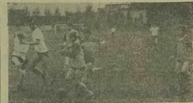
Atak Spartan na bramkę Zielonych.