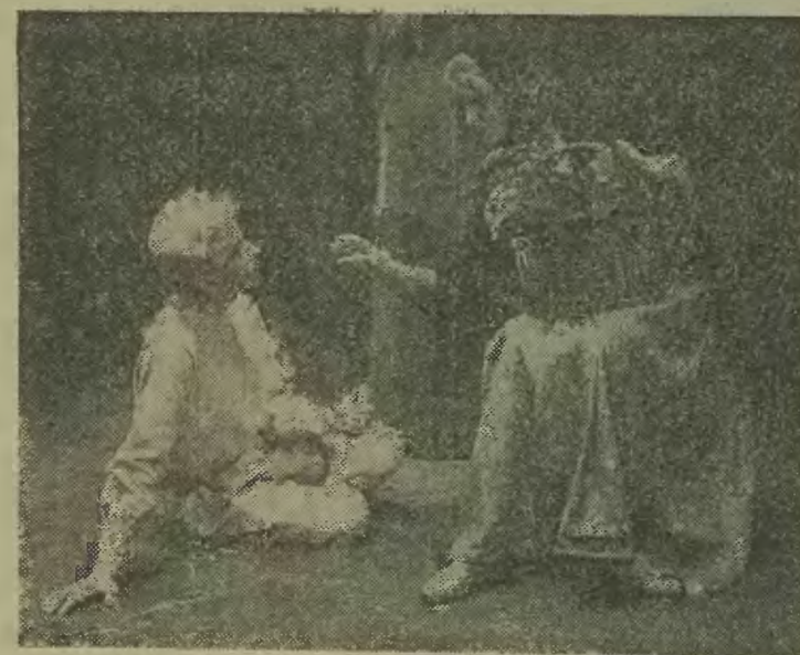
Pastuszek Jasio i zielarka — scena z bajki „Tajemnica starej wierzy”.