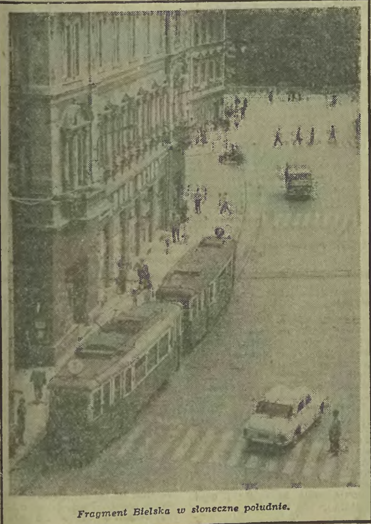
Fragment Bielska w słoneczne południe.

Uczestnicy VIII Babiogórskiego Rajdu Nocnego otrzymają pamiątkowe plakietki i zdobywać będą punkty do górskiej odznaki turystycznej GOT. (wl)