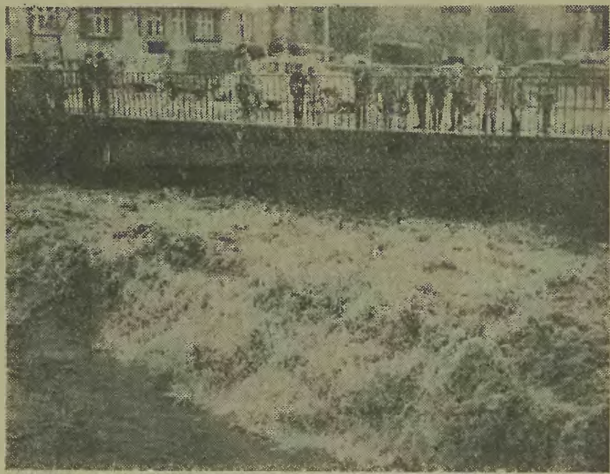
Wysokość wody pod mostem na Białej wynosiła blisko 4 m. Niewiele brakowało by woda popłynęła górą.