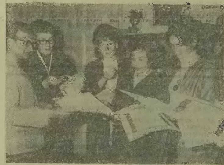
Uczniowie i wychowawcy ze szkoły nr 3 cieszą się z osiągniętych sukcesów sportowych.

W dniu 10 czerwca br. w Młodzieżowym Domu Kultury przy ul. Broniewskiego odbyło się podsumowanie wyników sportowych oraz działalności artystycznej szkół bielskich. W ubiegłym roku szkolnym młodzież bielska okazała się bardzo aktywna zarówno w działalności artystycznej jak i sportowej. Uczniowie szkół podstawowych startowali w wielu zawodach powiatowych, a także wojewódzkich odnosząc wiele cennych sukcesów. Zespoły taneczne, estradowe i recytatorskie brały również udział w imprezach miejskich i wojewódzkich. Dla najlepszych ufundowane zostały cenne nagrody w postaci sprzętu sportowego, medali pamiątkowych i dyplomów. Jedną z najlepszych bielskich szkół, która pod względem usportowienia i wyrobienia artystycznego przoduje, jest szkoła nr 10. Dzielnie dotrzymuje jej kroku szkoła nr 3. Nie sposób wymienić wszystkich laureatów i zwycięzców indywidualnych — jest ich naprawdę bardzo dużo. (he)