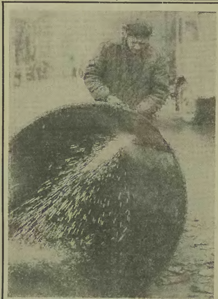
Miasto nasze ulega ciągłym przeobrażeniom. Zakłada się ciągi kanalizacyjne, wodne i ciepłownicze. Przy ul. Sempolowskiej dobiegają końca roboty przy budowie nowego rurociągu kanalizacyjnego.

Zaszczytnego wyróżnienia gratulujemy popularnemu „Włodziowi”. Oby żył i latał sto lat! (tap)