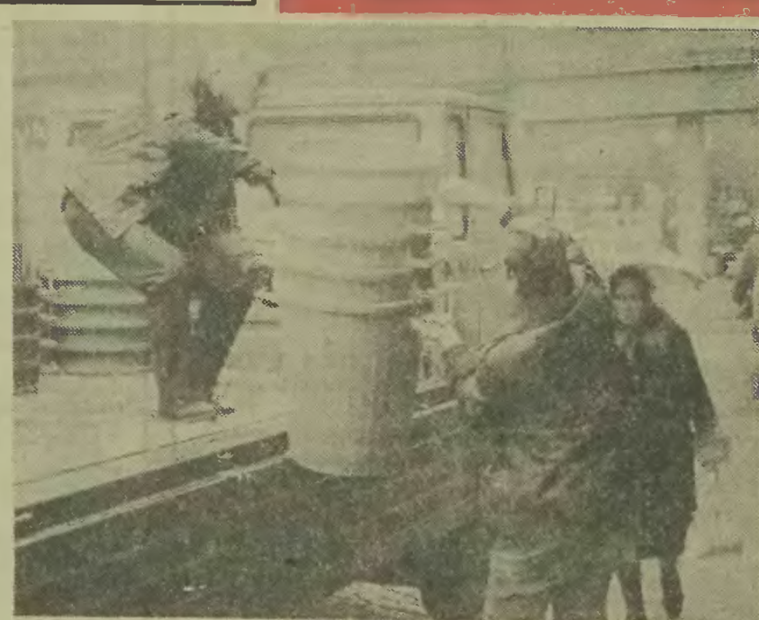
Ostatnio pojawiły się w naszych sklepach tanie i estetyczne pojemniki plastikowe. Zastosowanie ich w gospodarstwie domowym jest wszechstronne, a mimo to nie cieszą się one zbyt dużą popularnością wśród naszych gospodyń.

Prawie co wieczór na ulicę Łokietka przy- jeżdża ogromny, tarasujący sobą ruch, autobus „Orbis”, który stoi tam do rana. Kierowcy jest to prawdopodobnie na ręce, ale autobus zaj- muje niemal połowę całej uliczki, a oprócz tego w sposób skandalicznie niszczy rosnące przy ulicy drzewa. Manewrowanie autobusem spra- wia kierowcy wiele kłopotów, więc nie zasta- nawiając się, najjeżdża na drzewka. Drzewko roszące na rogu Łokietka i Bogusławskiego zo- stało zdewastowane do tego stopnia, że dzisiaj już go nie ma. Jest za to nadal autobus, dla któ- rego „Orbis” albo nie znalazł właściwego garażu, albo po prostu nie wie o wygodniejszych prak- tykach kierowcy. Jeżeli tak, to podajemy numer rejestracyjny autobusu — 9328 SE. Warto, by za- walidrodze dewastującemu zieleni wskazać wła- ściwe miejsce postoju. (wys)