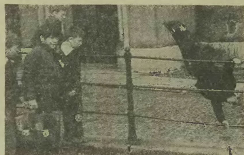
Tego rodzaju popisy byłyby zapewne bezpieczniejsze na szkolnej sali gimna- stycznej.