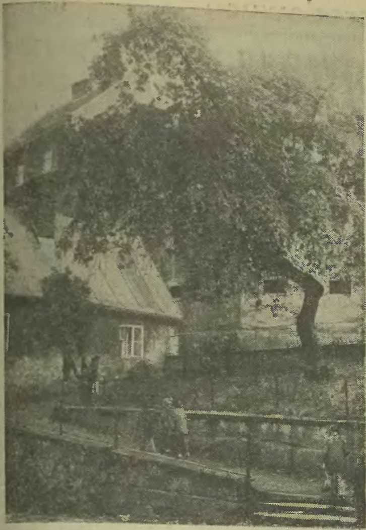
Bielsko — fragment starego miasta.

Za kilka dni obchodzić będziemy 56 rocznicę Wielkiej Socjalistycznej Rewolucji Październikowej. Łączy się ona bezpośrednio z obchodami 30-lecia Ludowego Wojska Polskiego oraz z przygotowaniem do obchodów 30-lecia Polskiej Rzeczypospolitej Ludowej. Rewolucja Paź-