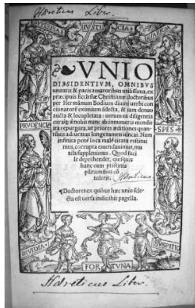
II. 2. Marcin Bucer, Unio dissentientium, omnibus unitatis, Köln 1531. Strona tytułowa z wpisem rękopiśmiennym „Haereticus Liber”.

Paleotypy przechowywane w LNB doskonale odzwierciedlają sytuację z pierwszej połowy XVI w. – początek reformacji oraz rozpowszechnianie się wraz z nią nowych idei. W bibliotece znajduje się 49 dzieł twórcy protestantyzmu Marcina Lutra (1483–1546), większość z nich to kazania wydane w pierwszej połowie XVI w. Po śmierci Lutra jego działalność kontynuował Philipp Melanchthon (1479–1560). W LNB znajduje się 15 jego dzieł z tegoż okresu, a także sporo książek, do których wydania ten protestancki teolog przyczynił się jako autor wyboru, przedmowy itp. Świadectwem ówczesnych napięć religijnych są rękopiśmienne wpisy, np. w książce niemieckiego humanisty, reformatora, byłego dominikanina Marcina Bucera (1491–1551) Unio dissentientium, omnibus unitatis (Köln 1531; R.XVI:B.300(2)) rękopiśmienny wpis: „Haereticus Liber“ dowodzi, że dzieło należało wówczas do książek zakazanych, czyli prohibitów.