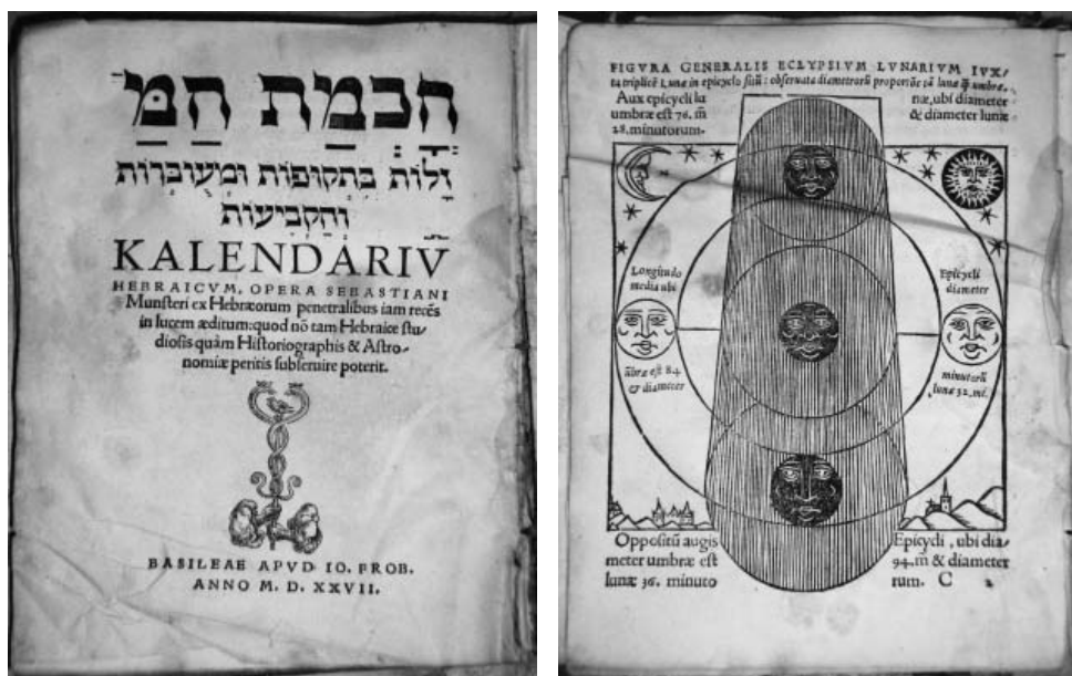
II. 3. Sebastian Münster, Kalendarium hebraicum, Basel 1527. Strona tytułowa i ilustracja.